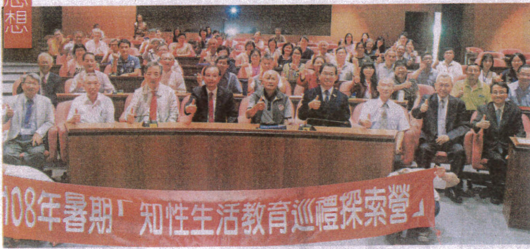
← 孔子學會在嘉藥舉辦知性生活教育巡禮探索營活動，與會人員在開幕式中合影留念。