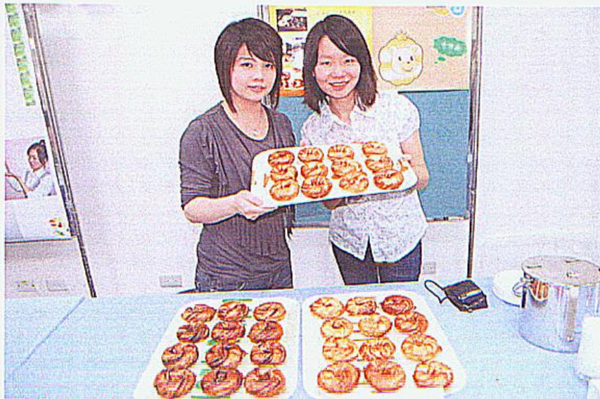
▲「吉慈同團」將坊間的炸甜甜圈改良為烤甜甜圈。