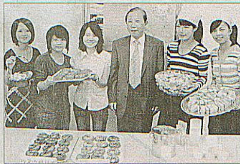
▲大學生創業偏愛賣什麼？答案是食物！嘉南藥理科技大學以藥學起家，學生創業賣的食物也特別養生，不只追求美味，更要健康。

昨天下午，三支團隊舉行發表會，校長許立人到場替同學打氣。其中，開辦已半年的「Miss M沙拉輕食小舖」商品，標榜低油、低熱量及低卡路里，其所販售的沙拉與全麥三明治製作，醬汁全由客人自行調配，口感佳食材新鮮，客戶回流率極高。另一家「杏意商團」，主要替喜愛甜甜圈又怕油炸的饕客量身設計，將一般炸甜甜圈改良用烤的，且不需裹上一層厚糖粉，既可減少熱量，又能避免油膩感，兼具美味又健康。