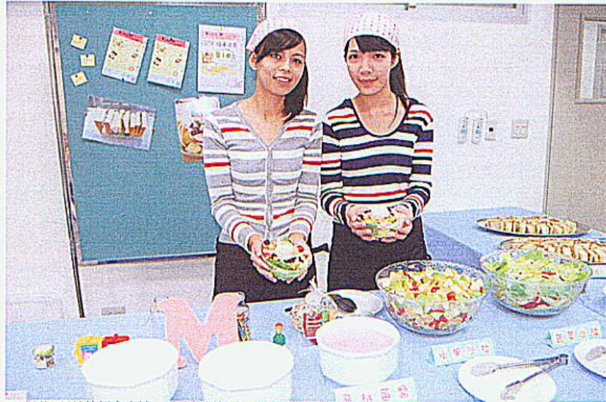
▲「Miss M沙拉輕食小舖」商品強調低油、低熱量及低卡路里。