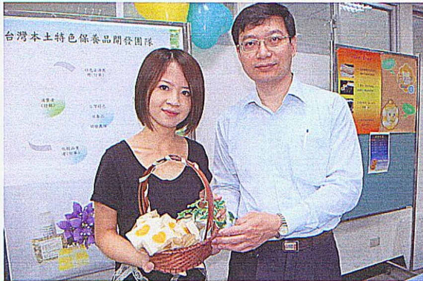
▲「台灣本土特色保養品開發團隊」是利用本土性原料開發初具台灣特色之化妝保養品。