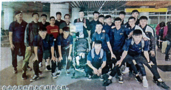
台南應用科技大學球員合照。

7月25日(星期四)：03.男隊：7:00PM: Delta Dynamic 对 Abadi Trading; 04.男隊：8:15PM: 嘉南藥理大學(台灣)对 Sanaja Sdn.Bhd。