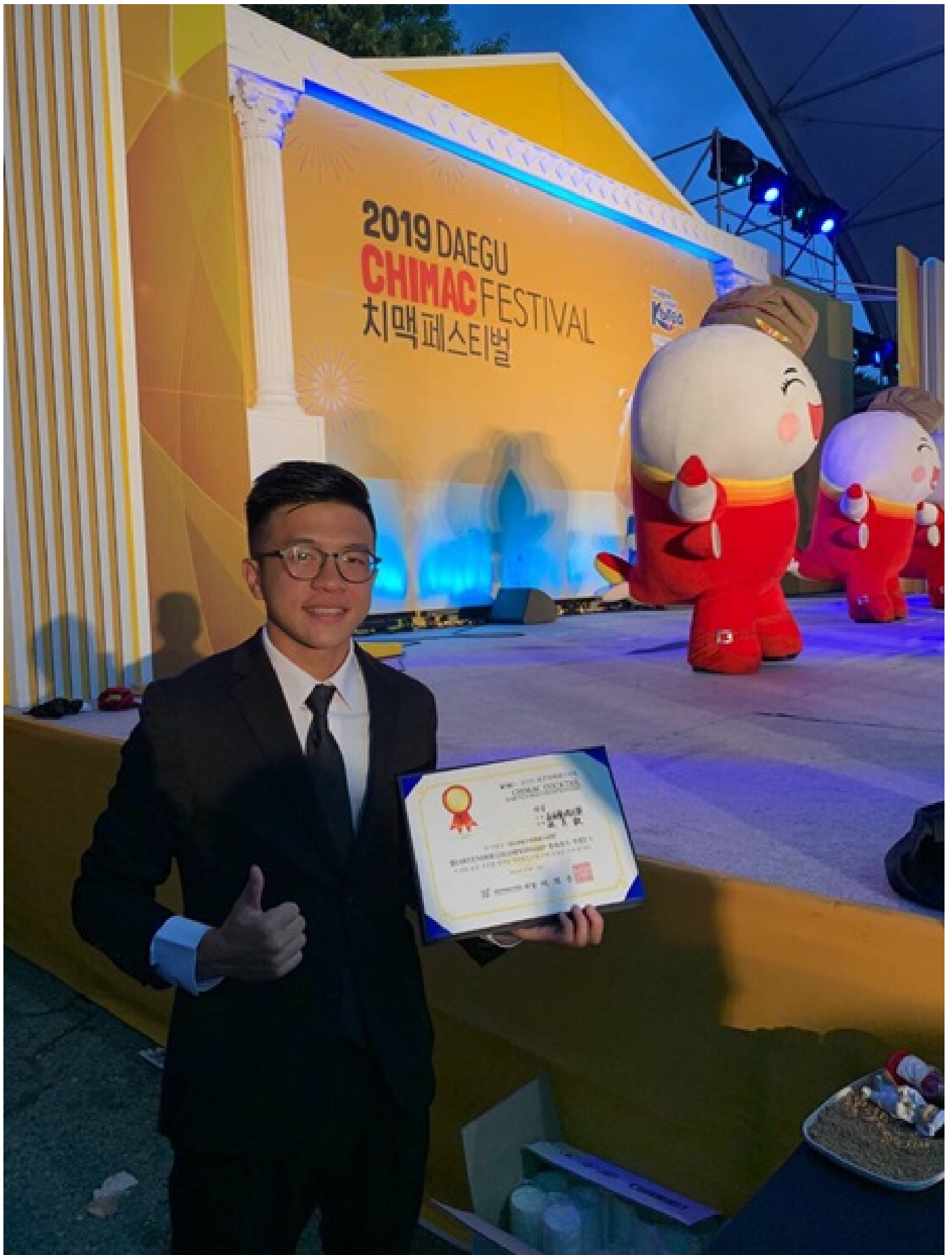
【大成報記者杜忠聰/臺南報導】韓國著名的大邱炸雞啤酒節日前風光落幕，主辦單位今年特別舉行傳統與花式調酒大賽，其中來自台南的嘉南藥理大學餐旅管