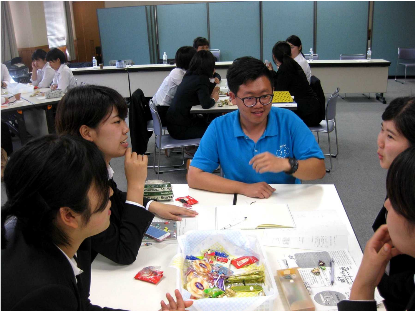
圖說：嘉藥老服系學生與日本大學生進行分組討論。

校方表示，今年暑期該系遴選的海外實習生共有七位，主要地點在日本長野縣與愛媛縣，實習單位包含日間照顧中心、養護中心、失智症團體家屋、老人保健設施及介護療養型醫療設施等；在實習同時，也利用假日到松本大學研修上課，讓學生不僅實際體驗他國較先進的老人照護現況，也更深入認識「超高齡社會」日本不同體系多元的長照方式，增廣國際見聞。