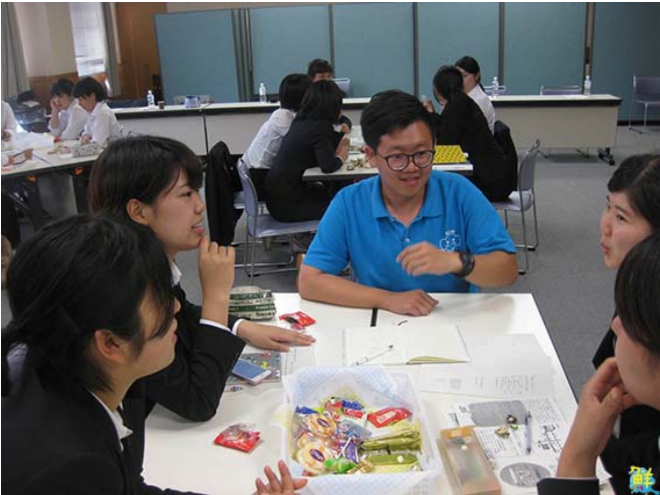
▲嘉藥老服系學生與日本大學生進行分組討論。