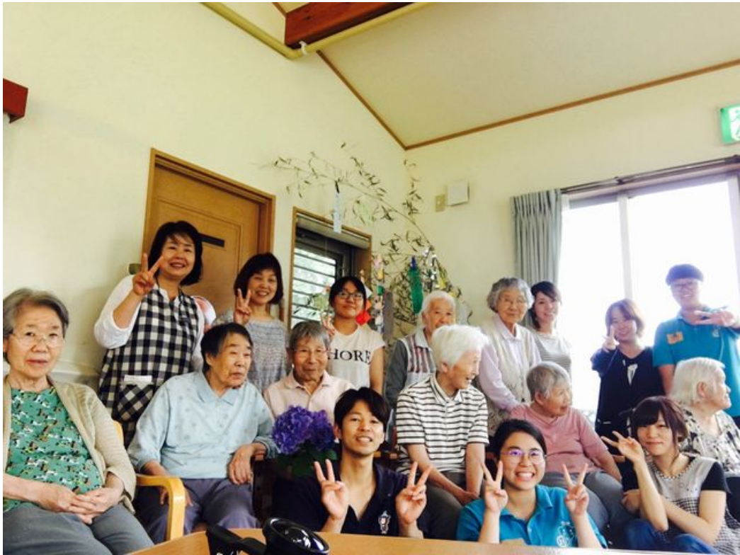
嘉藥老服系學生和日本實習機構長者及工作人員開心合影。

http://www.cntimes.info 2019-07-23 11:36:19