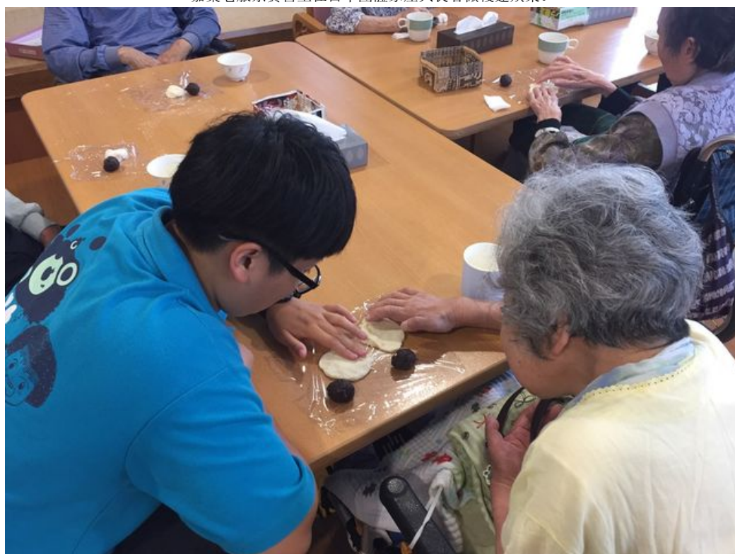
嘉藥老服系學生藉由製作甜點協助日本長者手部運動。