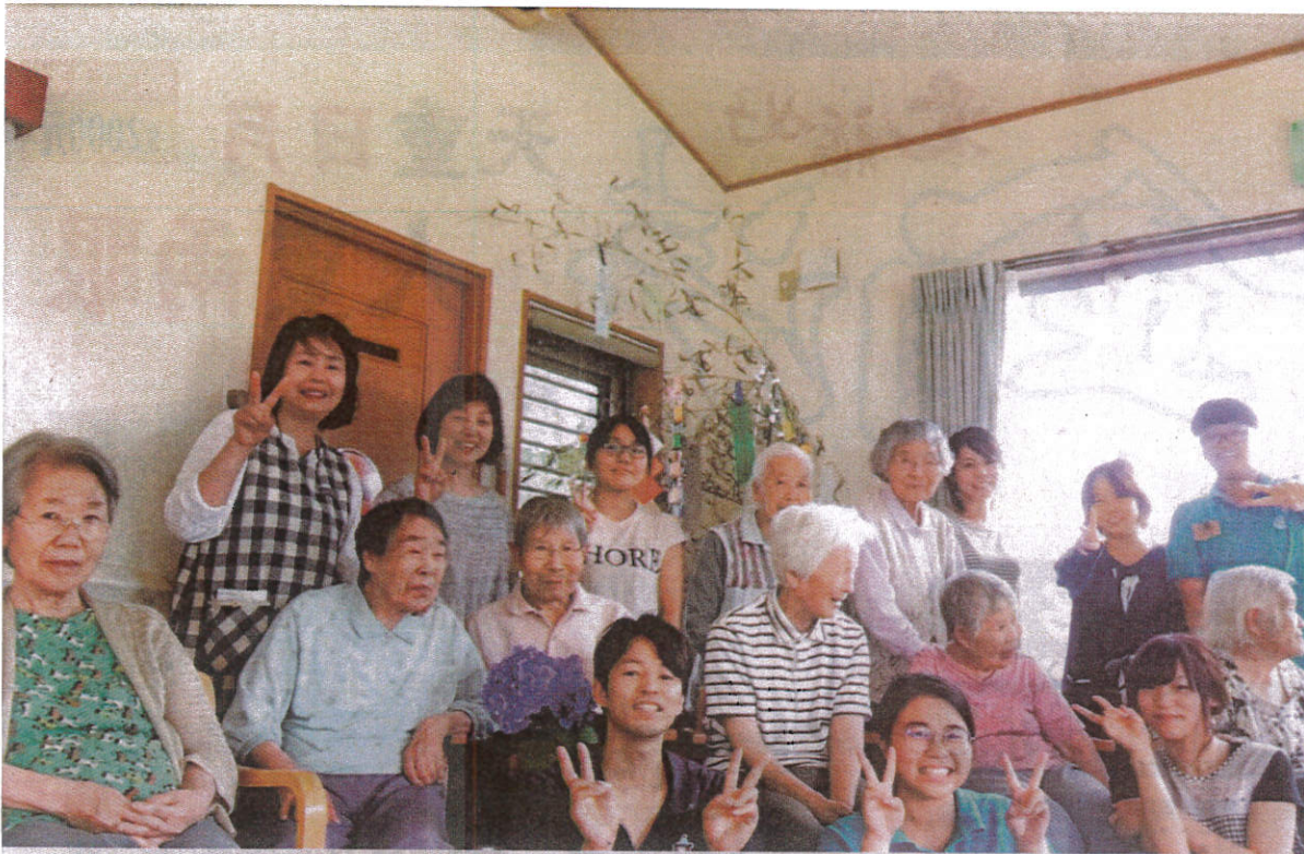
老服系的實習生們除了輔助長者生活，還會教授長輩台灣童謠。