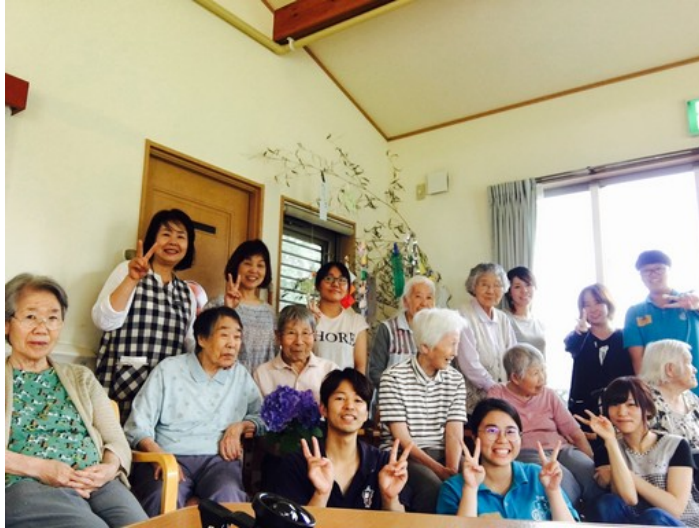
嘉藥老服系學生和日本實習機構長者及工作人員開心合影