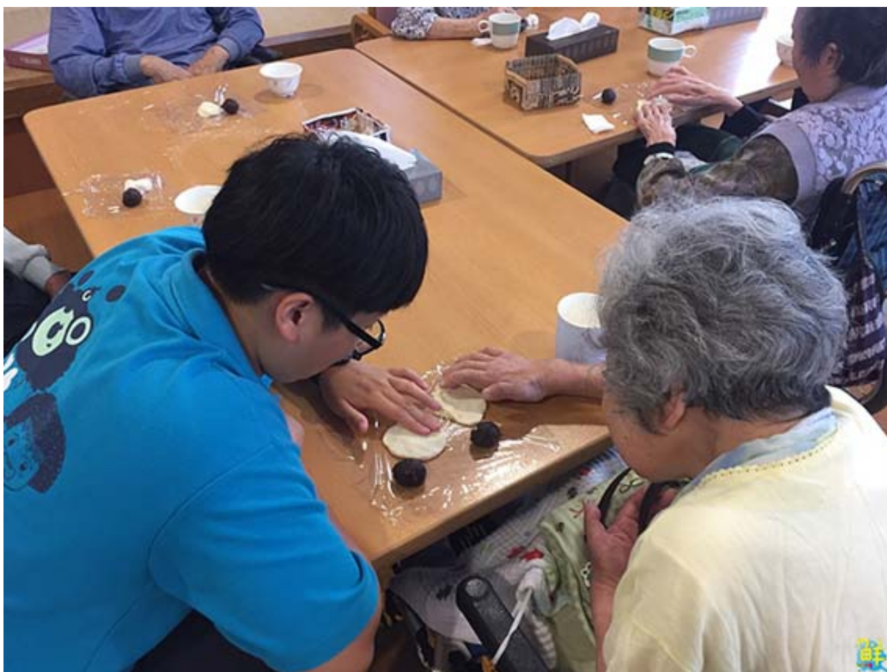
▲嘉藥老服系學生藉由製作甜點協助日本長者手部運動。