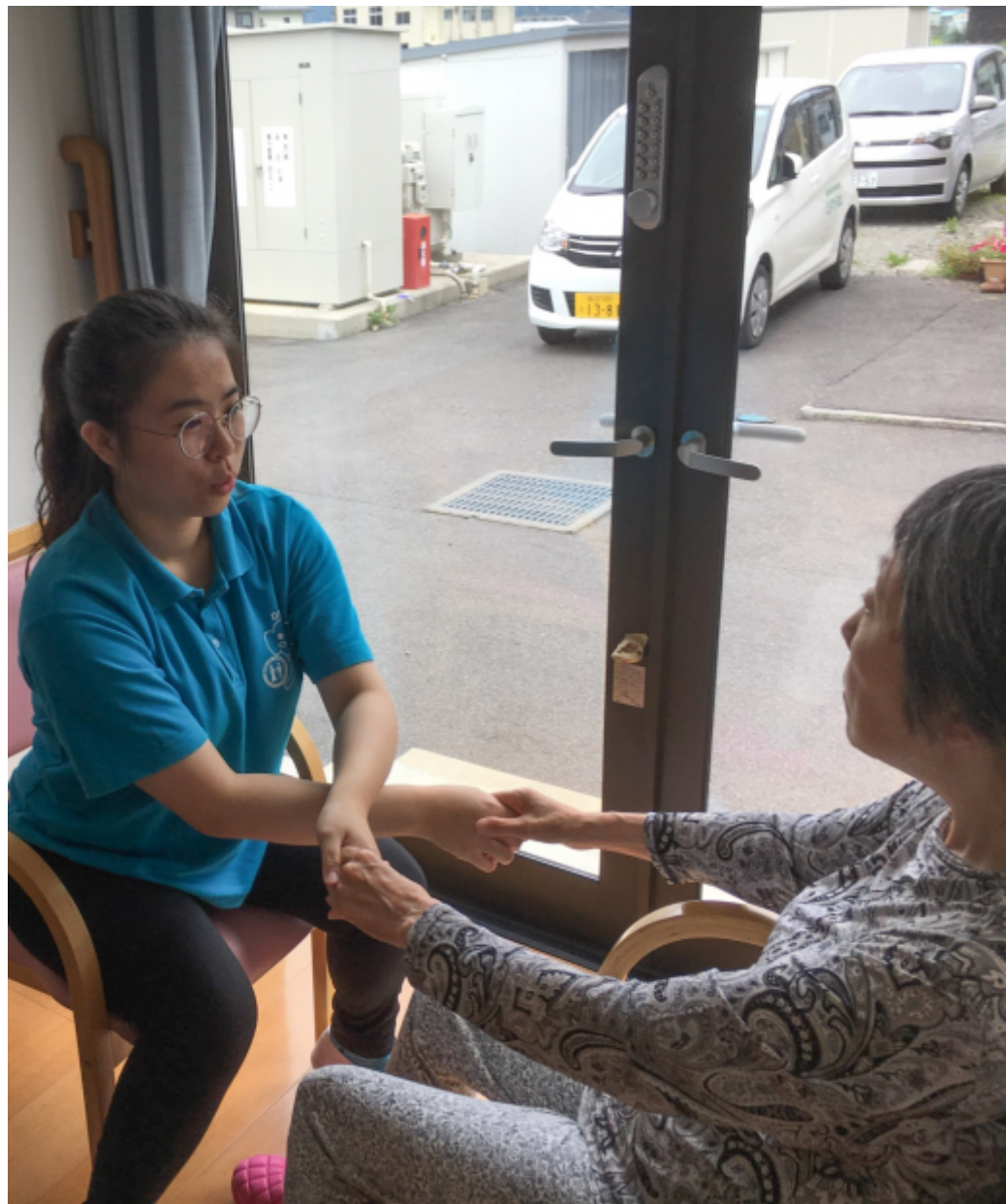
嘉藥老服系實習生在日本團體家屋與長者做復建娛樂。