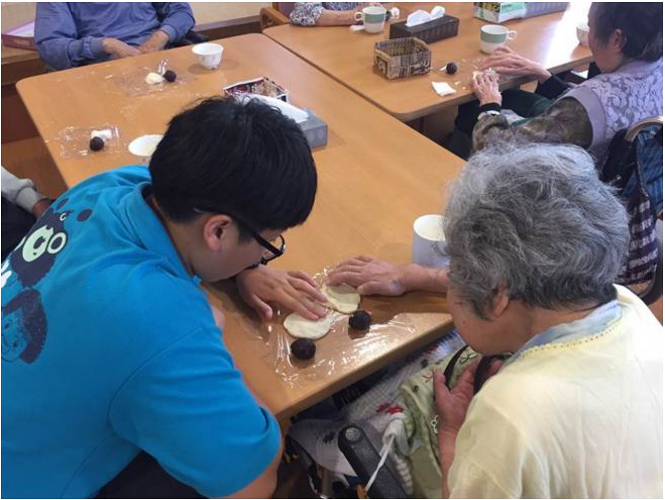
嘉藥老服系赴日實習。

嘉藥校長陳鴻助表示，學校重視海外實習，老服系和日方合作多年豎立好口碑，未來學生更將有機會前往北京、上海的老人機構實習或就業。除此之外，今年暑假幼保、食品、外語、餐旅、觀光等系也安排至新加坡、泰國、日本等海外實習，配合教育部相關計畫補助下，另有美、澳姊妹校進行研習參訪等活動，藉此讓學生實務增能，學以致用，也強化專業及外語能力，拓展全球視野，累積更豐厚的國際移動力和競爭力。