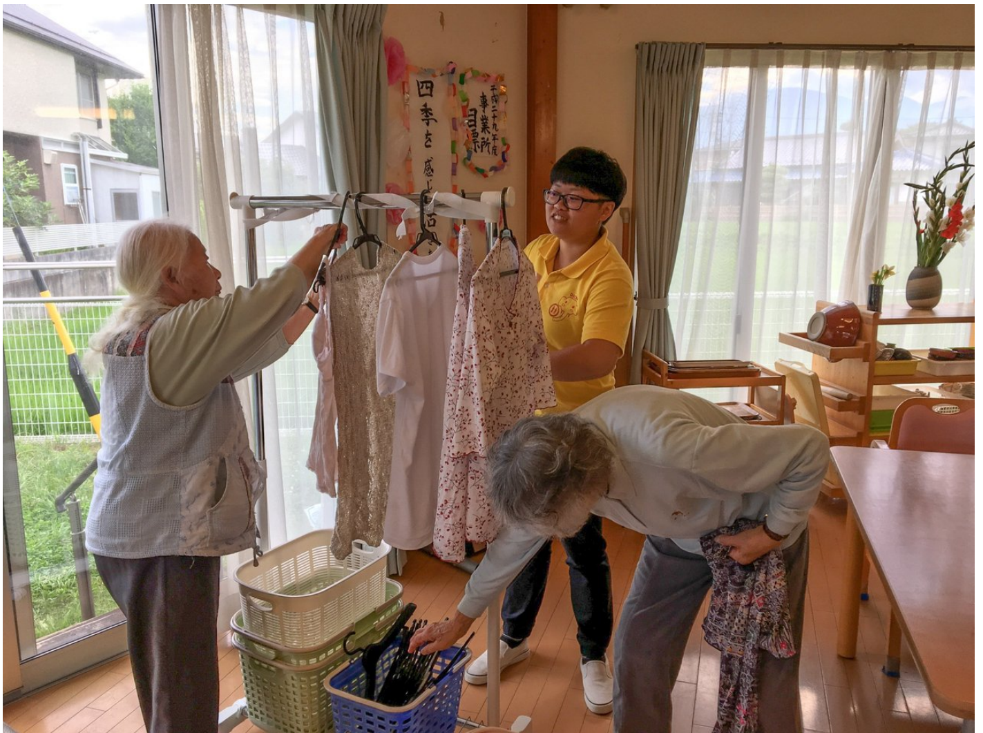
學生打破語言隔閡，親切照護長者，獲得機構讚賞。