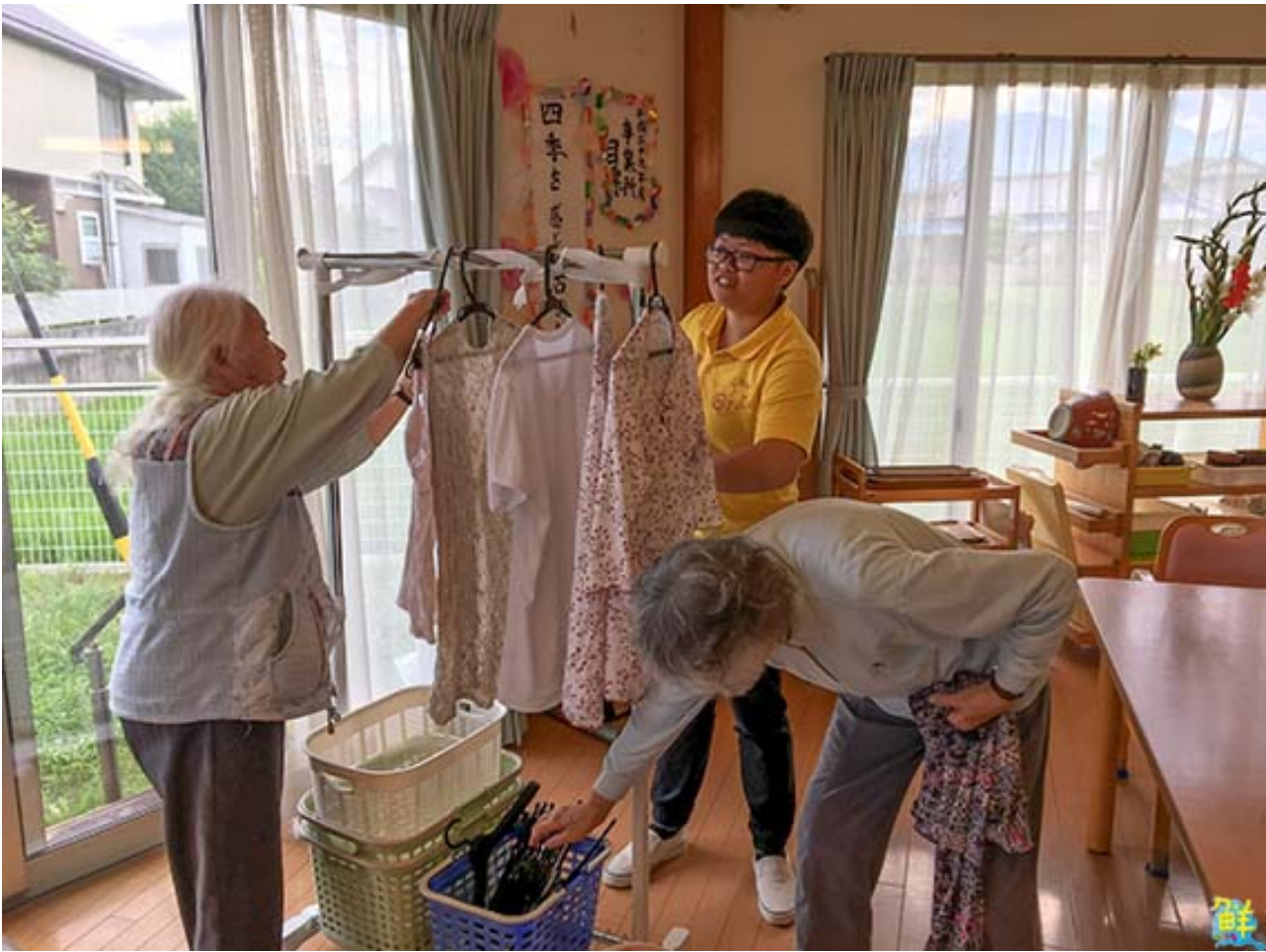
▲嘉藥老服系實習生協助日本長者生活自理。

嘉藥校長陳鴻助表示，學校重視海外實習，老服系和日方合作多年，早已豎立好口碑，去年更與大陸知名企業泰禾集團簽訂產學交流，未來學生將有機會赴北京、上海老人機構實習或就業。今年暑假尚有幼保、食品、外語、餐旅、觀光、環管及醫化等系也安排前往新加坡、泰國、日本、大陸等地實習，加上教育部相關計畫補助下，另有至美澳姊妹校進行研習參訪等活動，藉此讓學生實務增能，學以致用，也強化專業及外語能力，拓展全球視野，累積更豐厚的國際移動力和競爭力。