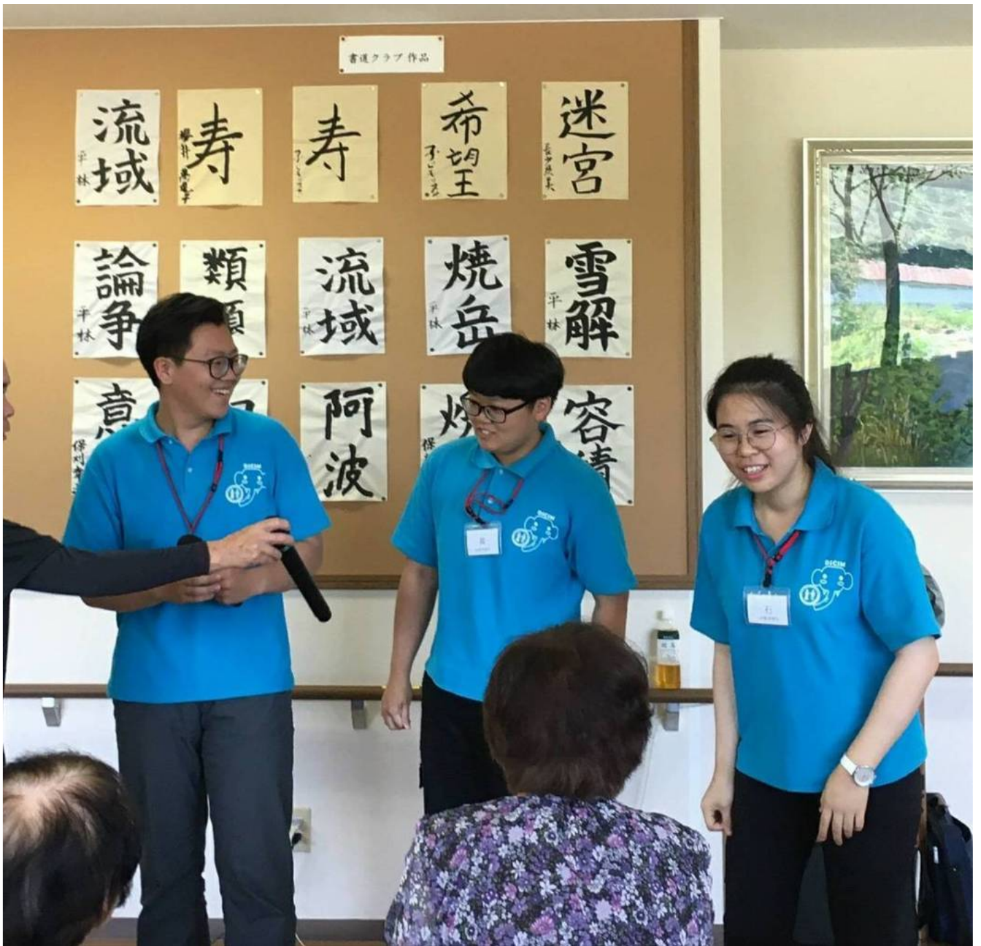
嘉藥老服系實習生為日本長者即興表演。