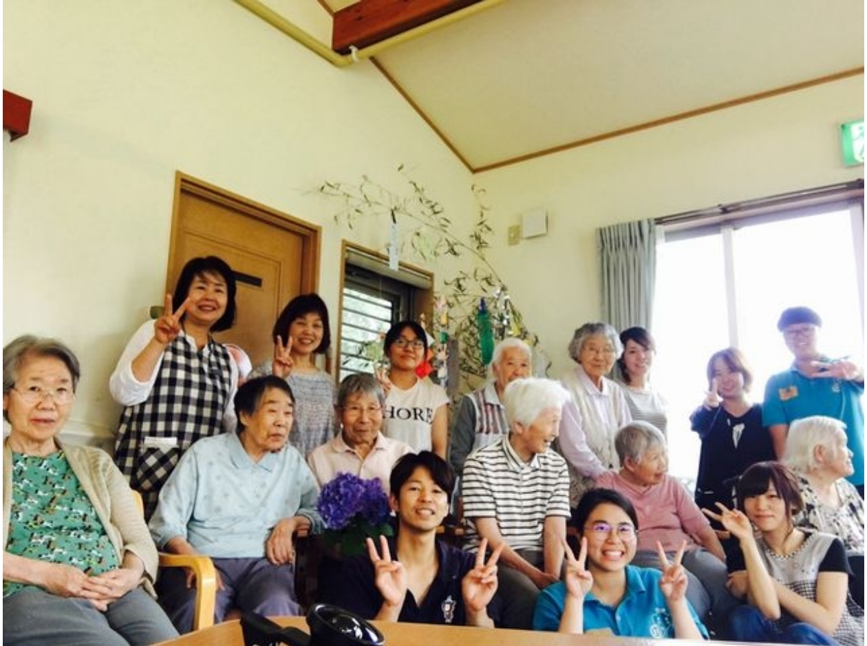
嘉藥老服系學生和日本實習機構長者及工作人員開心合影。

【101新聞網記者王宇榛 / 台南報導】實習幾乎是所有大專生畢業前必要的學習歷程，若能到海外實習，吸取跨國職場經驗，甚至獲得當地留用就業，機會可謂難逢，也顯示其專業知識能備受信賴與肯定。台南的嘉南藥理大學老人服務事業管理系，日前選送學生赴日實習2個月，然在短短未滿三周的實習期間因表現優異，日本實習機構即已表明希望延攬錄用，並祭出優渥薪資福利，令他們喜出望外。