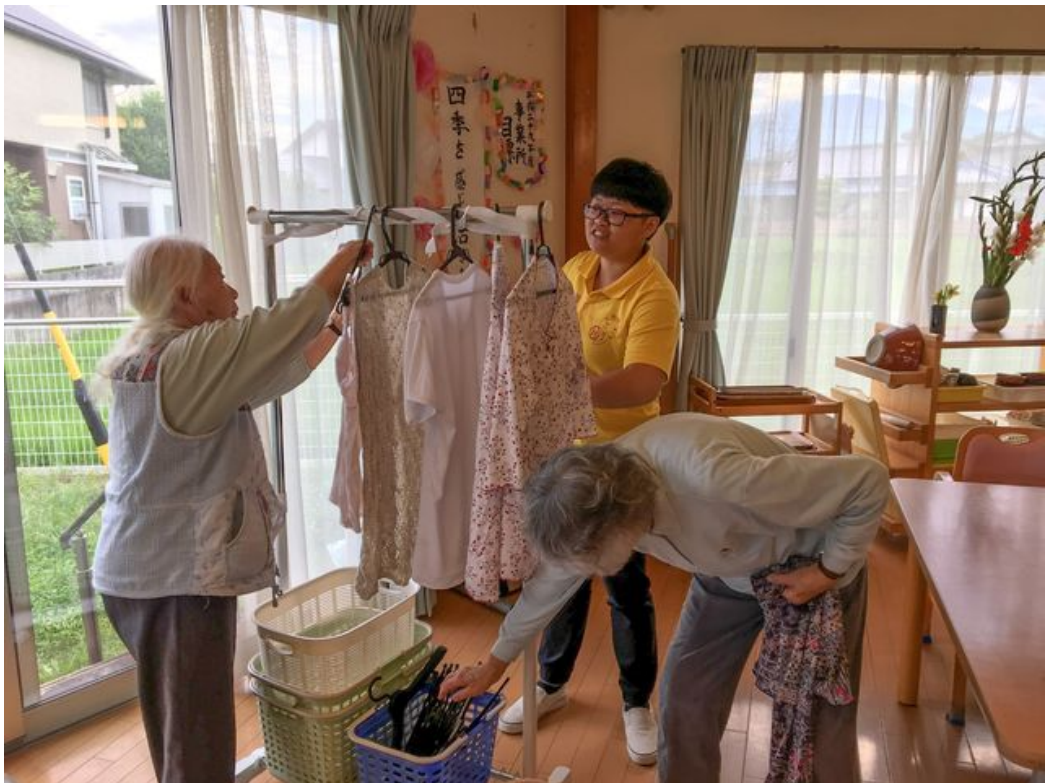
嘉藥老服系實習生協助日本長者生活自理。