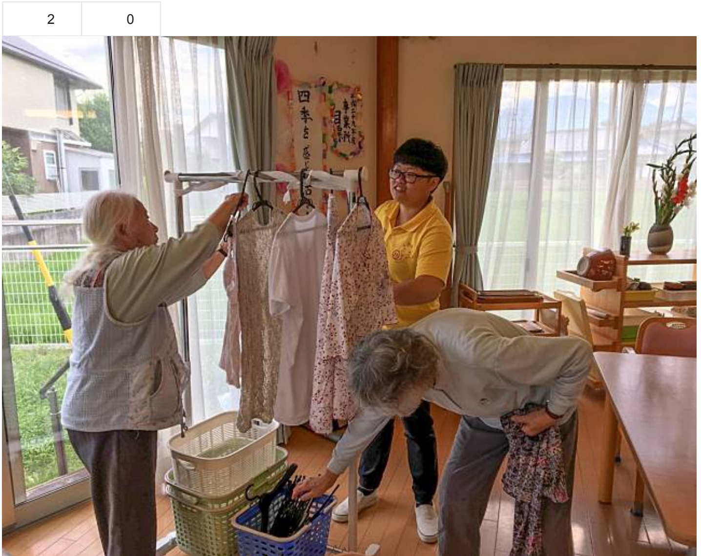
嘉藥老服系海外實習口碑佳 獲長照機構重金延攬

高齡化社會長照議題正夯！嘉南藥理大學老人服務事業管理系，日前選送學生赴日實習2個月，因表現優異，日本實習機構已表明希望延攬錄用，並祭出優渥薪資福利，令學生喜出望外。