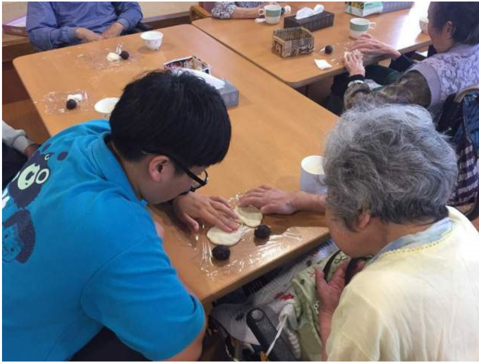
（圖說）嘉藥老服系學生藉由製作甜點協助日本長者手部運動。

校方表示，老服系自2013年起連續7年，與日本的老人長照機構、大學合作，每年暑假選派大三升大四學生，前往日本進行為期2個月的實務實習和研修，迄今已有39位學生受惠；而且學校協助申請教育部「學海築夢」獎助，學生赴日實習不必負擔機票，每月還有近5萬元生活補助，實習條件相當優越完善。