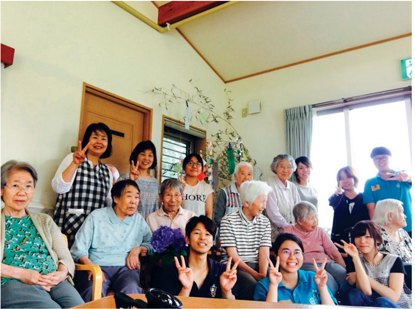
老服系學生和日本實習機構長者及工作人員開心合影。