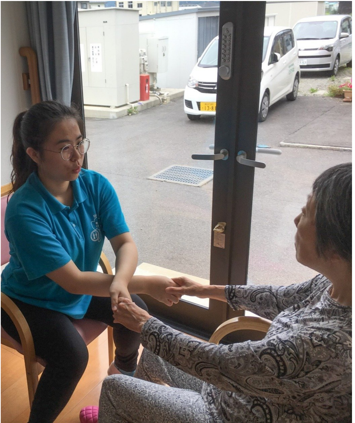
嘉藥老服系實習生在日本團體家屋與長者做復建娛樂。