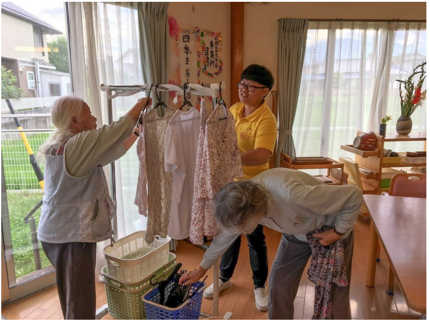
嘉藥老服系實習生協助日本長者生活自理。