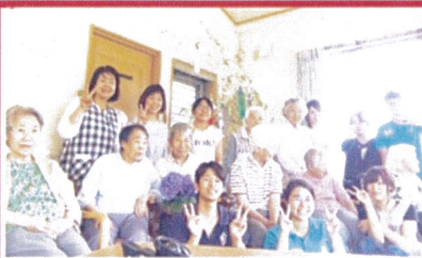
嘉南藥服系學生和日本實習機構長者及工作人員開心齊聚。