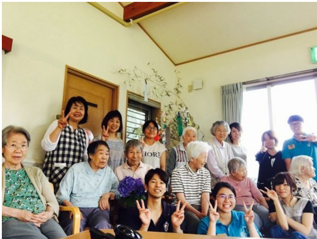
嘉藥老服系學生和日本實習機構長者及工作人員開心合影。