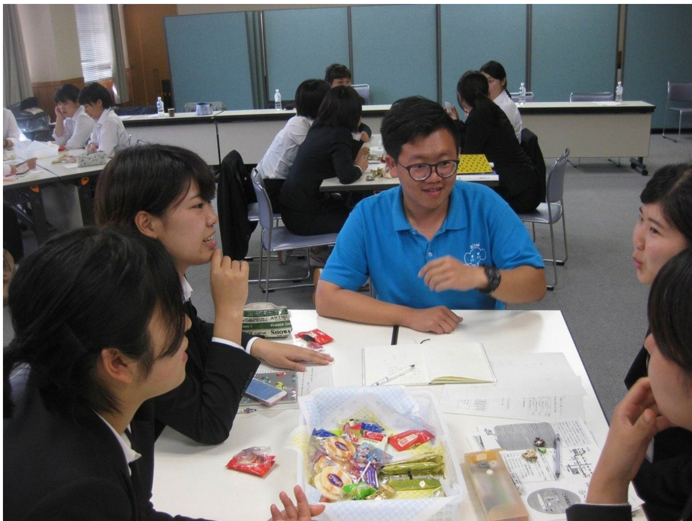
嘉藥老服系學生與日本大學生進行分組討論。