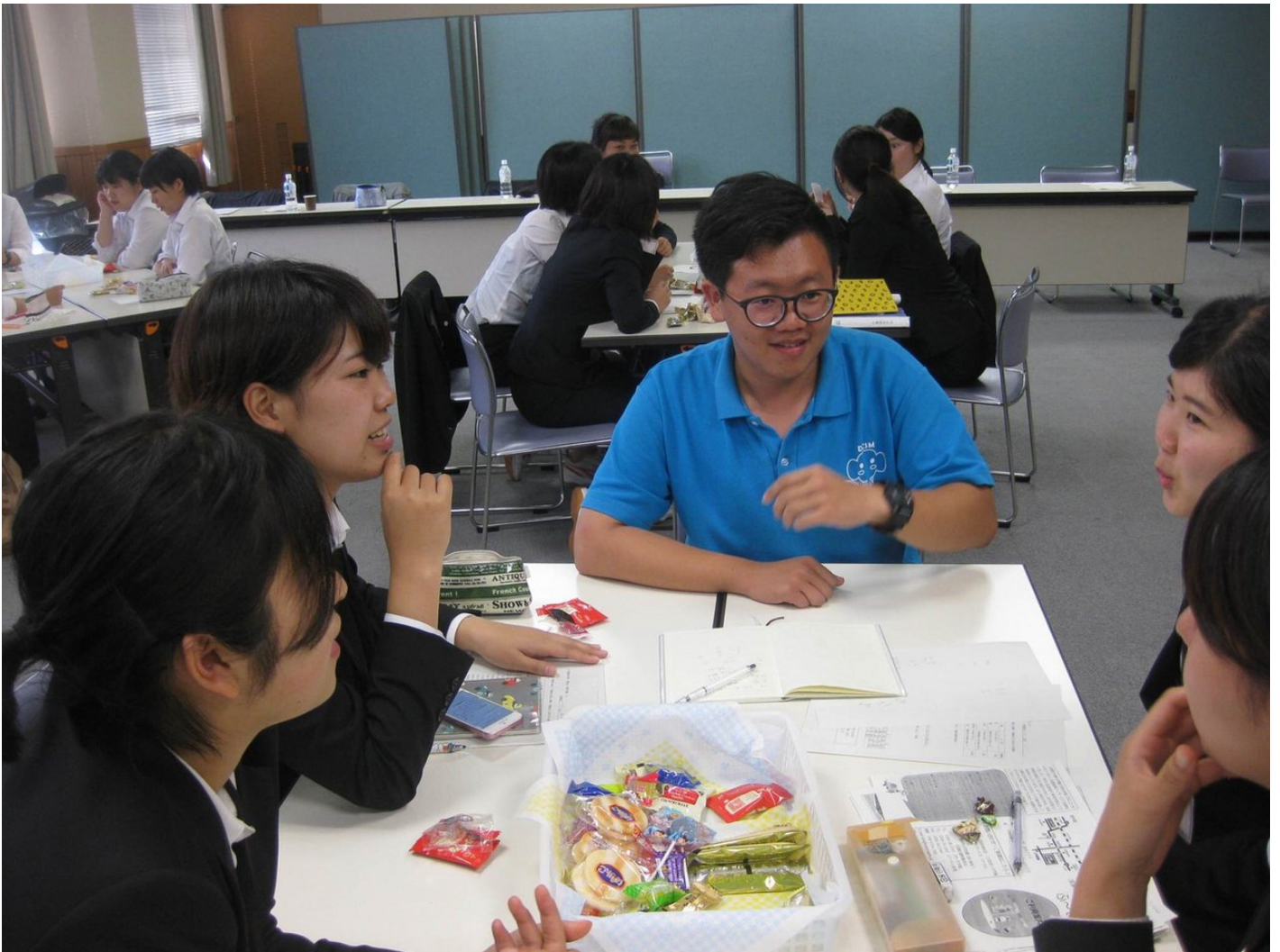
學生們表現優良，實習尚未屆滿就獲得單位延攬錄用。

老服系2013年起每年暑假選派大三升大四學生赴日研修，實習單位包含日間照顧中心、養護中心、失智症團體家屋、老人保健及介護療養型醫療等機構，迄今已有39位學生受惠。