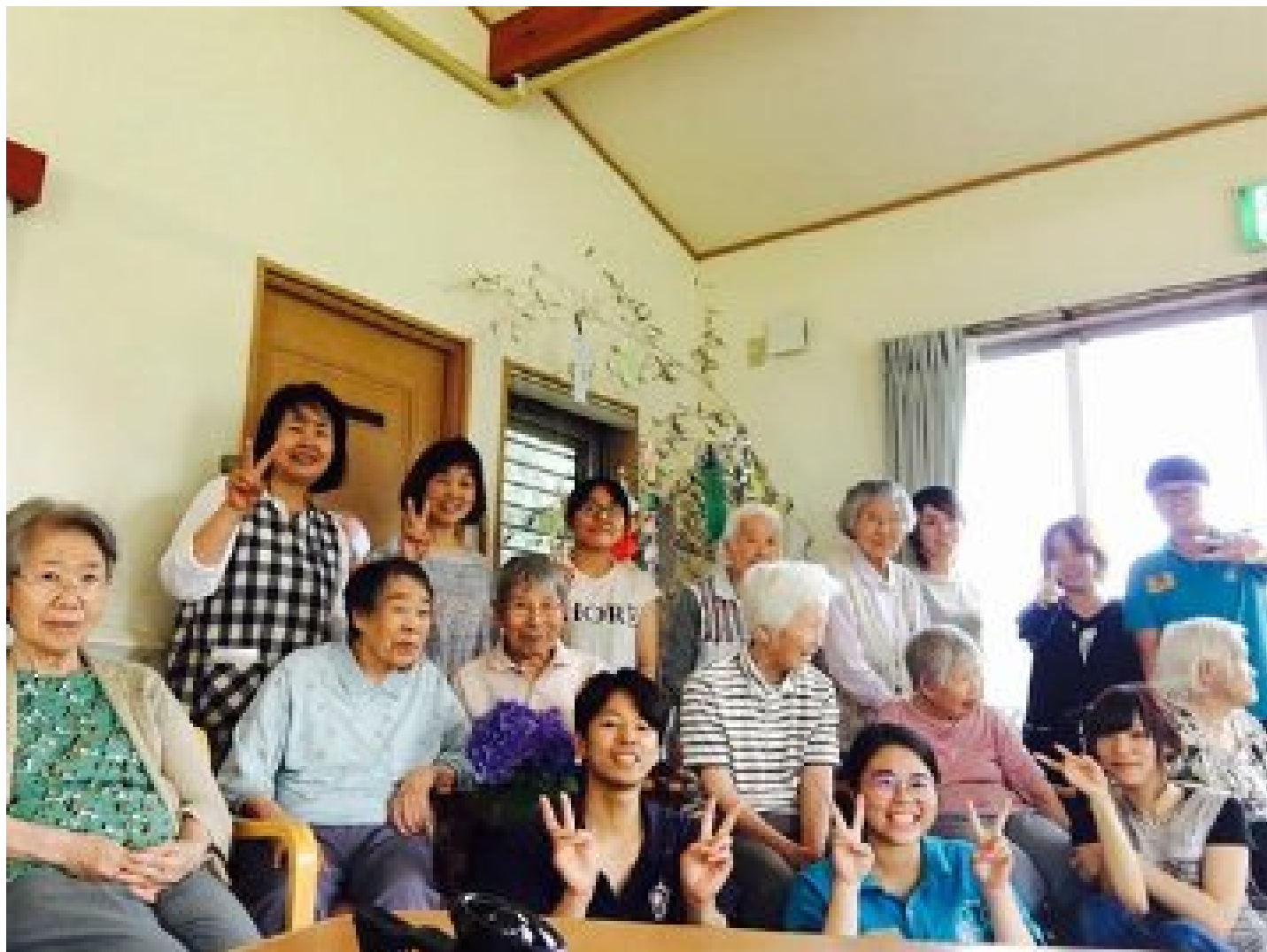
嘉藥老服系實習口碑佳 日本長照機構重金延攬就業

(中央社訊息服務20190723 09:21:34)實習幾乎是所有大專生畢業前必要的學習歷程，若能到海外實習，吸取跨國職場經驗，甚至獲得當地留用就業，機會可謂難逢，也顯示其專業知能備受信賴與肯定。台南的嘉南藥理大學老人服務事業管理系，日前選送學生赴日實習2個月，然在短短未滿三周的實習期間因表現優異，日本實習機構即已表明希望延攬錄用，並祭出優渥薪資福利，令他們喜出望外。