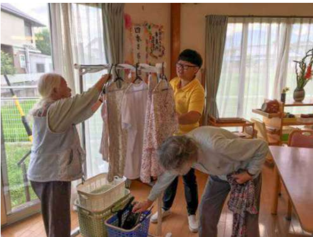
圖5：嘉藥老服系學生與日本大學生進行分組討論。