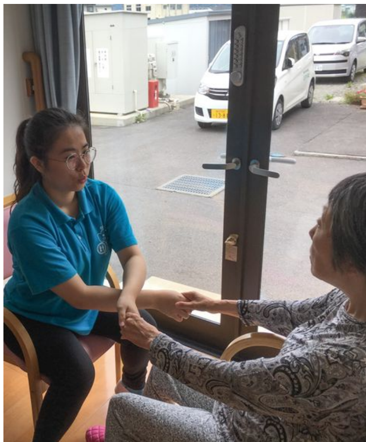
嘉藥老服系實習生在日本團體家屋與長者做復建娛樂。