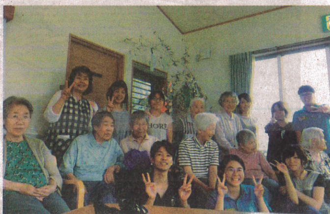
●老服系學生和日本實習機構長者及工作人員開心合影。

校長陳鴻助表示，老服系和日方合作多年，早已豎立好口碑，去年更與大陸知名企業泰禾集團簽訂產學交流，未來學生將有機會赴北京、上海老人機構實習或就業；除此之外，今年暑假尚有幼保、食品、外語、餐旅、觀光、環管及醫化等系也安排前往新加坡、泰國、日本、大陸等地實習，加上教育部相關計畫補助下，另有至美澳姊妹校進行研習參訪等活動，藉此讓學生實務增能，學以致用，也強化專業及外語能力，拓展全球視野，累積更豐厚的國際移動力和競爭力。