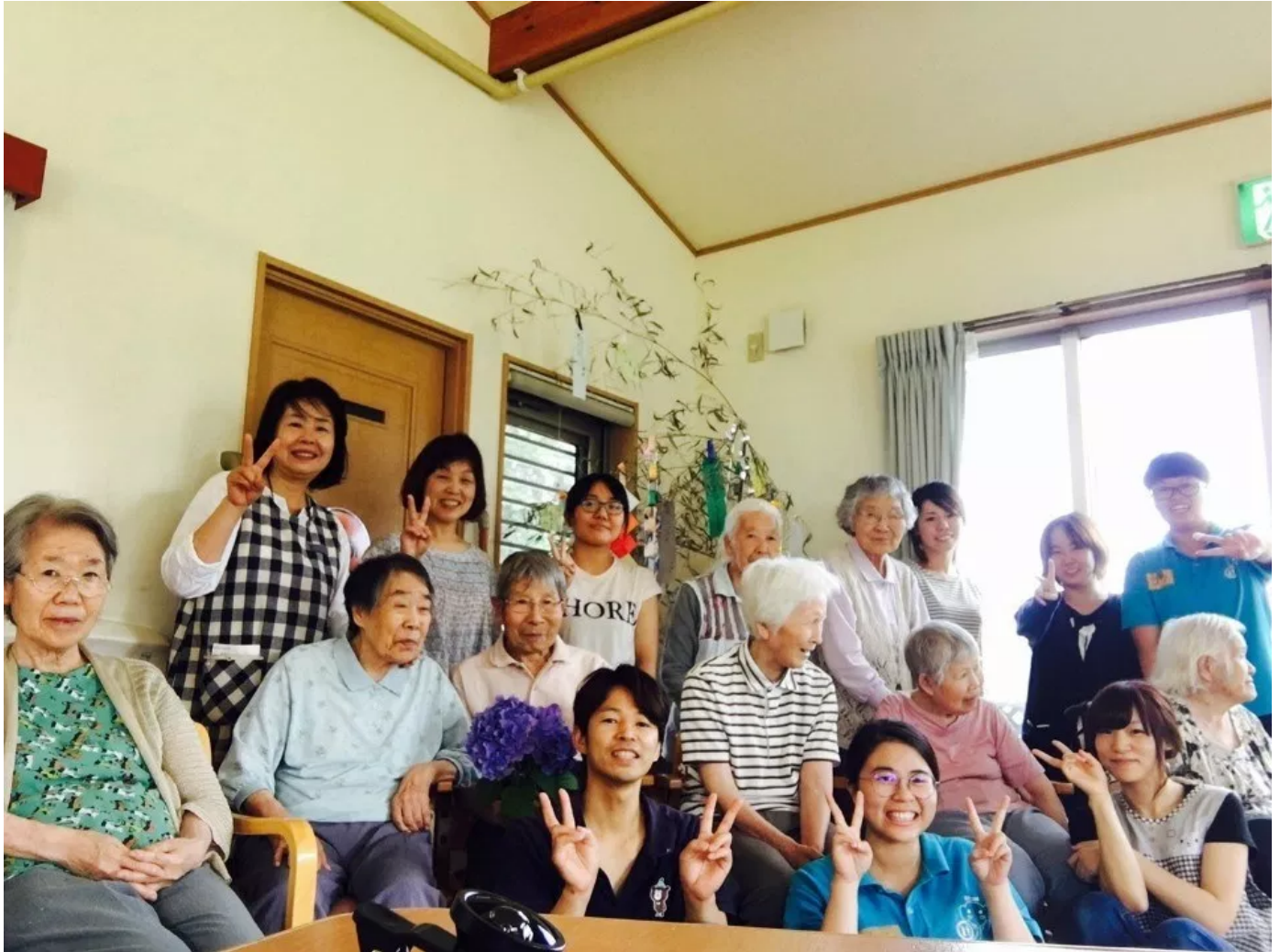
嘉藥老服系學生和日本實習機構長者及工作人員開心合影

【記者謝國樑/台南報導】台南的嘉南藥理大學老人服務事業管理系，日前選送學生赴日實習2個月，在短短未滿三周的實習期間因表現優異，日本實習機構即已表明希望延攬錄用，並祭出優渥薪資福利，令學生喜出望外。