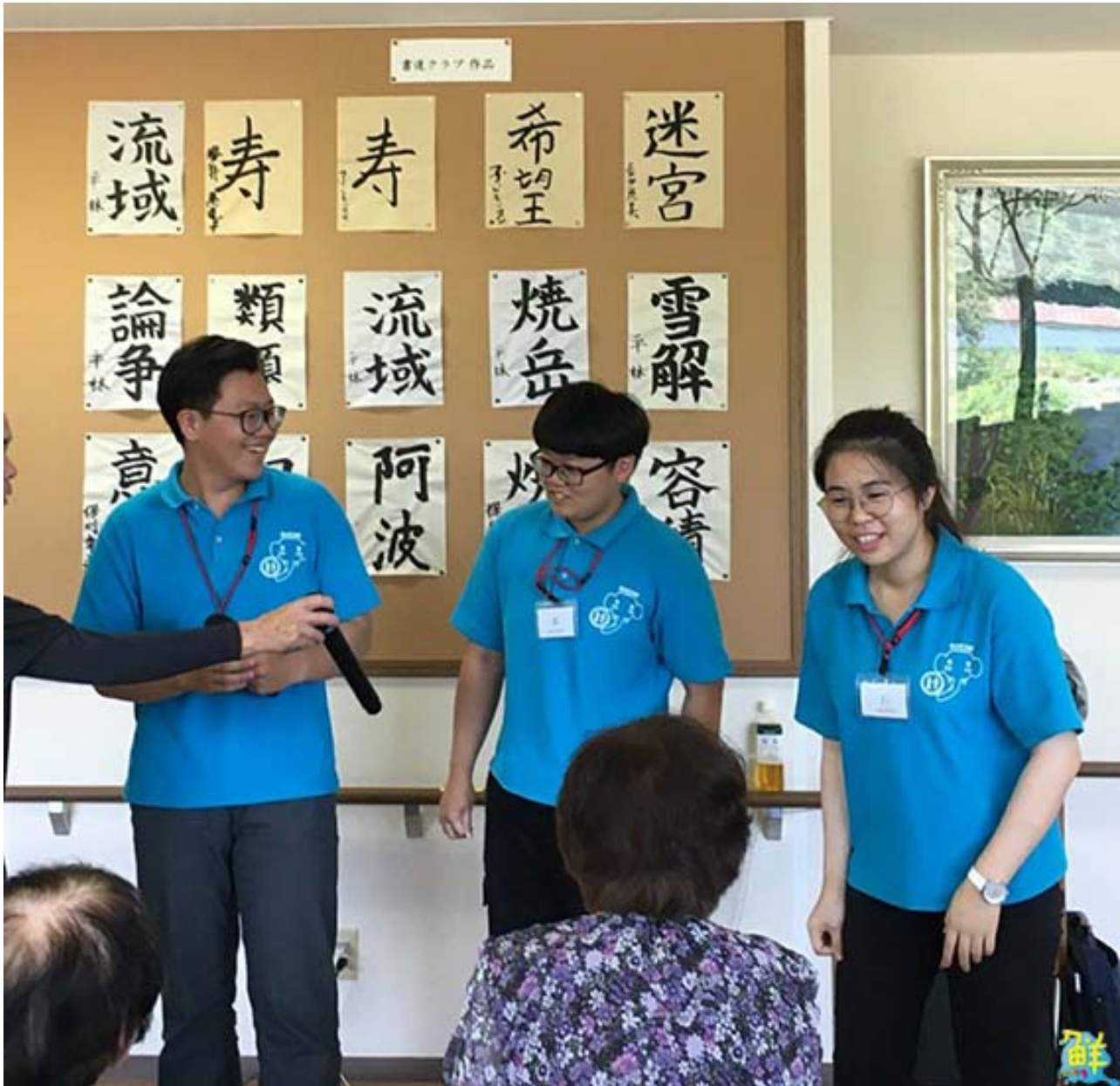
▲嘉藥老服系實習生為日本長者即興表演。

言障礙，真誠與長者溫馨互動，照顧無微不至，連日本員工也讚賞有加，多次表達廣納招募的意願。