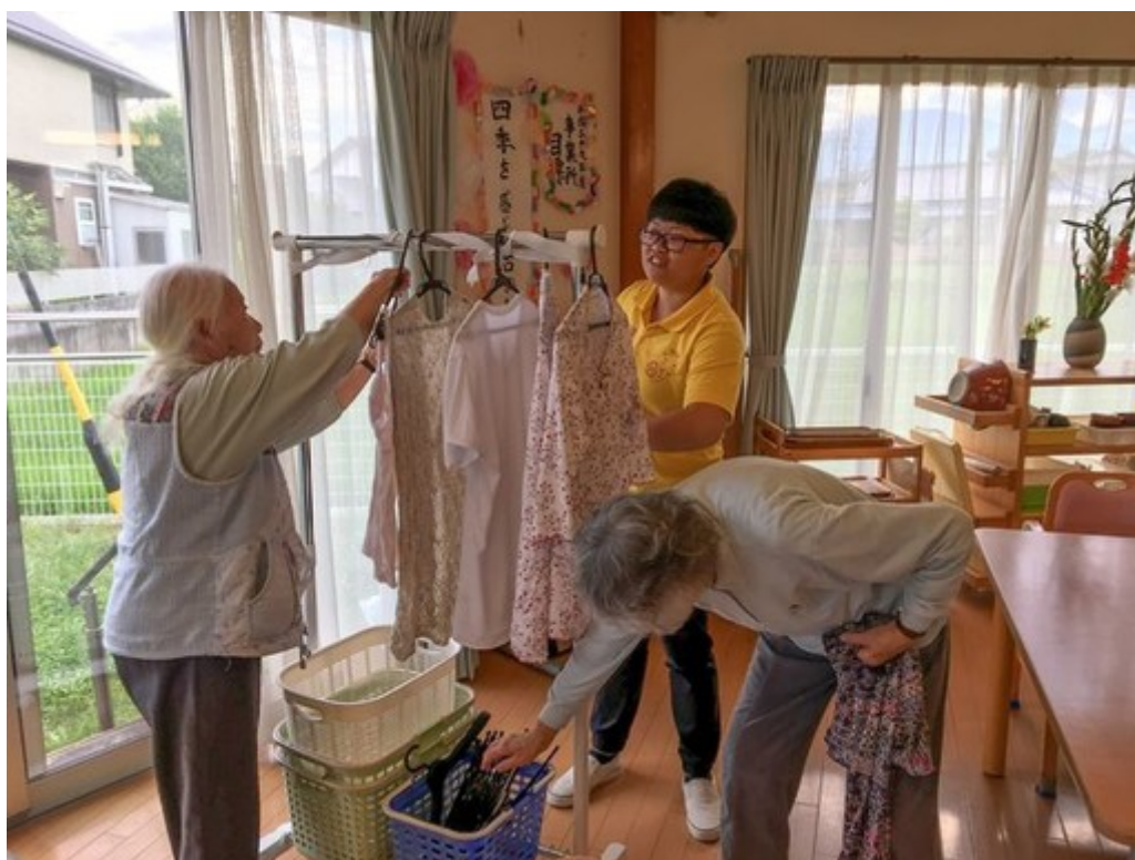
嘉藥老服系實習生協助日本長者生活自理。