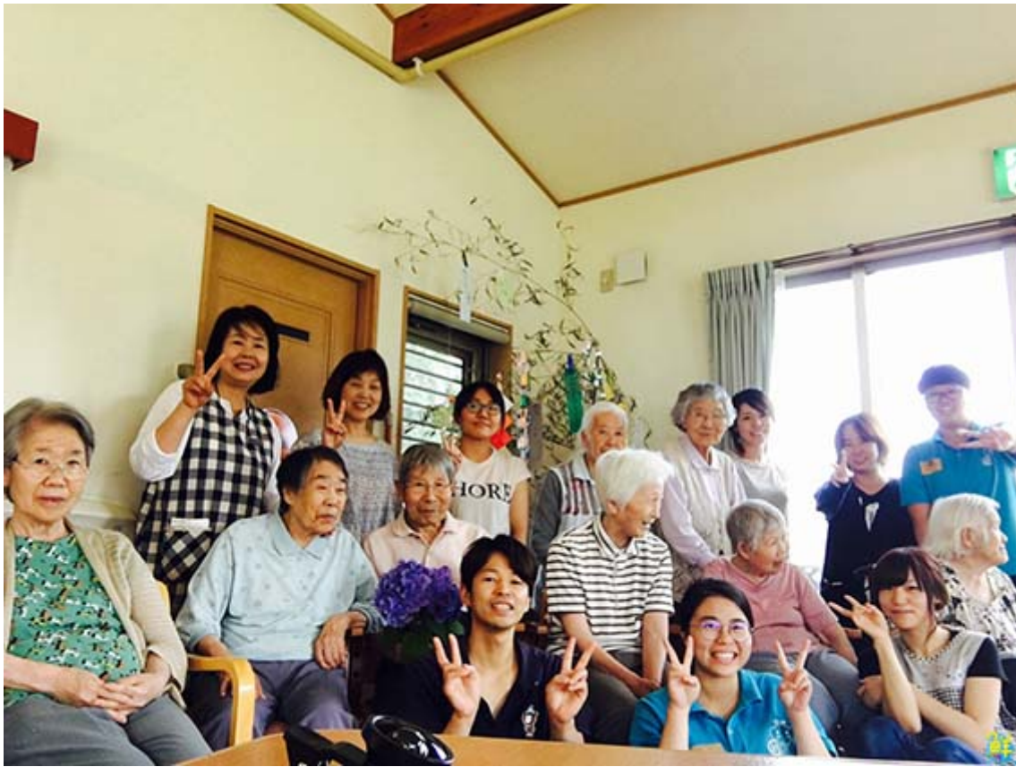
▲嘉藥老服系學生和日本實習機構長者及工作人員開心合影。