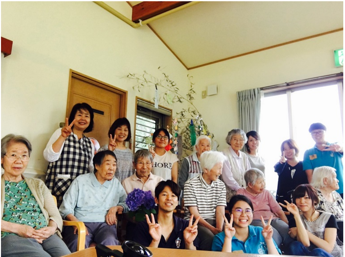
▲嘉藥老服系學生和日本實習機構長者及工作人員開心合影。