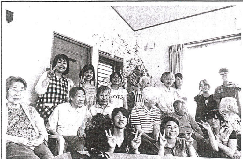
嘉藥老服系學生和日本實習機構長者及工作人員開心合影。

嘉藥校長陳鴻助表示，學校重視海外實 習，老服系和日方合作多年，早已豎立好口 碑，去年更與大陸知名企業泰禾集團簽訂產 學交流，未來學生將有機會赴北京、上海老 人機構實習或就業；除此之外，今年暑假尚 有幼保、食品、外語、餐旅、觀光、環管及 醫化等系也安排前往新加坡、泰國、日本、 大陸等地實習，加上教育部相關計畫補助 下，另有至美澳姊妹校進行研習參訪等活 動，藉此讓學生實務增能，學以致用，也強 化專業及外語能力，拓展全球視野，累積更 豐厚的國際移動力和競爭力。