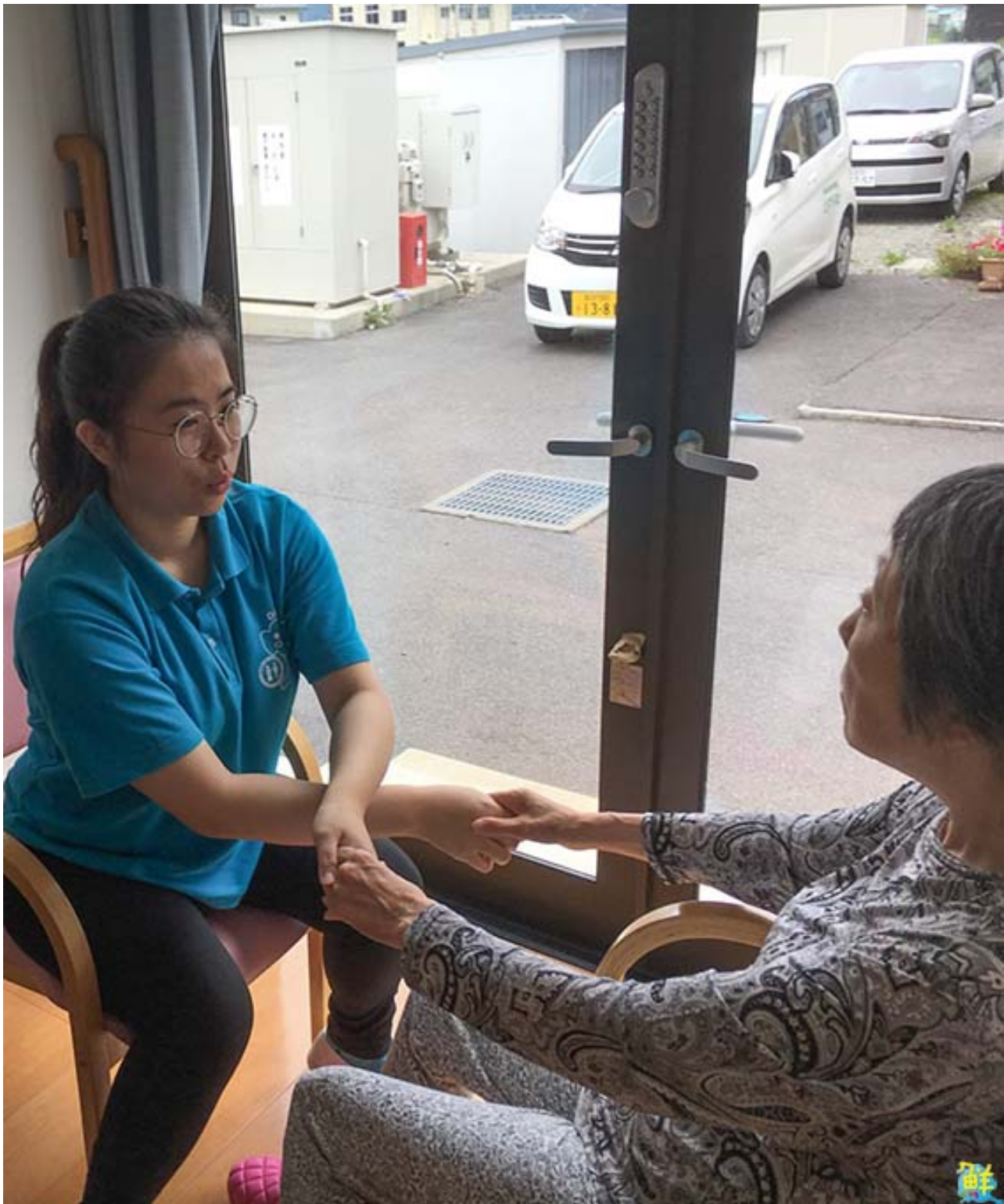
▲嘉藥老服系實習生在日本團體家屋與長者做復建娛樂。

校方表示，老服系連續7年與日本的老人長照機構、大學合作，每年暑假選派大三升大四學生，前往日本進行為期2個月的實務實習和研修。學校協助申請教育部「學海築夢」獎助，學生赴日實習不必負擔機票，每月還有近5萬元生活補助，實習條件相當優越完善。