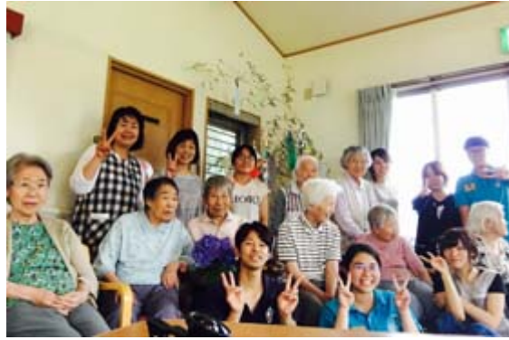
嘉藥老服系學生和日本實習機構長者及工作人員開心合影。

【記者孫宜秋／南市報導】實習幾乎是所有大專生畢業前必要的學習歷程，若能到海外實習，吸取跨國職場經驗，甚至獲得當地留用就業，機會可謂難逢，也顯示其專業知能備受信賴與肯定。台南的嘉南藥理大學老人服務事業管理系，日前選送學生赴日實習2個月，然在短短未滿三周的實習