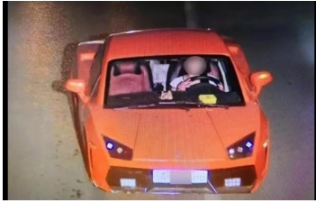
長腿辣妹買超跑「只要6萬8」！警攔下後一聽是「蘭基…