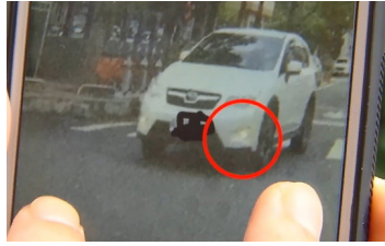
開日行燈被當「霧燈」檢舉罰1200 女駕駛氣炸：原廠就這…