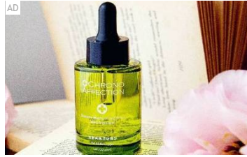
網美驚嘆！原來這種臉部保養方式才最有效