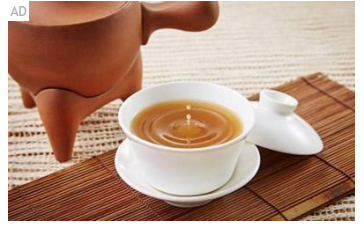
忽冷忽熱身體狀況多！提升免疫力就靠這碗