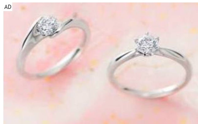
網友高呼想婚了！人氣日系簡約訂製對戒，七夕限定優惠10%