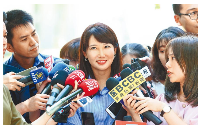
傳郭不脫黨參選總統9月17日攤牌