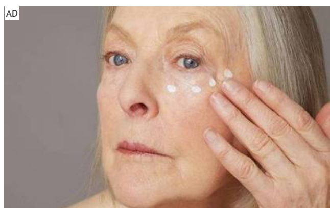
去斑只要一個月！原來只要這樣做，一個月臉上斑點全不見！