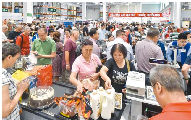
上海好市多擠爆 買不成先打架