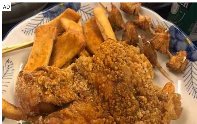
三酸甘油酯從261→56？暴飲暴食無運動居然也行！