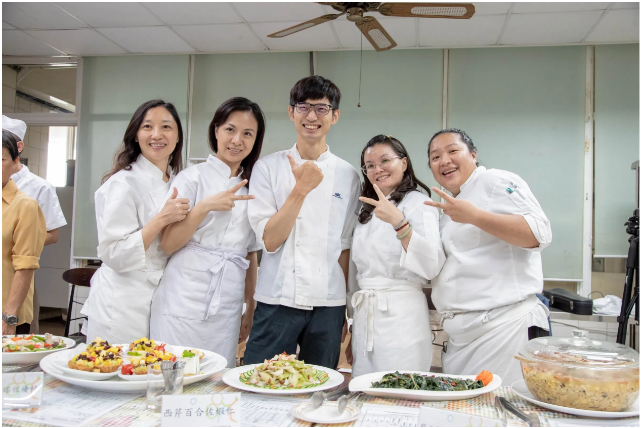
參與月子訓練班學員們完成360小時課程後開心結業【圖/翻攝畫面】

結業典禮現場，學員們發揮精湛廚藝，展示坐月子養生料理，台南市政府勞工局人員也到場，與所有學員分享就業媒合服務等資訊，以滿足學員後續求職上的需求，嘉藥推廣中心顏主任指出：這個課程是以就業為導向，所以，不只要傳授產後照護的專業技能，更要從產婦、雇主的角度，培養高質感的坐月子服務人才，幫助學員們盡快找到工作。