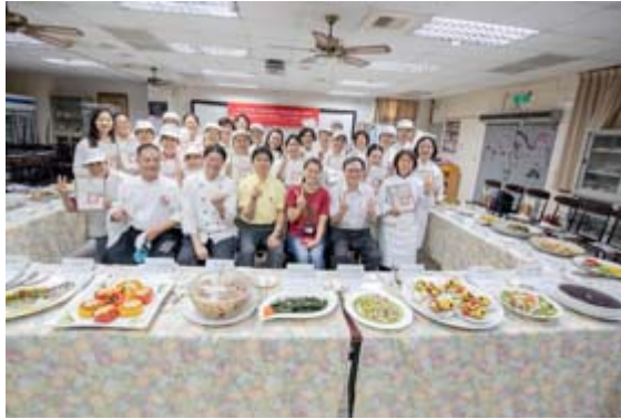
嘉藥坐月子訓練班於日前舉辦結業儀式。

【記者孫宜秋／南市報導】由台南市政府勞工局職訓就服中心委託嘉南藥理大學推廣教育中心所舉辦「坐月子服務人員訓練班」，歷經了360小時的訓練之後，在8月29日舉行結訓典禮，台南市政府勞工局長官特別親臨會場嘉勉所有學員，並頒贈結業證書。獲頒結業證書的26位學員，以歡