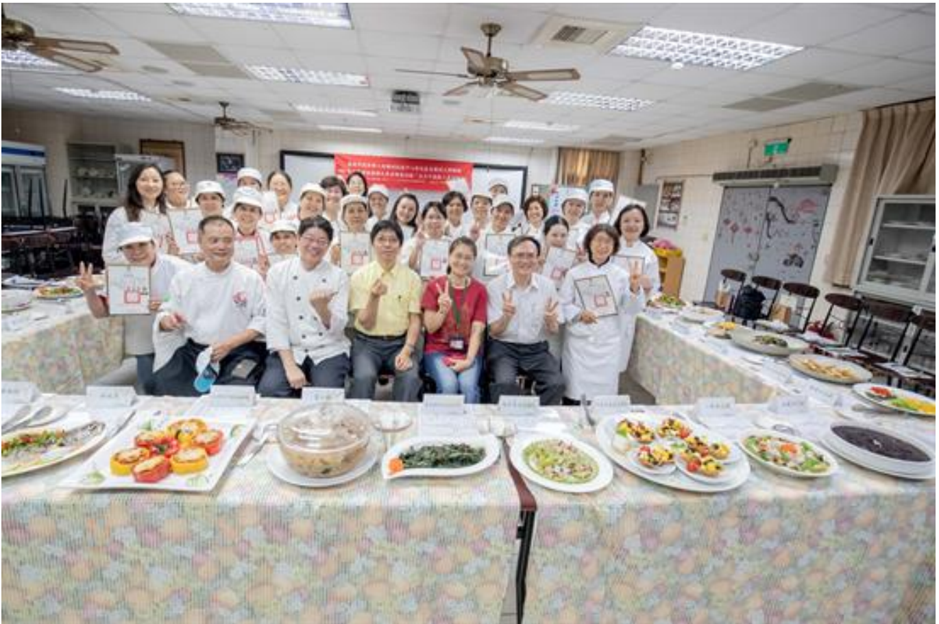
嘉藥坐月子訓練班以專業催生 培力與就業 母女攜手行