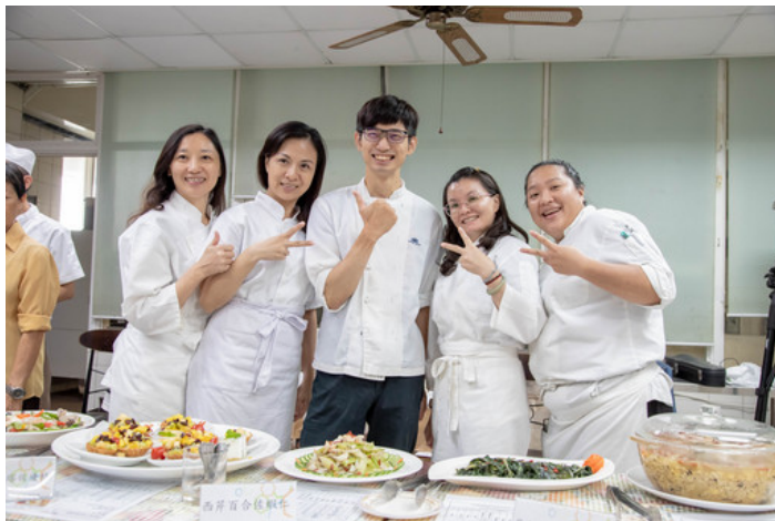
參與月子訓練班學員們完成360小時課程後開心結業