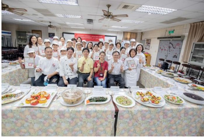
嘉藥坐月子訓練班於日前舉辦結業儀式