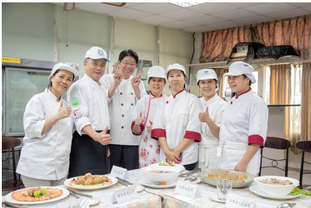
嘉藥專業師資與課程安排，讓參加學員各個成為月嫂達人。