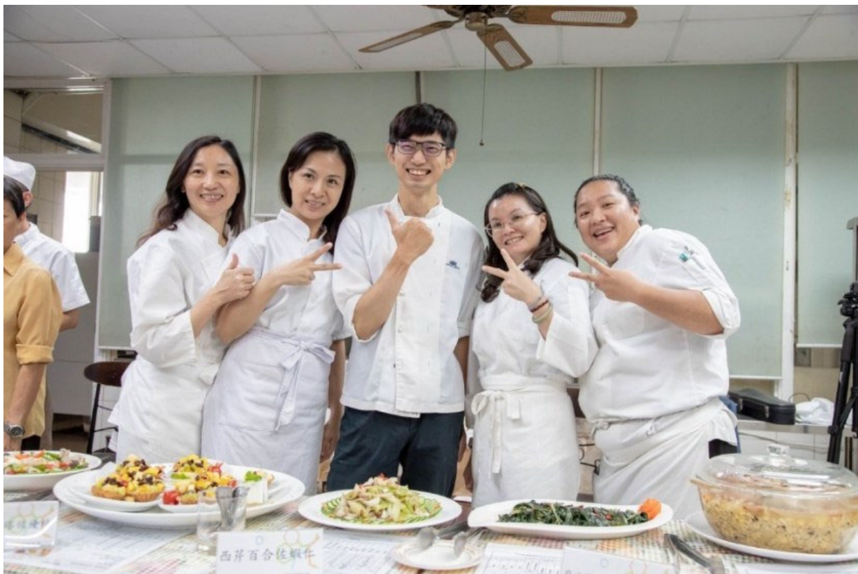
參與月子訓練班學員們完成360小時課程後開心結業【圖/翻攝畫面】

結業典禮現場，學員們發揮精湛廚藝，展示坐月子養生料理，台南市政府勞工局人員也到場，與所有學員分享就業媒合服務等資訊，以滿足學員後續求職上的需求，嘉藥推廣中心顏主任指出：這個課程是以就業為導向，所以，不只要傳授產後照護的專業技能，更要從產婦、雇主的角度，培養高質感的坐月子服務人才，幫助學員們盡快找到工作。