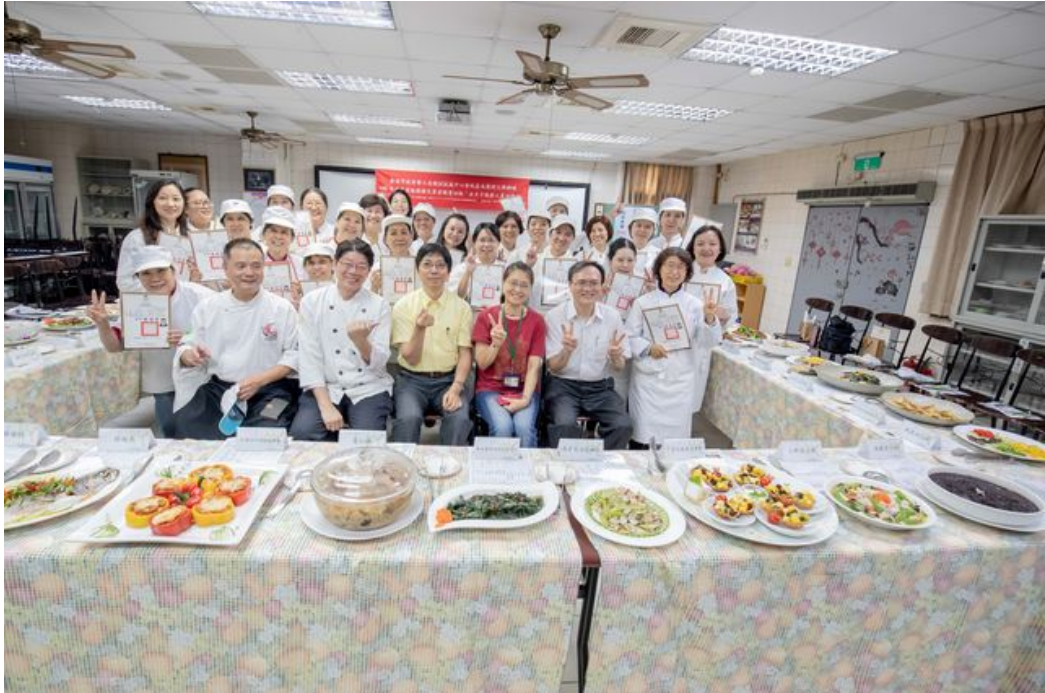
嘉藥坐月子訓練班舉辦結業儀式。

http://www.entimes.info 2019-09-01 22:06:01