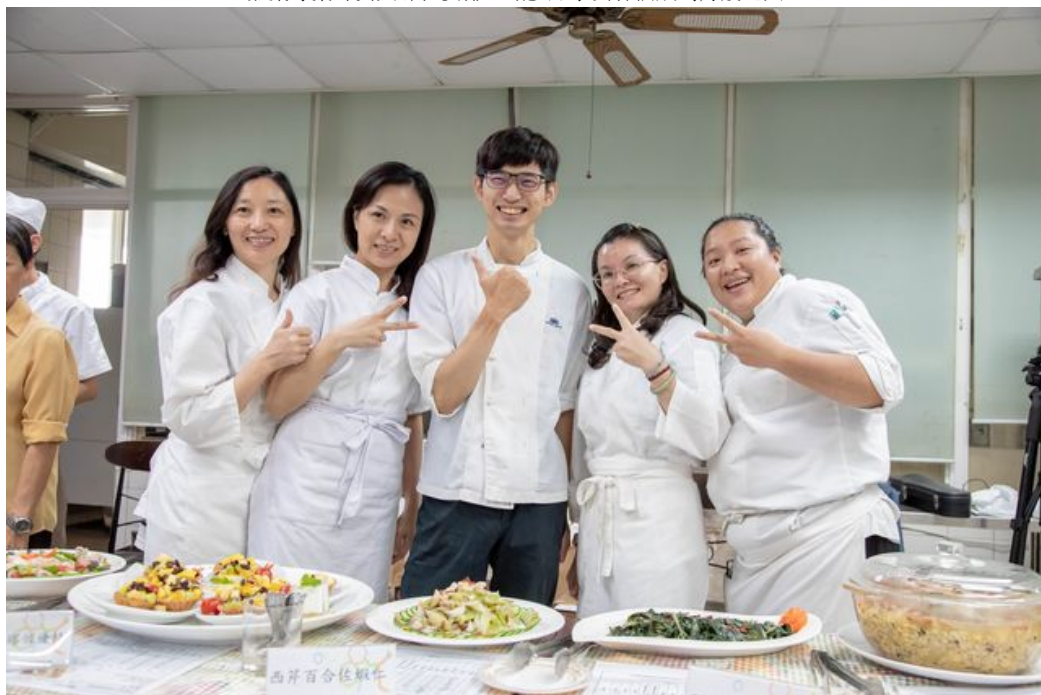
參與月子訓練班學員們完成360小時課程後開心結業。