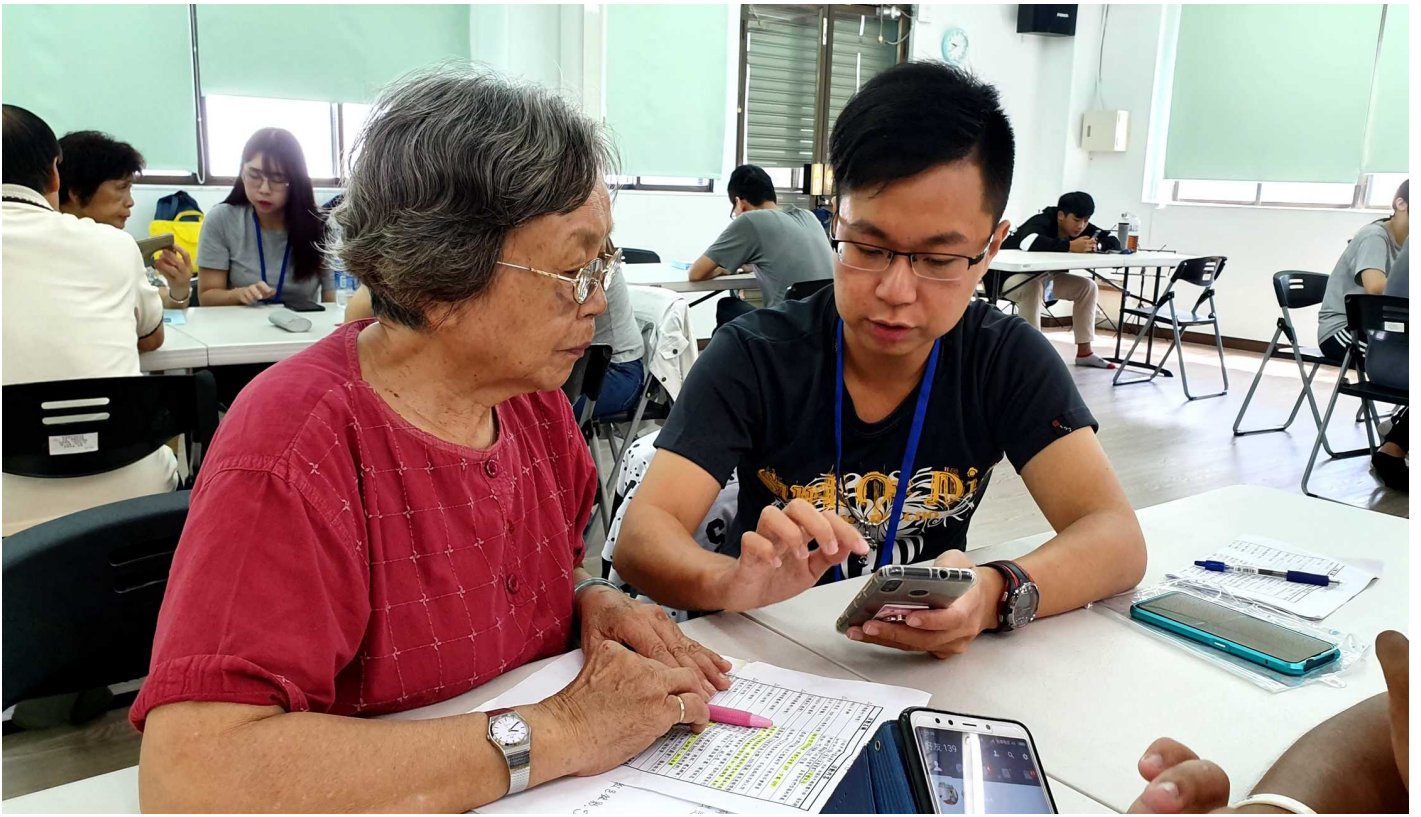
圖說：嘉藥資管系同學教導銀髮族使用智慧型手機。

林澄輝社福基金會執行長黃良矜表示，銀髮三C手機達人班是長者的暑假大事，尚未開辦就有人在問了，因為連續三年的成果已有口碑，這次分別在台南市南廠長壽會、璐德老人長期照顧中心及臨安大樓開設了四個班，吸引超過五位銀髮長者「樓頂偕樓咖，作伙來參加」。