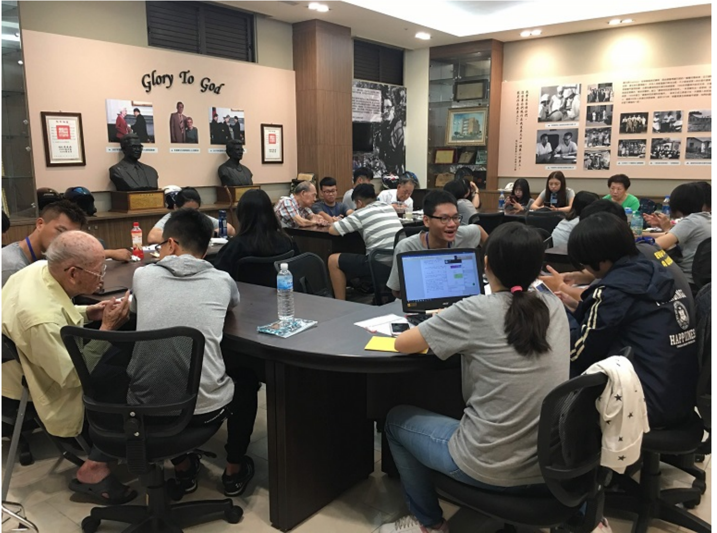
▲嘉藥學生前進社區教導銀髮族3C產品，吸引許多長輩參加。

有感於現今智慧型手機功能多元，銀髮族在使用時，常面臨無人可問或被晚輩「洗臉」的窘境，再加上缺乏機會練習，要是只學過一次，其實不容易記住，而親人又無暇陪同練習，甚至責備「怎麼教都學不會」，多數的銀髮族都失去信心，只好放棄。