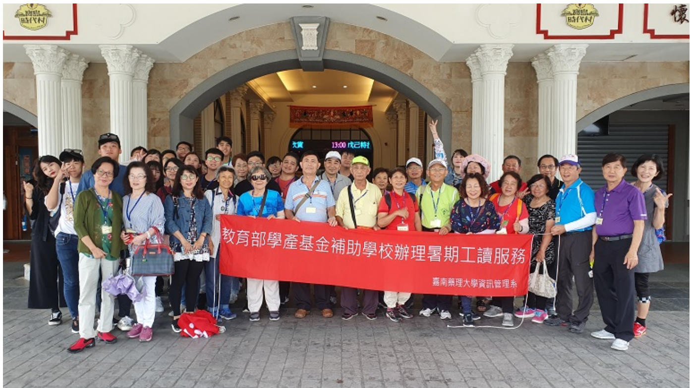
▲嘉南藥理大學與林澄輝社會福利基金會，連續三年開辦銀髮3C手機達人班。