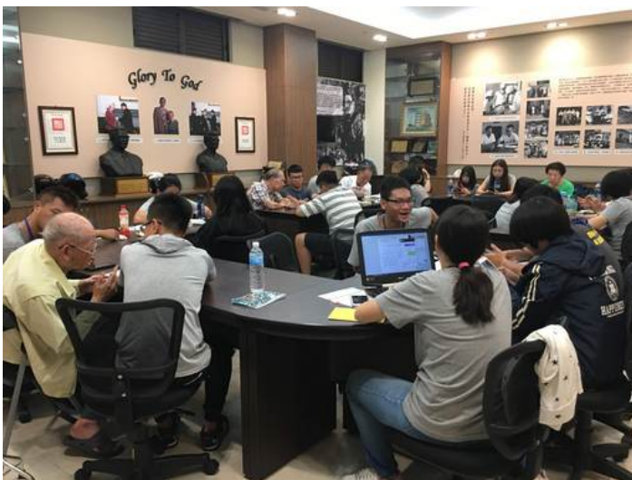
嘉藥學生前進社區教導銀髮族3C產品，吸引許多長輩參加