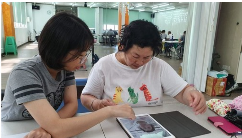
為了跟上年輕人腳步長輩們用心學習3C產品使用。