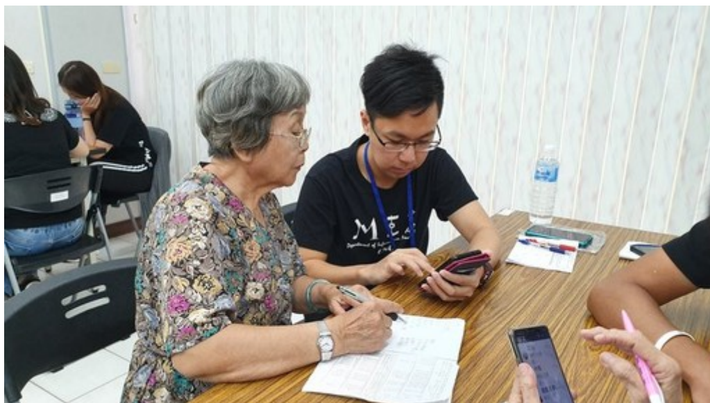
銀髮3C手機達人班的長輩們邊學習邊做筆記。