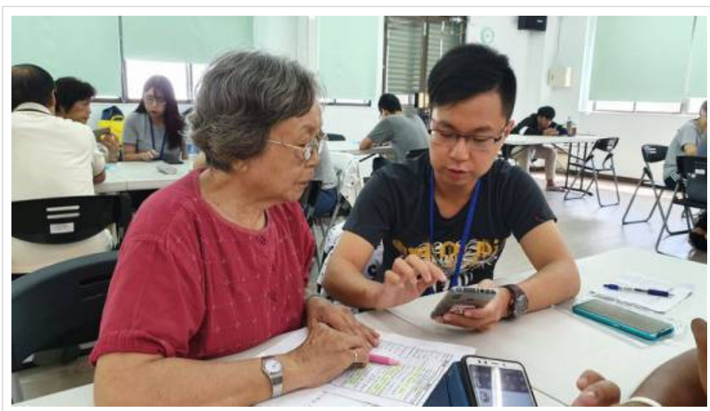
圖5：嘉藥學生前進社區教導銀髮族3C產品，吸引許多長輩參加。