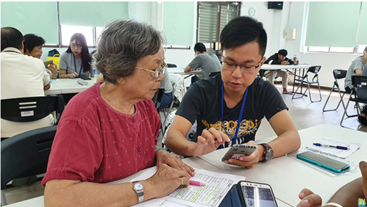
▲嘉藥資管系同學教導銀髮族使用智慧型手機。

參加的李阿公豎起大拇指說，謝謝同學這麼有耐心的教學，讓他問問題也不用歹勢，覺得學得很有心得。蘇阿嬤也表示，最高興學會拍照跟修圖，這樣出門去玩，就可以賴給朋友看。