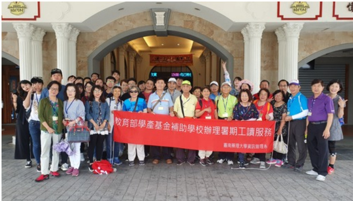
嘉南藥理大學與林澄輝社會福利基金會，連續三年開辦銀髮3C手機達人班