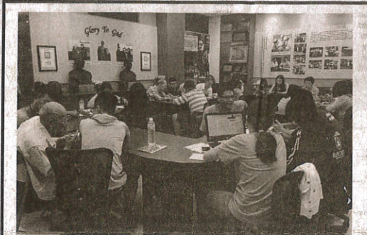
嘉藥學生前進社區教導銀髮族3C產品，吸引許多長輩參加。