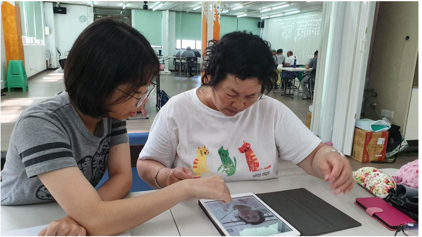
在學生們的細心教學下，長輩們能夠擺脫以往不好意思問的窘境，按部就班熟悉手機功能。