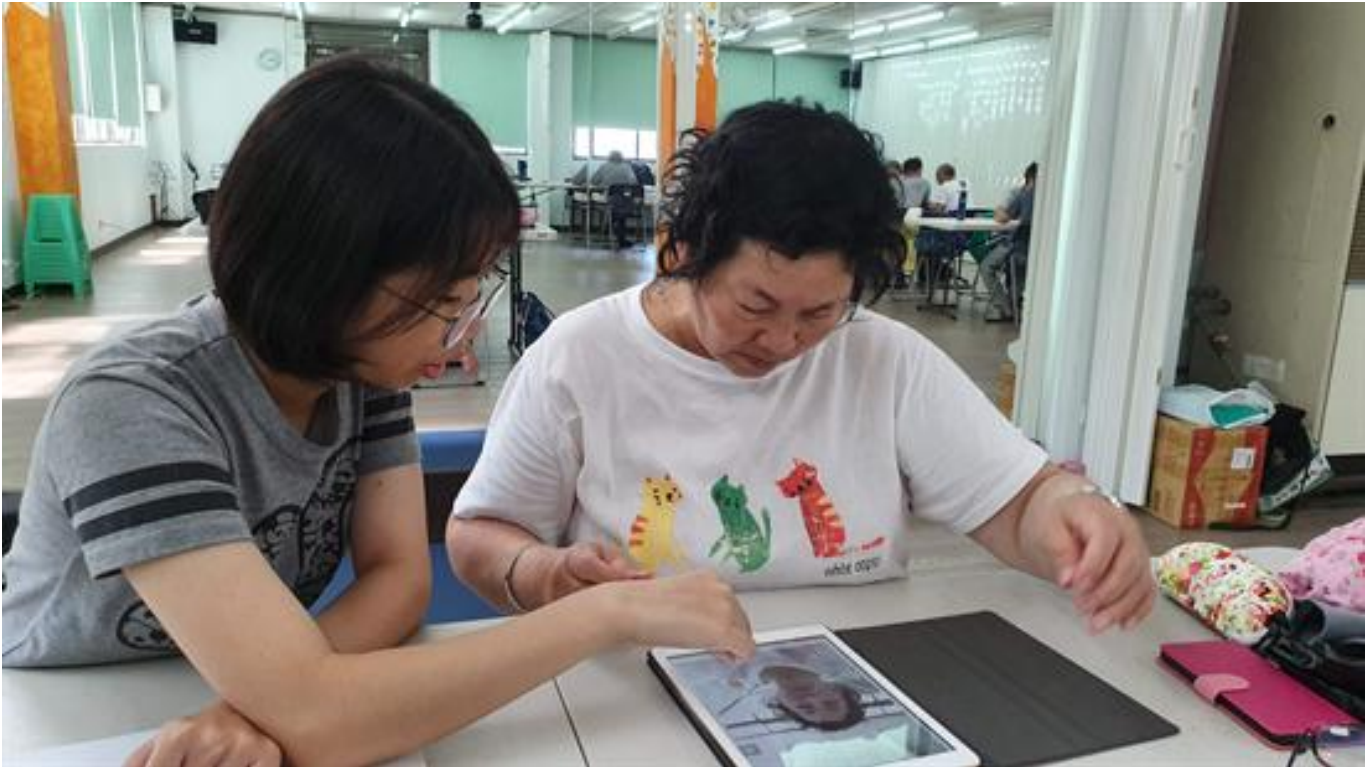
LKK也要滑出自信 嘉藥3C達人班風光結業

(中央社訊息服務20190805 10:42:44)由嘉南藥理大學資訊管理系、老人服務事業管理系與林澄輝社會福利慈善事業基金會開辦的銀髮3C手機達人班，在歷經四星期課程後，今天於中西區臨安大樓舉辦結業式，參加的大學生與銀髮長者都收穫滿滿。