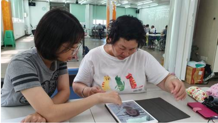
為了跟上年輕人腳步長輩們用心學習3C產品使用