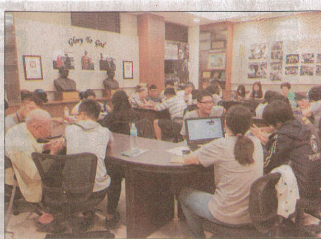
←嘉藥學生前進社區教導銀髮族3C產品，吸引許多長輩參加。