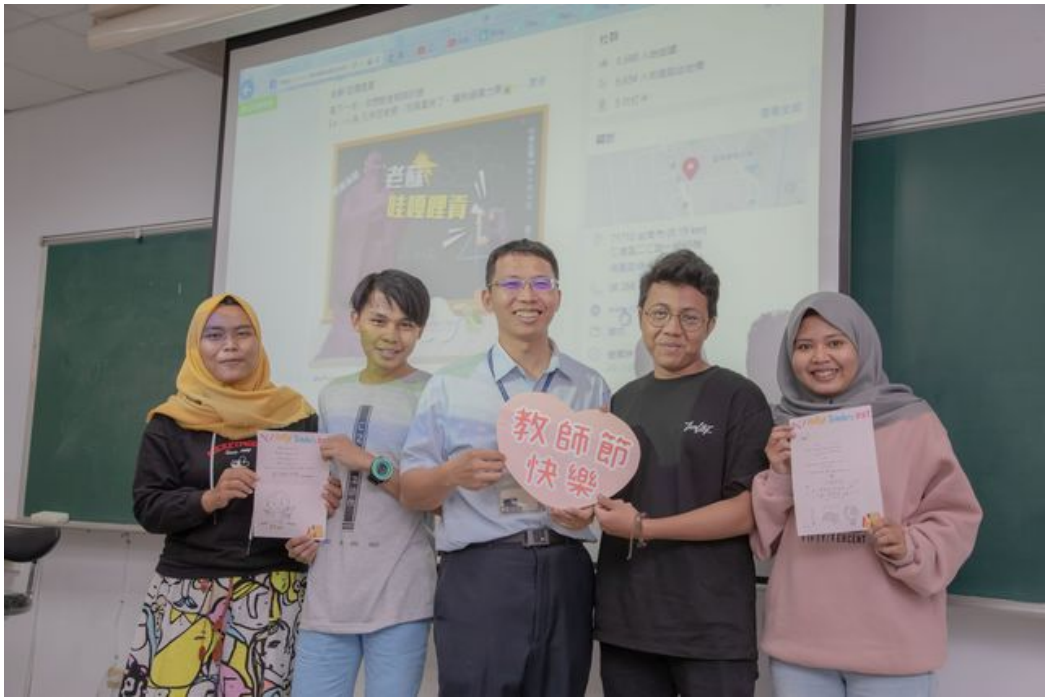
來自印尼的外籍學生首次體驗教師節，在卡片上寫下對老師的感謝心意。