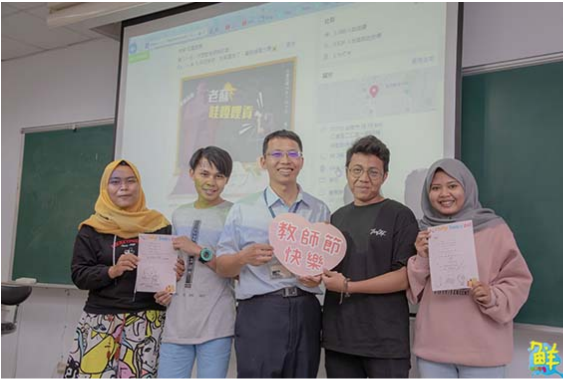
▲來自印尼的外籍學生首次體驗教師節，在卡片上寫下對老師的感謝心意。