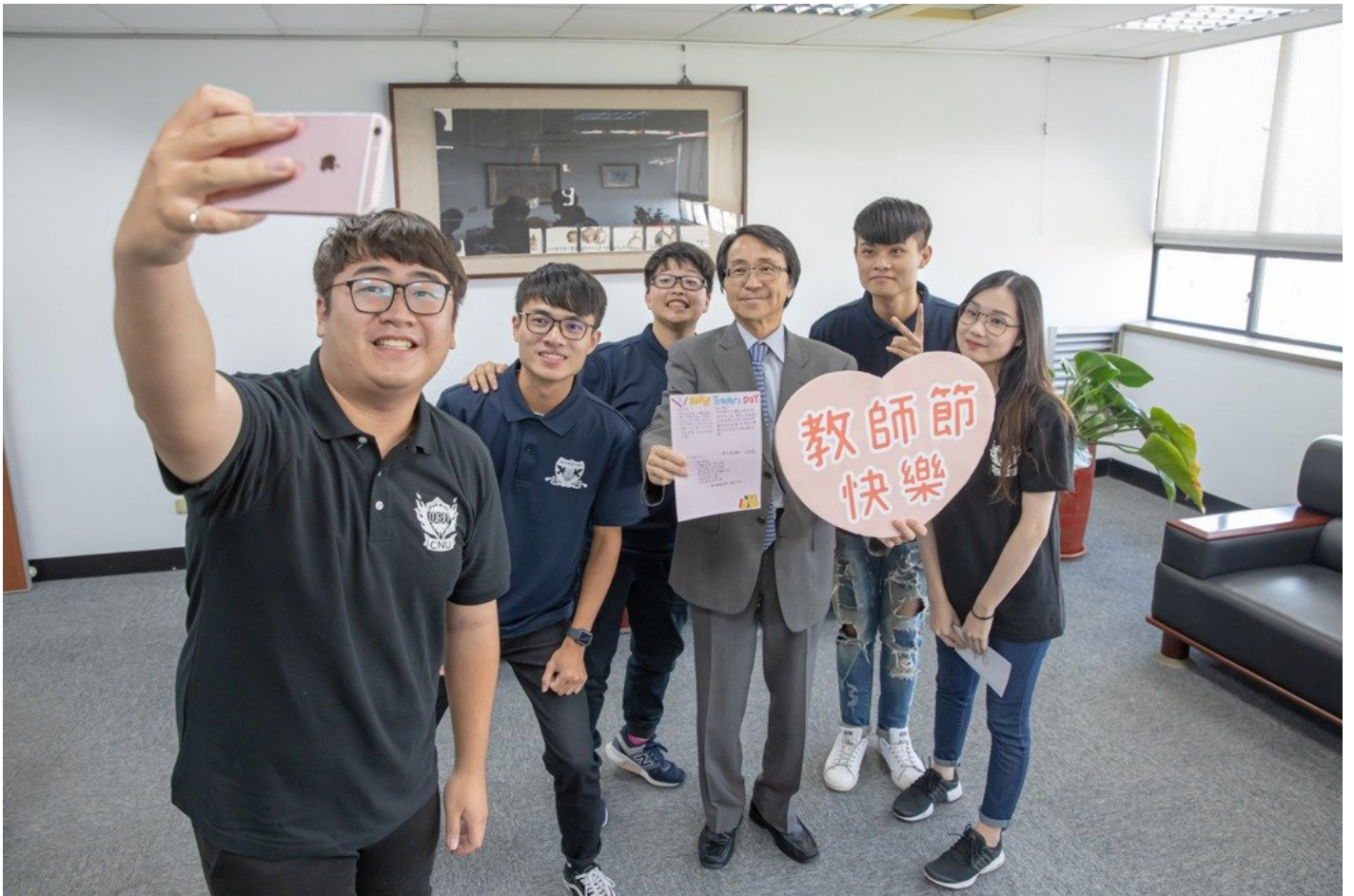
學生會代表全校同學贈送校長教師卡。