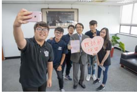
學生會代表全校同學贈送校長教師卡。

【記者孫宜秋／南市報導】一年一度的教師節即將到來，嘉南藥理大學為了感謝老師平時認真辛勤的付出，倡導尊師重道精神，增進師生間的互動與交流，特別規畫了「嘉藥小桃李，諄諄敬師情」卡片設計比賽，並評選出優秀作品印製成卡片，讓同學在卡片上寫下對老師的感謝，傳達出敬師、愛師心意給平日辛苦的老師們。