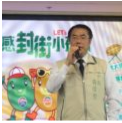
「Zespri超有感封街小孩趴」 17、18