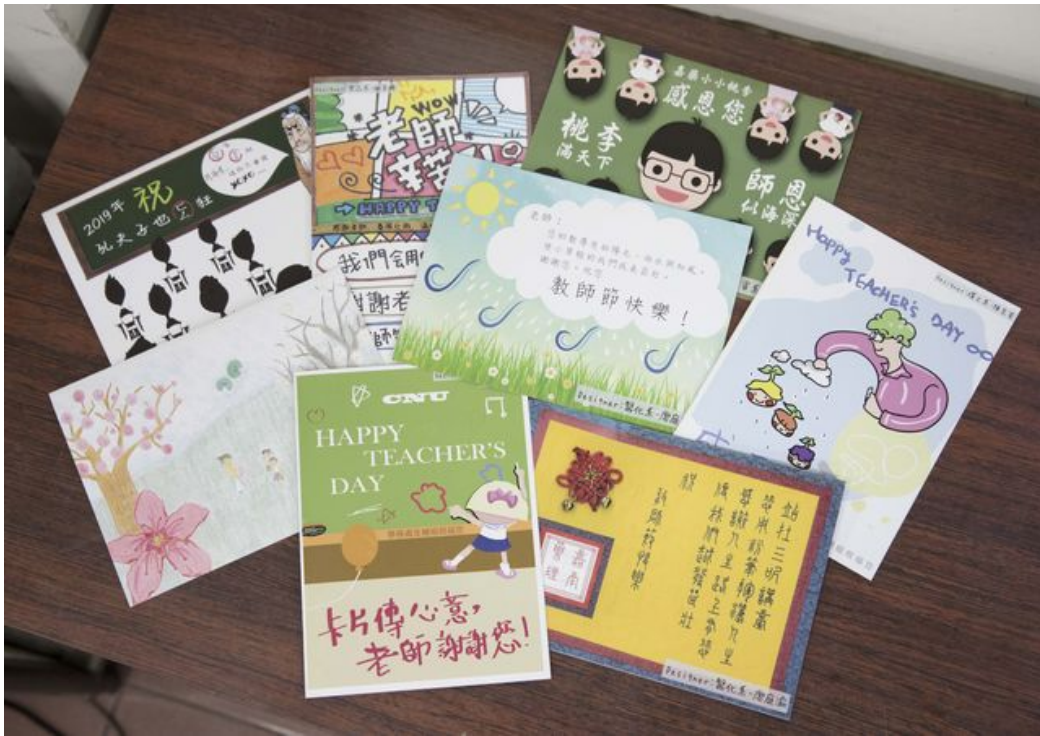
嘉藥舉辦教師卡片設計，投稿卡片創意多多。

一年一度的教師節即將到來，嘉南藥理大學為了感謝老師平時認真辛勤的付出，倡導尊師重道精神，增進師生間的互動與交流，特別規畫了「嘉藥小桃李，諄諄敬師情」卡片設計比賽，並評選出優秀作品印製成卡片，讓同學在卡片上寫下對老師的感謝，傳達出敬師、愛師心意給平日辛苦的老師們。