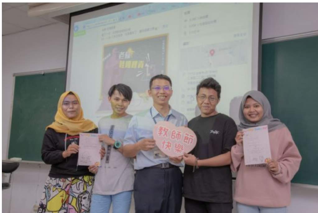
來自印尼的外籍學生首次體驗教師節，在卡片上寫下對老師的感謝心意。