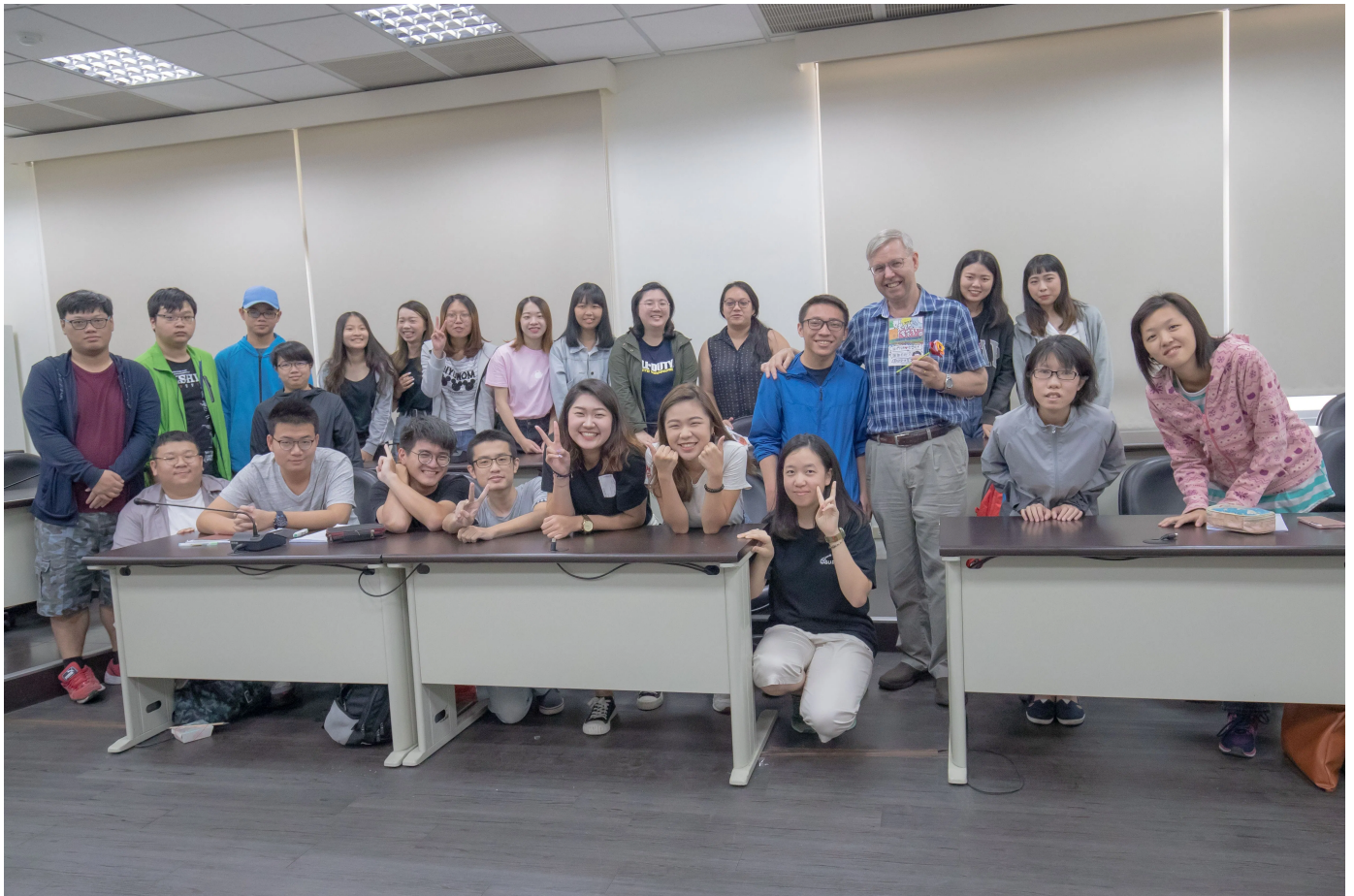
嘉藥小桃李 諄諄敬師情 【圖/翻攝畫面】