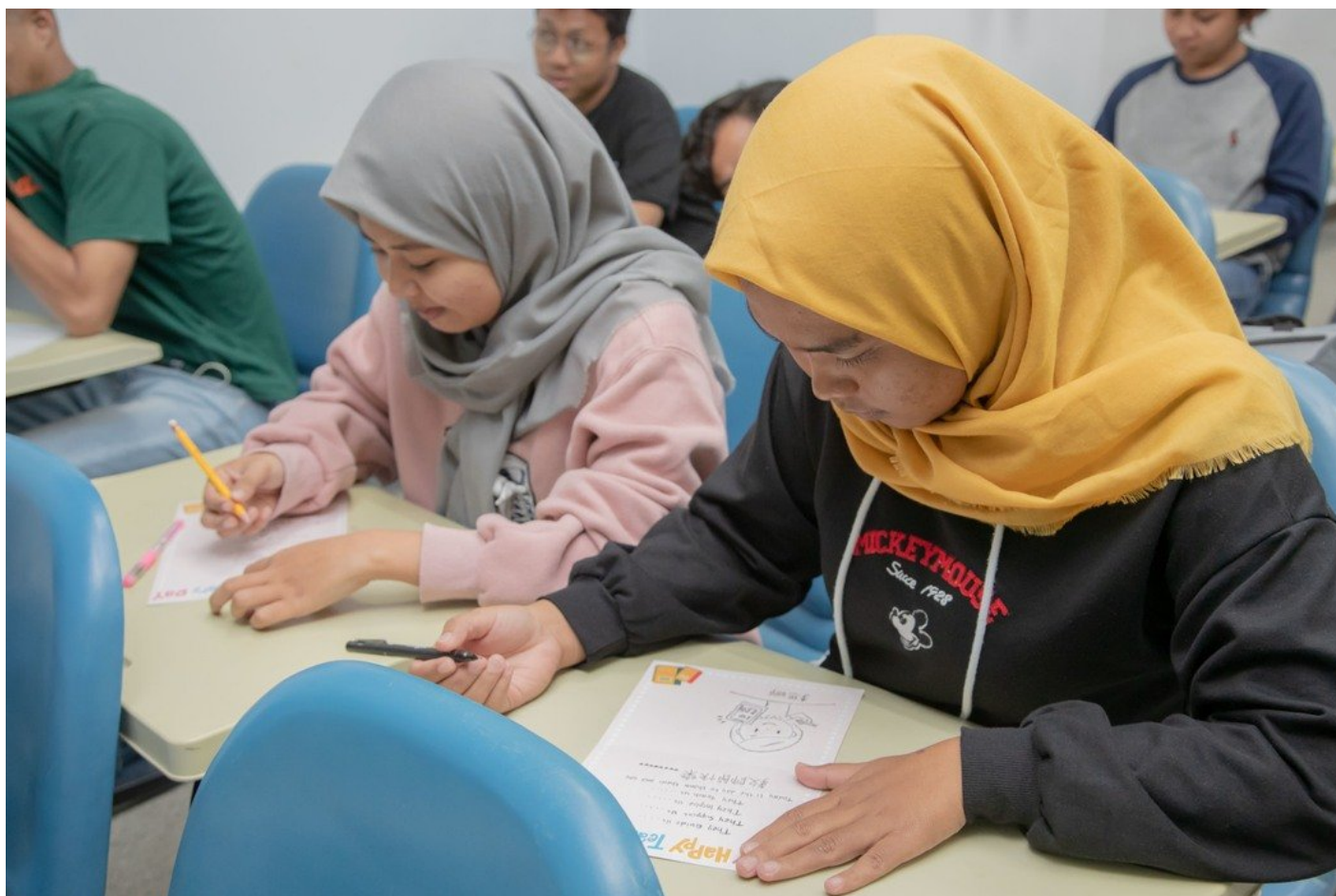
印尼同學展現創意，畫下對老師的感謝。