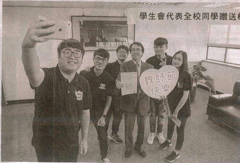
學生會代表全校同學贈送校長教師卡。

嘉藥校長陳鴻助表示教師節活動屬於品德教育的一部分，品德教育不只是教條式的宣講，也是一種感恩的行動；透過教師節活動讓學生能建立尊師敬師觀念，倡導學生重道精神，瞭解知恩感恩真諦，增進師生情誼，促進班級和諧氣氛，營造友善校園氣氛。