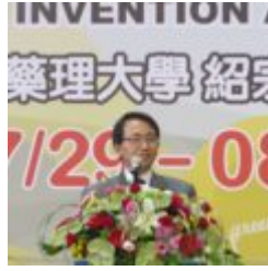
點亮環保金頭腦 嘉藥主辦綠點子發明