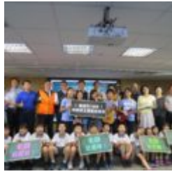
臺南市首度辦理教師節主題歌曲徵選