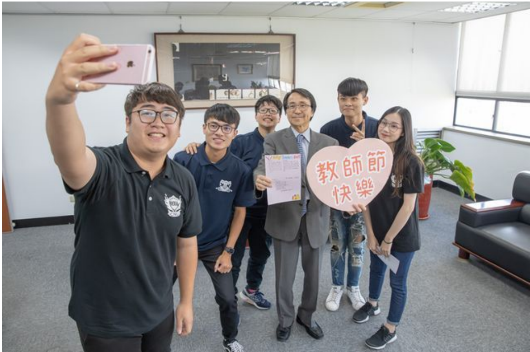
學生會代表全校同學贈送校長教師卡。

http://www.cntimes.info 2019-09-26 18:33:47