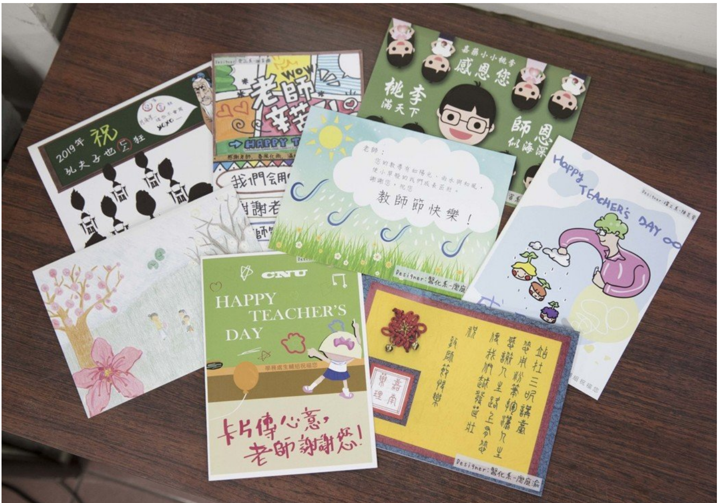
嘉藥舉辦教師卡片設計，投稿卡片創意多多。