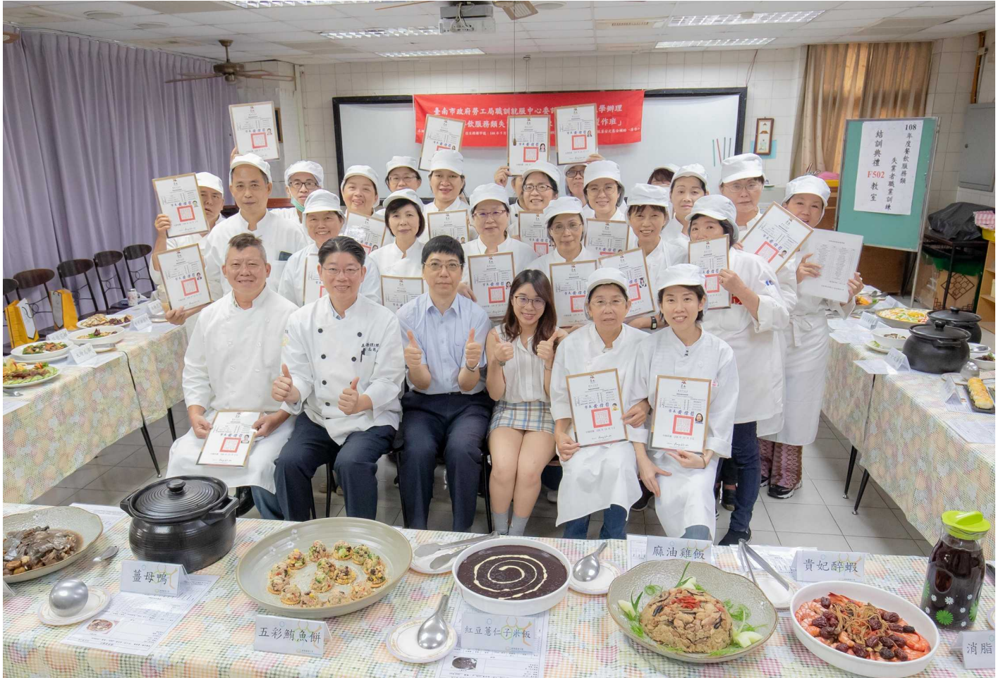
圖一：嘉藥藥膳烹調製作班結業，二十三位學員開心取得結業證書。

台南市府勞工局職訓就服中心委託嘉南藥理大學舉辦「藥膳烹調製作班」，二十三位學員歷經三二〇小時的訓練，四日舉行結訓成果發表會，嘉藥生活系主任王柏森表示，美味又具療效的藥膳，利人也利己，不只是可就業、創業的一技之長，更是保健的好幫手，祝福學員都能以健康的身體，開創新職涯。