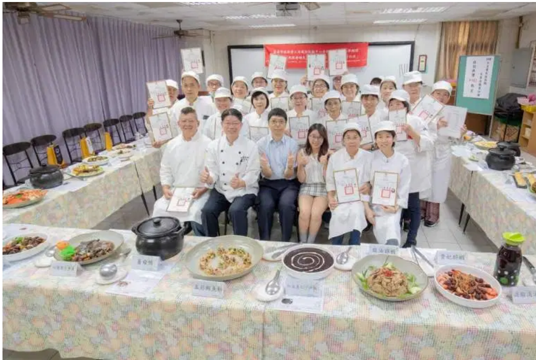
（圖說）嘉藥藥膳烹調製作班日前舉辦結業儀式。

民以食為天，藥膳食療更是民眾熱衷的飲食習慣，臺南市勞工局看準市場需求，結合嘉藥生活系專業模組課程和優良師資，推出「藥膳烹調製作班」，並針對中高齡、原住民、身心障礙者、低收入或中低收入、二度就業婦女、新住民、長期失業者等特定對象身分者，提供全額補助，以減輕弱勢失業民眾的經濟負擔，課程內容除學習藥膳餐點製作外，也涵蓋了中草藥及食材特性介紹、顧客心理學、食品相關法規，為學員將來的就業提供全方位的準備。