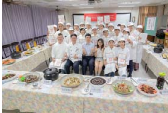
嘉藥藥膳烹調製作班於日前舉辦結業儀式。

【記者孫宜秋／南市報導】臺南市政府勞工局職訓就服中心委託嘉南藥理大學舉辦藥膳烹調製作班，歷經了320小時的訓練之後，於3日舉行結訓成果發表會，臺南市政府勞工局長官特別親臨會場嘉勉所有學員，並頒贈結業證書。順利完成課程的23位學員，互相祝勉，依依不捨都寫在臉