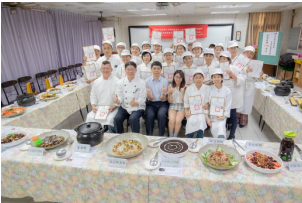
嘉藥藥膳烹調製作班於日前舉辦結業儀式