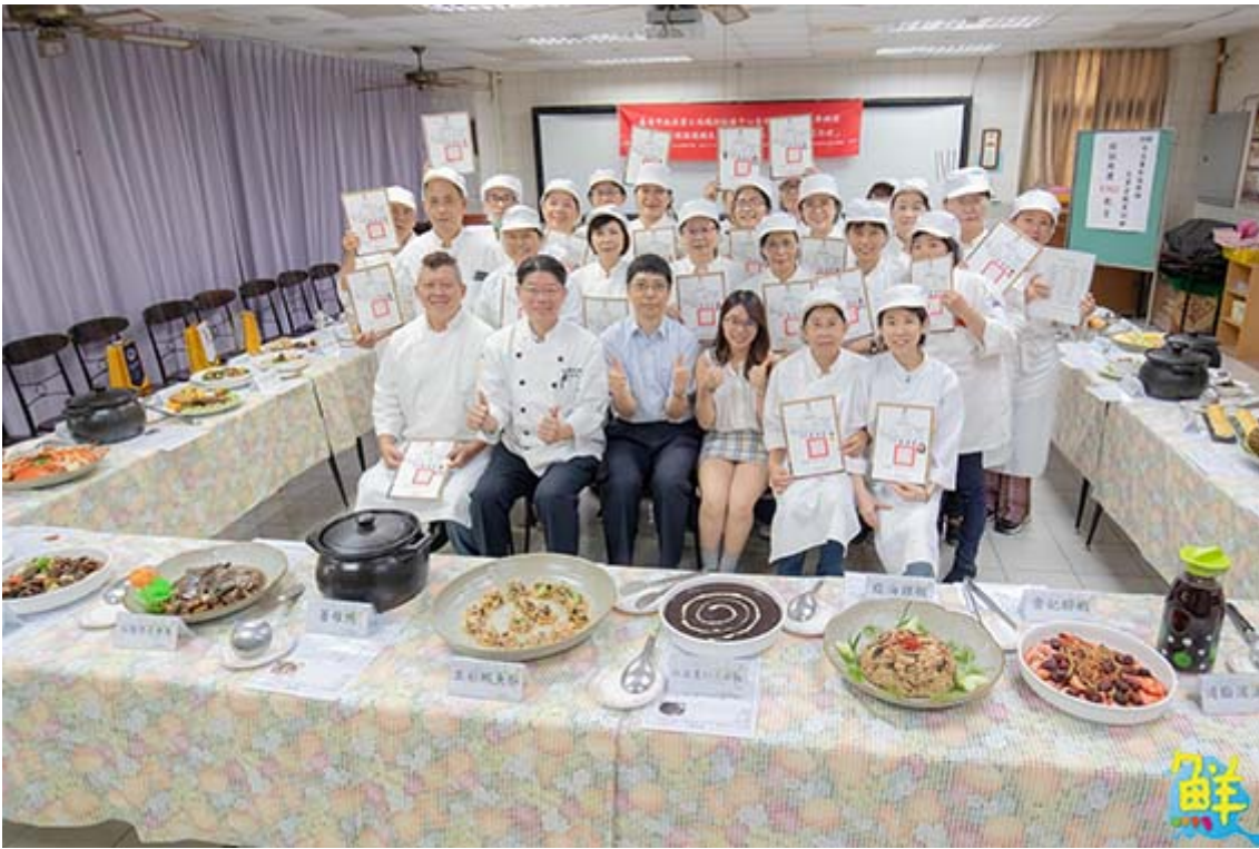
▲嘉藥藥膳烹調製作班於日前舉辦結業儀式，學員們展現學習成果。