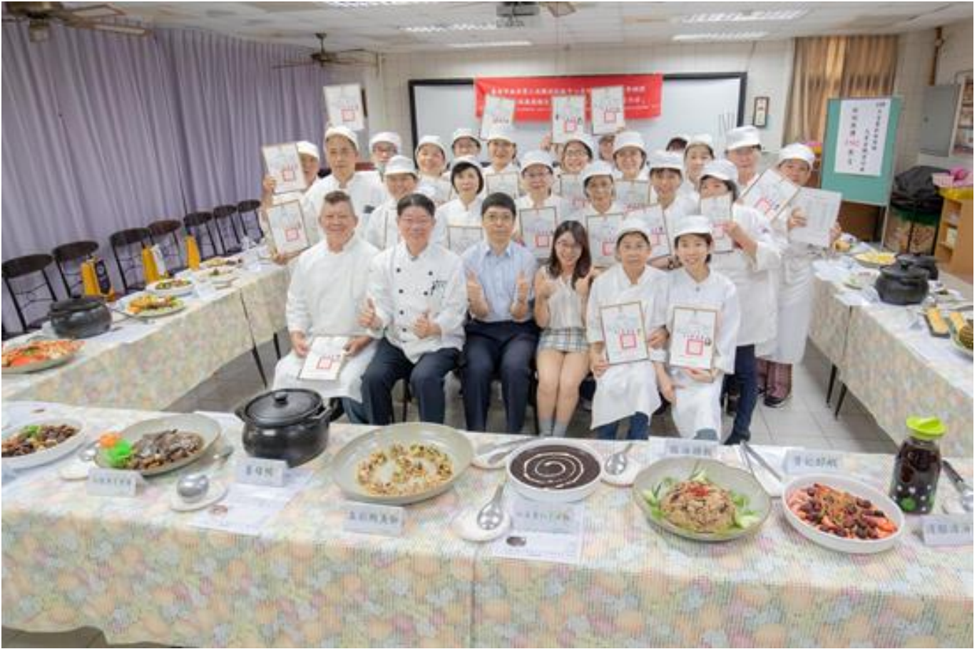
創意藥膳添新意 圓融執著寫新 嘉藥藥膳班劃下溫馨句點

(中央社訊息服務20191005 09:25:56)臺南市政府勞工局職訓就服中心委託嘉南藥理大學舉辦藥膳烹調製作班，歷經了320小時的訓練之後，於3日舉行結訓成果發表會，臺南市政府勞工局長官特別親臨會場嘉勉所有學員，並頒贈結業證書。順利完成課程的23位學員，互相祝勉，依依不捨都寫在臉上，嘉藥生活系主任王柏森表示，美味又具療效的藥膳，利人也利己，不只是可就業、創業的一技之長，更是保健的好幫手，他祝福學員都能以健康的身體，開創新職涯。