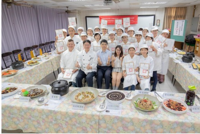
嘉藥藥膳烹調製作班於日前舉辦結業儀式