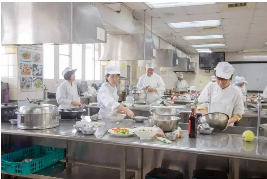
（圖說）藥膳烹調班學員們，卯足全力在結訓日大展廚藝。

民以食為天，藥膳食療更是民眾熱衷的飲食習慣，臺南市勞工局看準市場需求，結合嘉藥生活系專業模組課程和優良師資，推出「藥膳烹調製作班」，並針對中高齡、原住民、身心障礙者、低收入或中低收入、二度就業婦女、新住民、長期失業者等特定對象身分者，提供全額補助，以減輕弱勢失業民眾的經濟負擔，課程內容除學習藥膳餐點製作外，也涵蓋了中草藥及食材特性介紹、顧客心理學、食品相關法規，為學員將來的就業提供全方位的準備。