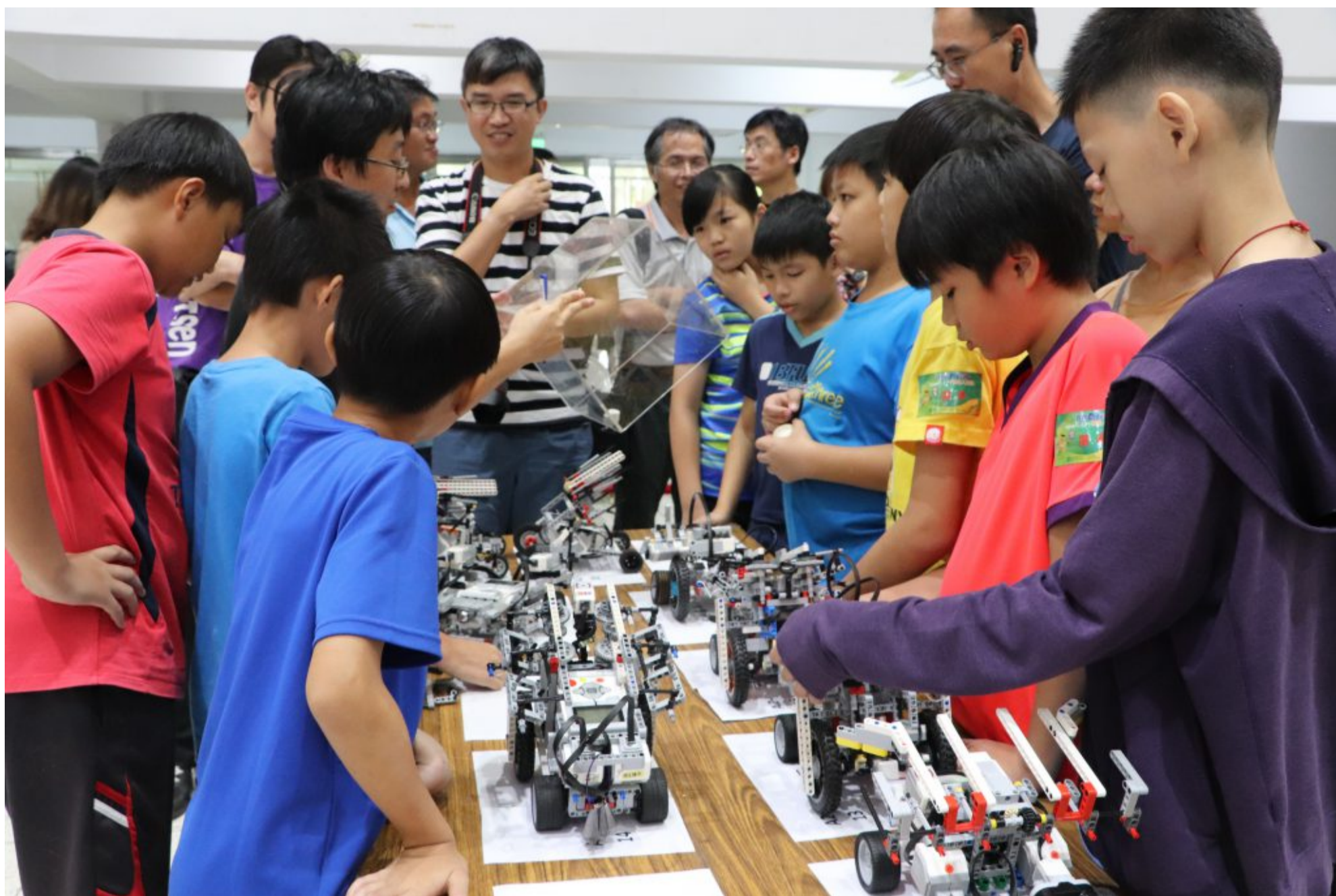
裁判和參賽同學們一起站在展示區，確認機器人的組裝架構是否正確。