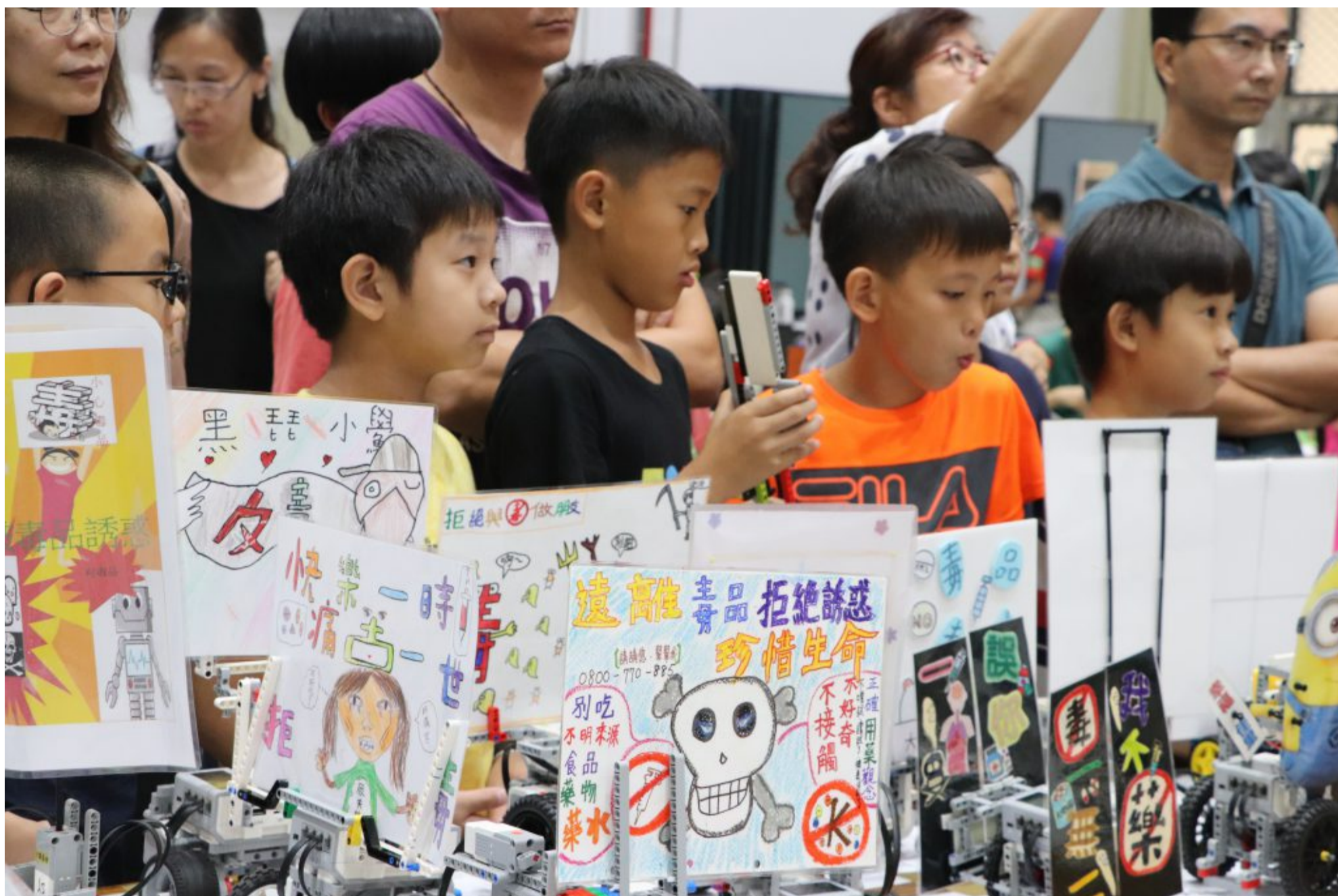
參賽選手們在檢錄區等待機器人出場，桌上擺放著各種創意海報。