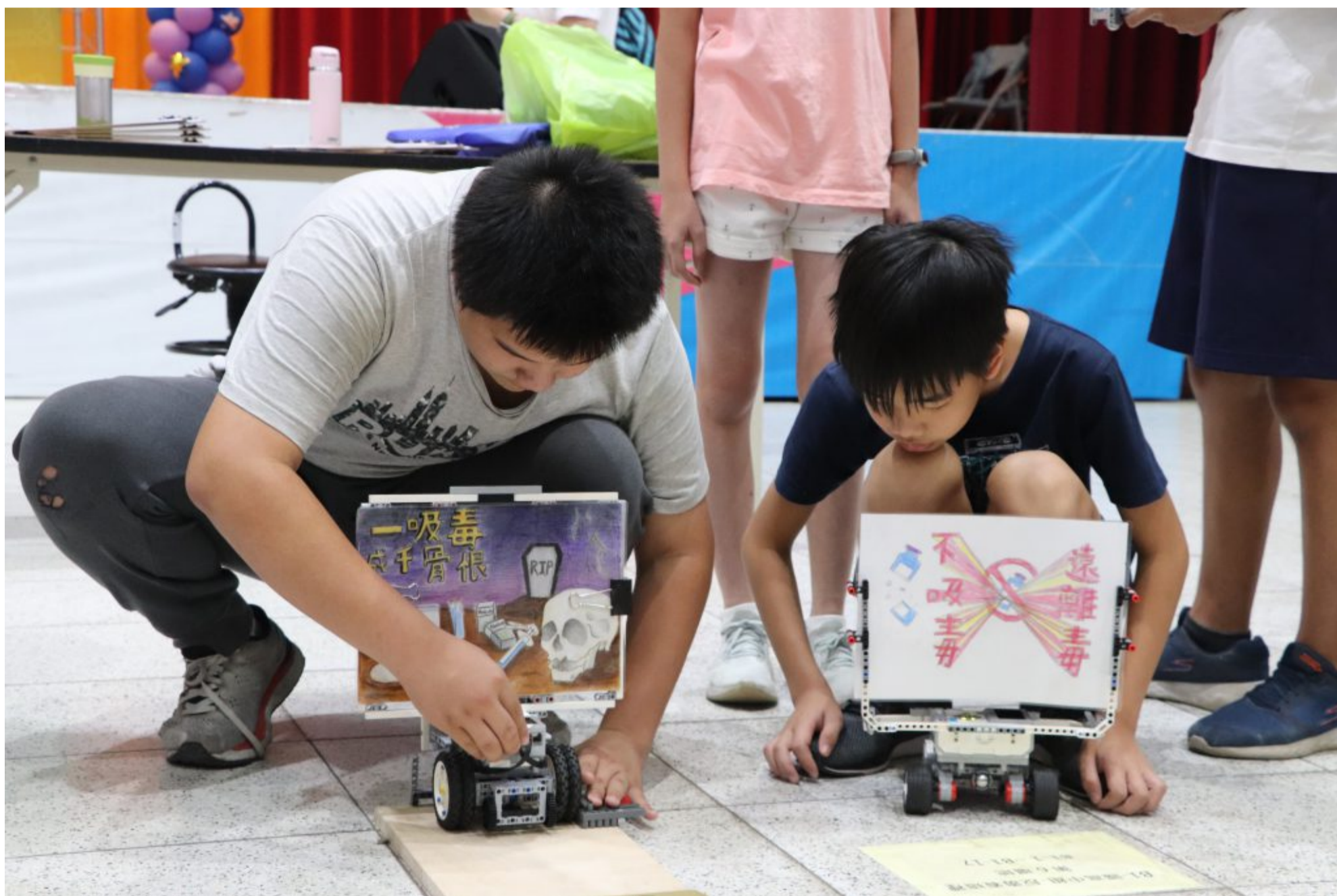
參賽小朋友集中精神，讓機器人帶著自己製作的創意海報，在迷宮中出發。

【記者呂心喻台南報導】裁判一聲令下，現場500到600位參賽同學拿起機器人放在軌道上奔馳，各式各樣的樂高積木製作而成的機器人，裝著不同造型的機械手臂，上面掛著各種創意海報。6日舉辦的第二屆嘉藥反毒機器人競賽由嘉南藥理大學主辦，吸引全台灣高中小132組學生參與，此次競賽將反毒知識融入有趣的機器人競賽，打造另類學習環境。