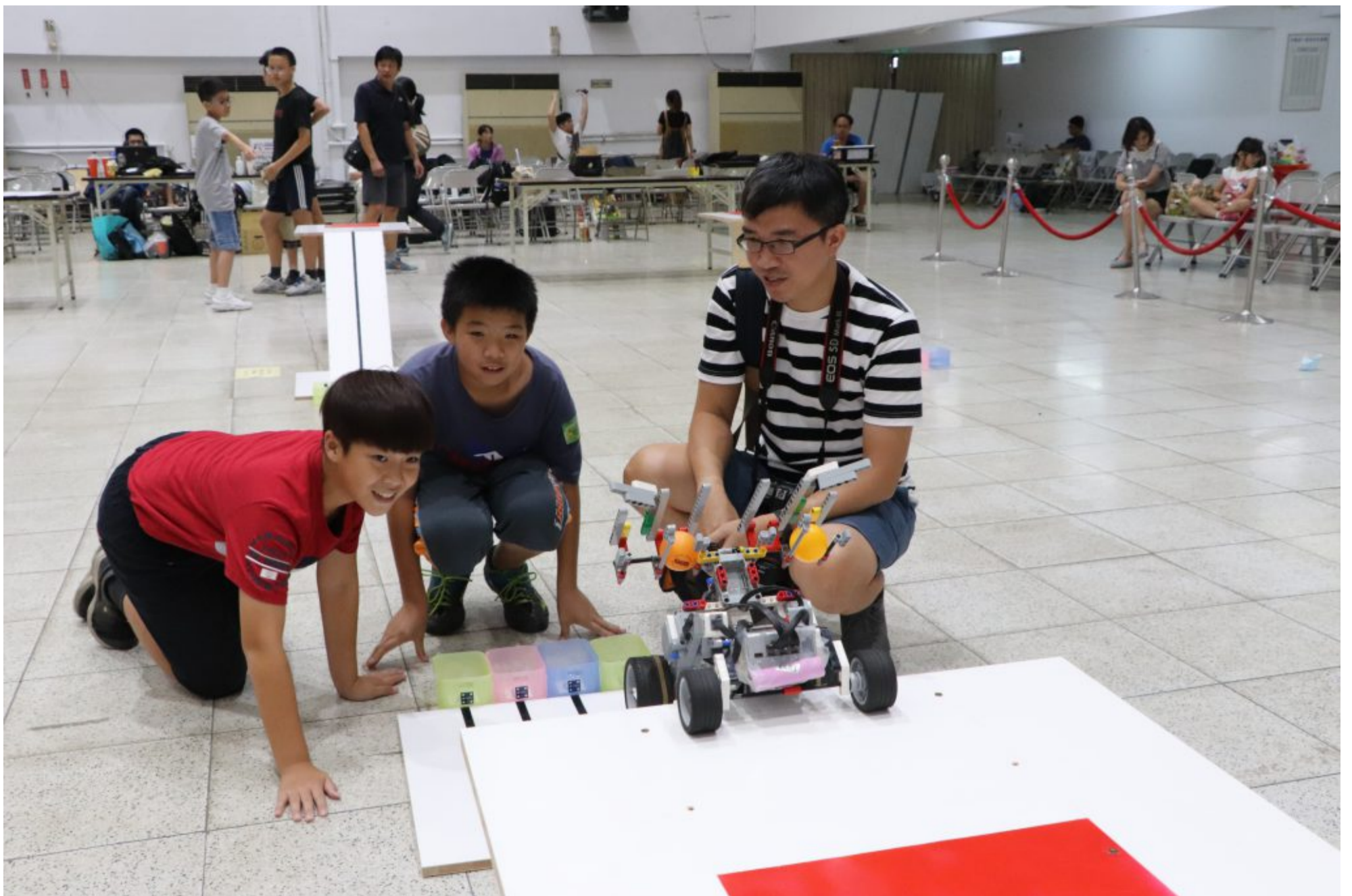
指導老師教導學生如何修正機器人，並引導他們主動發想程式和架構。

Tags: 1708期 , uNews , uonline , 反毒 , 樂高 , 機器人 , 比賽 , 生活