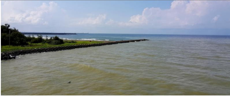
藍綠分色的樣態被居民戲稱為四草版的陰陽海。

不用抽 不用搶 現在用APP看新聞 保證天天中獎 點我下載APP 按我看活動辦法