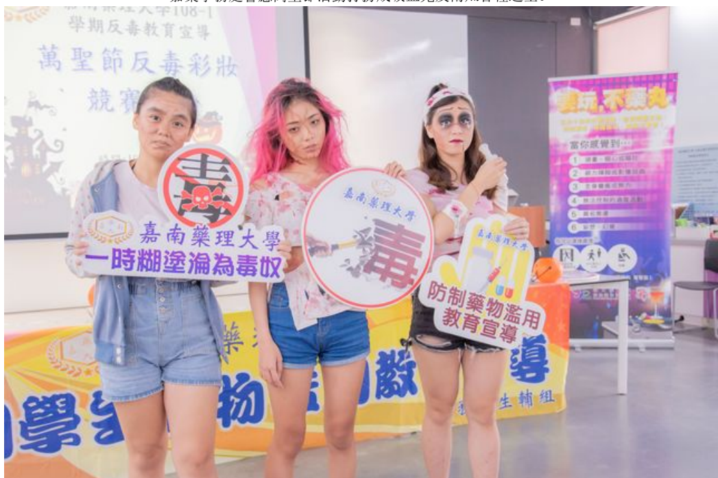
參加同學巧思裝扮展現吸毒後的樣子。