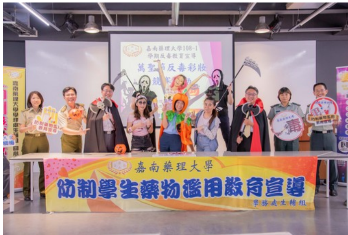
嘉藥學務處響應萬聖節活動打扮成吸血鬼及南瓜各種造型