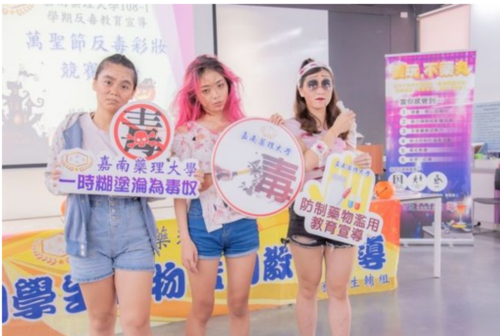
參加同學巧思裝扮展現吸毒後的樣子。