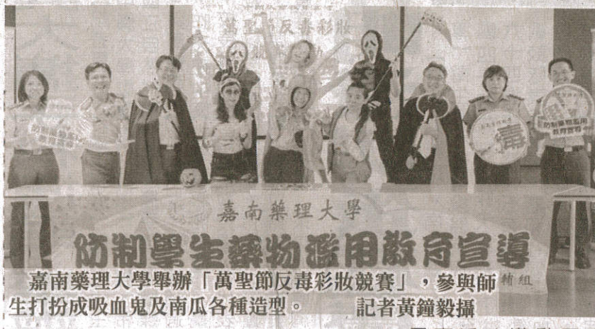
嘉南藥理大學舉辦「萬聖節反毒彩妝競賽」，參與師生打扮成吸血鬼及南瓜各種造型。

【記者黃鐘毅／台南報導】「萬聖節反毒彩妝競賽」吸毒妝貌」，邀請全校師生參加，讓學生發揮創意，透過彩妝凸顯毒品對容貌造成恐怖改變及身體危害，得獎作品將作成反