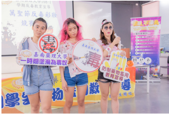
參加同學巧思裝扮展現吸毒後的樣子