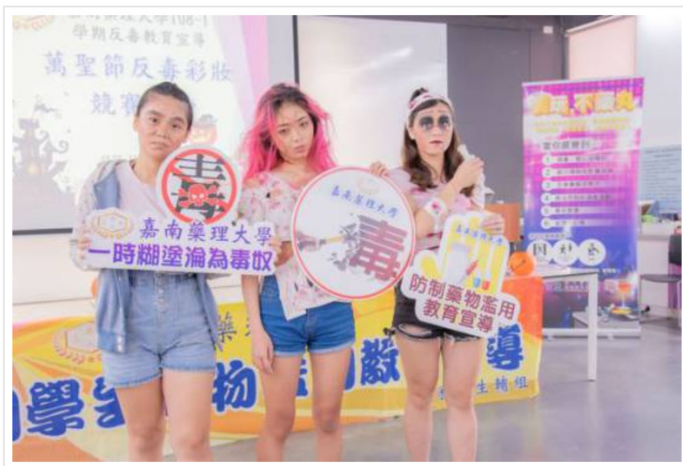
圖3：利用喪屍化妝感強調毒品吸食後果。