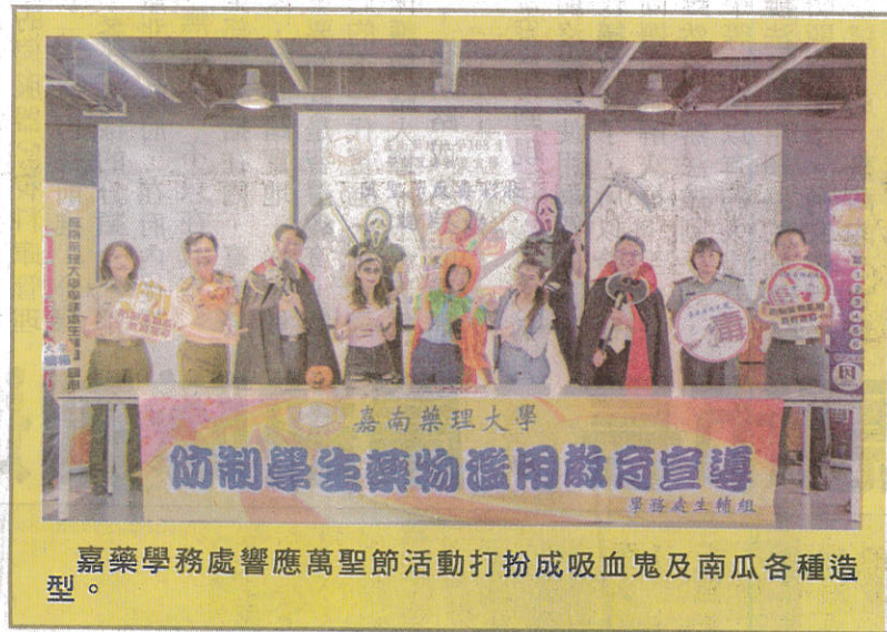
嘉藥學務處響應萬聖節活動打扮成吸血鬼及南瓜各種造型。

毒品的蔓延與戕害早已是各個有關單位全力防制重點，嘉藥對推廣反毒教育更是不遺餘力，除了與衛福部、臺南市衛生局、警察局及地方府機構攜手合作，還舉辦反毒專題演講、