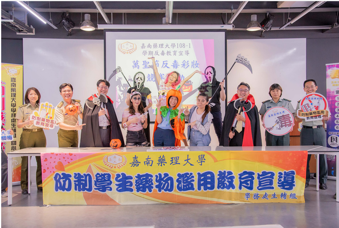
嘉南藥理大學利用萬聖節辦彩妝競賽推廣反毒教育。