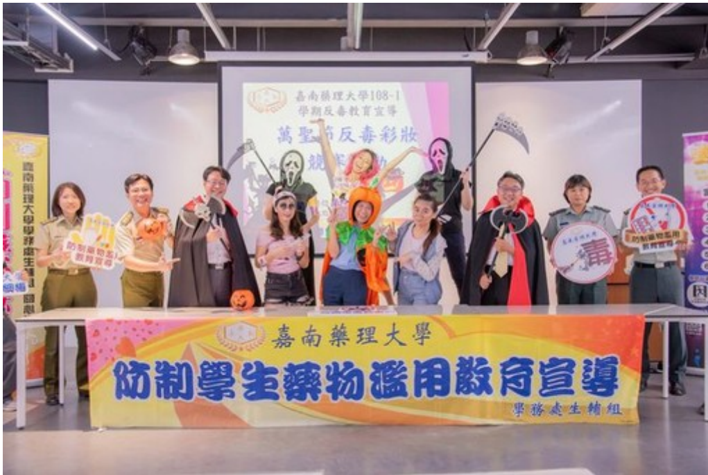
嘉藥學務處響應萬聖節活動打扮成吸血鬼及南瓜各種造型。