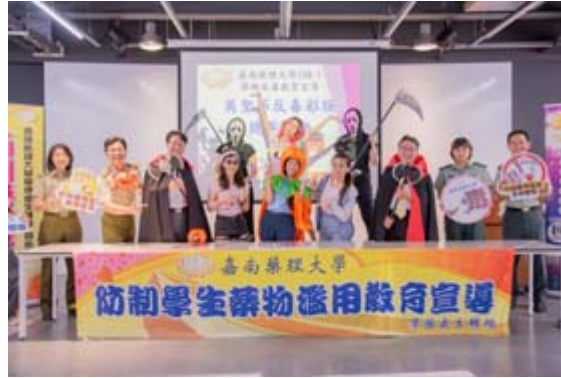
嘉藥學務處響應萬聖節活動打扮成吸血鬼及南瓜各種造型。

【記者孫宜秋／南市報導】搶搭西洋萬聖節熱潮，嘉南藥理大學學務處及粧品系合辦「萬聖節反毒彩妝競賽—吸毒妝貌」，邀請全校師生參加，讓學生發揮創意，透過彩妝凸顯毒品對容貌造成恐怖改變及身體危害，得獎作品將作成反毒宣導海報，並張貼於校內外以增進反毒教育成效，讓心