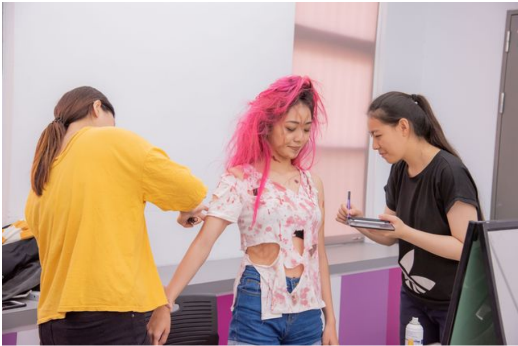
利用喪屍化妝感強調毒品吸食後果。

搶搭西洋萬聖節熱潮，嘉南藥理大學學務處及粧品系合辦「萬聖節反毒彩妝競賽—吸毒妝貌」，邀請全校師生參加，讓學生發揮創意，透過彩妝凸顯毒品對容貌造成恐怖改變及身體危害，得獎作品將作成反毒宣導海報，並張貼於校內外以增進反毒教育成效，讓心存僥倖或懷有好奇心的學生，警惕到毒品巨大的傷害，遠離毒品誘惑，防制學生藥物濫用。