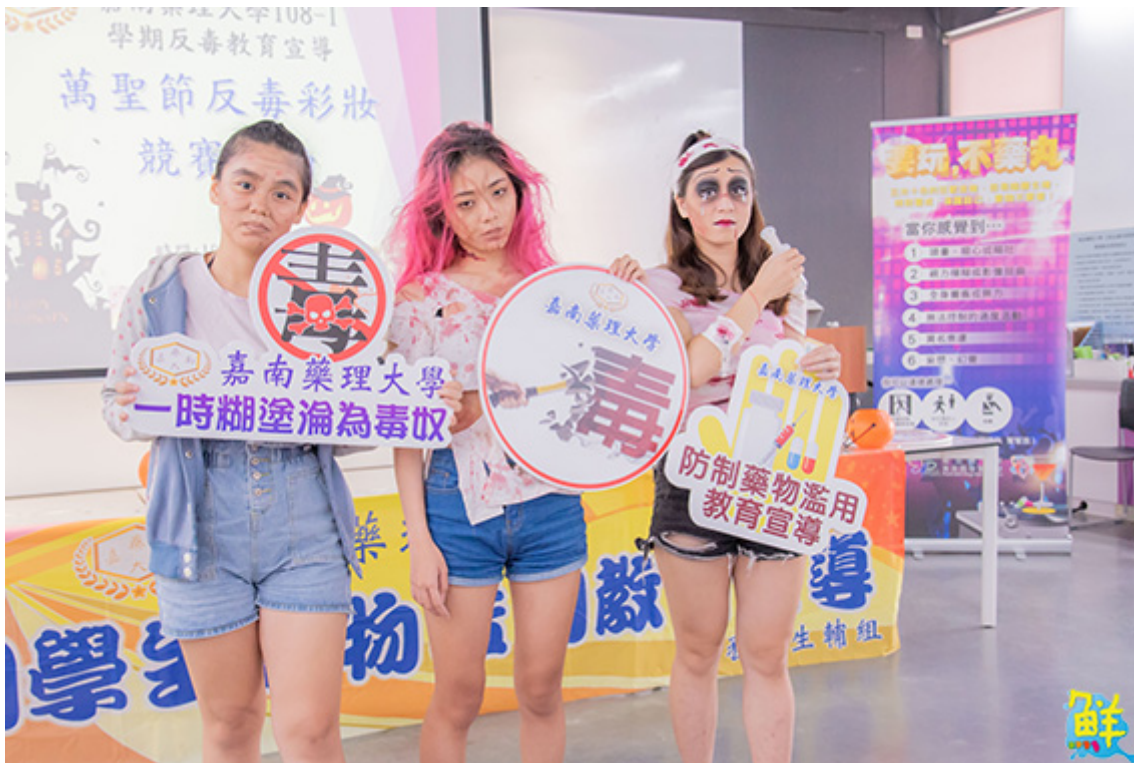
▲參加同學巧思裝扮展現吸毒後的樣子。

調吸毒者的無奈與無助，也希望告訴吸毒者要勇於向外求助，葉佳樺這組則是希望以老妝來警惕同學「不要為了一時的快樂，浪費自己的青春」。