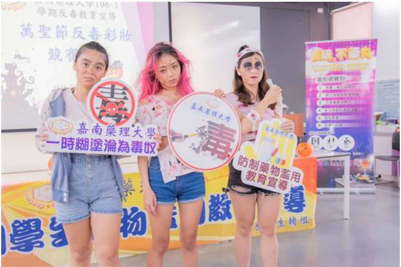
嘉藥創意反毒宣導 萬聖節彩妝競賽

(中央社訊息服務20191101 09:23:18)搶搭西洋萬聖節熱潮，嘉南藥理大學學務處及粧品系合辦「萬聖節反毒彩妝競賽 - 吸毒妝貌」，邀請全校師生參加，讓學生發揮創意，透過彩妝凸顯毒品對容貌造成恐怖改變及身體危害，得獎作品將作成反毒宣導海報，並張貼於校內外以增進反毒教育成效，讓心存僥倖或懷有好奇心的學生，警惕到毒品巨大的傷害，遠離毒品誘惑，防制學生藥物濫用。