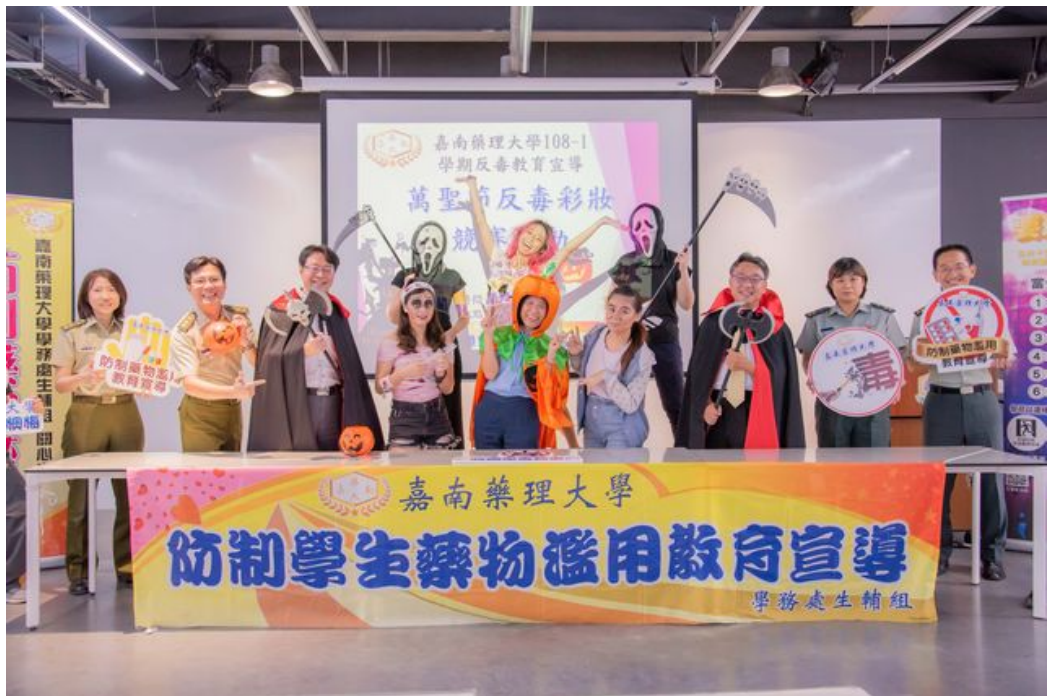
嘉藥學務處響應萬聖節活動打扮成吸血鬼及南瓜各種造型。

http://www.cntimes.info 2019-10-31 21:11:48