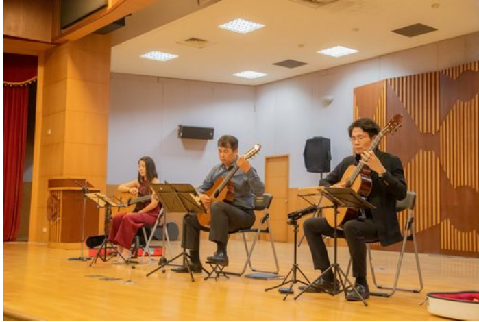
3位老師精彩演出讓觀眾聽得如癡如醉