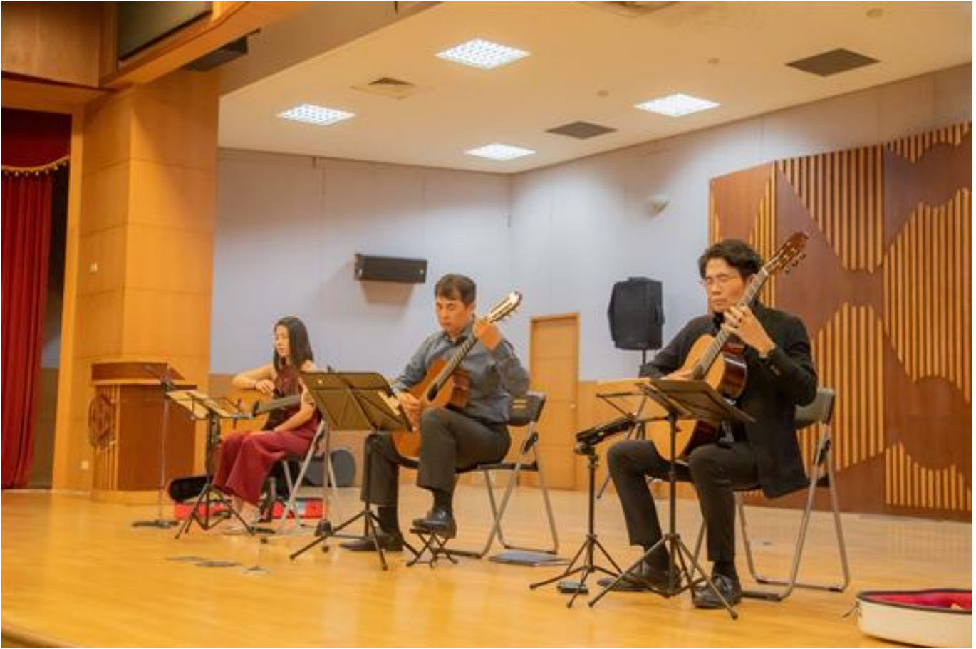
嘉藥吉他音樂饗宴 引領聽覺視覺感動

(中央社訊息服務20191028 09:33:51)由嘉南藥理大學文化藝術館與方圓之間室內樂團共同策劃的「吉思廣藝-吉他音樂工藝特展」系列活動，隨著名家名琴陸續登場，整個活動進入另一波高潮，還沒有到場參與音樂盛宴的愛樂同好，千萬要把握機會，領受吉他樂音獨特沈穩的魅力，擁抱純美的心靈資糧。