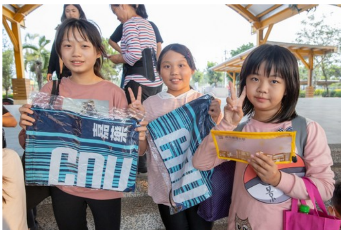
透過闖關遊戲開心獲得嘉藥禮品的小朋友