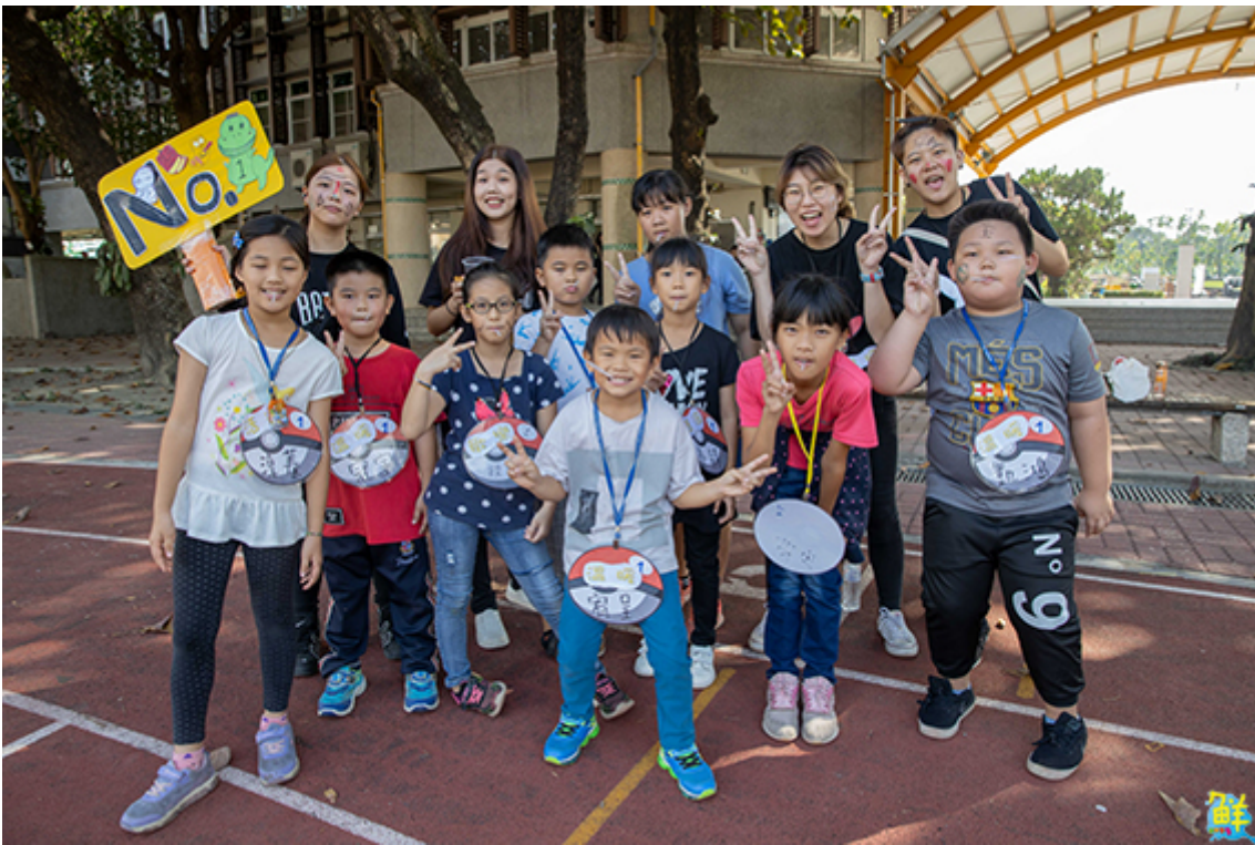
▲嘉藥學生會及議會利用假日到里港載興國小作偏鄉關懷。

施比受更有福！嘉南藥理大學學生會及議會同學趁著周末課餘時間，前往屏東縣里港鄉載興國小進行偏鄉關懷活動，帶給國小的弟弟妹妹們豐富互動遊戲與課程，載興國小校長王美玲除了感謝嘉藥學生到來外，也指出教育是「生命感動生命、生命影響生命」的歷程，透過大哥哥、大姐姐的陪伴，為小朋友提供孩子更多元活動及舞台。