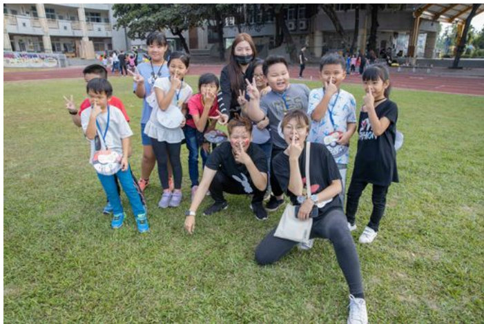
一整天的活動下來，嘉藥大學生與載興小學生培養出好感情