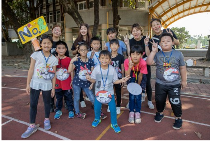
嘉藥學生會及議會利用假日到里港載興國小作偏鄉關懷