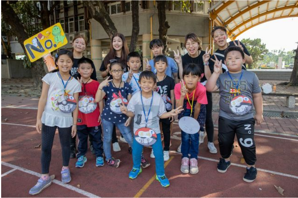
嘉藥學生會及議會利用假日到里港載興國小作偏鄉關懷。

http://www.cntimes.info 2019-11-25 20:23:55