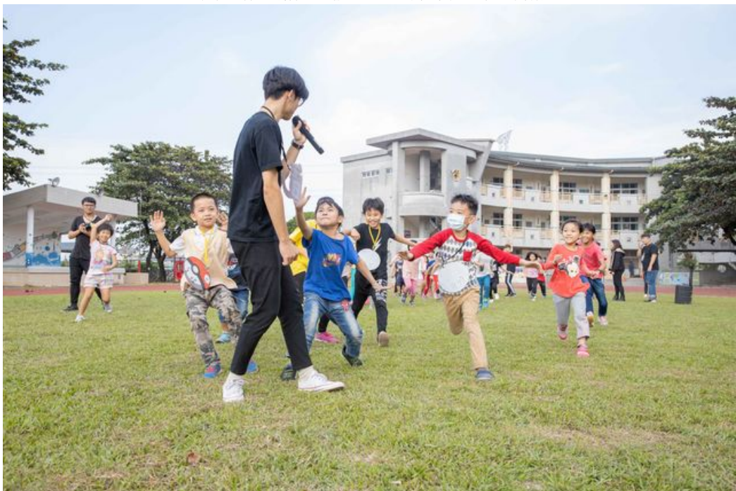
小朋友開心玩著123木頭人。

嘉南藥理大學學生會及議會同學趁著周末課餘時間，前往屏東縣里港鄉載興國小進行偏鄉關懷活動，帶給國小的弟弟妹妹們豐富互動遊戲與課程，整天活動中小朋友稚嫩的臉上掛滿了笑容，施比受更有福，嘉藥的大哥哥姐姐們也因為孩子天真的笑容，內心充滿了富足及溫暖。