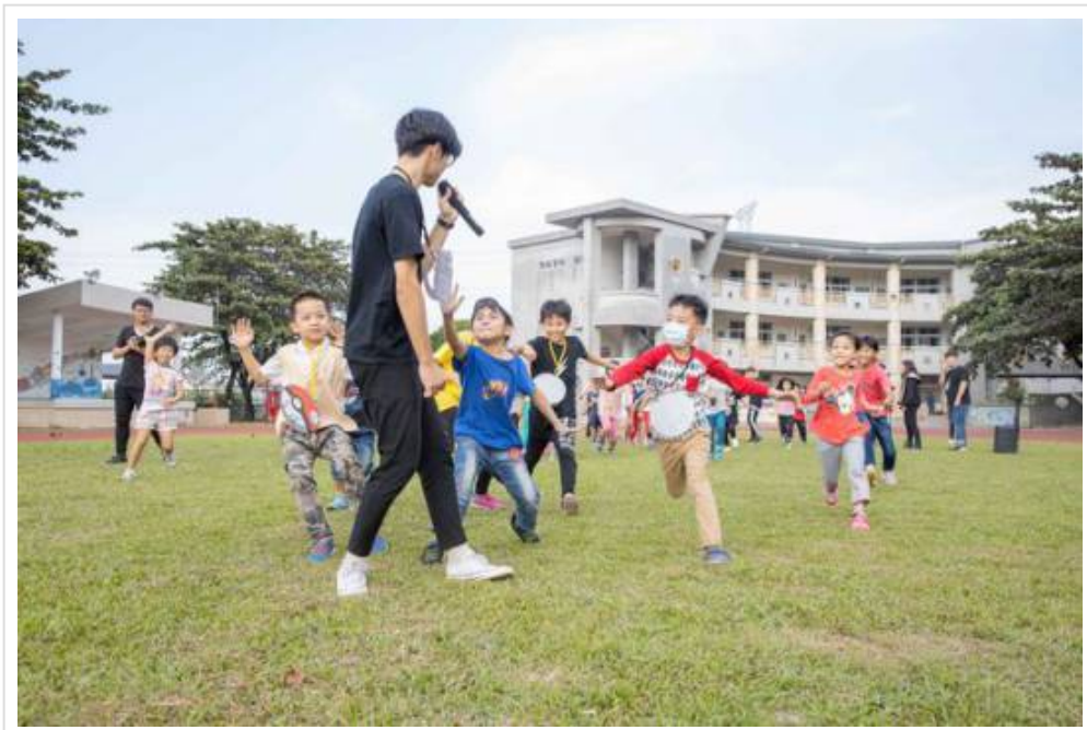
圖2：小朋友開心玩著123木頭人。