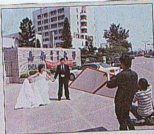
嘉南藥理科大災後多日清理逐步恢復往日校園景觀，校園又可見校友與附近民眾拍攝婚紗照。

淹大水，校方統計，嘉南科大損失4億5000萬元、崑山科大2億元、中華醫大1億5000萬元，中華醫大延後一周開學。