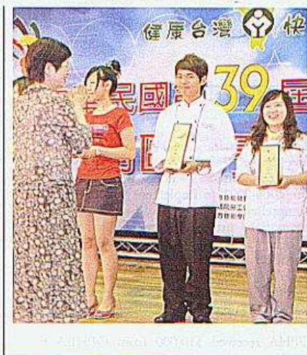
【圖一】嘉南藥理科技大學藥劑系學生在「健康台灣」活動中，由嘉南藥理科技大學藥劑系教授頒發證書給獲獎學生。

嘉南藥理科技大學藥劑系教授在頒獎典禮上致詞，勉勵獲獎學生在專業領域中不斷學習，為社會大眾提供優質服務。