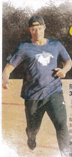
陳偉殷連吞4個壘包得分。