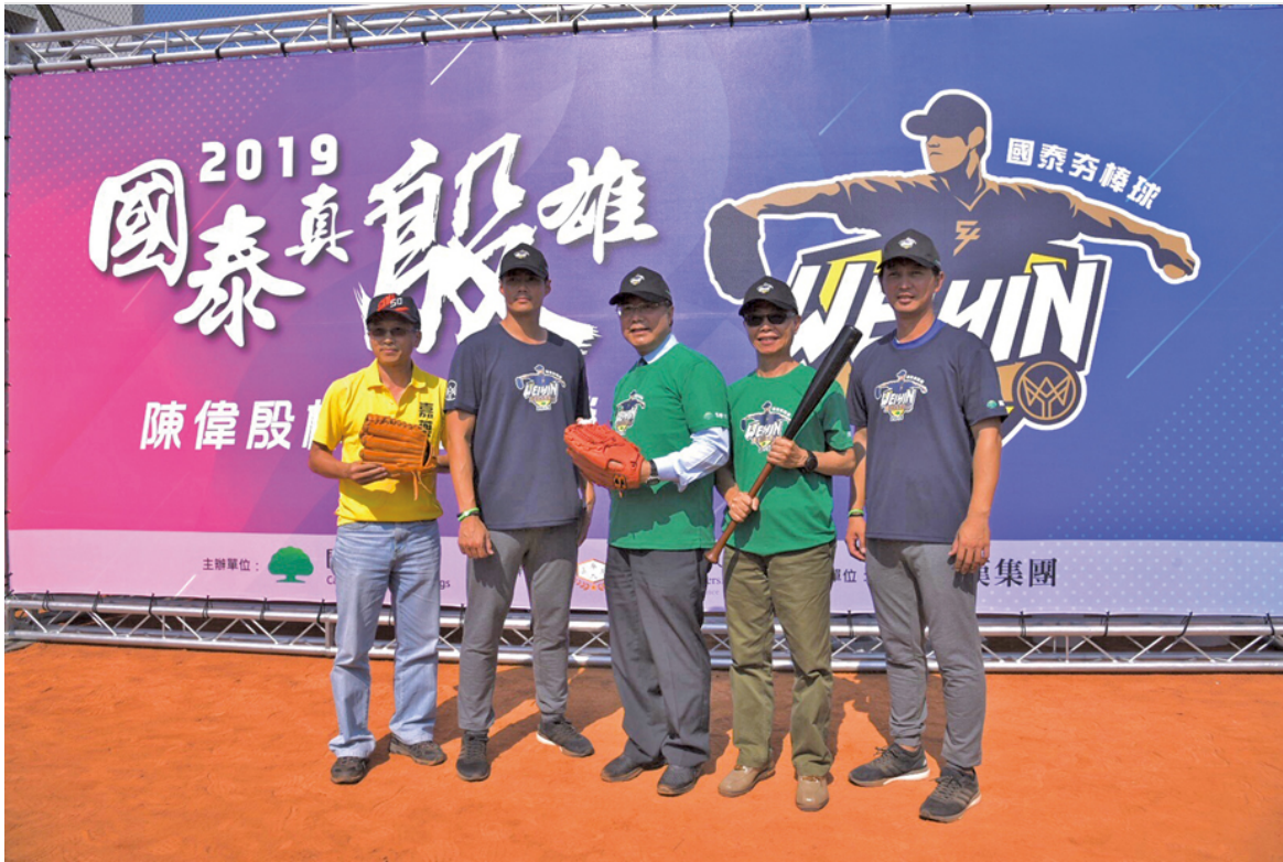
第八屆「國泰真殷雄 陳偉殷棒球訓練營」在嘉藥開訓。