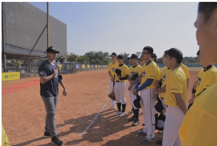
陳偉殷勉勵球員有問題勇於發問才能學到更多技巧