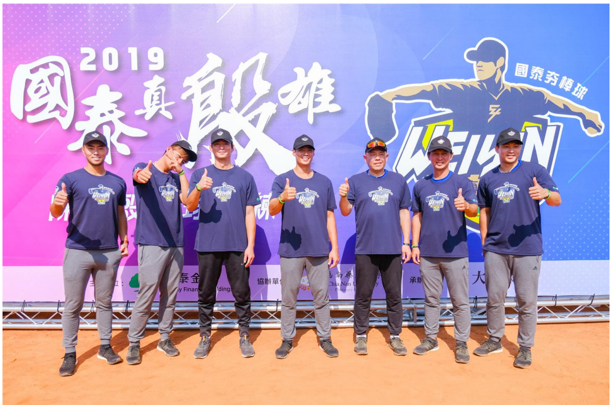
陳偉殷率領跨國教練團指導來自雲嘉南10所大專院校球員。