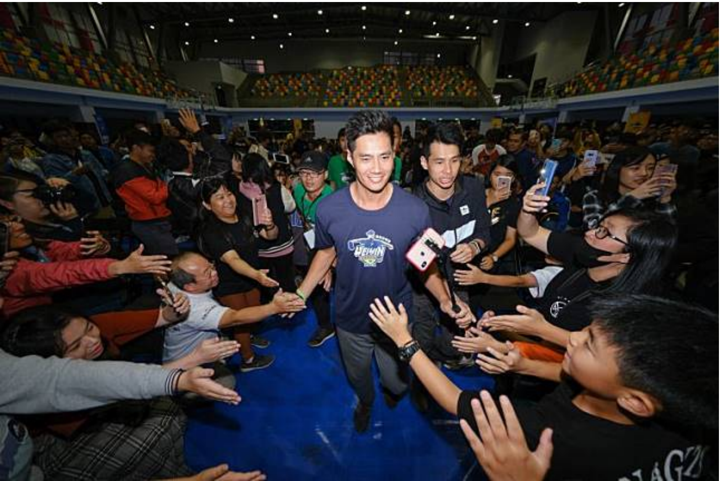
球迷會上陳偉殷受到粉絲熱烈歡迎。大會提供

本次「國泰真殷雄 陳偉殷棒球訓練營」學員組成除去年保留名額新竹明星科大外，包括台南大學、嘉義大學、中正大學、崑山科大、南台科大、南華大學、長榮大學、成功大學以及地主嘉藥大學十所大專院校。陳偉殷在訓練學員時不斷強調：「短短2天希望能看到學員努力去學自己想要的，不要怕問問題，只要敢發問，教練團都會有問必答。」同時，陳偉殷也特別感謝國泰金控長期幫忙，讓他每年有機會回饋不同縣市的學生，將更多人認識棒球。