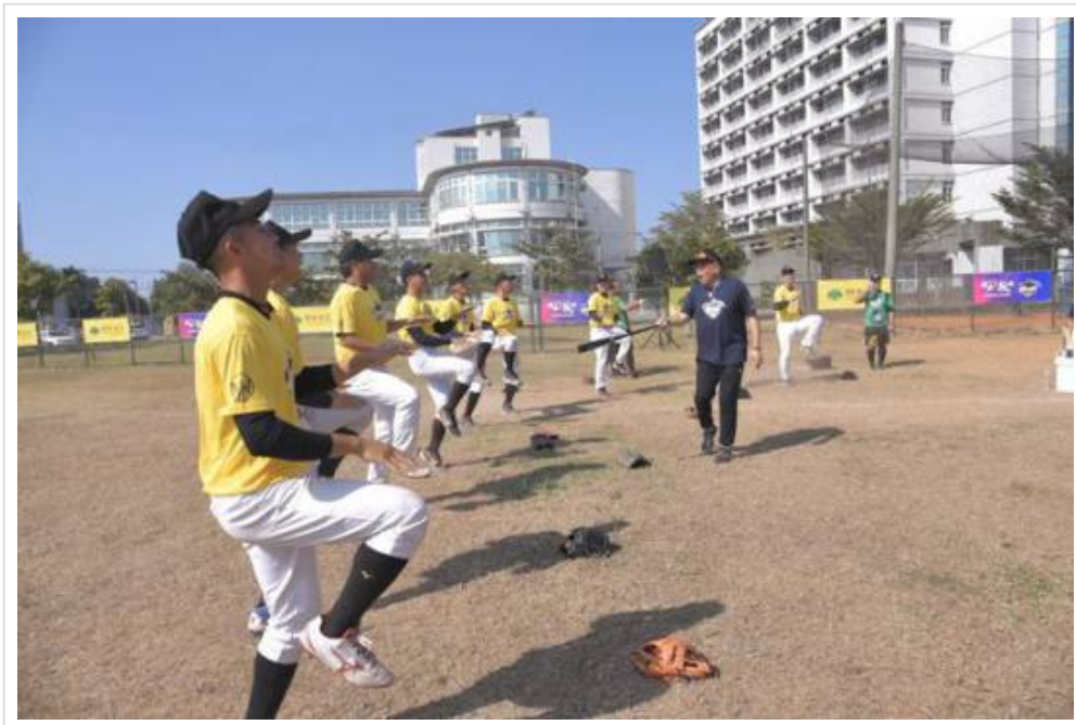
圖3：嘉藥副校長廖志祥代表學校歡迎陳偉殷蒞臨。