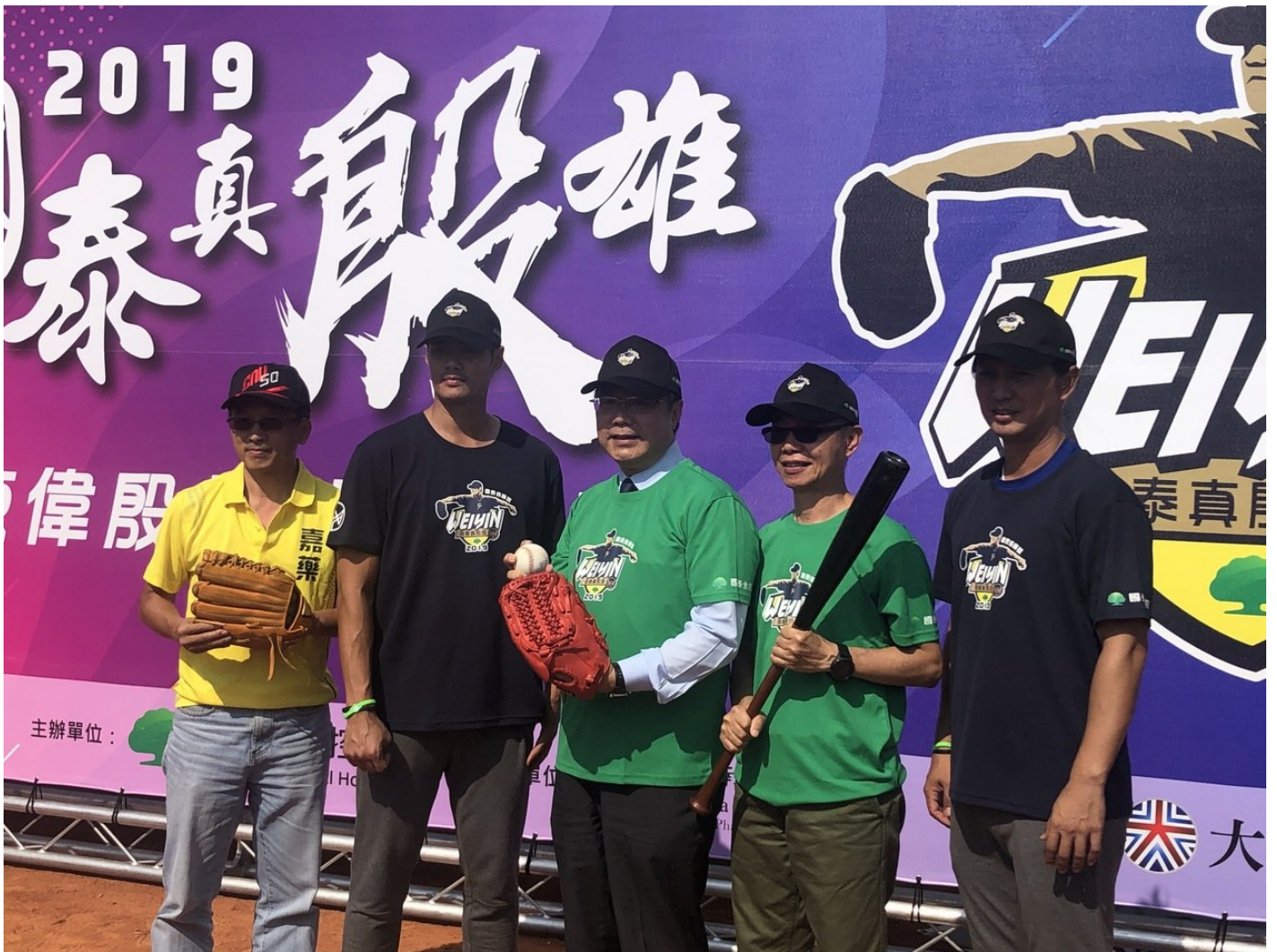
一年一度的棒球界重頭戲「國泰真殷英雄 陳偉殷棒球訓練營」邁入第八屆，今（2019）年首度前進台南，今（30）日由國泰金和旅外美國大聯盟球星陳偉殷攜手七人跨國教練團，在嘉南藥理大學球場共同揭幕。