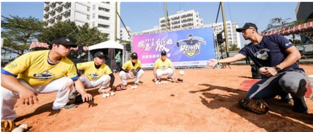
▲陳偉殷指導接球。

有趣的是，訓練空檔特別安排國泰當地的客戶帶著小朋友共同參加幼兒趣味棒球，難得看到陳偉殷和小小孩的趣味互動，為球場增添許多精彩畫面。