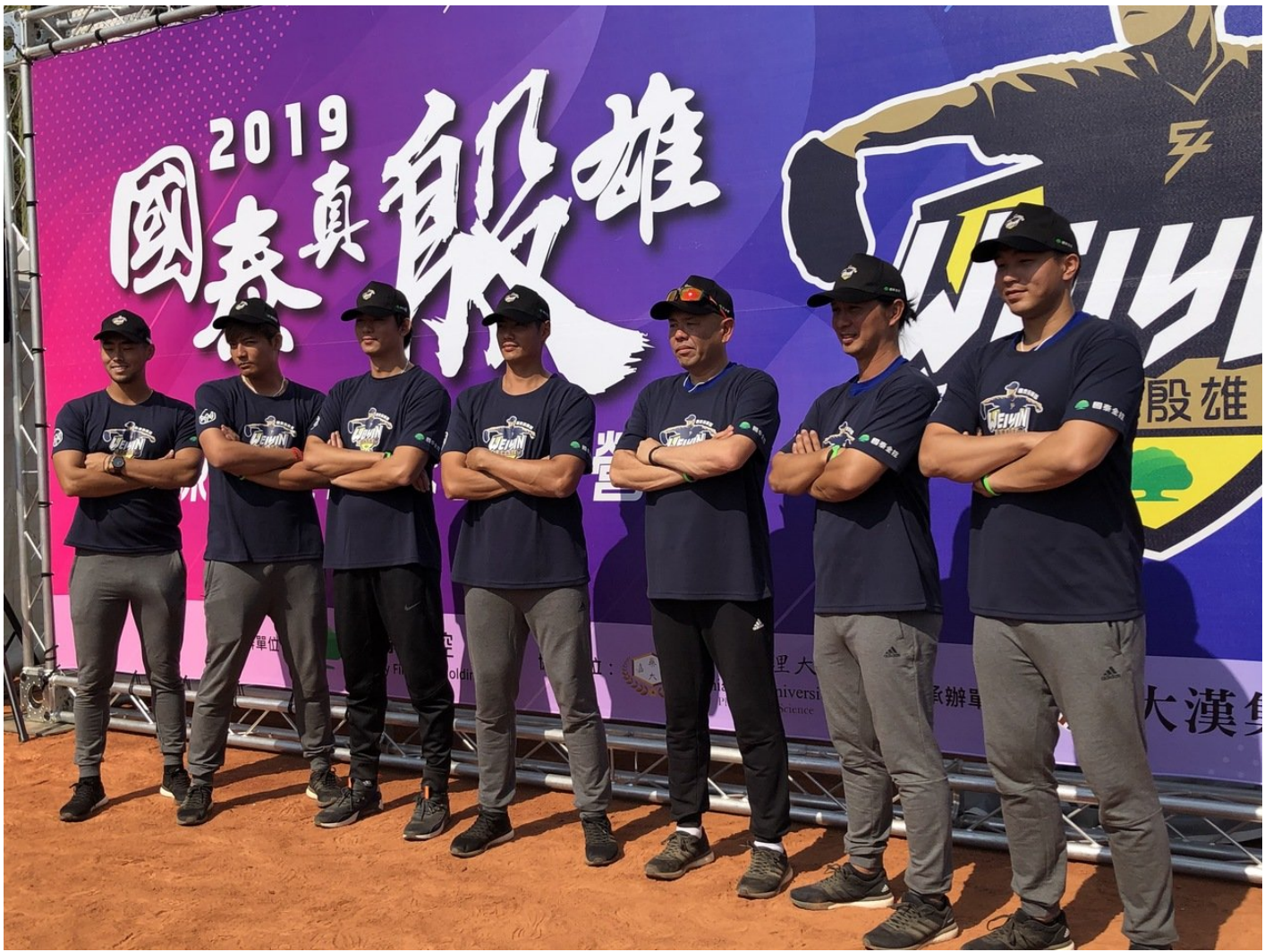
一年一度的棒球界重頭戲「國泰真殷雄 陳偉殷棒球訓練營」邁入第八屆，今（2019）年首度前進台南，今（30）日由國泰金和旅外美國大聯盟球星陳偉殷攜手七人跨國教練團，在嘉南藥理大學球場共同揭幕。