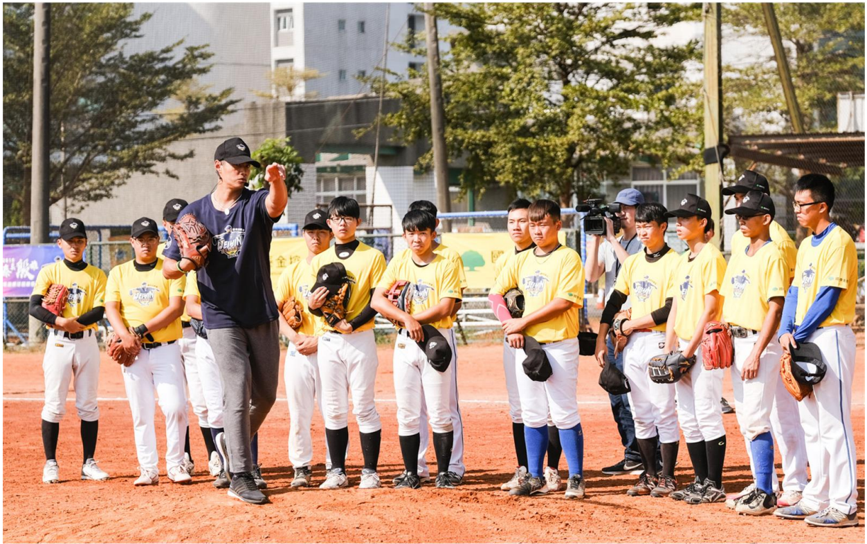
陳偉殷頂著南臺灣大太陽認真指導國泰棒球營學員。