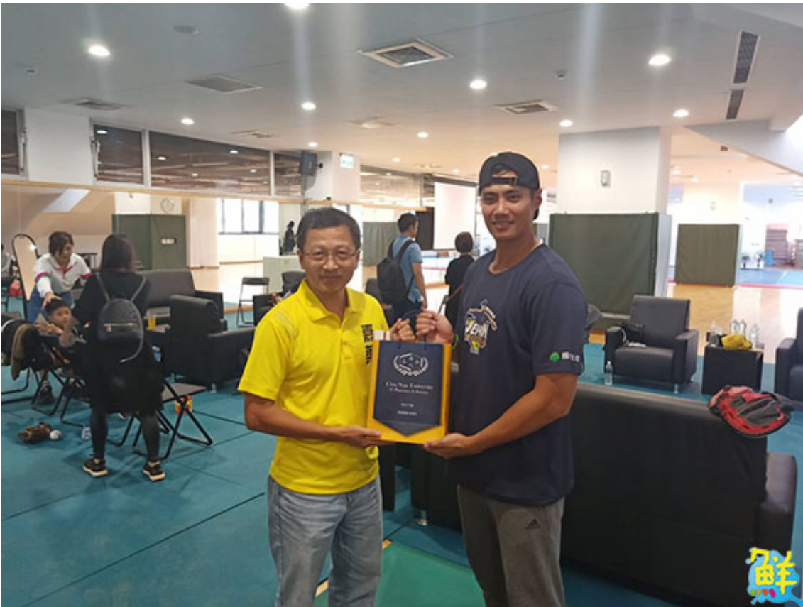
▲嘉藥副校長廖志祥(左)代表學校歡迎陳偉殷(右)蒞臨，並希望學員藉由兩天訓練營能研習到精實的棒球攻略。

今年的訓練營再次邀請各界棒壇菁英擔任教練團，兩天課程利用嘉藥棒球場、紹宗體育館及健身中心的設備分成室內外，並新增如重訓、營養學、運動防護與AI科技等項目，讓球員不再只學球技，更能接觸有關棒球的不同面向。