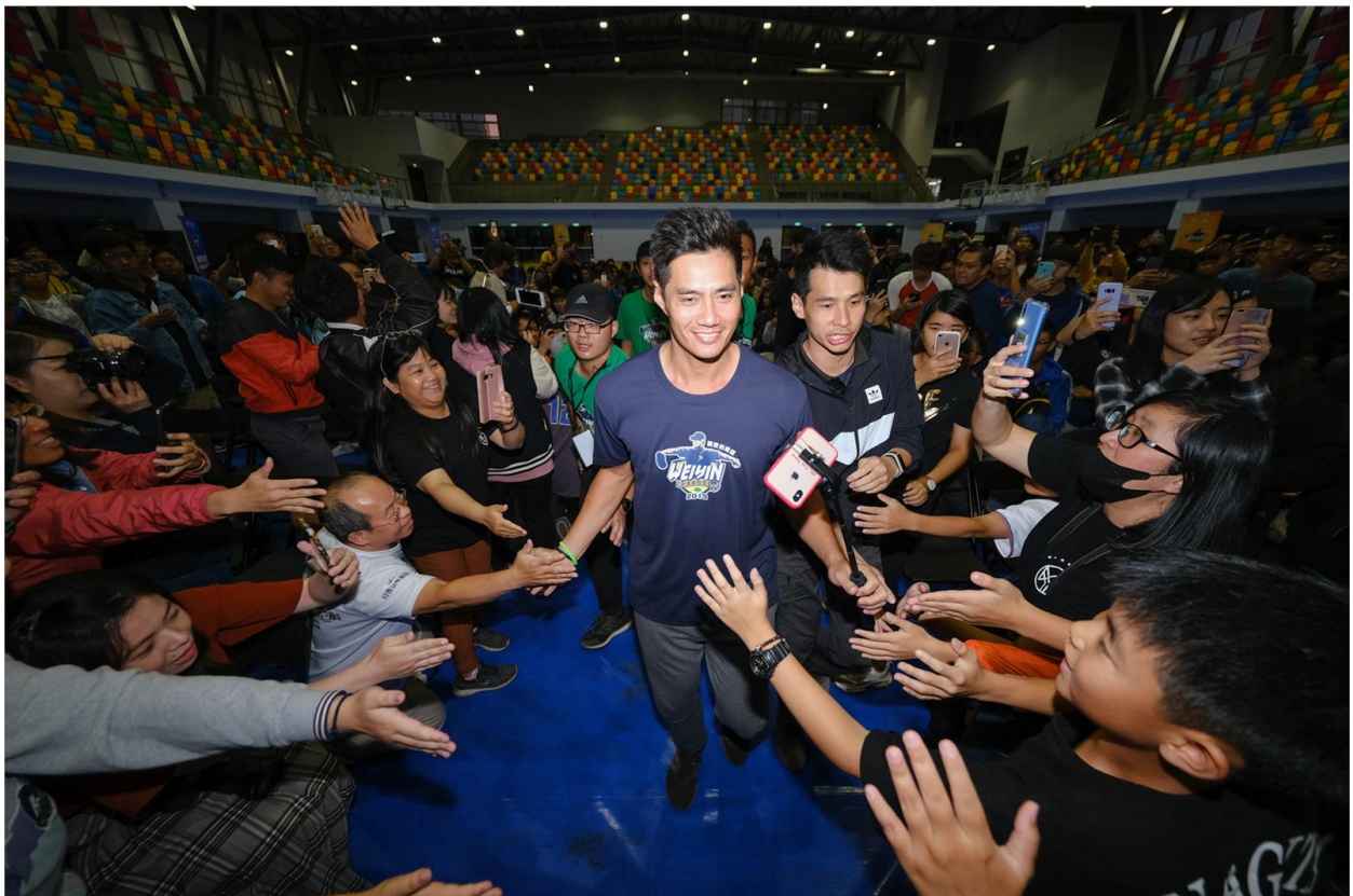
球迷見面會上陳偉殷受到粉絲熱烈歡迎。