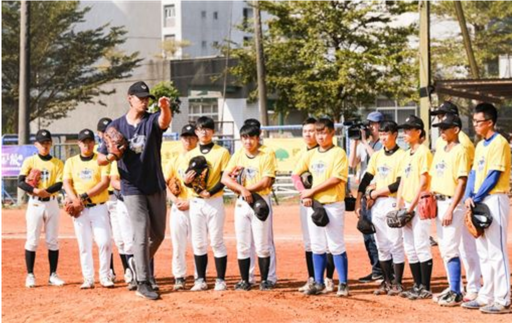
▲陳偉殷訓練營指導乙組選手。

國泰金控贊助美國職棒台灣左投陳偉殷棒球營30日前進台南嘉南藥理大學，邀請南部10所大專院校棒球隊學生參加，陳偉殷親自指導乙組選手，給予正確棒球觀念與避免受傷。2019年美職選秀會第14輪獲得亞歷桑納響尾蛇挑選的台灣捕手林家正，這次也擔任客座指導。