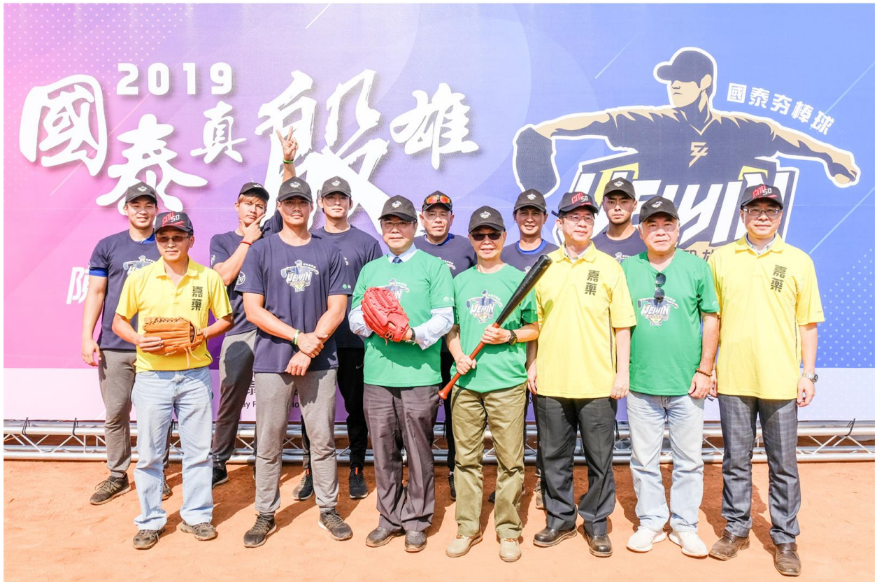
由陳偉殷擔任總教練的2019「國泰真殷雄 陳偉殷棒球訓練營」在嘉南藥理大學揭開序幕。