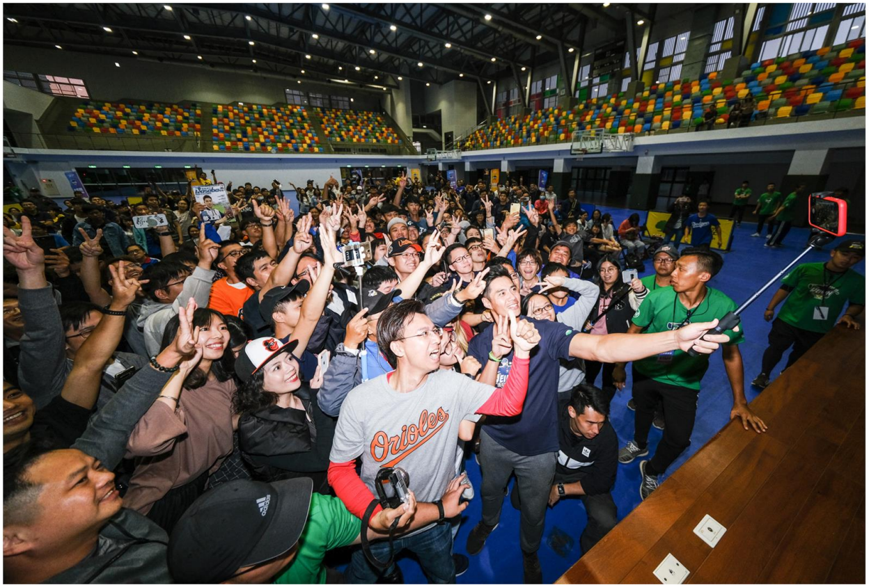
陳偉殷在球迷見面會上與粉絲開心玩自拍。