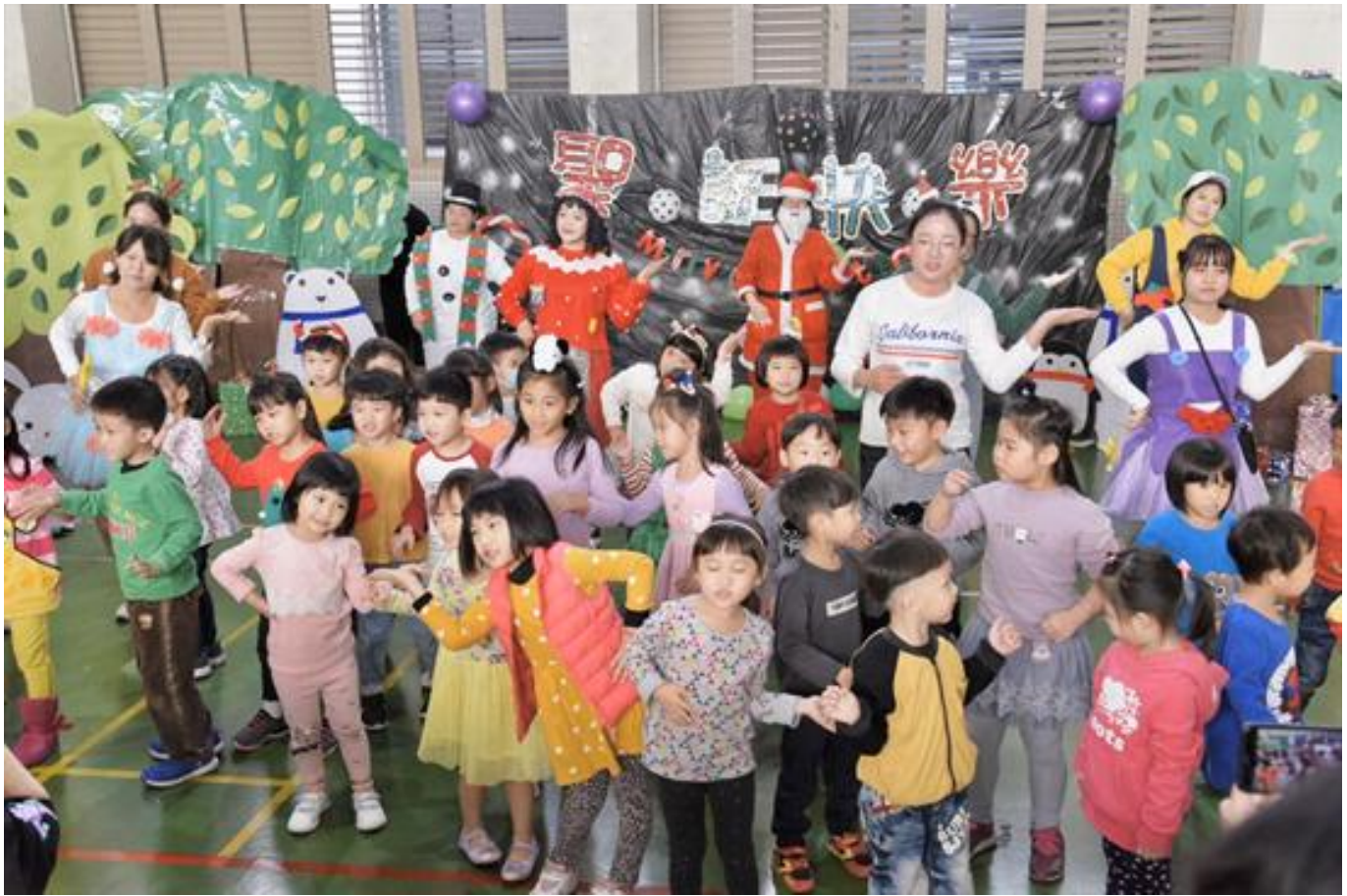
嘉藥 新一代親子戲劇 - 麋鹿巧巧放假去登場

(中央社訊息服務20191223 09:27:29)嘉南藥理大學嬰幼兒保育系學生於21日上午舉辦一場融合戲劇、音樂律動及親子遊戲的畢業成果展，吸引近300多位社區幼兒及家長前來參加，在暖暖冬陽下欣賞歡樂的親子互動戲劇，提前感受嘉藥幼保系學生帶來的聖誕溫馨氣氛！