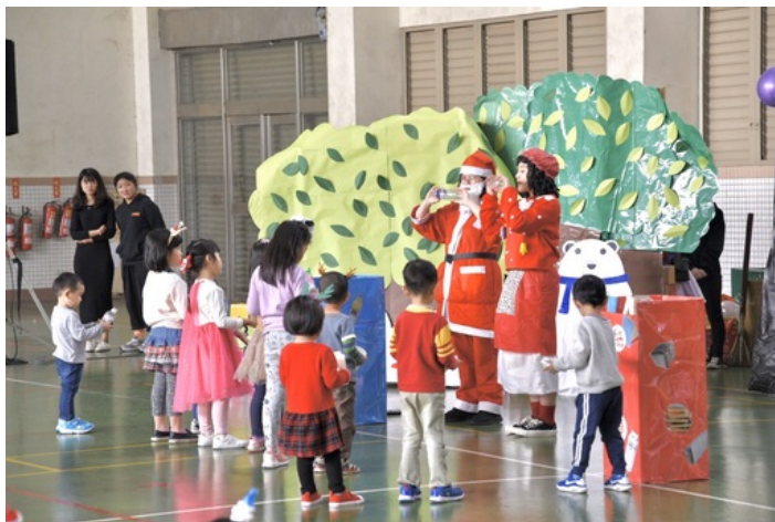
透過聖誕活動，教導小朋友資源回收概念