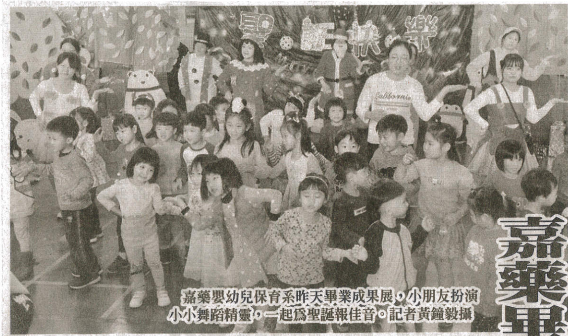
嘉藥嬰幼兒保育系昨天畢業成果展，小朋友扮演小小舞蹈精靈，一起為聖誕報佳音。