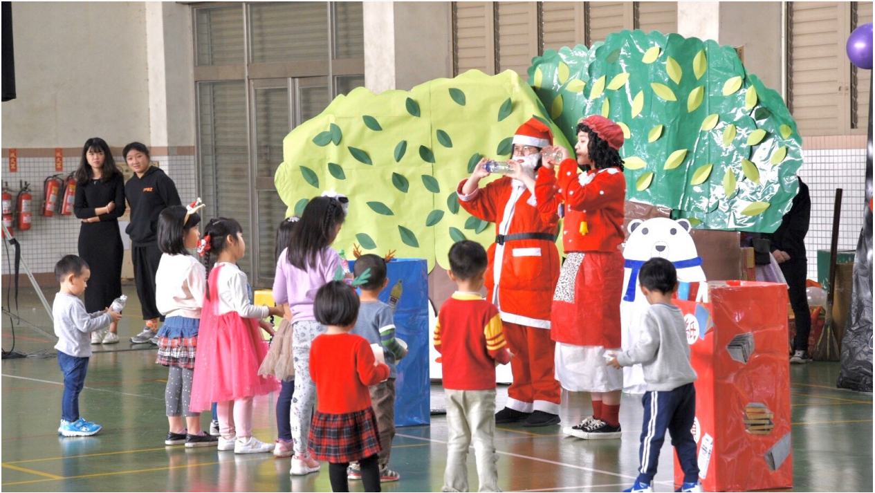
透過聖誕活動，教導小朋友資源回收概念【圖/翻攝畫面】

除結合幼兒參與戲劇演出外，本次活動嘉藥幼保系首次挑戰以「親子互動」為主軸，分別設計培養幼兒環保意識的遊戲，讓父母與幼兒一同做資源回收分類及垃圾減量，第二個遊戲「圈圈叉叉」則是增進幼兒「聽與理解」事物的能力；第三及第四個遊戲需要親子合力完成的「套住你套住我」和「同心協力一起送寶藏」，期盼透過陪伴孩子玩耍增進親子感情，也在聖誕節前夕留下不一樣的回憶。