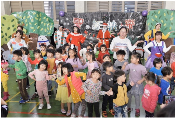
現場小朋友扮演小小舞蹈精靈，一起為聖誕報佳音