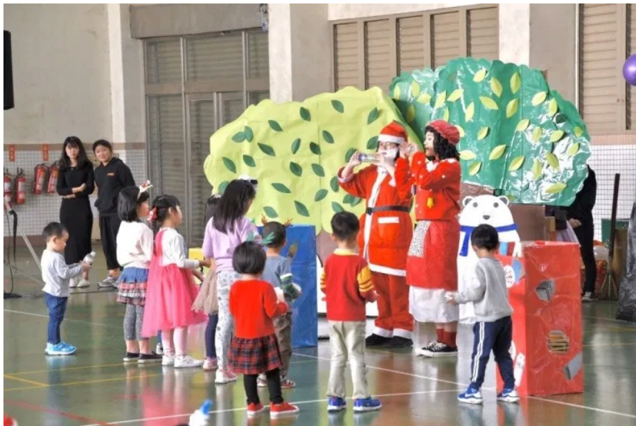
透過聖誕活動，教導小朋友資源回收概念

以「麋鹿巧巧放假去」為題，本次戲劇以嘉藥幼兒園為舞台，特別邀請現場小朋友參與演出，扮演「小小舞蹈精靈」上台為聖誕來臨報佳音，再與麋鹿巧巧一起舞蹈，迎接麋鹿來到森林中玩耍；最後幼兒園小朋友以自編的舞蹈，歡送麋鹿巧巧和聖誕老公公回家，駕著雪橇為小朋友送禮物！