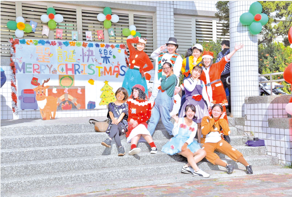
嘉南藥理大學嬰幼兒保育系學生創意設計親子劇。