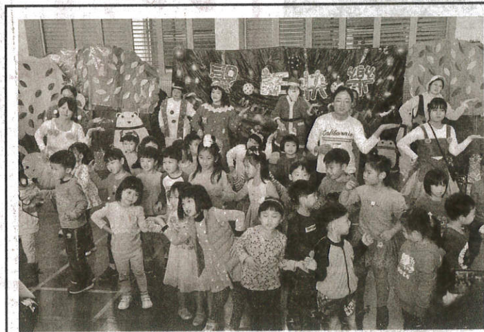
現場小朋友扮演小小舞蹈精靈，一起為聖誕報佳音。