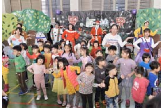
現場小朋友扮演小小舞蹈精靈，一起為聖誕報佳音。

【記者孫宜秋／南市報導】嘉南藥理大學嬰幼兒保育系學生於21日上午舉辦一場融合戲劇、音樂律動及親子遊戲的畢業成果展，吸引近300多位社區幼兒及家長前來參加，在暖暖冬陽下欣賞歡樂的親子互動戲劇，提前感受嘉藥幼保系學生帶來的聖誕溫馨氣氛！