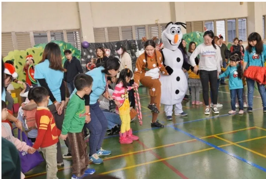
利用呼拉圈傳遞遊戲，訓練小朋友大肌肉發展【圖/翻攝畫面】

嘉南藥理大學嬰幼兒保育系學生於21日上午舉辦一場融合戲劇、音樂律動及親子遊戲的畢業成果展，吸引近300多位社區幼兒及家長前來參加，在暖暖冬陽下欣賞歡樂的親子互動戲劇，提前感受嘉藥幼保系學生帶來的聖誕溫馨氣氛！