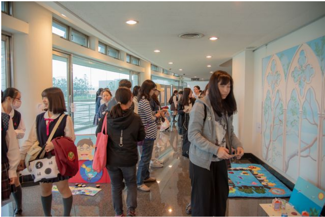
嘉藥舉辦教玩具競賽吸引56所高中職生同台競技。

第11屆「全國兒童教玩具競賽暨應用研習」日前於嘉南藥理大學隆重登場，主要在激勵幼保科學生發揮所學，製作兼具原創、實用及教育性的教玩具，極富競賽性與教育意義，今年競爭激烈共有高中職校56件作品、200餘人同台競技，最後由屏東高中、樹德家商及三民家商分居第1、2、3名，三民家商、復華中學拿下創意獎，而光華高中、嘉義家職、三信家商及臺中家商等校則獲得佳作。