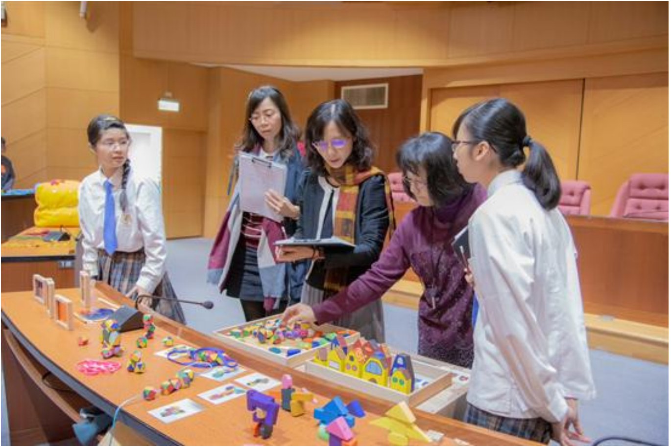
教保高手秀巧思，齊聚嘉藥比創意

(中央社訊息服務20191231 09:45:38)第11屆「全國兒童教玩具競賽暨應用研習」日前於嘉南藥理大學隆重登場，主要在激勵幼保科學生發揮所學，製作兼具原創、實用及教育性的教玩具，極富競賽性與教育意義，今年競爭激烈共有高中職校56件作品、200餘人同台競技，最後由屏榮高中、樹德家商及三民家商分居第一、二、三名，三民家商、復華中學拿下創意獎，而光華高中、嘉義家職、三信家商及臺中家商等校則獲得佳作。