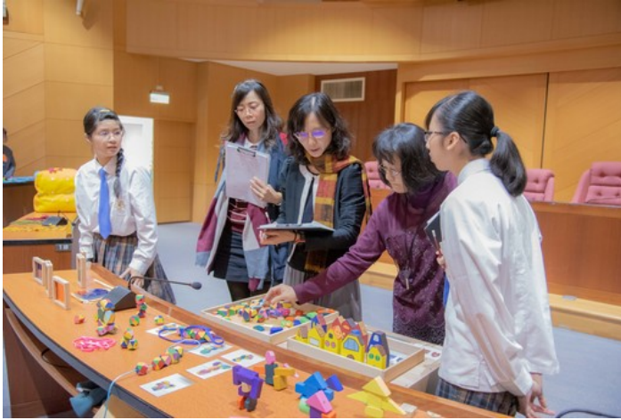
參賽選手一一向評審說明設計理念