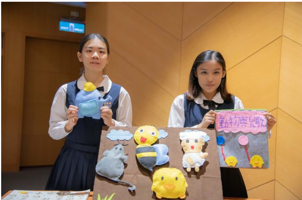
豐富多元的教玩具設計競賽，展現高中職生絕佳創意。