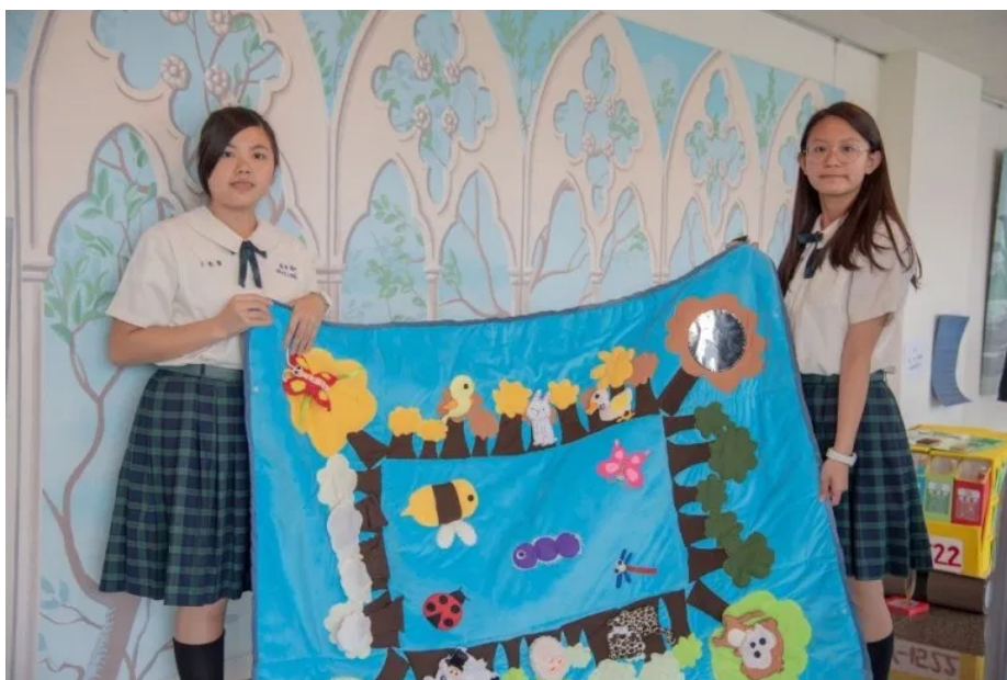
嘉藥舉辦全國兒童教玩具競賽第一名由屏東高中獲得

本次競賽研習活動包含了教玩具觀摩、桌遊操作及幼兒戲劇研習，希望透過競賽交流與研習，提升學生實務專題能力；成績評量方面，為回應幼保現場教學需求，每位參賽者除設計教具外，皆須當場說明參賽作品的設計理念與玩法，並回答評審委員提問，以展現參賽者口述表達與操作互動能力，每位參賽學生無不卯盡全力，爭取優異成績。