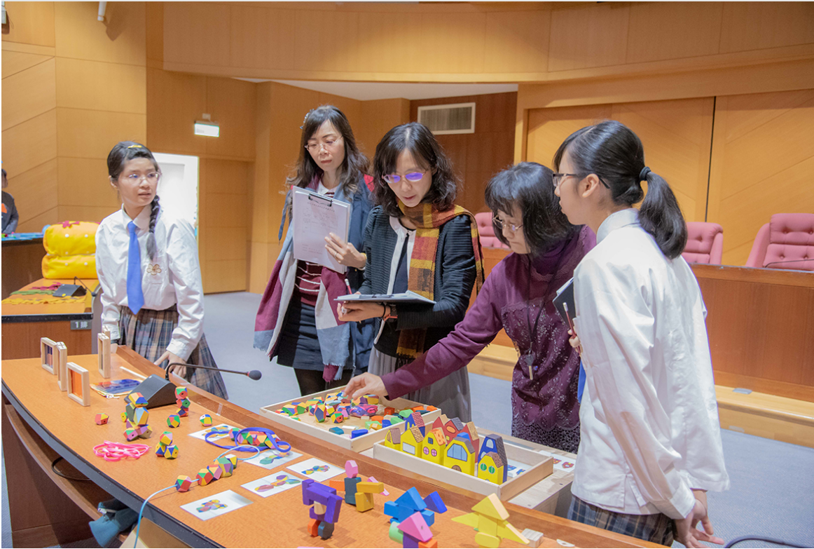
嘉南藥理大學舉辦第11屆全國兒童教玩具競賽現場。