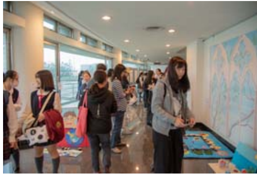
嘉藥舉辦教玩具競賽吸引56所高中職生同台競技。

【記者孫宜秋／南市報導】第11屆「全國兒童教玩具競賽暨應用研習」日前於嘉南藥理大學隆重登場，主要在激勵幼保科學生發揮所學，製作兼具原創、實用及教育性的教玩具，極富競賽性與教育意義，今年競爭激烈共有高中職校56件作品、200餘人同台競技，最後由屏榮高中、樹德家商