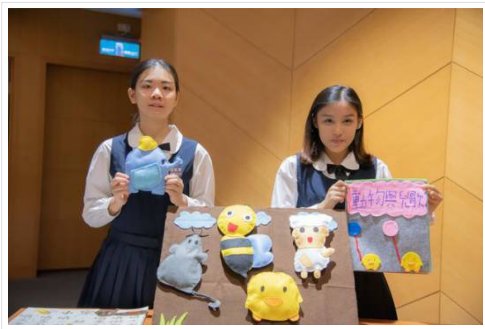
圖3：嘉藥舉辦教玩具競賽吸引56所高中職生同台競技。