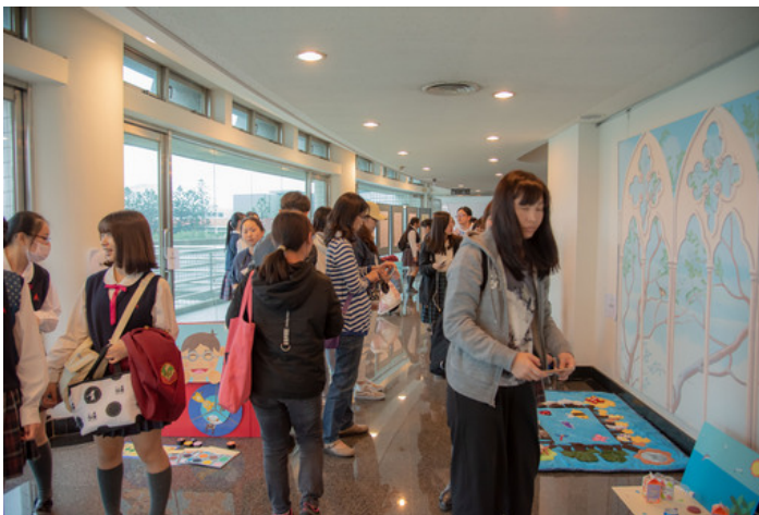
嘉藥舉辦教玩具競賽吸引56所高中職生同台競技