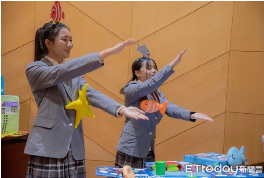
▲第11屆「全國兒童教玩具競賽暨應用研習」，於嘉南藥理大學隆重登場。