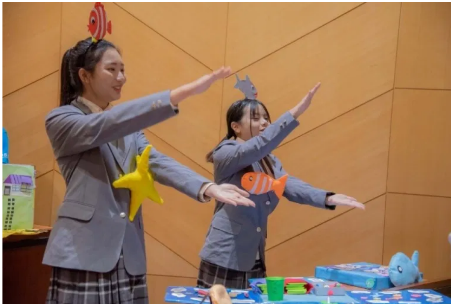
同學手舞足蹈創作教具加說明，吸引評審目光

第11屆「全國兒童教玩具競賽暨應用研習」日前於嘉南藥理大學隆重登場，主要在激勵幼保科學生發揮所學，製作兼具原創、實用及教育性的教玩具，極富競賽性與教育意義，今年競爭激烈共有高中職校56件作品、200餘人同台競技，最後由屏東高中、樹德家商及三民家商分居第一、二、三名，三民家商、復華中學拿下創意獎，而光華高中、嘉義家職、三信家商及臺中家商等校則獲得佳作。