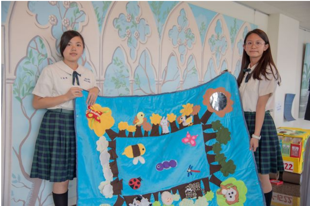
嘉藥舉辦全國兒童教玩具競賽第一名由屏榮高中獲得。

http://www.cntimes.info 2019-12-30 19:48:41