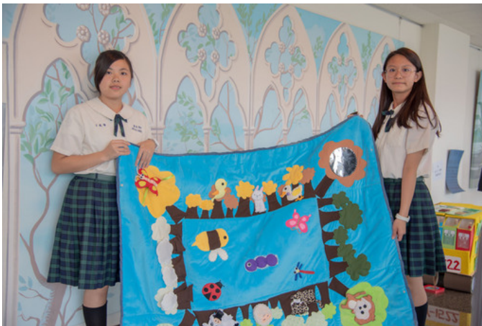
嘉藥舉辦全國兒童教玩具競賽第一名由屏榮高中獲得