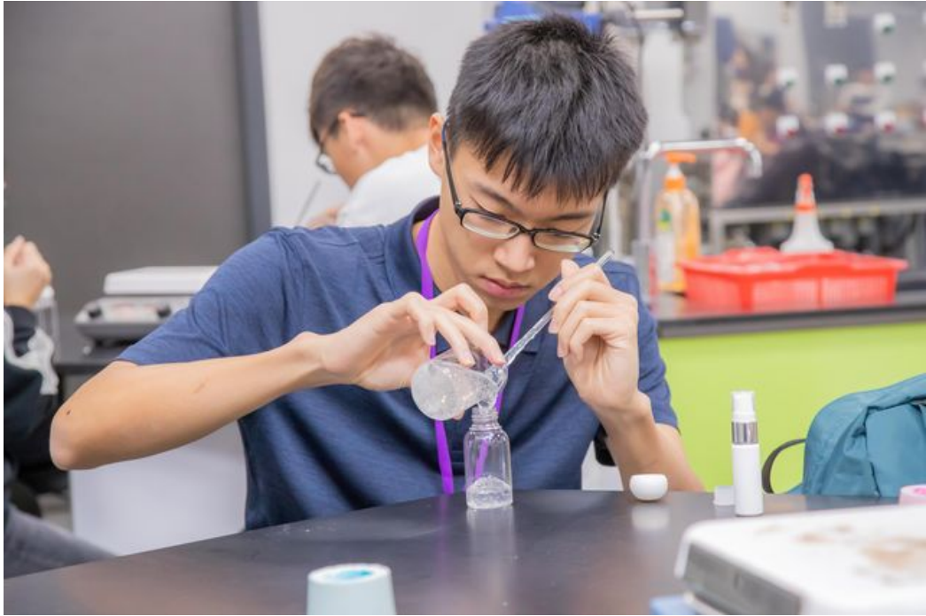
完成乾洗手製作後學員小心翼翼的裝瓶。

http://www.cntimes.info 2020-02-06 19:37:48