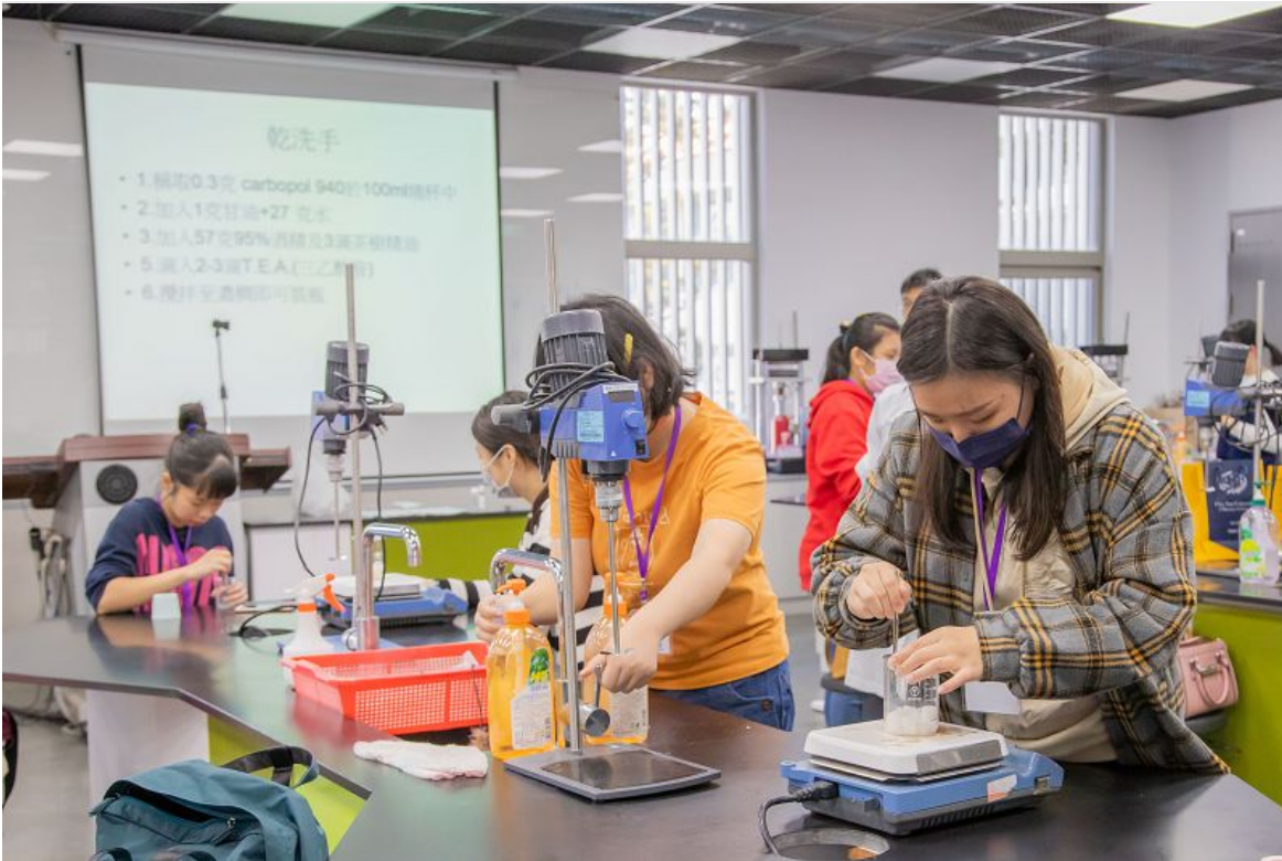
嘉南藥理大學化粧品研習營活動加強防疫宣導。