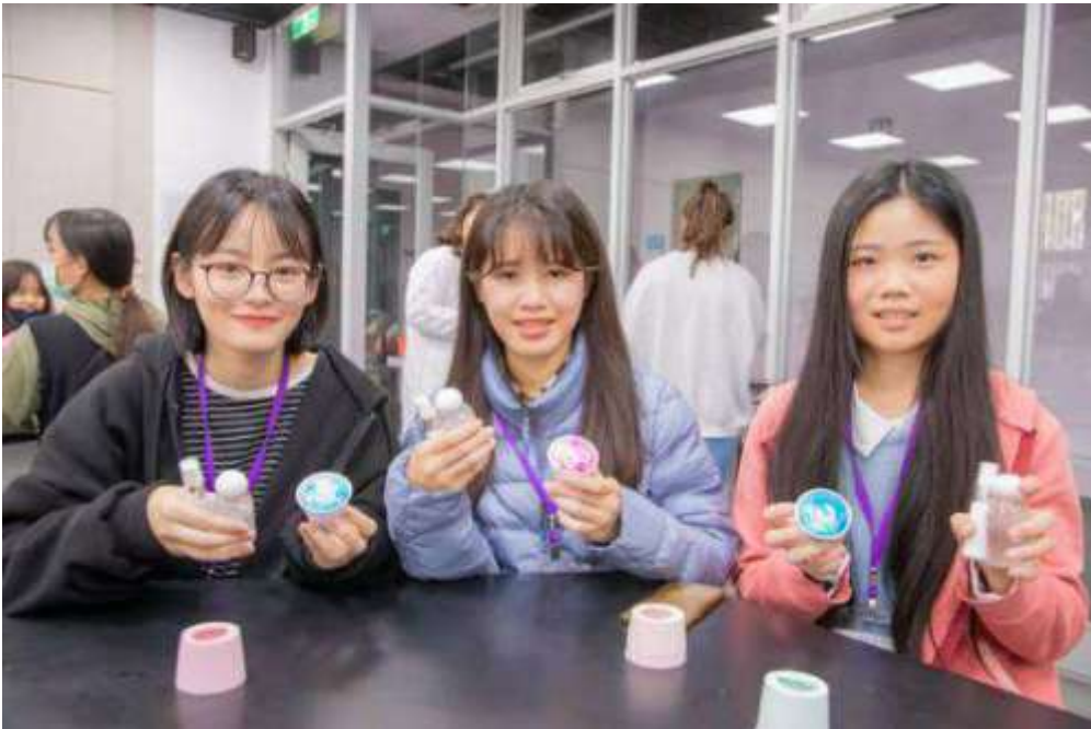
圖3：嘉藥粧品系汪老師帶領學員們完成手工皂及乾洗手製作。