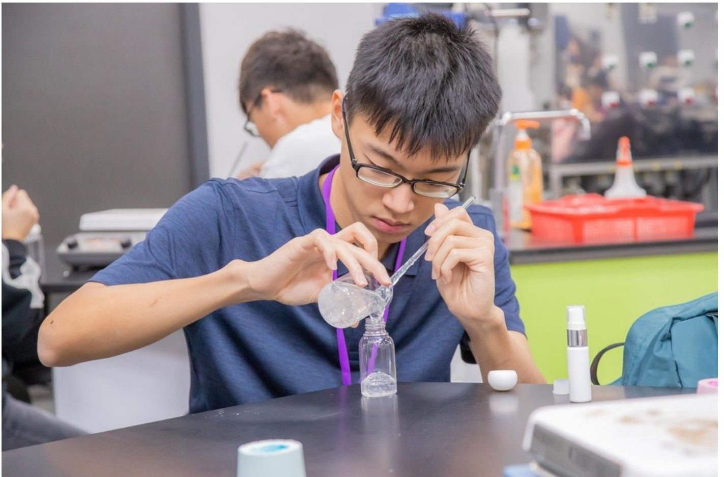
完成乾洗手製作後學員小心翼翼的裝瓶。

參與同學來自北中南各個高中，有些是呼朋引伴三五好友一起來，也有單槍匹馬隻身從台北南下的，上午課程鎖定化粧品原理介紹、產業趨勢分析的理論課程，下午則是化粧品實作的部分，因應武漢肺炎的疫情，也特別加入殺菌乾洗手的製作，參與同學專注又開心調製著自己喜愛的化粧品，覺得非常有趣又學到許多實用東西，來自台北的許同學說雖然就讀普通高中，但是對化粧品產業非常有興趣，希望透過這次營隊確認自己的志向，這次經驗也讓她考慮把技職體系及粧品系納入未來升學選項當中。