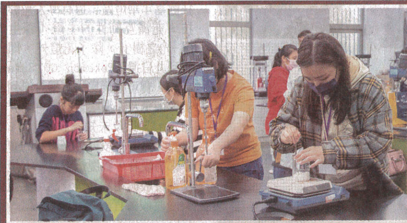
嘉南藥理大學化粧品研習營 活動加強防疫宣導。