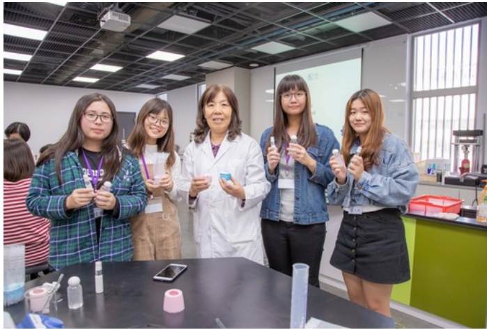
嘉藥粧品系汪老師帶領學員們完成手工皂及乾洗手製作