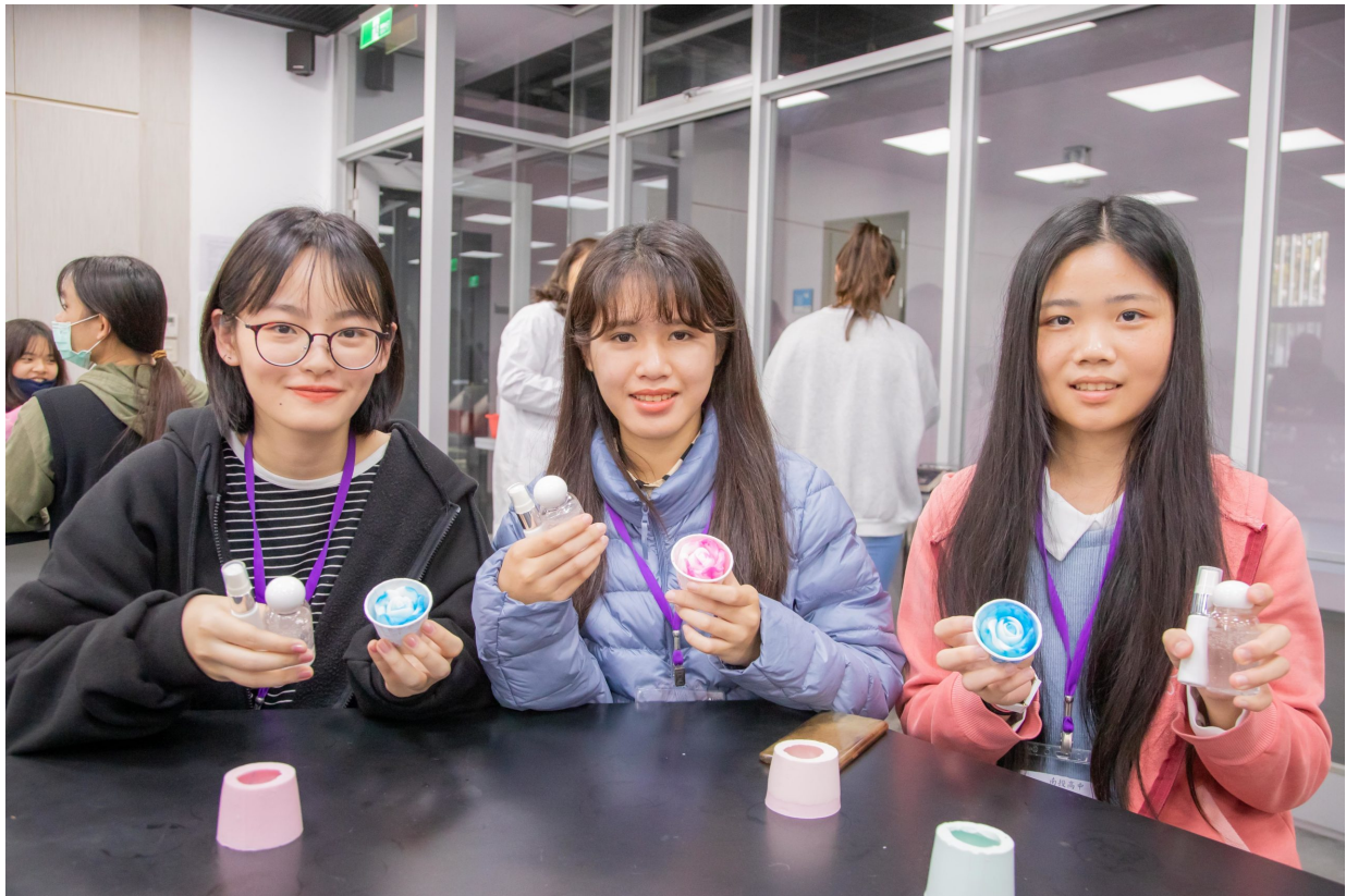
來自台北的許同學(左)特地南下參加研習營確定自己的志向