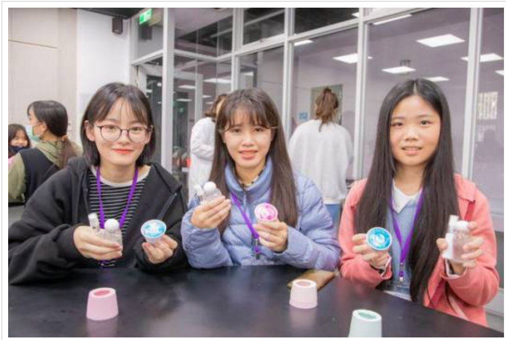
圖3：嘉藥粧品系汪老師帶領學員們完成手工皂及乾洗手製作。