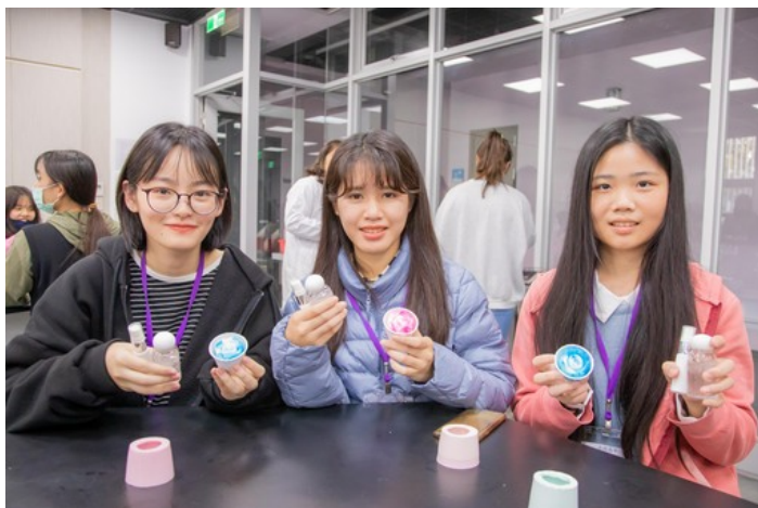
來自台北的許同學(左)特地南下參加研習營確定自己的志向