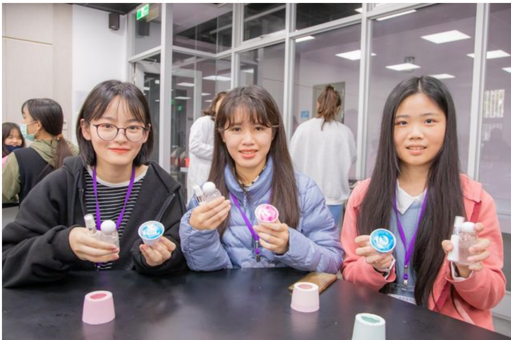
來自台北的許同學(左)特地南下參加研習營確定自己的志向。