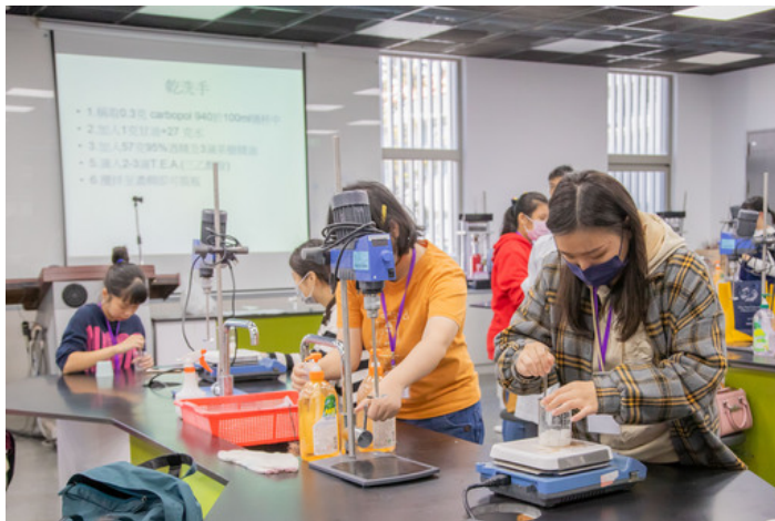
參與學員專心製作手工皂