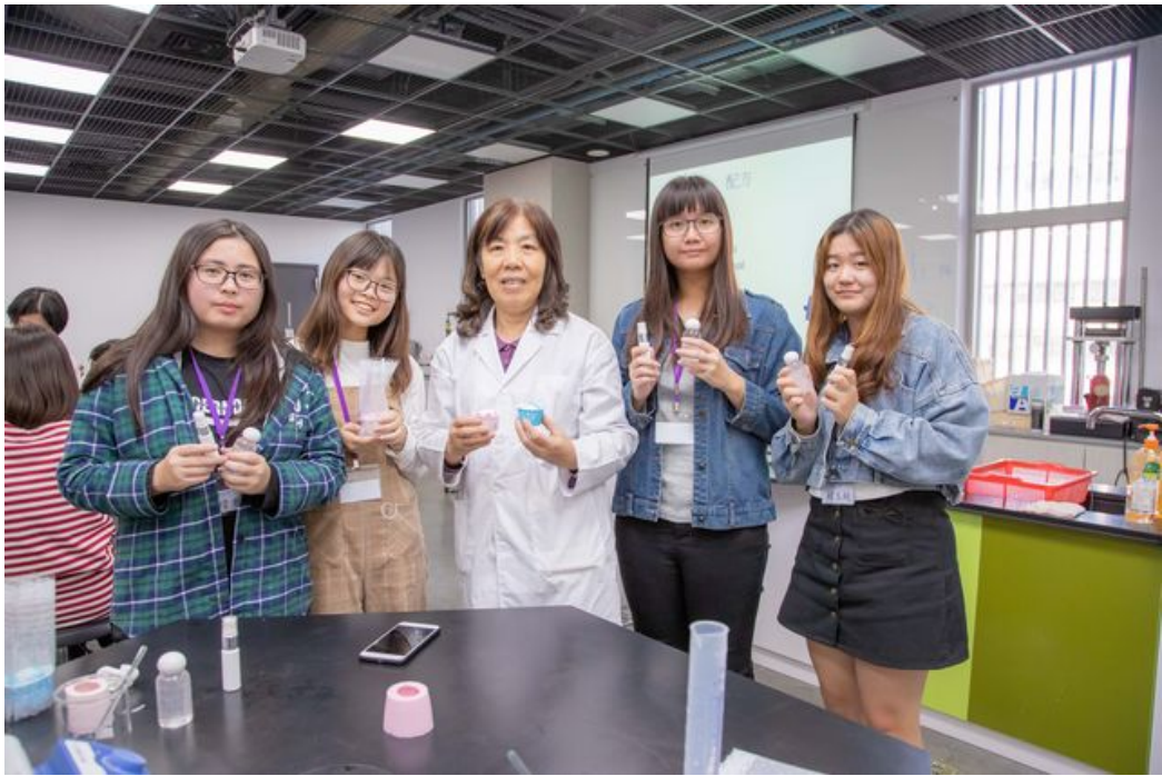
嘉藥粧品系汪老師帶領學員們完成手工皂及乾洗手製作。

為了協助即將畢業的高中學子了解化粧品產業與職涯探索，嘉南藥理大學化粧品應用與管理系特別趁著寒假期間，舉辦一日化粧品研習營，內容涵蓋化粧品原理介紹、產業趨勢分析及化粧品實作，吸引了來自全國各地的高三應屆畢業學生熱烈參加，除了原先排定的玫瑰花手工皂、天然潤膚乳製作外，因應武漢肺炎疫情的緊張情勢，特別加入殺菌乾洗手的製作，讓大家隨時能勤洗手，保護自己。