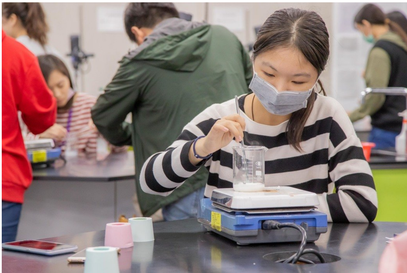
學員專心進行皂化的步驟。