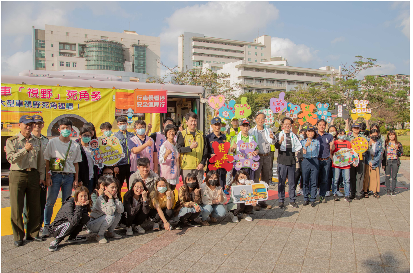
校長、學務長與在場進行互動式體驗活動師生合影。

活動現場安排一輛大型遊覽車當道具，由員警詳細說明包括砂石車、聯結車、大貨車、遊覽車等大型車在轉彎時易出現的「內輪差」，並在地上鋪設紅、黃顏色區塊，模擬實際道路情境，讓學生輪番登上大型車輛，親自查看左、右後照鏡，確認無法看見視野死角區域，讓體驗的學生都頗感驚訝，進而體認到一定要與大型車輛保持安全距離，否則就是與死神同行的距離。