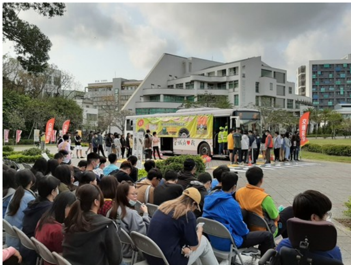
同學輪番上車體驗視野死角及照後鏡看不見盲區