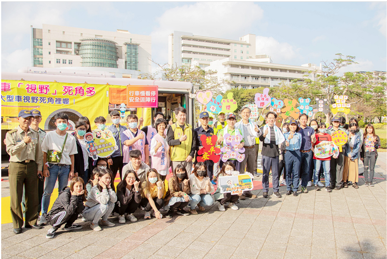
嘉南藥理大學在嘉南大道廣場舉辦交通安全週系列活動。