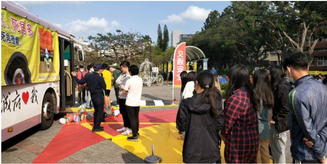
交警大隊莊組長講解視野死角及內輪差區域。

http://www.cntimes.info 2020-03-17 19:15:39