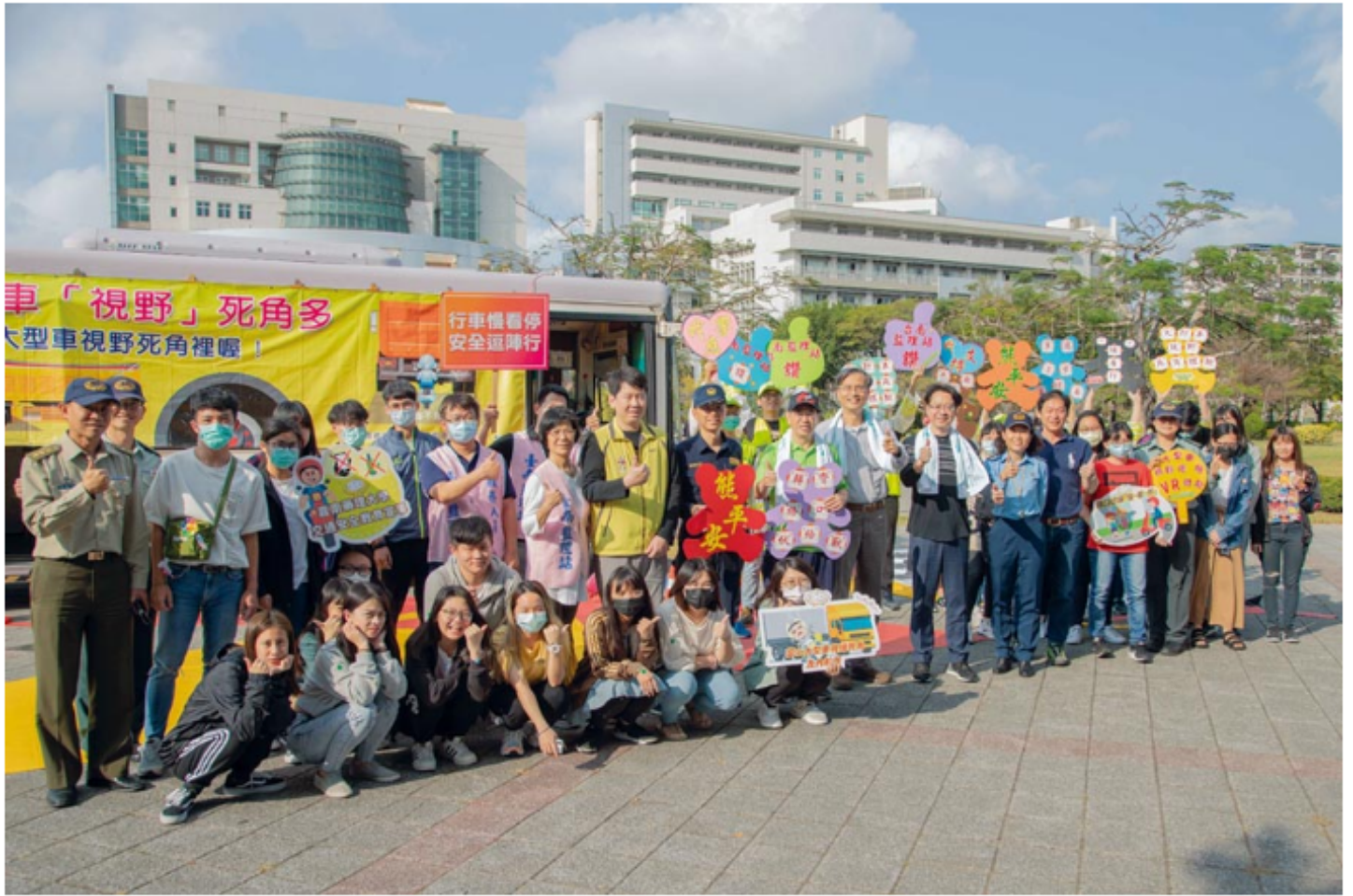
嘉藥辦理交通安全週系列活動。