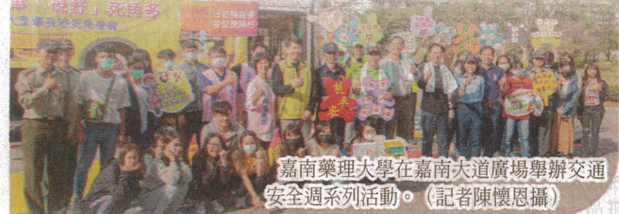
嘉南藥理大學在嘉南大道廣場舉辦交通安全週系列活動。

限制，並加強機車安全防護，以降低校外肇事率。監理站黃股長則提醒注意路線標誌標線、注意大型車輛內輪差及視野死角。