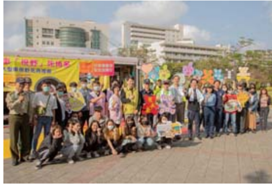
校長及學務長與在場進行互動式體驗活動師生合影。

【記者孫宜秋／南市報導】近來因視線死角而發生的車禍頻傳，為能有效幫助學生了解視線死角及相關交通安全觀念，嘉南藥理大學日前邀請台南市交通局、臺南監理站及交警大隊於嘉南大道廣場辦理交通安全週系列活動，內容包含「大車視野死角，遠離大車保平安」及「3D模擬酒駕」互