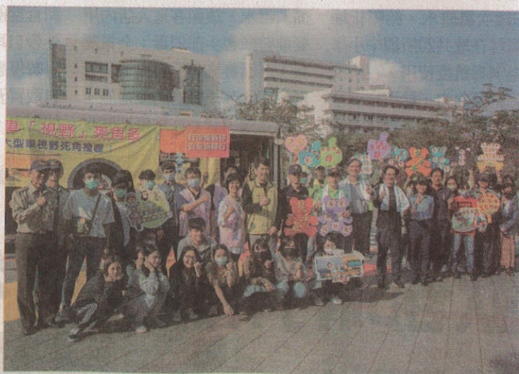
● 嘉藥辦理交通安全週系列活動。

嘉藥配合教育部施政重點方向擴大宣導交通安全，將持續利用各項集會時機及教育場域，透過正式及非正式教育方法及手段傳達平安是回「嘉」唯一的路，提醒所有用路人務必注意大車的「視野死角」及「內輪差」，保持安全距離，期將生命無價深化同學內心達到交通安全零事故。