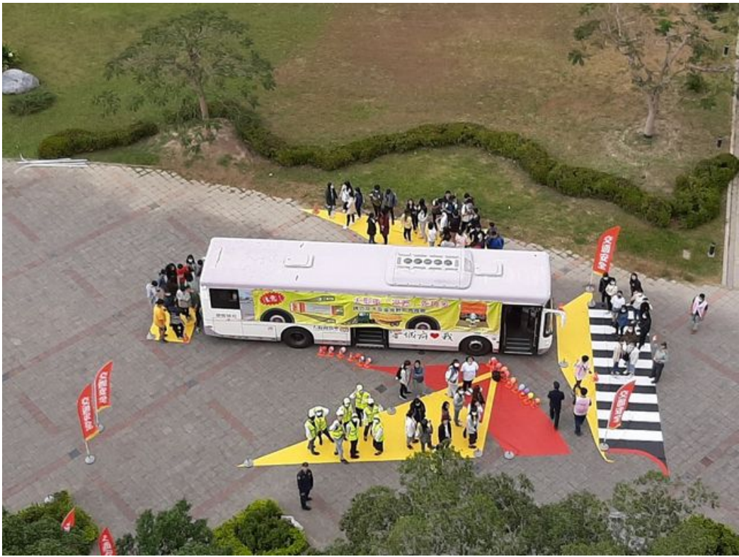
視野死角互動式體驗活動進行中。

近來因視線死角而發生的車禍頻傳，為能有效幫助學生了解視線死角及相關交通安全觀念，嘉南藥理大學日前邀請台南市交通局、臺南監理站及交警大隊於嘉南大道廣場辦理交通安全週系列活動，內容包含「大車視野死角，遠離大車保平安」及「3D模擬酒駕」互動式宣導體驗，希望能透過親身體驗來加深同學對交通路況的警覺性，進而保障生命安全，避免憾事發生。