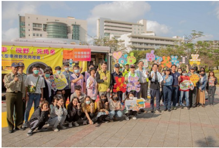
校長及學務長與在場進行互動式體驗活動師生合影