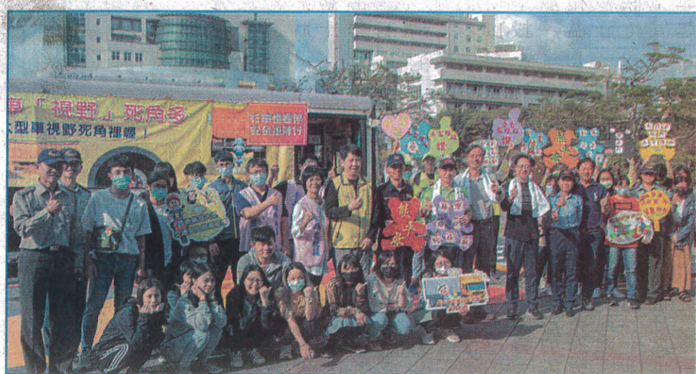
嘉藥交通安全週遠離大車車保平安！