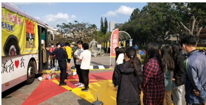
交警大隊莊組長講解視野死角及內輪差區域