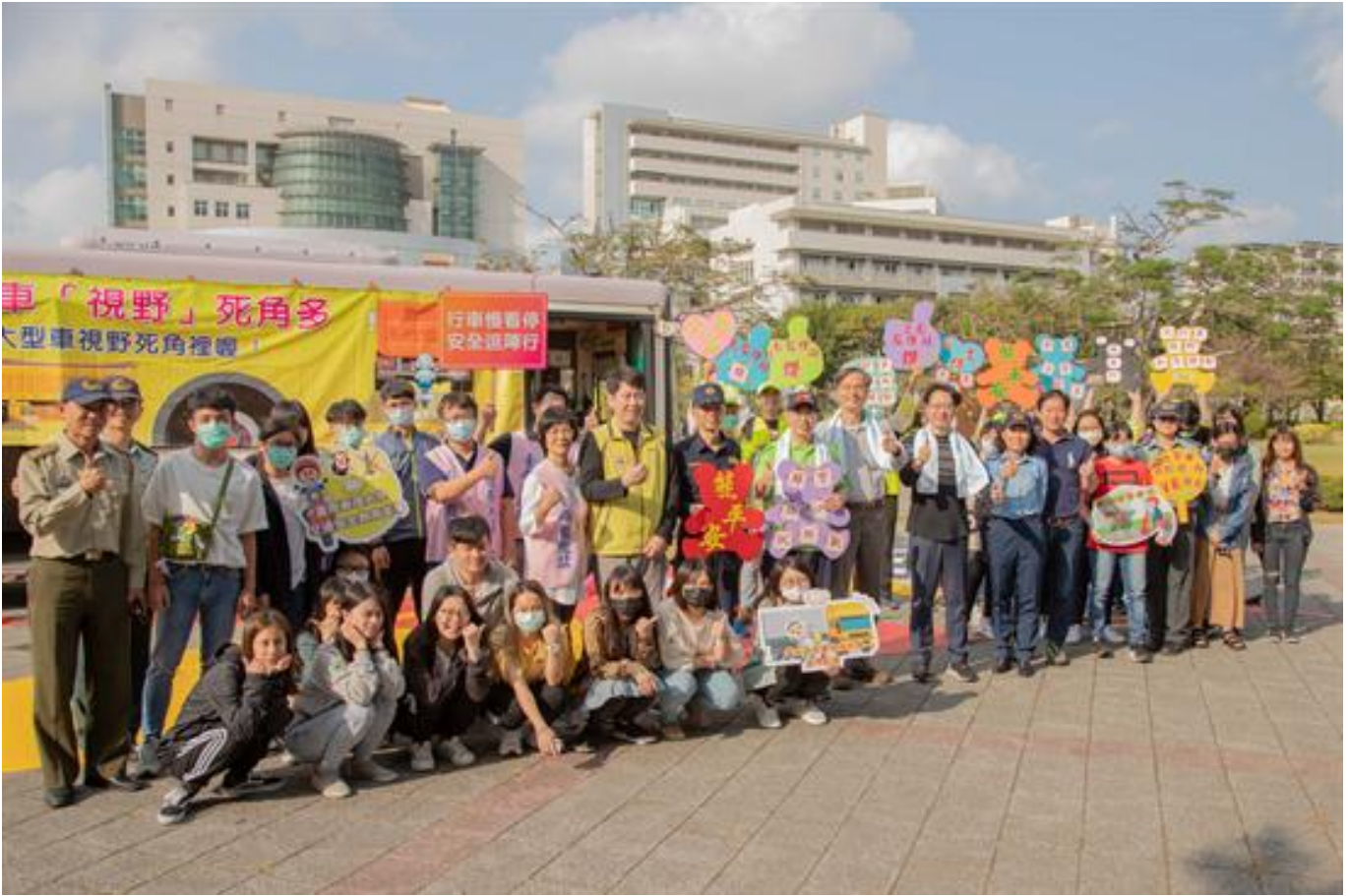
嘉藥交通安全週 遠離大車保平安

(中央社訊息服務20200318 09:18:48)近來因視線死角而發生的車禍頻傳，為能有效幫助學生了解視線死角及相關交通安全觀念，嘉南藥理大學日前邀請台南市交通局、臺南監理站及交警大隊於嘉南大道廣場辦理交通安全週系列活動，內容包含「大車視野死角，遠離大車保平安」及「3D模擬酒駕」互動式宣導體驗，希望能透過親身體驗來加深同學對交通路況的警覺性，進而保障生命安全，避免憾事發生。