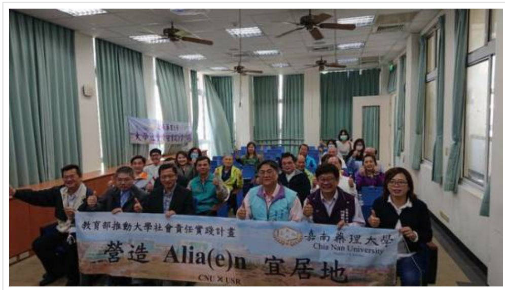
圖2：高雄市阿蓮區社區照護團隊成員大合照。