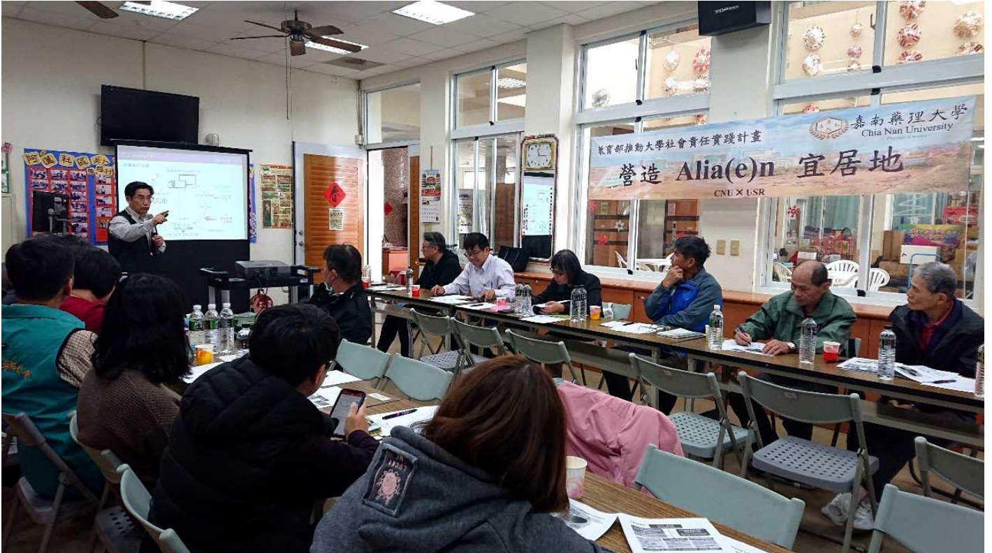
圖說：嘉藥團隊向社區說明USR計畫。

嘉南藥理大學申請教育部第二期大學社會責任實踐(USR)萌芽型計畫，三件申請案全數通過。在既有產學合作基礎上，嘉藥持續深化社區營造鏈結，以鄰近鄉鎮區及地方創生優先推動地區為實踐大學社會責任的出發點，引導大學以人為本，從在地需求出發，透過人文關懷與協助，解決區域問題，據以作為推動USR的政策理念。