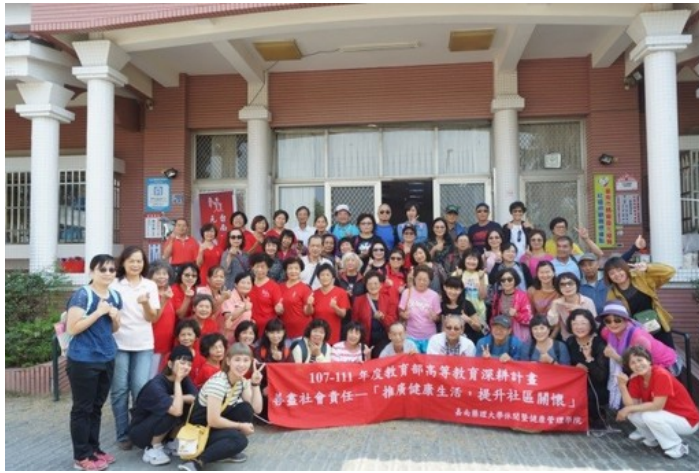
嘉南藥理大學申請教育部大學社會責任實踐計畫全數通過