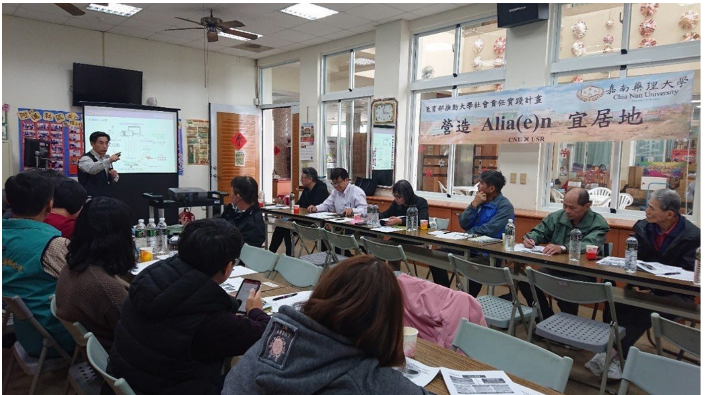
嘉藥團隊在阿蓮區行計畫解說會議。