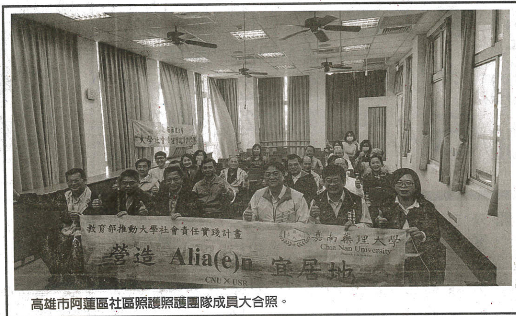
高雄市阿蓮區社區照護照護團隊成員大合照。

了要形塑官田文化與產業的獨特性並創新產品差異化外，同時推動銀髮族健康自主管理，深化在地鏈結，營造樂活社區，108年度更依據官田示範點成功經驗，進行活動複製，水平擴散為目標，前進至其他地區。