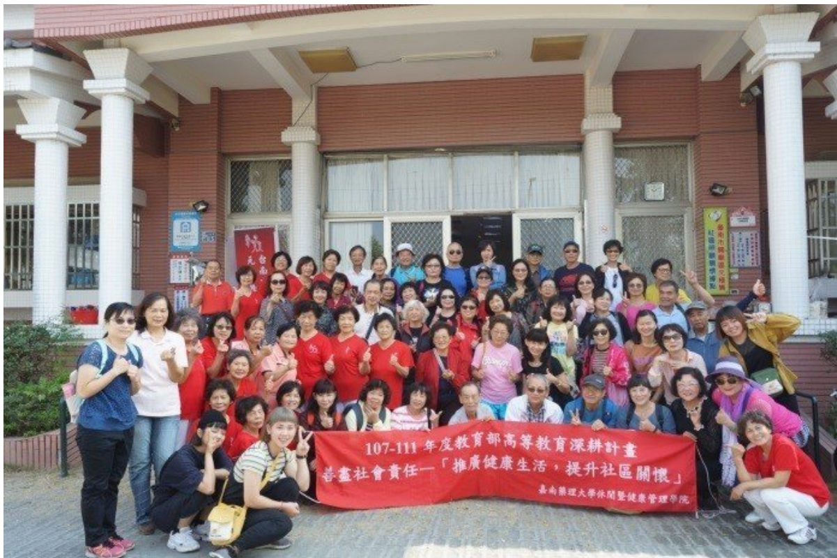
嘉南藥理大學申請教育部大學社會責任實踐計畫全數通過。