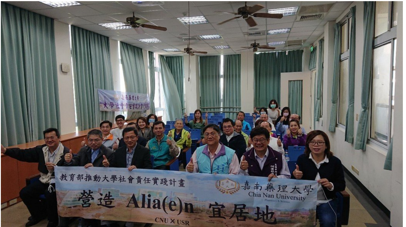
高雄市阿蓮區社區照護照護團隊成員大合照。