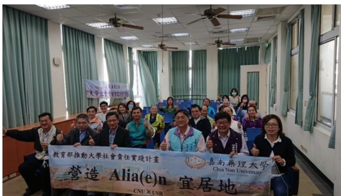
高雄市阿蓮區社區照護照護團隊成員大合照