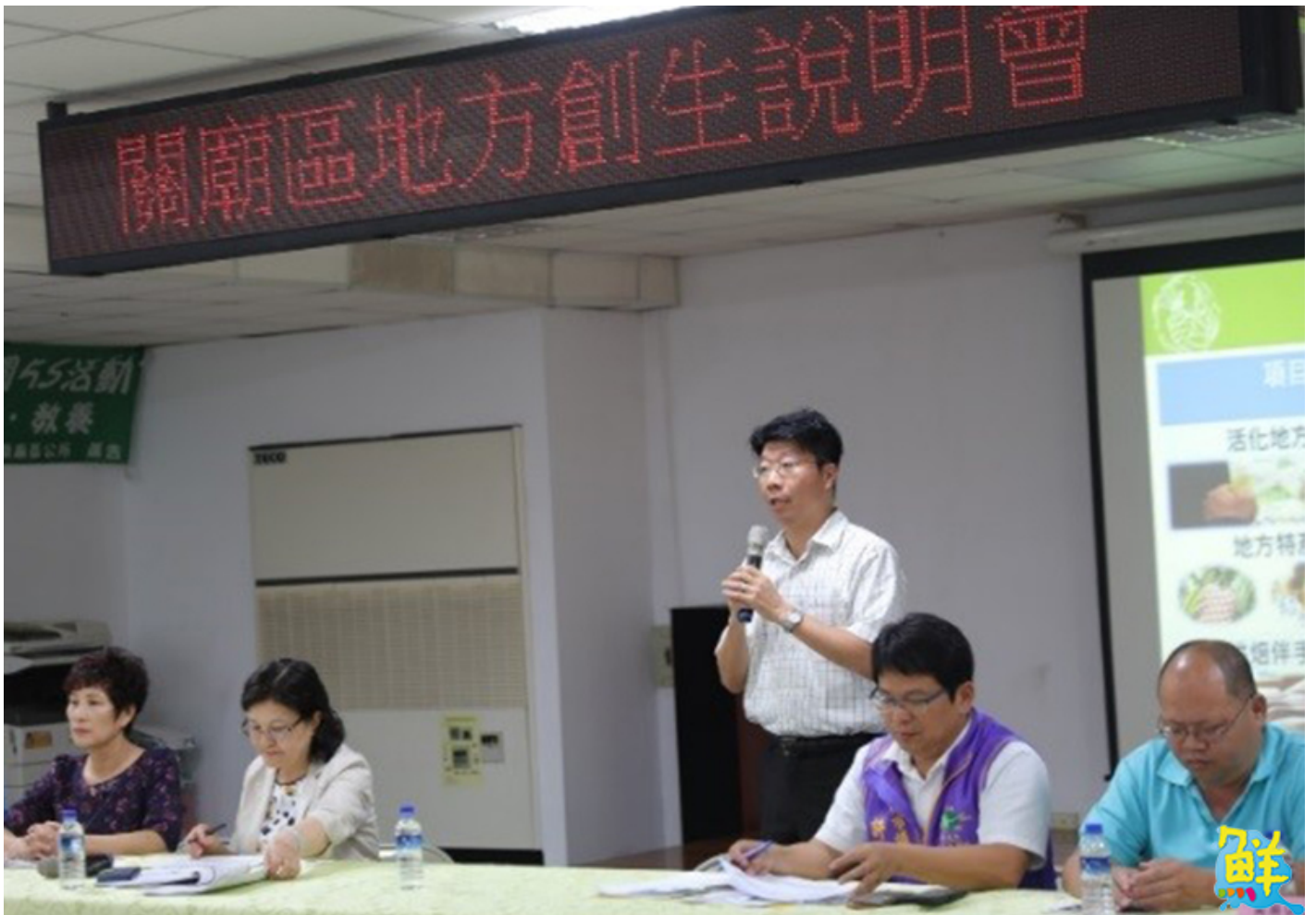
▲結合嘉藥休閒學院及民生學院，聚焦在地農產品的創新與推廣的台南市關廟區之「濃濃香洋風，再造關廟情」。