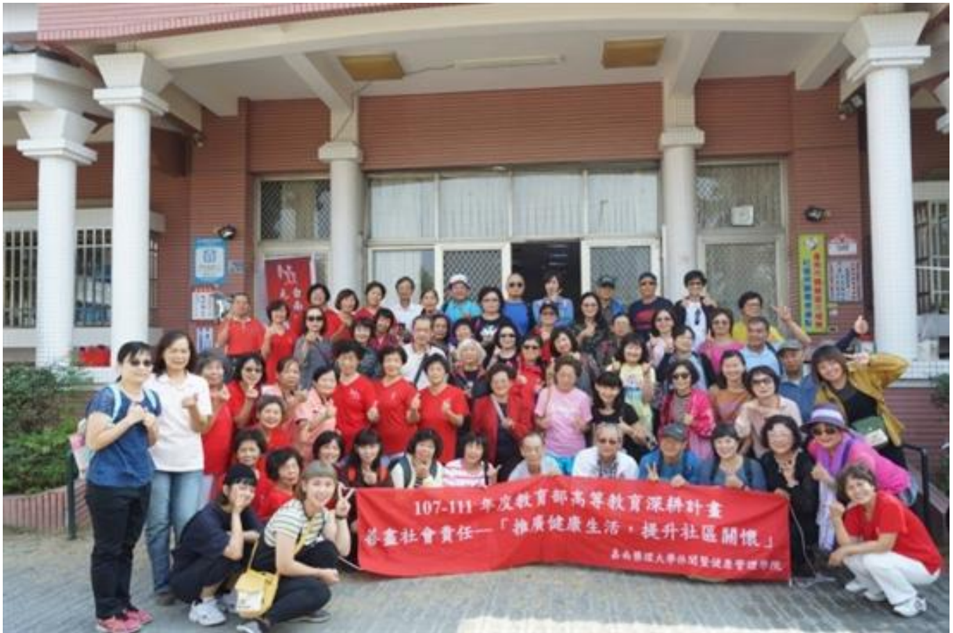
嘉藥持續在地深耕 USR計畫全數通過

(中央社訊息服務20200325 09:17:50)嘉南藥理大學申請教育部第二期 (109-111年度) 大學社會責任實踐 (USR) 萌芽型計畫，三件申請案全數通過。在既有產學合作基礎上，嘉藥持續深化社區營造鏈結，以鄰近鄉鎮區及地方創生優先推動地區為實踐大學社會責任的出發點，引導大學以人為本，從在地需求出發，透過人文關懷與協助，解決區域問題，據以作為推動USR的政策理念。