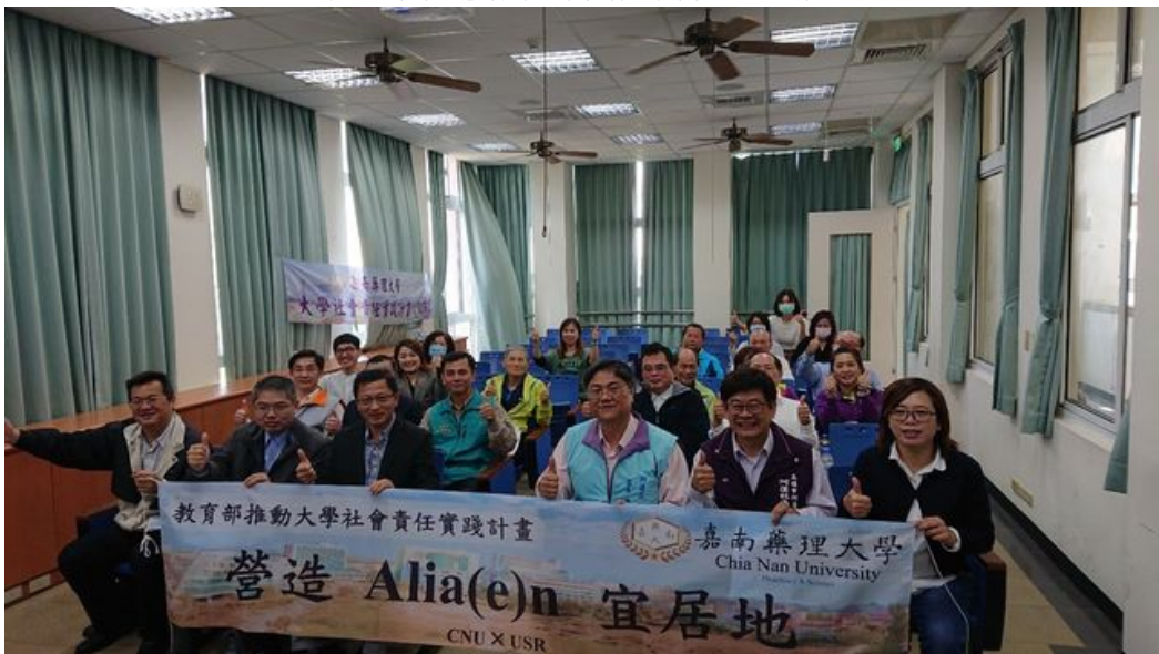
高雄市阿蓮區社區照護團隊成員大合照。

嘉南藥理大學申請教育部第二期（109-111年度）大學社會責任實踐（USR）萌芽型計畫，三件申請案全數通過。在既有產學合作基礎上，嘉藥持續深化社區營造鏈結，以鄰近鄉鎮區及地方創生優先推動地區為實踐大學社會責任的出發點，引導大學以人為本，從在地需求出發，透過人文關懷與協助，解決區域問題，據以作為推動USR的政策理念。