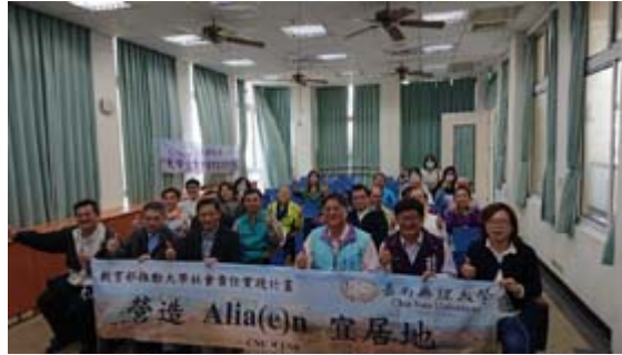
高雄市阿蓮區社區照護照護團隊成員大合照。

【記者孫宜秋／南市報導】嘉南藥理大學申請教育部第二期（109-111年度）大學社會責任實踐（USR）萌芽型計畫，三件申請案全數通過。在既有產學合作基礎上，嘉藥持續深化社區營造鏈結，以鄰近鄉鎮區及地方創生優先推動地區為實踐大學社會