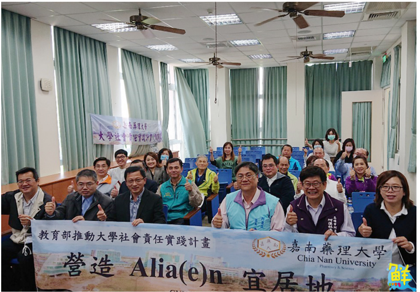
▲專注於在地人口老化，社區活力再造的議題，由嘉藥人資學院與民生學院合作的高雄市阿蓮區之「營造Alia(e)n 宜居地」