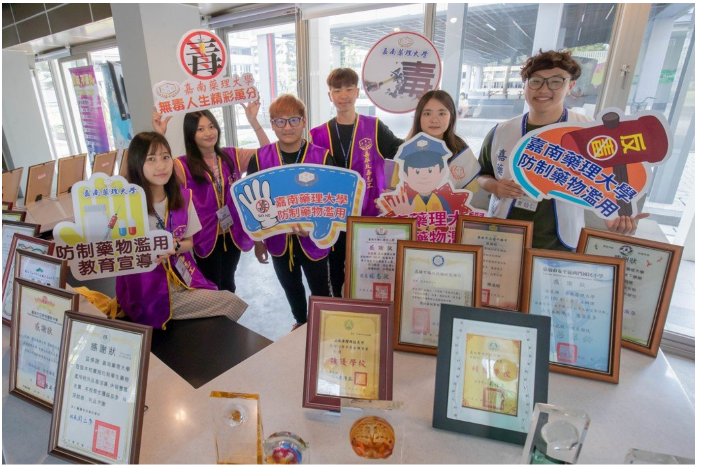
嘉藥積極宣導反毒，受教育部推薦與大愛電視台合作專題報導。