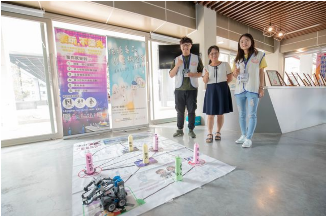
嘉藥校內各系合作做出反毒AI機器人。

嘉南藥理大學配合政府「新世代反毒行動綱領」，因應校園毒品可能向下拓展的隱憂，落實推動防制學生藥物濫用工作，特辦理一系列校內外頗具創新多元的宣教活動，更將推廣對象延伸至國高中職校，從基層就開始保護年輕學子，將毒品徹底趕出校園，透過多年的經驗累積與努力，嘉藥不僅與周遭各級學校在反毒議題上有深厚的合作與默契，更連續3年(106-108年)榮獲教育部評選為績優學校，累計已是9度獲獎，傑出表現相當難能可貴。