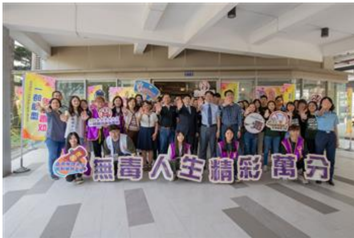
嘉藥連續3年榮獲教育部評選為反毒績優學校