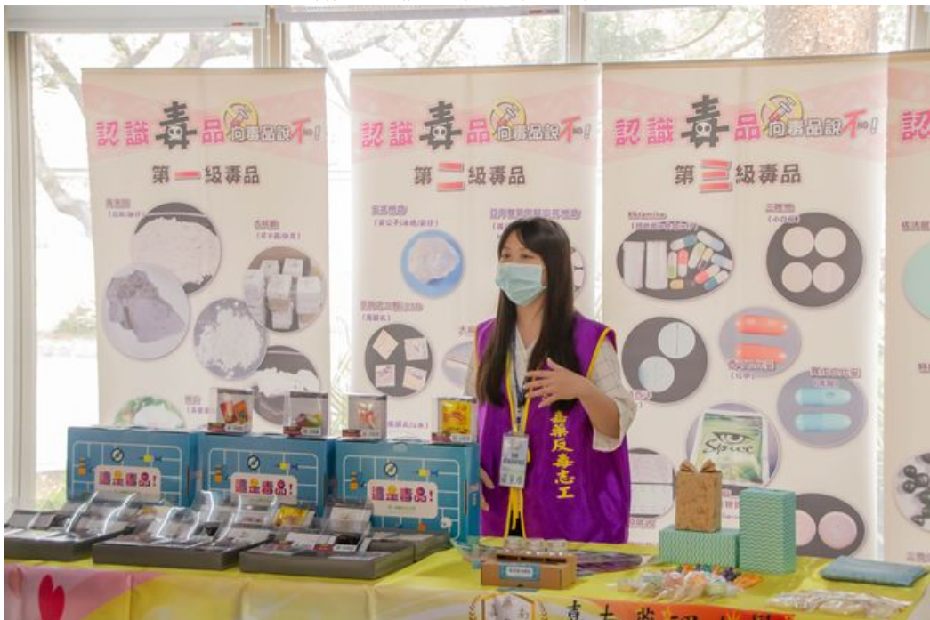
利用桌遊遊戲讓學生了解毒品的危害。