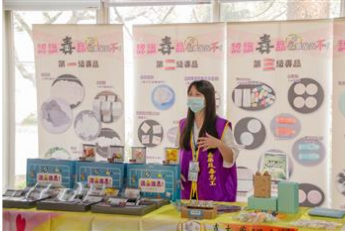
利用桌遊遊戲讓學生了解毒品的危害