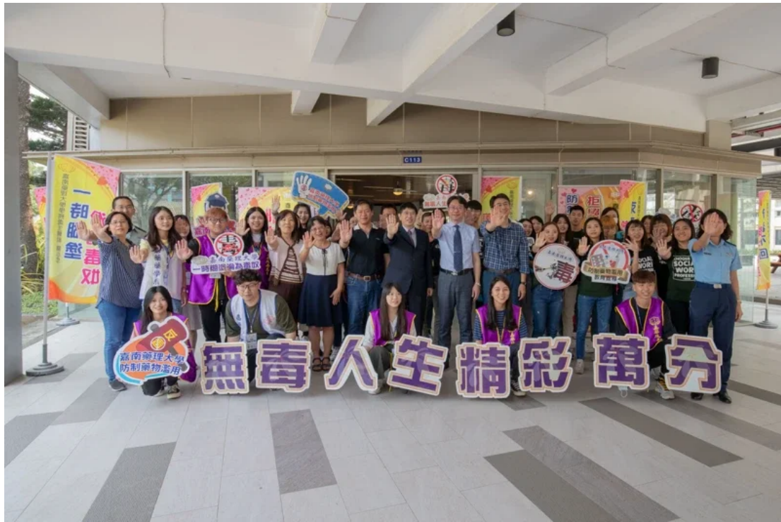
嘉南藥理大學推動防制學生藥物濫用 · 連3年獲選績優學校。