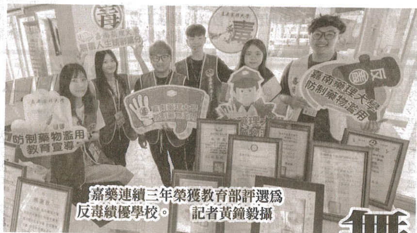
嘉藥連續三年榮獲教育部評選為反毒績優學校。