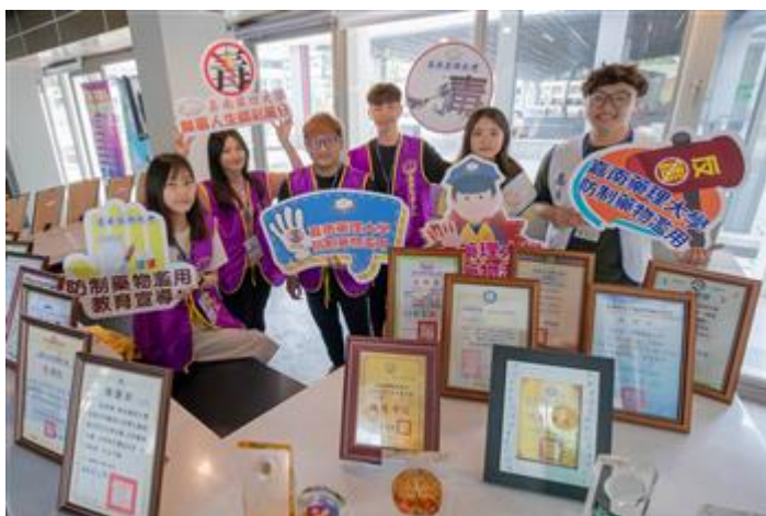
嘉藥積極宣導反毒，受教育部推薦與大愛電視台合作專題報導