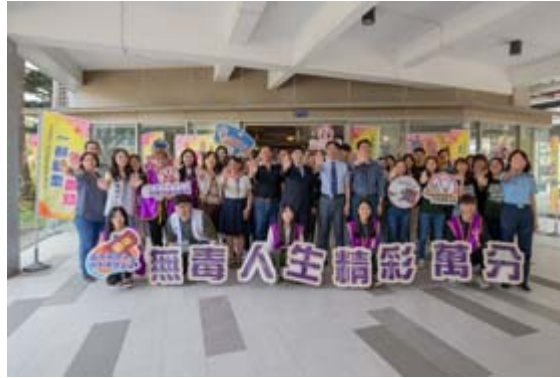
嘉藥連續3年榮獲教育部評選為反毒績優學校。

【記者孫宜秋／南市報導】嘉南藥理大學配合政府「新世代反毒行動綱領」，因應校園毒品可能向下拓展的隱憂，落實推動防制學生藥物濫用工作，特辦理一系列校內外頗具創新多元的宣教活動，更將推廣對象延伸至國高中職校，從基層就開始保護年輕學子，將毒品徹底趕出校園，透過多