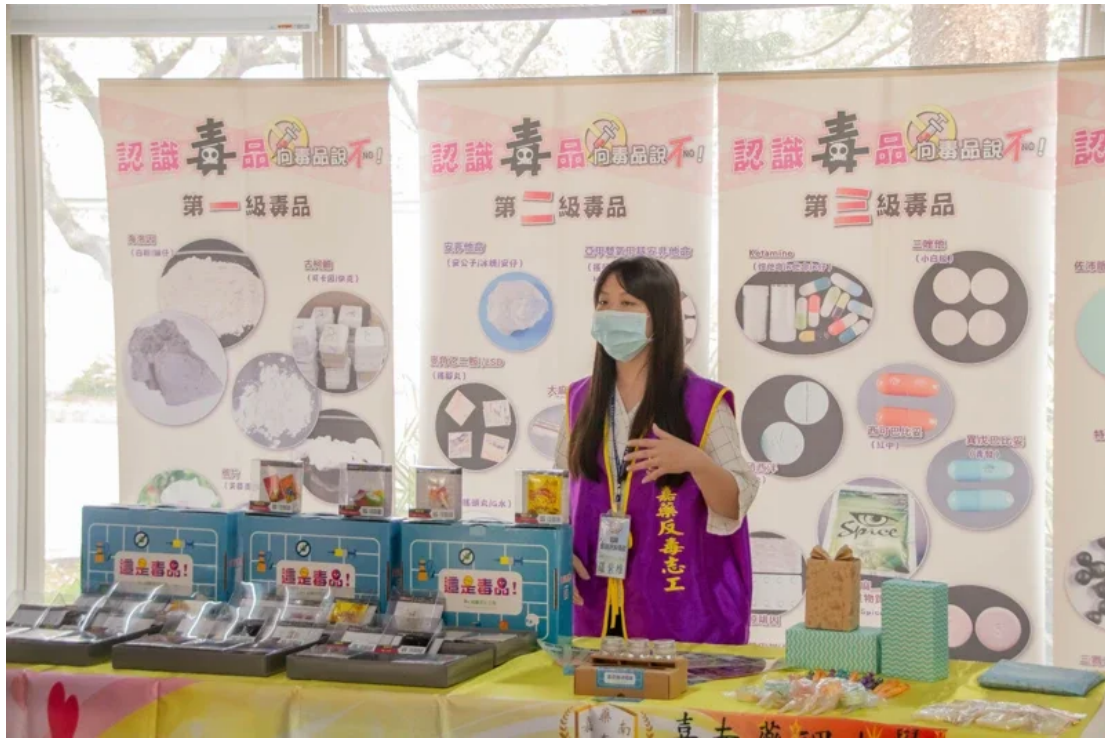
嘉南藥理大學推動防制學生藥物濫用 · 設計各式桌遊宣導。