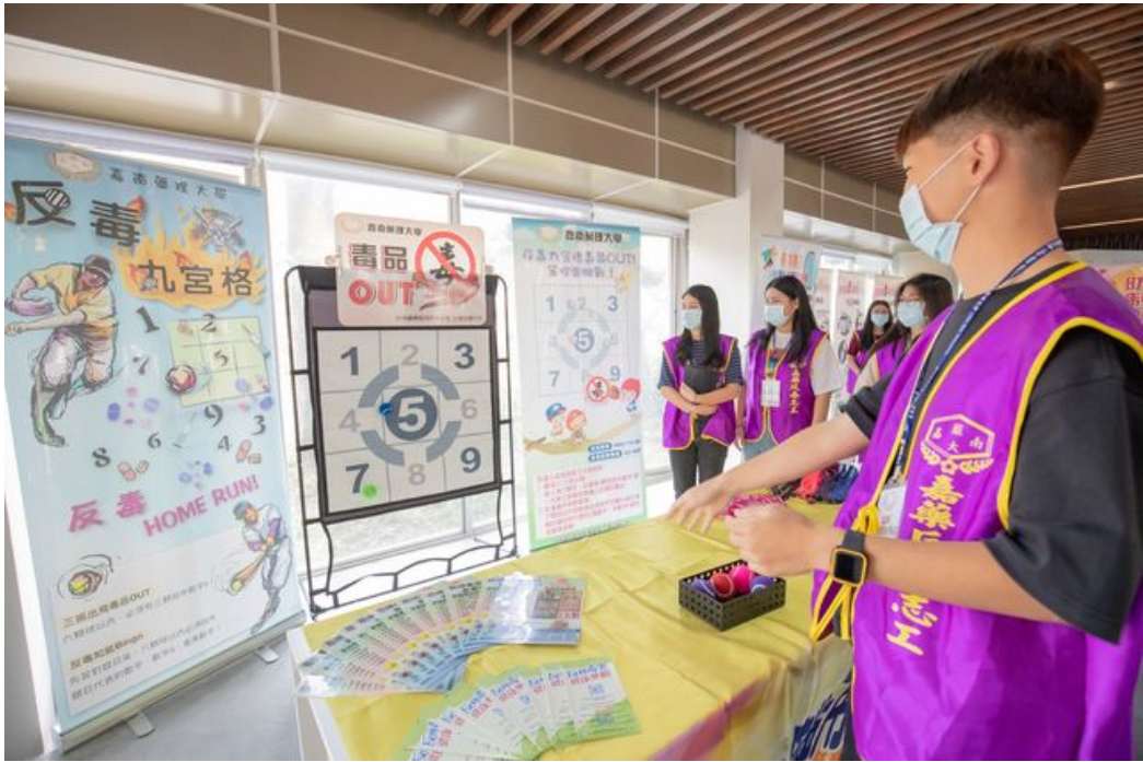
反毒棒球九宮格提升學生們學習反毒興趣。

http://www.cntimes.info 2020-04-07 19:35:41