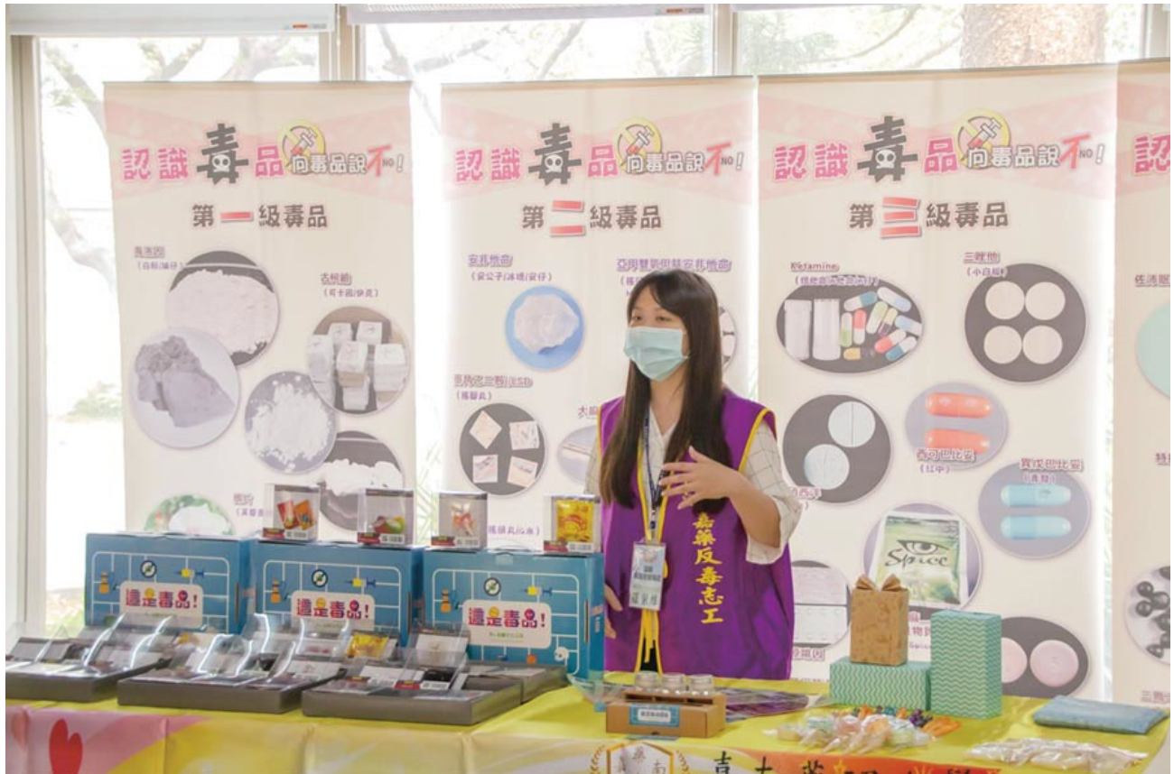
嘉南藥理大學利用桌遊遊戲讓學生了解毒品的危害。