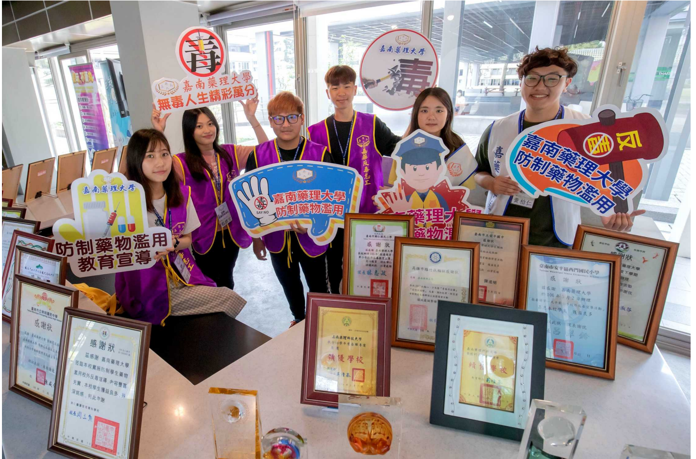
圖說：嘉藥連續三年榮獲教育部評選為反毒績優學校。

近年來毒品使用年齡下降趨勢，嘉南藥理大學配合政府「新世代反毒行動綱領」，特辦理一系列校內外創新多元的宣教活動，透過多年的經驗累積與努力，不僅與周圍各級學校在反毒議題上有深厚的合作與默契，更連續三年榮獲教育部評選為績優學校，累計已是九度獲獎，傑出表現相當難能可貴。