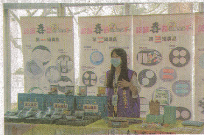
● 嘉南藥理大學利用桌遊遊戲讓學生了解毒品的危害。

。經由大愛電視台的專訪，不僅讓採訪記者對嘉藥多元反毒宣教感到佩服，也讓所有參與反毒志工們倍感榮耀與欣慰。