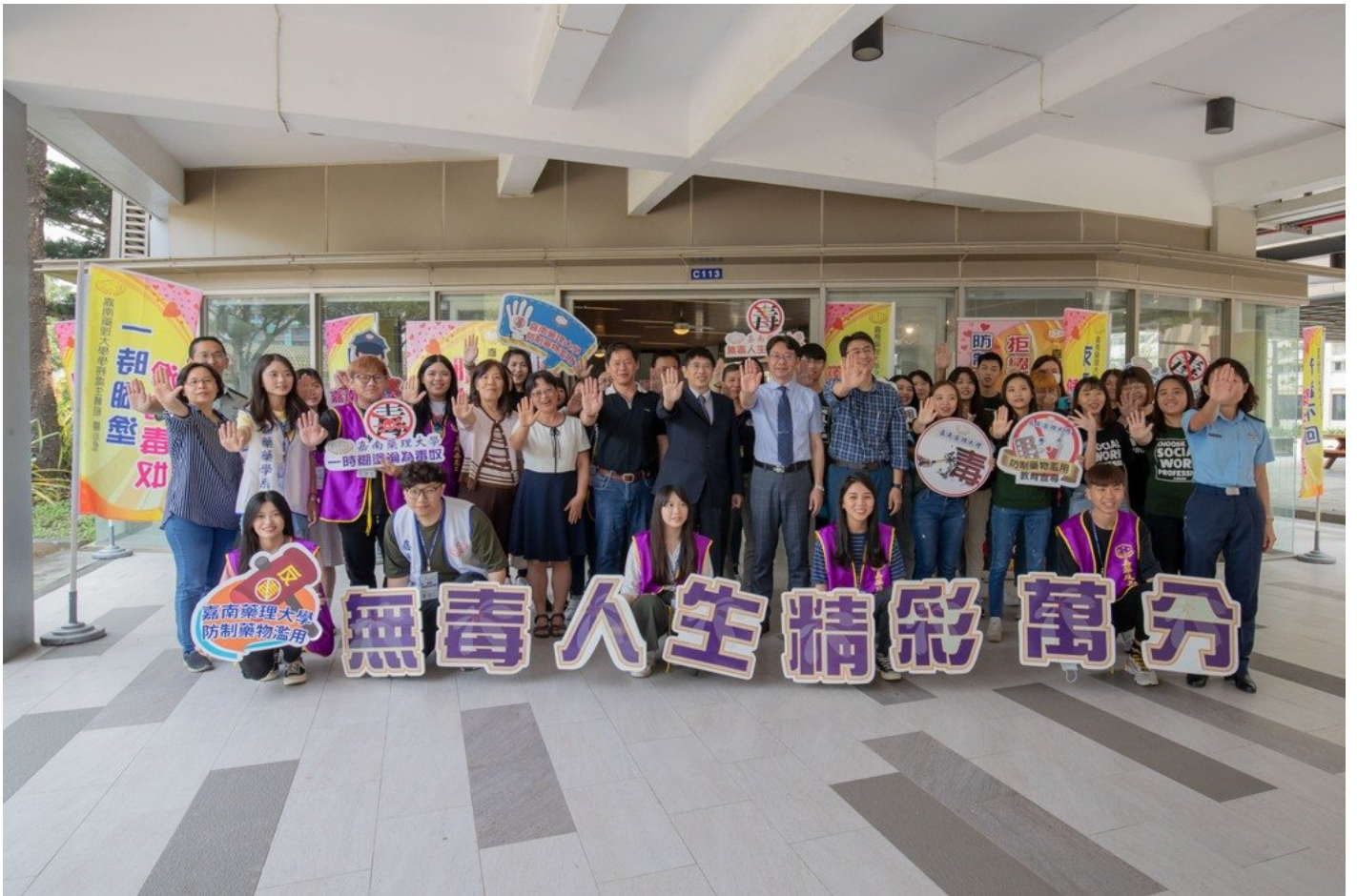
嘉藥連續3年榮獲教育部評選為反毒績優學校。