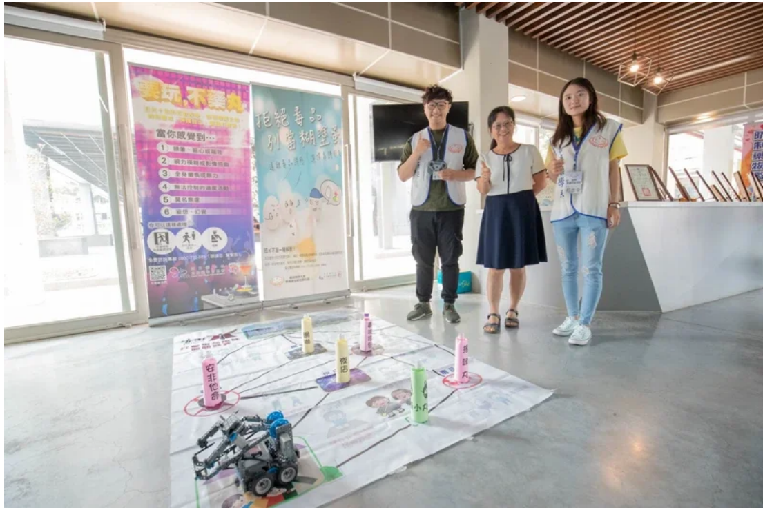
嘉南藥理大學學生設計反毒AI機器人 · 推動防制藥物濫用 。