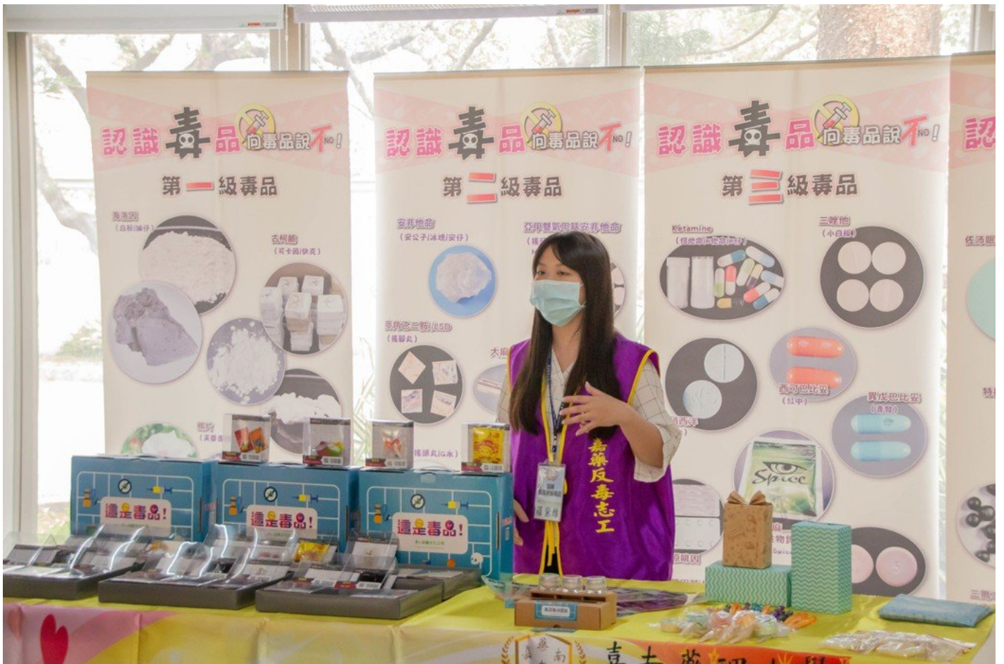
利用桌遊遊戲讓學生了解毒品的危害。