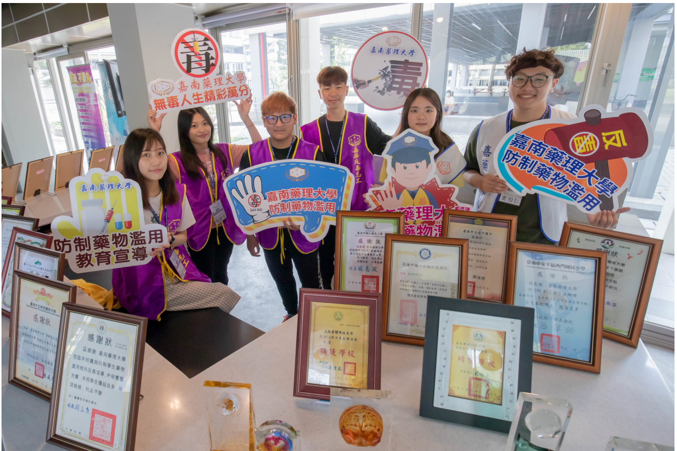
嘉藥積極宣導反毒，受教育部推薦與大愛電視台合作專題報導【圖/翻攝畫面】

毒品入侵而讓校園變了調是相當棘手的問題！年輕學子天性純真、好奇心重，也容易遭到不肖人士以毒品控制，近年來毒品使用年齡更有下降趨勢，根據教育部資料統計，首次沾毒在19歲以下者比例竟高達22.0%，且有持續攀升趨勢，持毒、吸毒甚至販毒的在學學生每年可能逾千人。校園防毒不僅需要向下紮根，從小賦予學子們正確觀念，更要時時關心學生狀況，適時做出輔導。