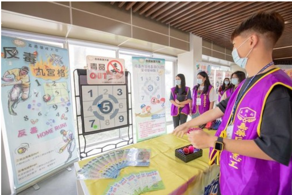
圖4：嘉藥校內各系合作做出反毒AI機器人。