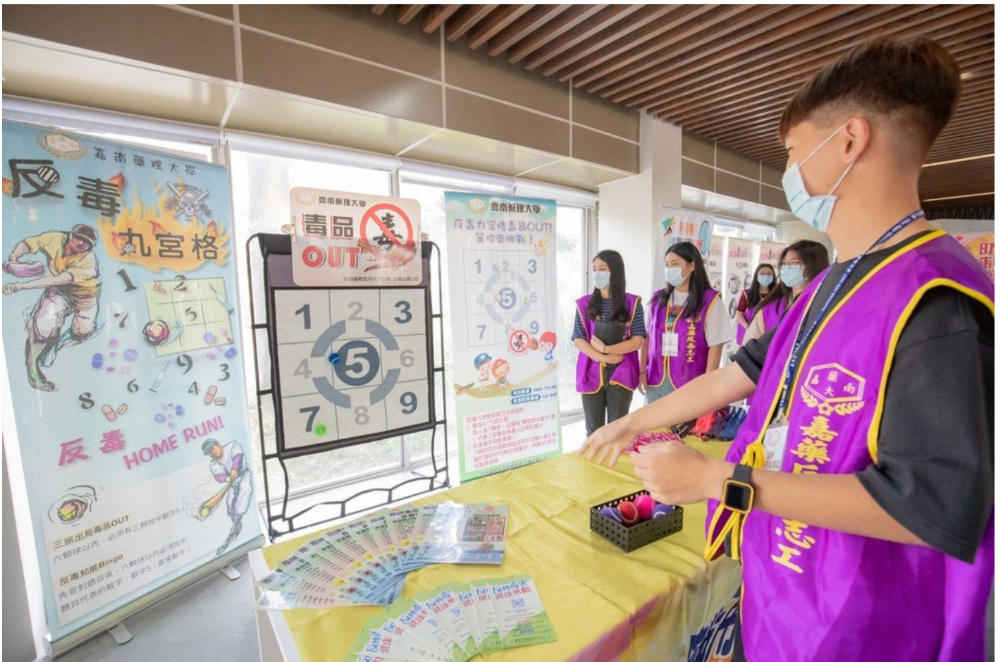
反毒棒球九宮格提升學生們學習反毒興趣。