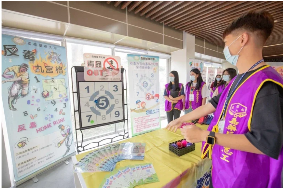
嘉南藥理大學設計反毒九宮格 · 宣導反毒。