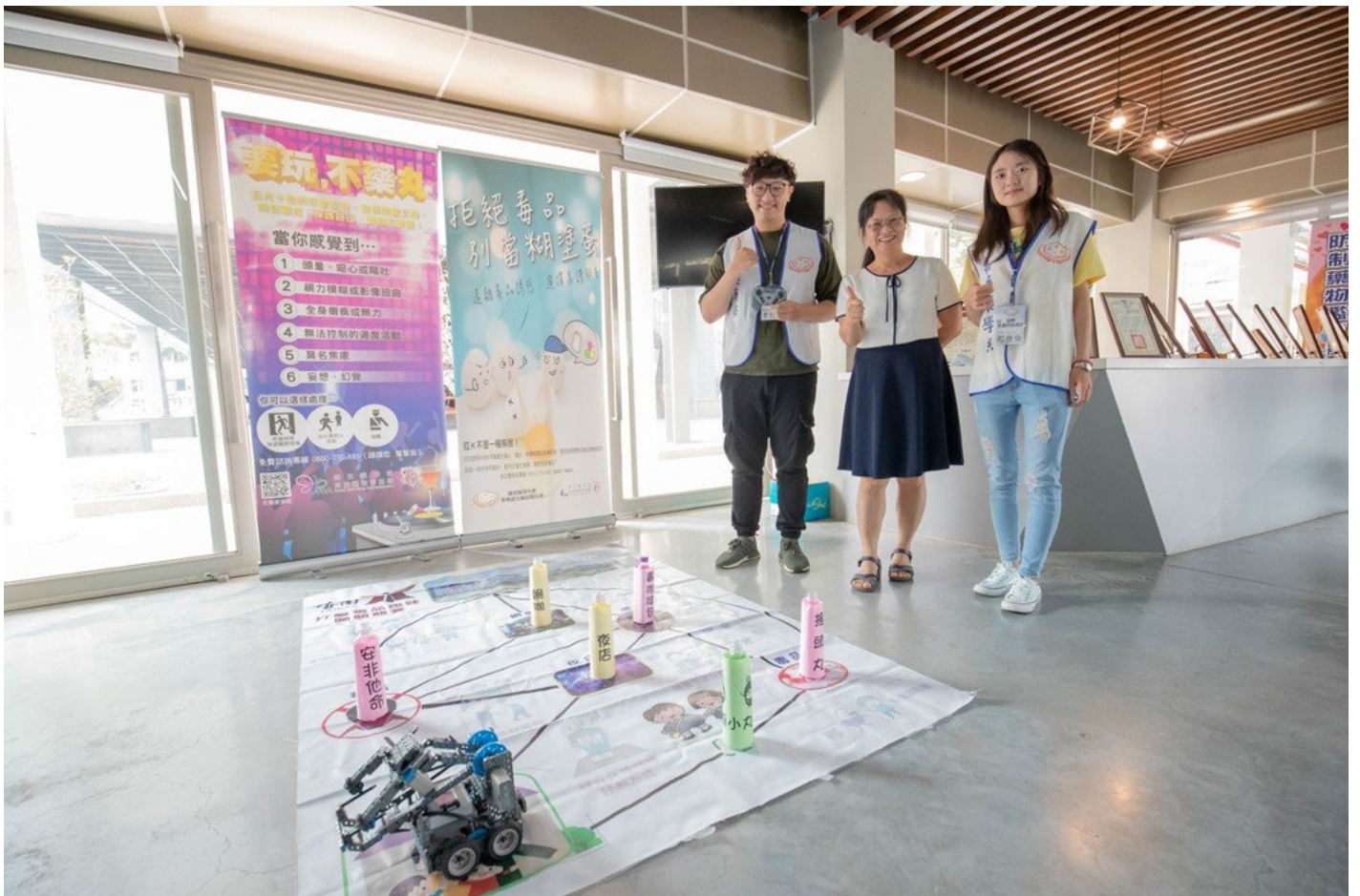
嘉藥校內各系合作做出反毒AI機器人。