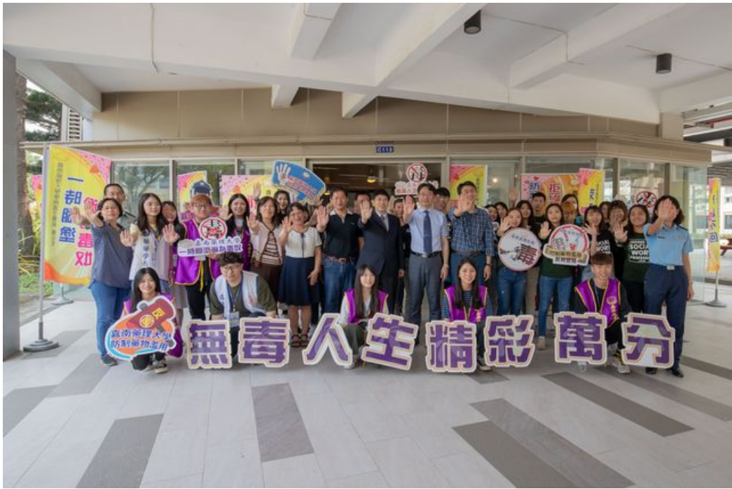
嘉藥連續3年榮獲教育部評選為反毒績優學校。