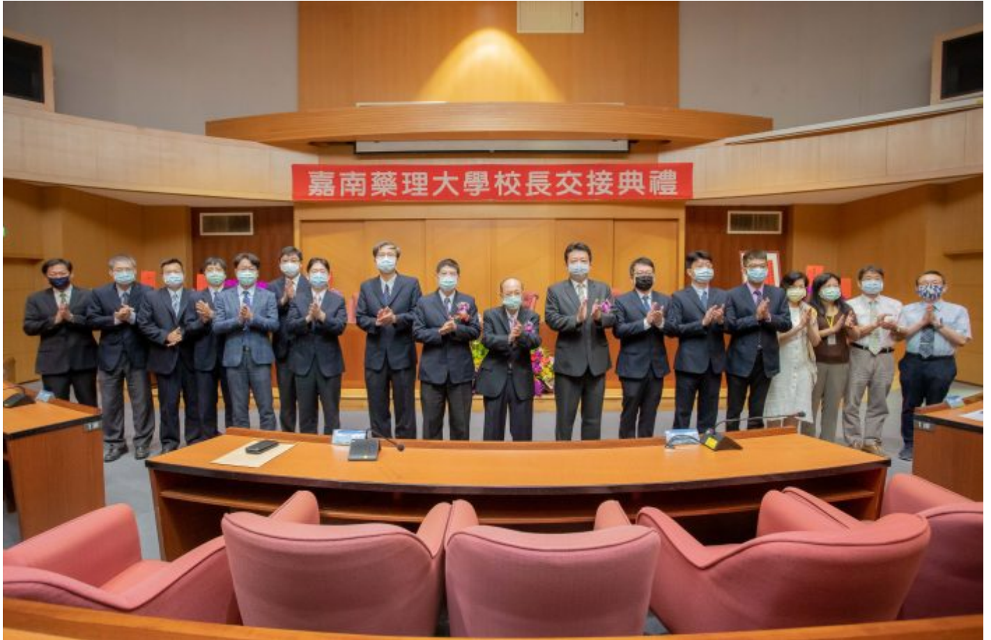
董事長(中)、校長與嘉藥一級主管合影