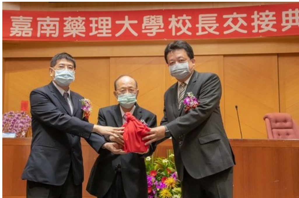
圖3：董事長(中)、校長與嘉藥一級主管合影。