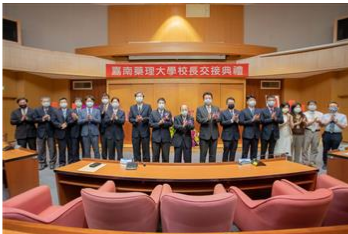
董事長(中)、校長與嘉藥一級主管合影