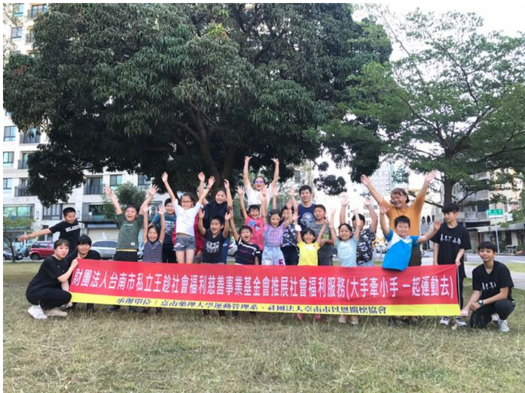
嘉藥攜手社福基金會舉辦大手牽小手 一起運動去活動。

http://www.cntimes.info 2020-05-11 18:09:17