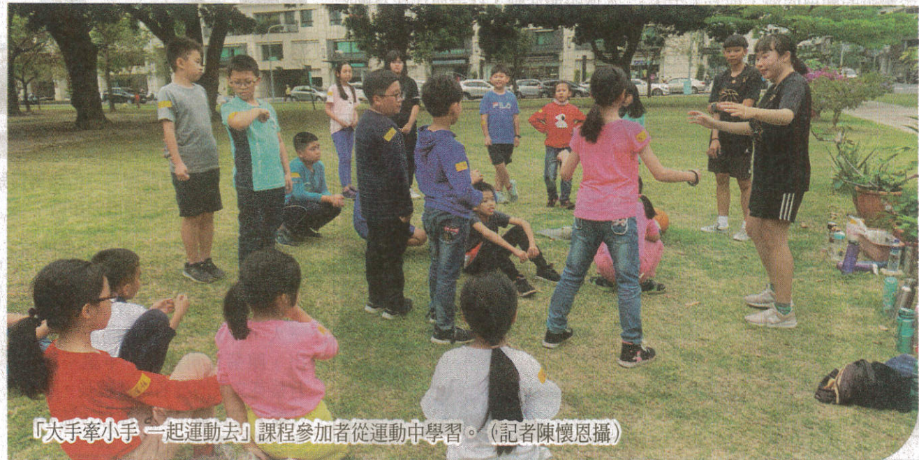
「大手牽小手一起運動去」課程參加者從運動中學習。

計劃案，讓兒少學員能夠在運動教育中學習並快樂成長，也讓運管系培育的運動專業指導員能在學習中找到熱情並適時回饋社會，履行大學的社會責任。