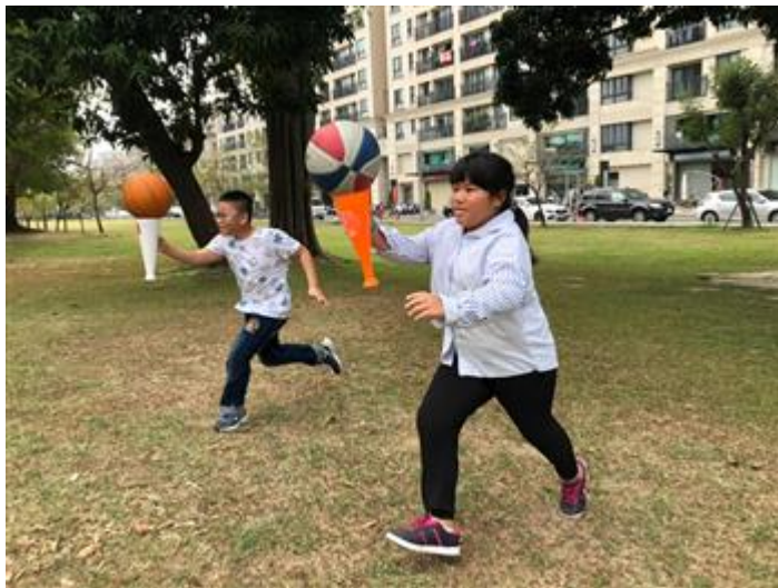
學童開心參與嘉藥學長姐安排的運動課程