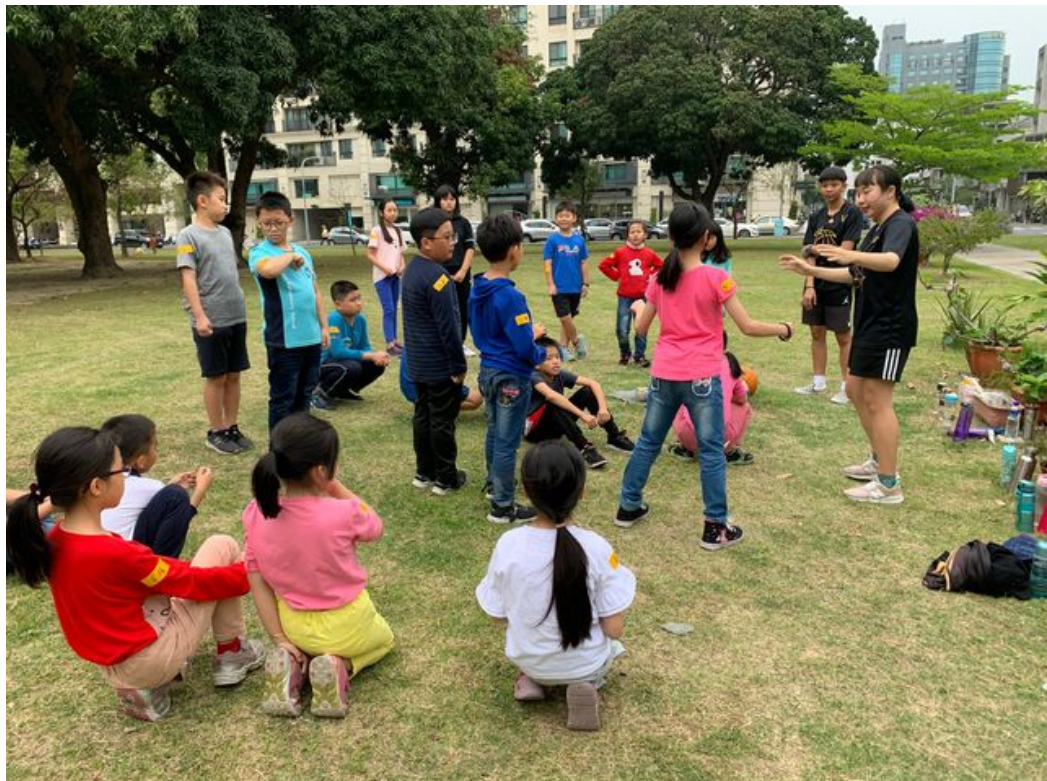
學童在大哥哥姊姊陪伴下十分開心。