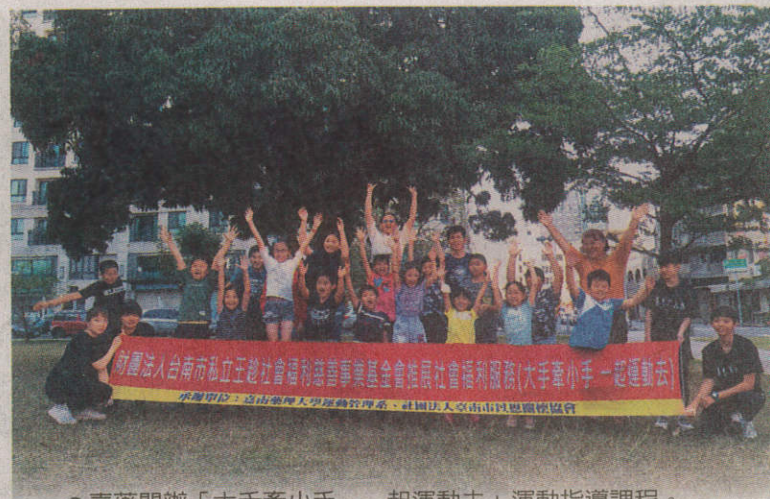
● 嘉藥開辦「大手牽小手，一起運動去」運動指導課程。

該校表示，「大手牽小手，一起運動去」主要以共享、共學為目標，透過運動指導建立良好的互動關係，鼓勵團隊合作，培養互信基礎及個人自信心，進而引導學員有責任去嘗試多元的學習面向，把教學目標轉換成學生行為的實務操作模式，嘉藥運管系特別選派四位運管系同學擔任指導員，由於本身是教