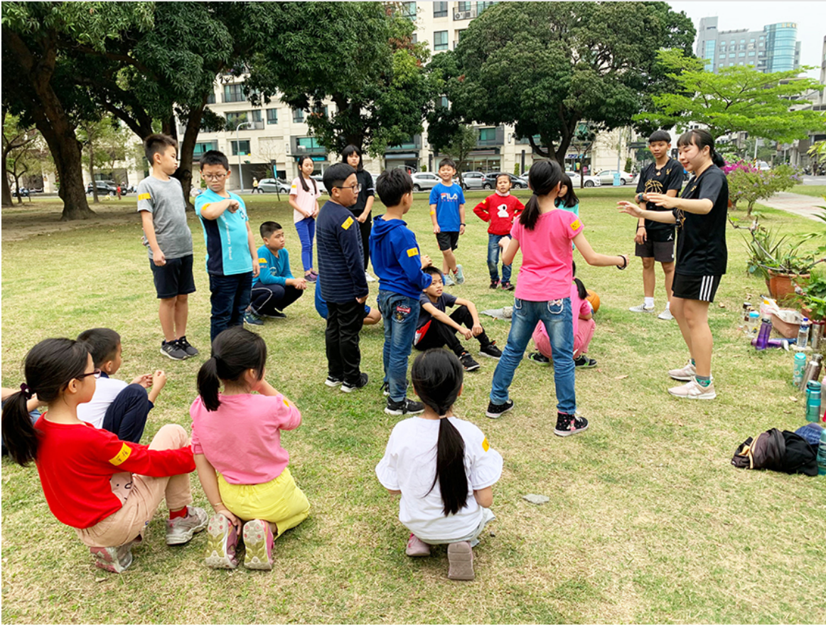
「大手牽小手一起運動去」課程參加者從運動中學習。