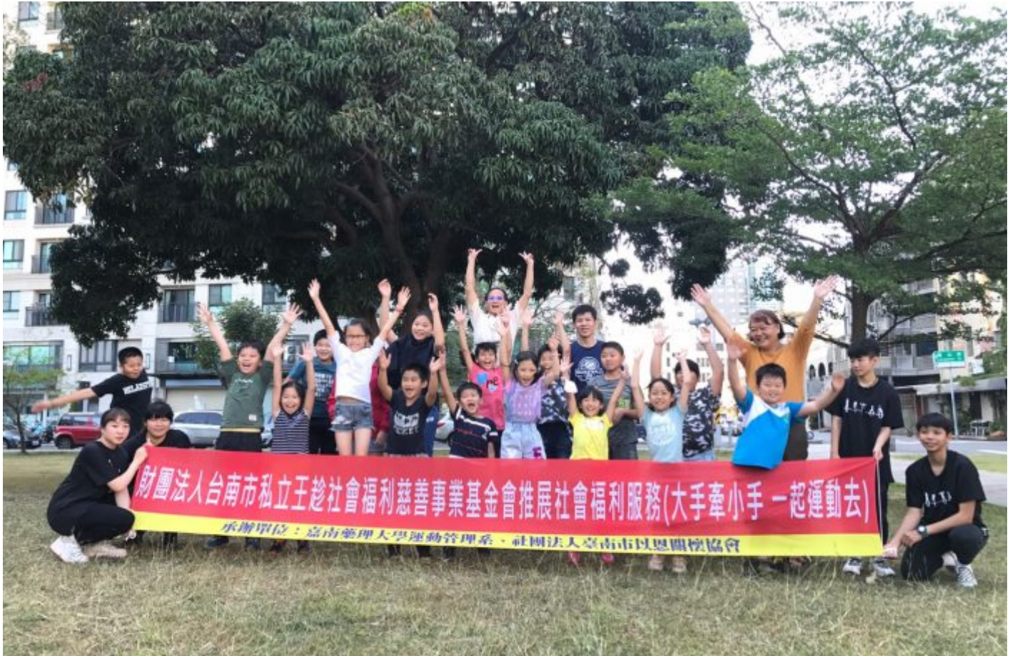
嘉藥攜手社福基金會舉辦大手牽小手 一起運動去活動