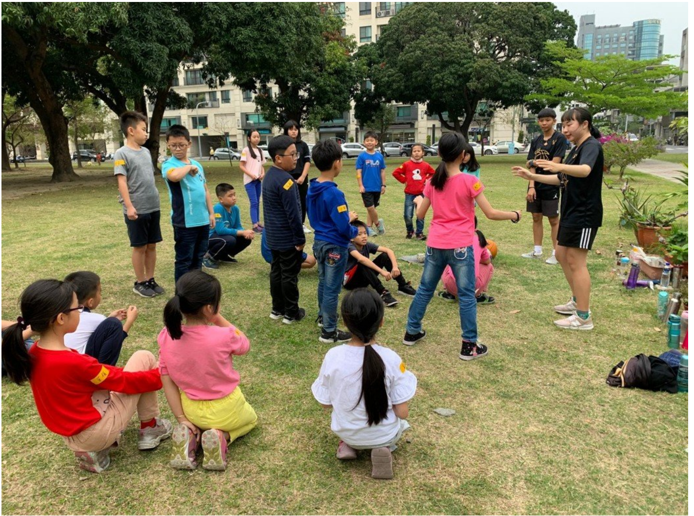
學童在大哥哥姊姊陪伴下十分開心。