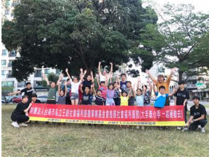
嘉藥攜手社福基金會舉辦大手牽小手 一起運動去活動