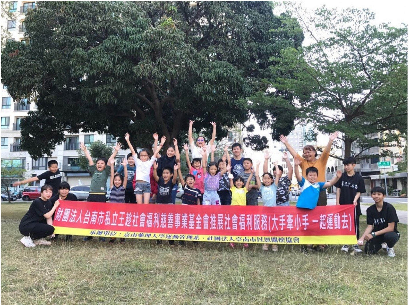
嘉藥攜手社福基金會舉辦大手牽小手 一起運動去活動。