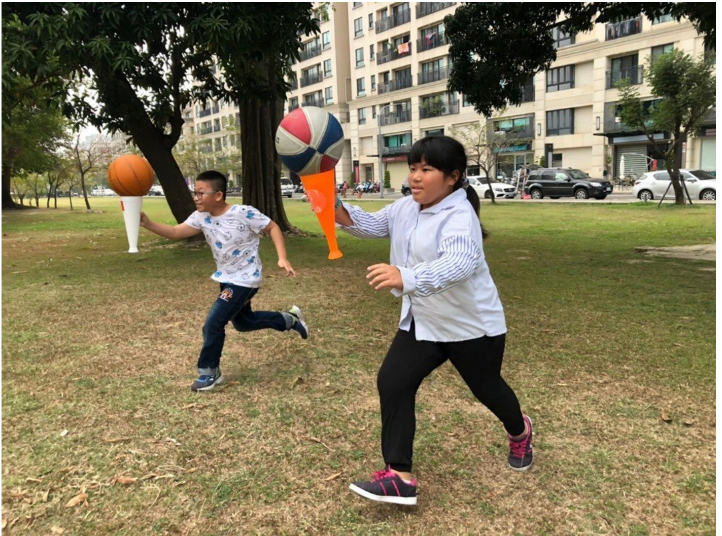
學童開心參與嘉藥學長姐安排的運動課程。