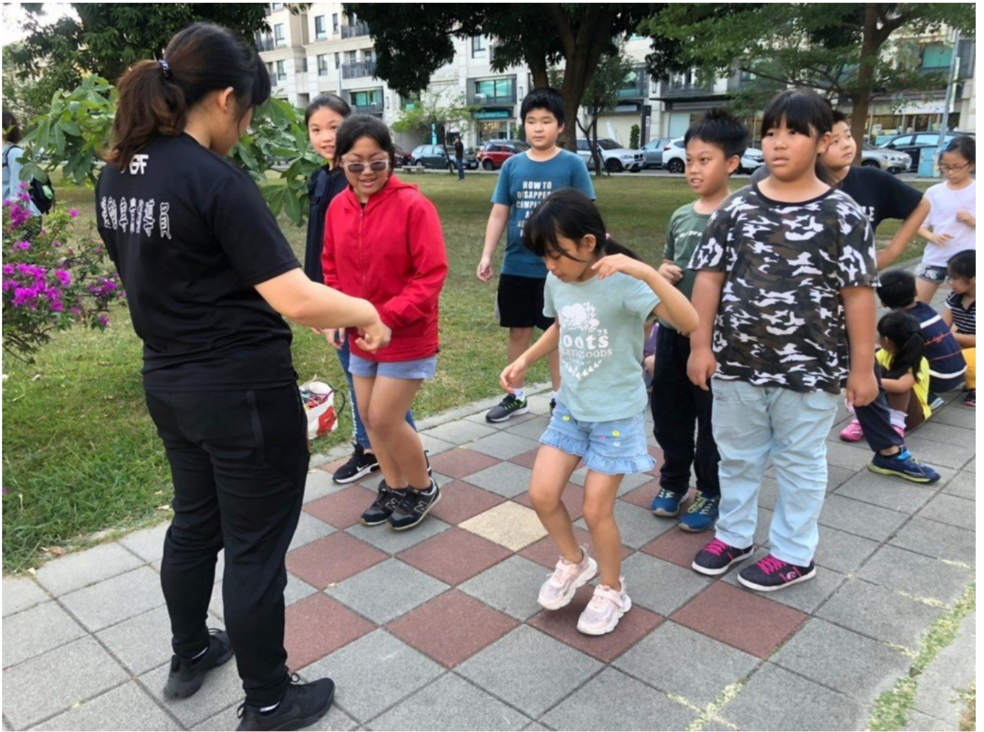
小朋友在嘉藥運管系學生陪伴下進行運動指導課程。