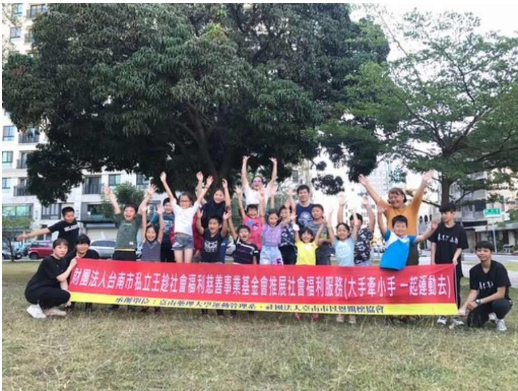
圖3：學童開心參與嘉藥學長姐安排的運動課程。