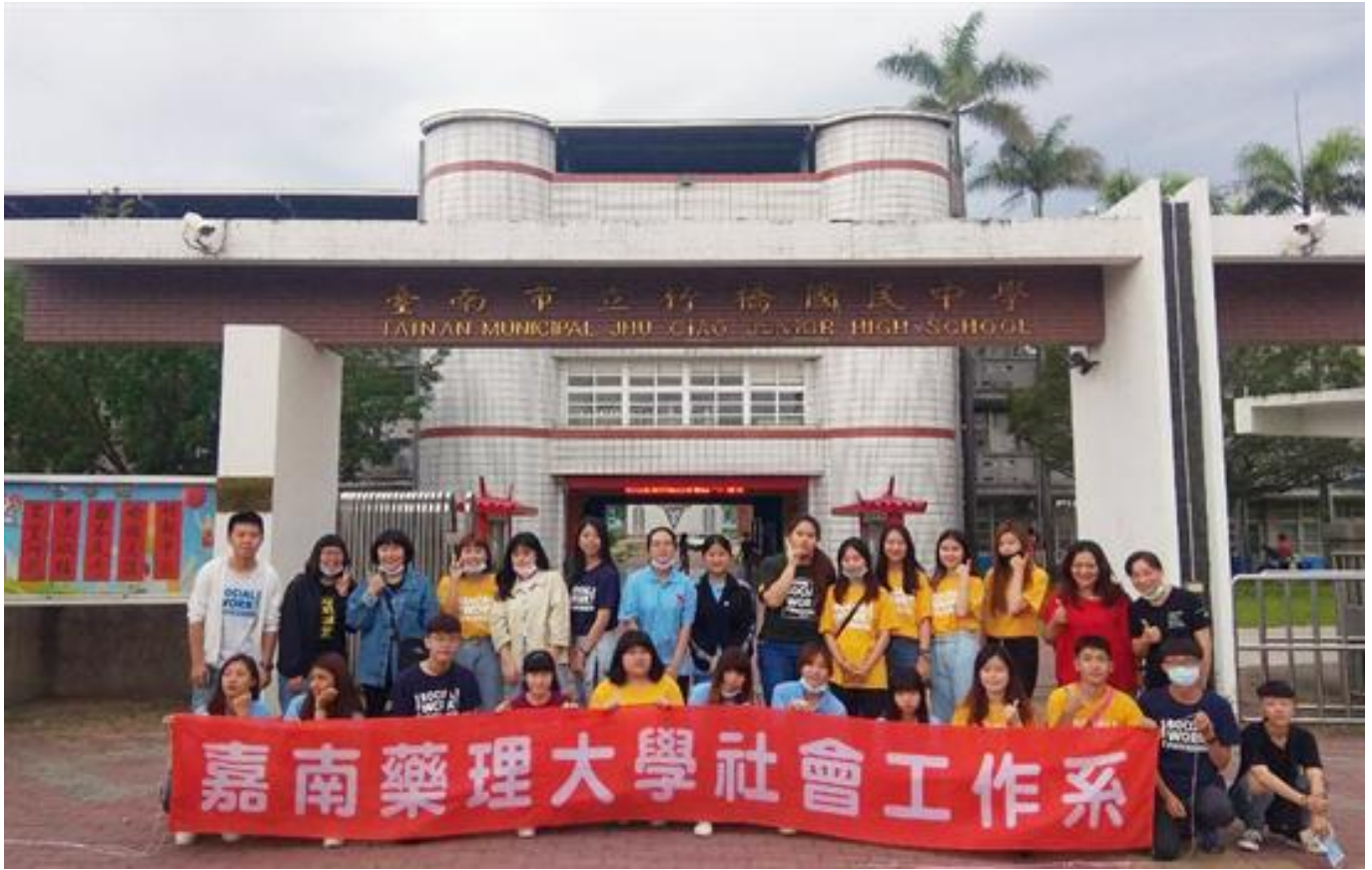
嘉藥社工得勝團隊服務偏鄉青少年「築夢人生」體驗營隊活動

(中央社訊息服務20200520 09:20:14)嘉南藥理大學社會工作系與得勝者教育協會合作，在台新銀行公益慈善基金會贊助下，於5月19日在台南七股區竹橋國中舉辦「築夢人生財商營3.5」營隊活動，吸引超過40名的國中生參加，透過財務相關的情境模擬體驗，趁早讓學員學習正確金錢觀，希望讓每一個孩子擁有生命贏家應有的「素養」，期待用生命教育的態度，引導孩子建構良好的理財觀念，學習善用資源與人分享，成為能力與品格兼備的財商達人。