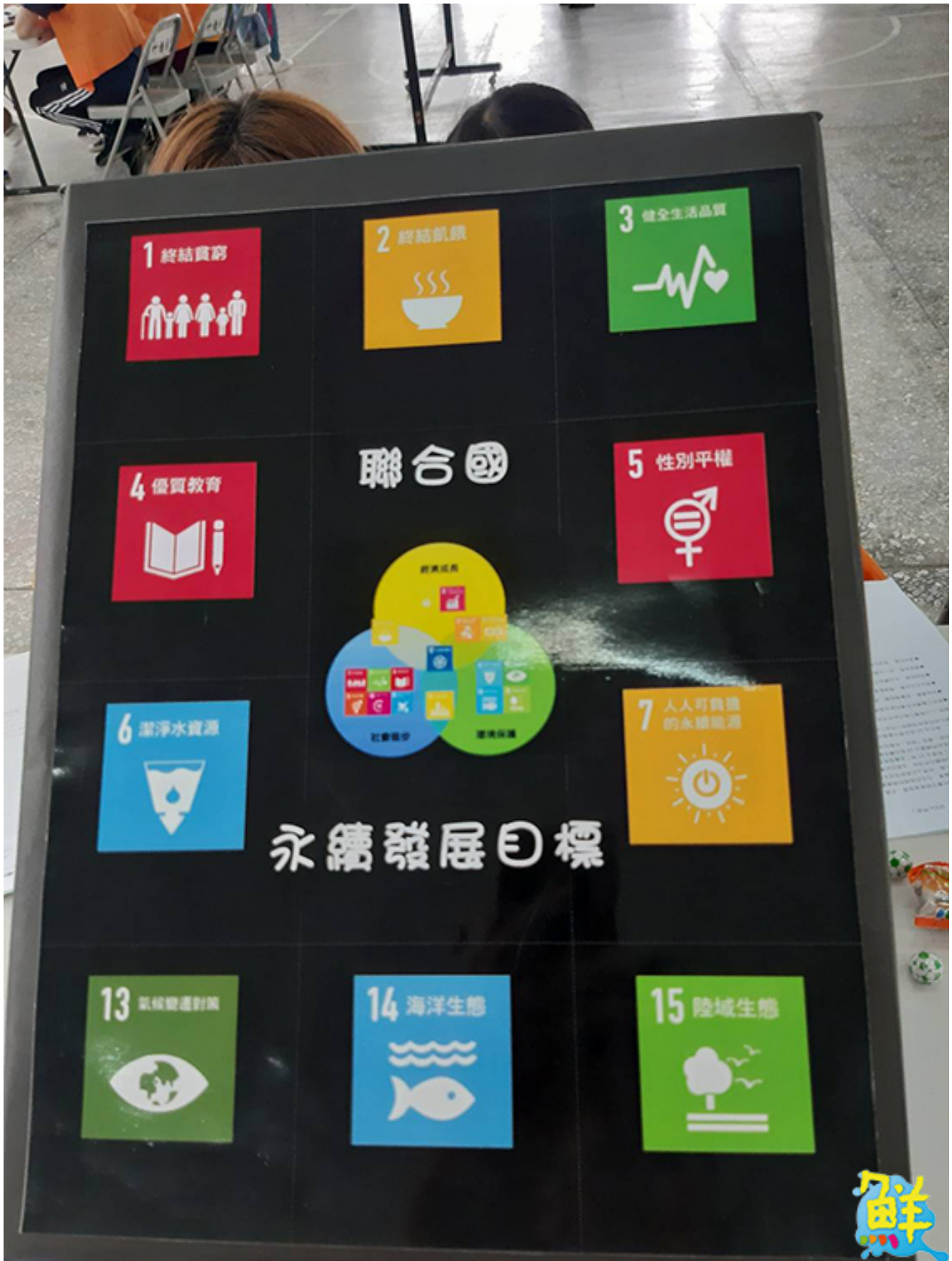
▲活動以聯合國的發展目標作為遊戲設計的主軸，鼓勵學員接受挑戰。