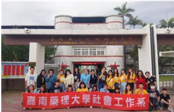
嘉藥社工系學生在竹橋國中舉辦「築夢人生財商營3.5」營隊活動