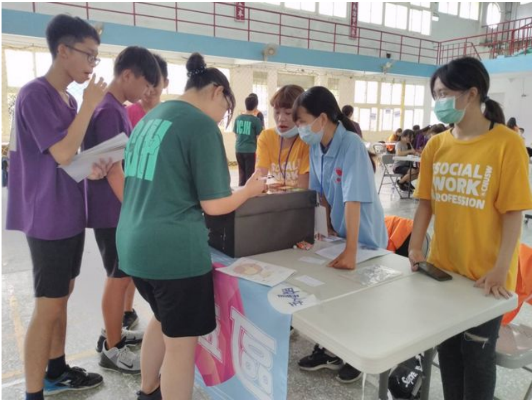
藉由活動學習面對問題找出圓夢方法。

嘉南藥理大學社會工作系與得勝者教育協會合作，在台新銀行公益慈善基金會贊助下，於5月19日在台南七股區竹橋國中舉辦「築夢人生財商營3.5」營隊活動，吸引超過40名的國中生參加，透過財務相關的情境模擬體驗，趁早讓學員學習正確金錢觀，希望讓每一個孩子擁有生命贏家應有的「素養」，期待用生命教育的態度，引導孩子建構良好的理財觀念，學習善用資源與人分享，成為能力與品格兼備的財商達人。