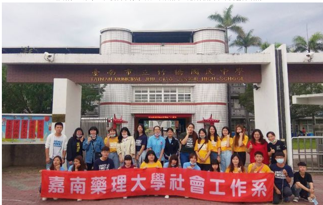
嘉藥社工系學生在竹橋國中舉辦「築夢人生財商營3.5」營隊活動。