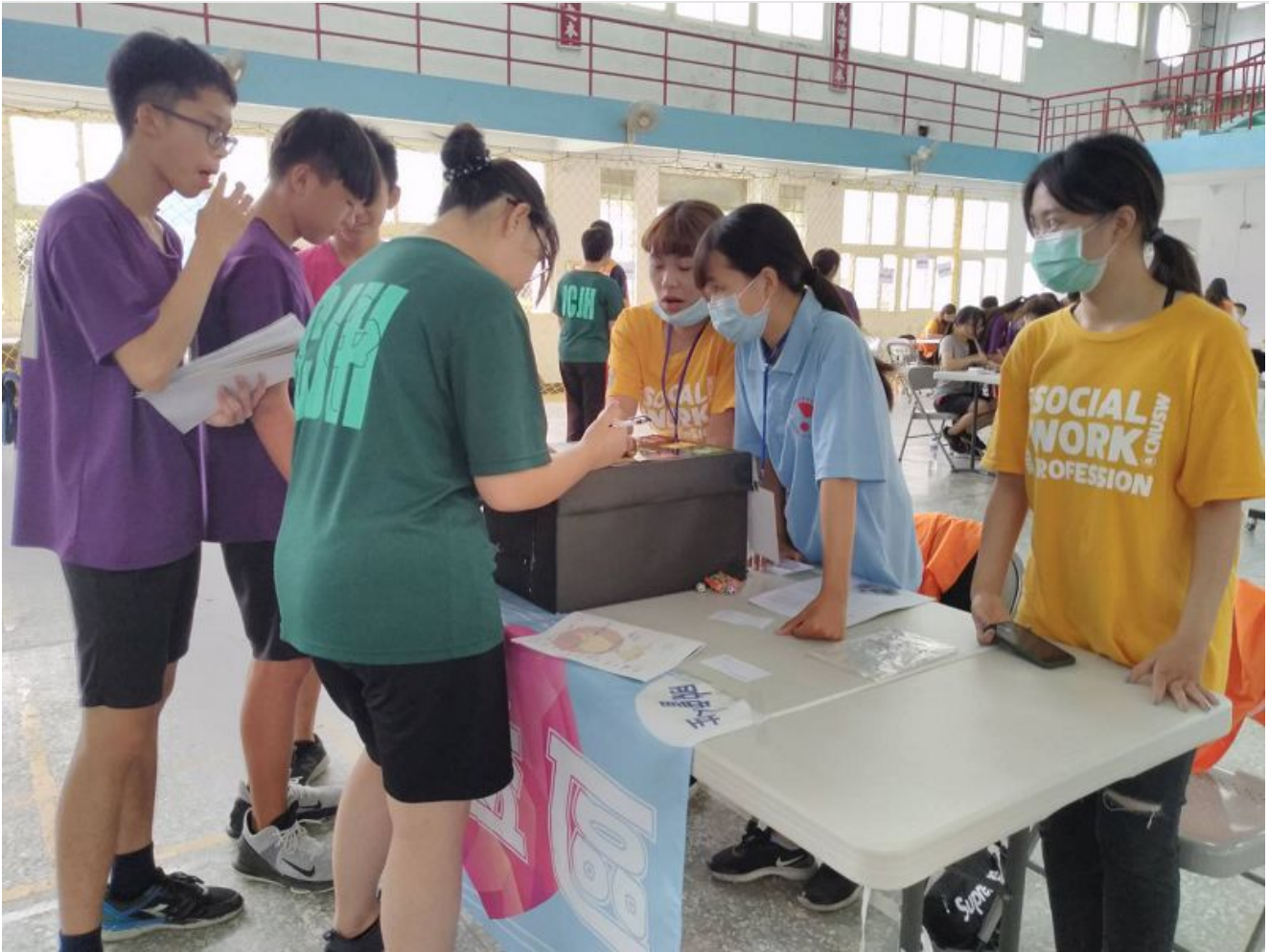
嘉南藥理大學社會工作系至竹橋國中舉辦財商體驗營活動。