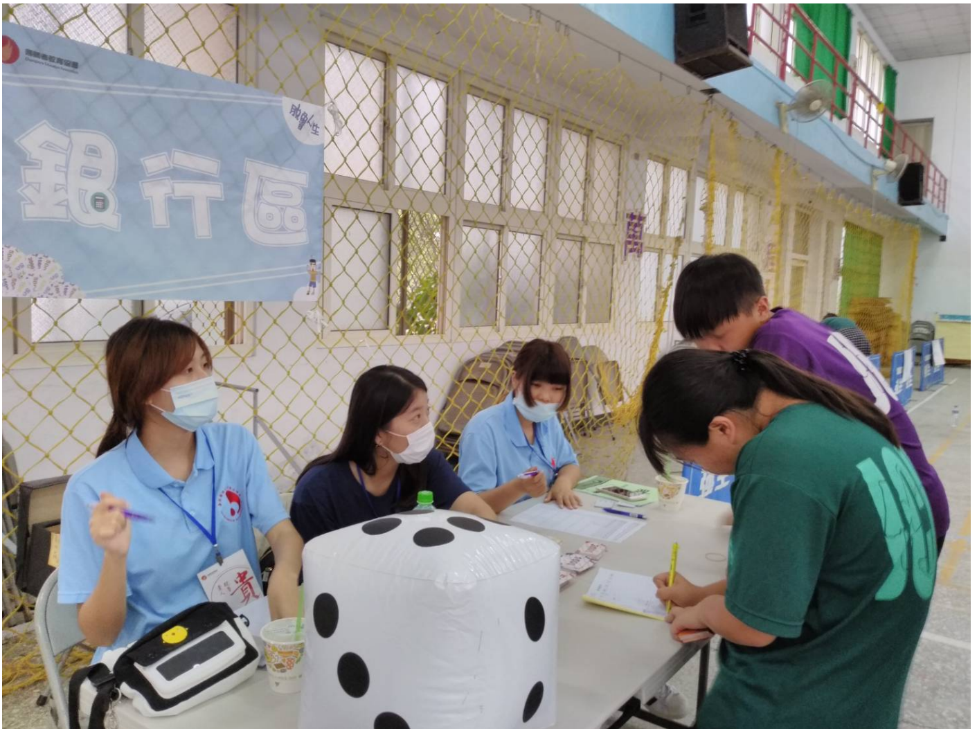
銀行區提供存錢、投資、信用卡使用相關業務體驗【圖/翻攝畫面】

用相關業務。等各組學員收集到足夠資源便可進行「築夢人生」的情境體驗，試著奪回家族夢想。「築夢人生」則是安排在「溫拿實驗室」中進行，歷時3.5小時的築夢模擬人生，涵蓋五大造夢區，並由築夢貴人來引導，讓參與學生們可以親身體驗，並從過程中學習面對問題，找出人生圓夢願景的有效方法。