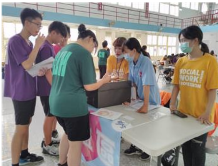
藉由活動學習面對問題找出圓夢方法