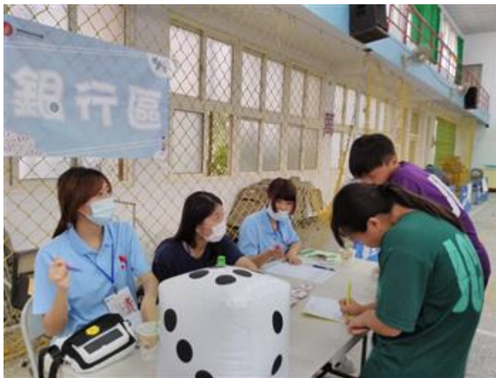
銀行區提供存錢、投資、信用卡使用相關業務體驗