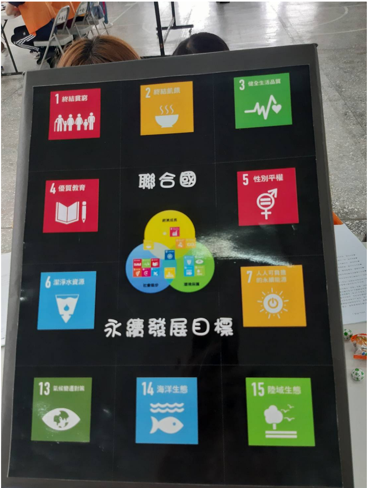
以聯合國的發展目標作為遊戲設計的主軸

這項活動由嘉藥社工系設計，並由社工系的大哥哥、大姊姊們來帶領，營隊活動內容豐富，先讓學員自主分工，並依照生活情境規劃出學習、銀行、工作、公益、消費五大區，銀行區提供存錢、投資、信用卡使