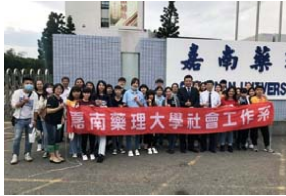
嘉藥社工系學生在校長李孫榮(右五)鼓勵下出發竹橋國中舉辦營隊活動。

【記者孫宜秋／南市報導】嘉南藥理大學社會工作系與得勝者教育協會合作，在台新銀行公益慈善基金會贊助下，於5月19日在台南七股區竹橋國中舉辦「築夢人生財商營3.5」營隊活動，吸引超過40名的國中生參加，透過財務相關的情境模擬體驗，趁早讓學員學習正確金錢觀，希望讓每一個孩子擁有生命贏家應有的「素