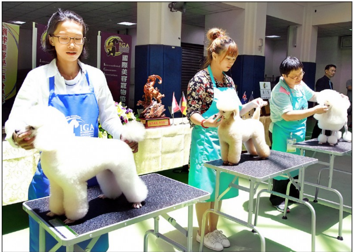
中華醫事科大成立特別的寵物美容系，深受學子歡迎。（記者吳俊鋒翻攝）

崑山科大電通系也因此受到不少年輕學子青睞，而一〇九學年度起，更將改名為智慧機器人工程系，著重於培育智慧製造的專業人才。