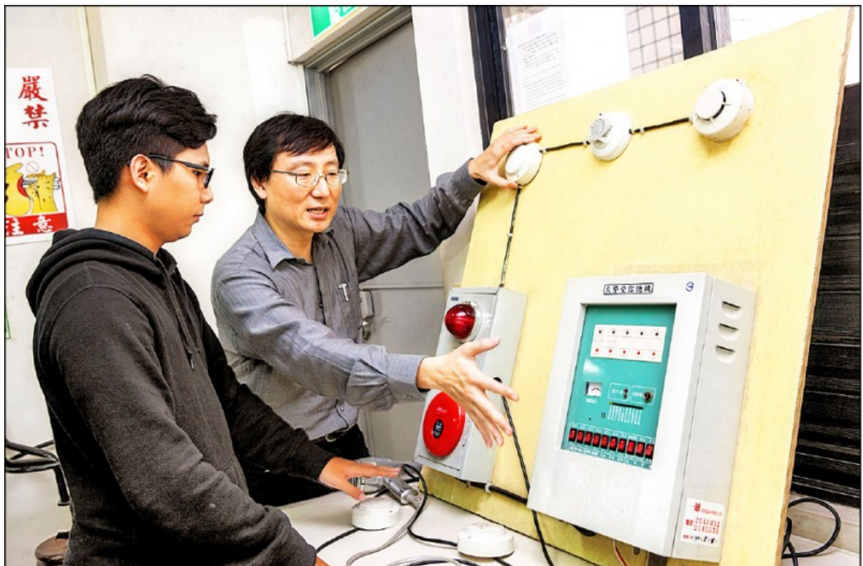
中華醫事科大成立特別的寵物美容系，深受學子歡迎。