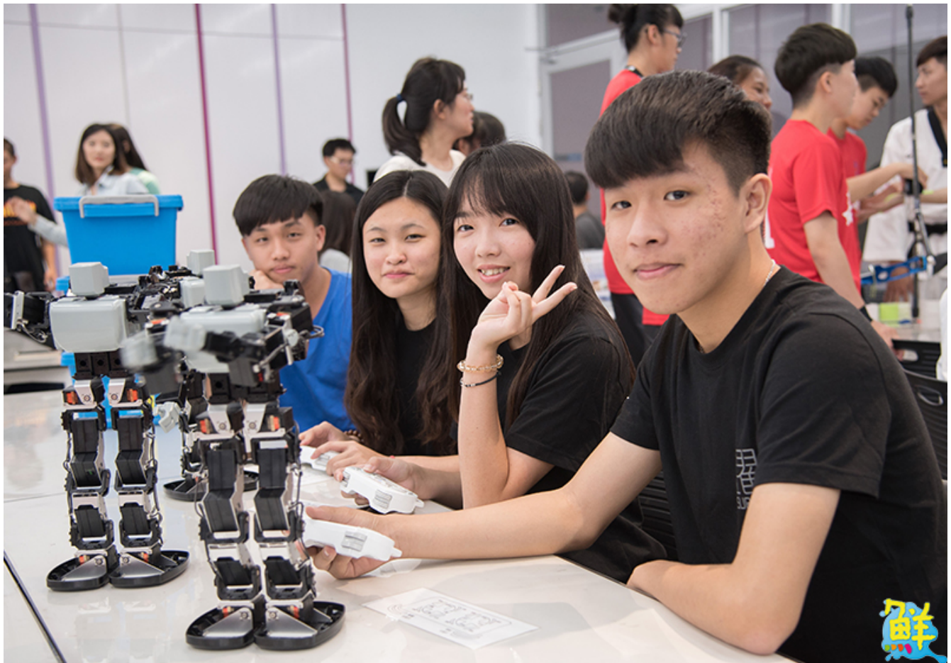
▲嘉藥配合政府推出產業新尖兵試辦計畫，鼓勵畢業生勇於挑戰為自己履歷加分。