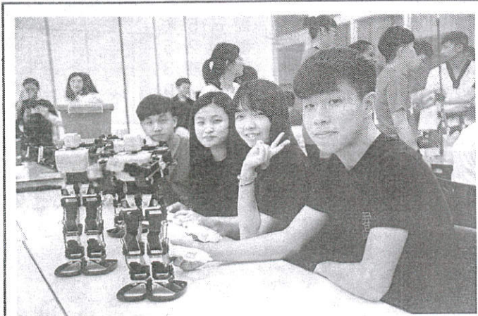
嘉藥配合政府推出產業新尖兵試辦計畫，鼓勵畢業生勇於挑戰為自己履歷加分。

在環保與循環經濟議題不斷升溫，也帶動環保產業蓬勃成長，根據20人力銀行資料顯示環保產業的人力仍供不應求。創系8年的嘉藥環工系，挾豐沛的畢業系友資源與完備的教學設施，再加上全國唯一的「再生水類產線與人才培育基地」，規劃修讀6學分環境工程核心專業課程，開設「多元專長培力課程」，提供已取得學士學位且對環保工作有興趣之人士培養第二專長及跨領域學習，進而投入具發展動能的環保產業職場機會。