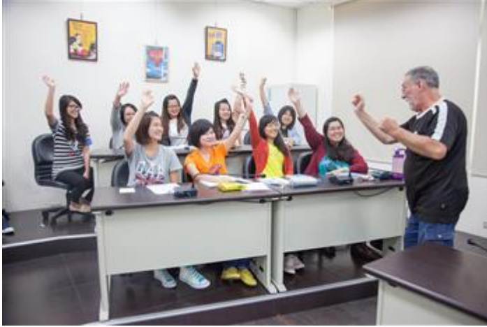
嘉藥外語系設置二年制安親美語學士後培力專班，協助畢業生培育相關專長