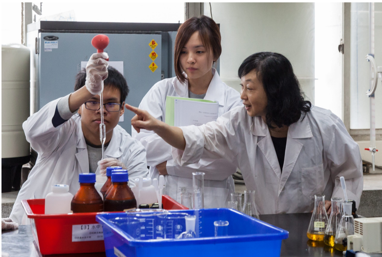
嘉藥環工系成立多元專長培力課程，提供對環保工作有興趣的人培養第二專長