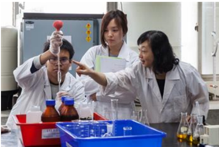
嘉藥環工系成立多元專長培力課程，提供對環保工作有興趣的人培養第二專長