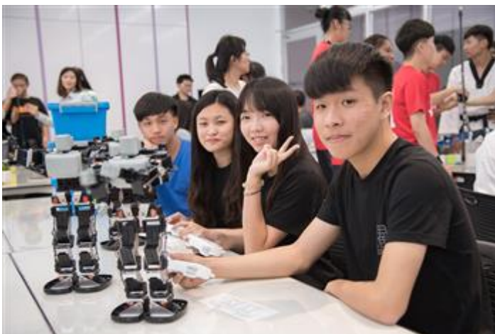
嘉藥配合政府推出產業新尖兵試辦計畫，鼓勵畢業生勇於挑