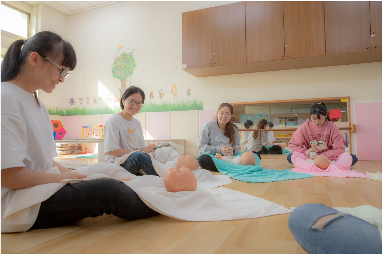
嘉藥成立雲林以南唯一的學士後學位學程教保員專班，培養教保專業人士

進入後疫情時代，內需產業的就業已開始恢復，為協助青年取得 5+2 產業及具發展前景製造業技術能力，提升職場競爭力以順利就業，嘉藥配合政府政策，結合勞動部訓練資源推出「產業新尖兵試辦計畫」，瞄準起薪3萬元以上的新興產業，開辦綠能科技、國際行銷企劃、數位資訊相關課程，如：機器人與遊戲設計專長培訓、水環境科技及水資源產業人才、Z世代佔心創意與數位行銷培訓等，鼓勵畢業生勇於挑戰為自己的履歷加分。值得一提的是，課程費用全額由政府補助，還可申請每月8,000元的學習獎勵金。