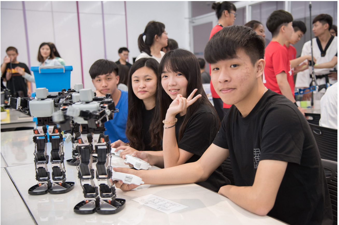
嘉藥配合政府推出產業新尖兵試辦計畫，鼓勵畢業生勇於挑戰為自己履歷加分【圖/翻攝畫面】

除了幼保專業人才外，目前兒童課後安親及學習美語仍有極高需求，在教育部公布「兒童課後照顧服務班級中心管理辦法」，明定課後照顧服務人員需接受相關課程訓練以及應考證照後，應用外語系便設置「二年制安親美語學士後雙專長培力課程專班」，希望能協助大學畢業生培育該領域的就業專長，接受相關英美語課程教學訓練及應考安親與美語教學（例如TKT國際證照）相關證照取得，增加其競爭力，為自己的履歷加分。