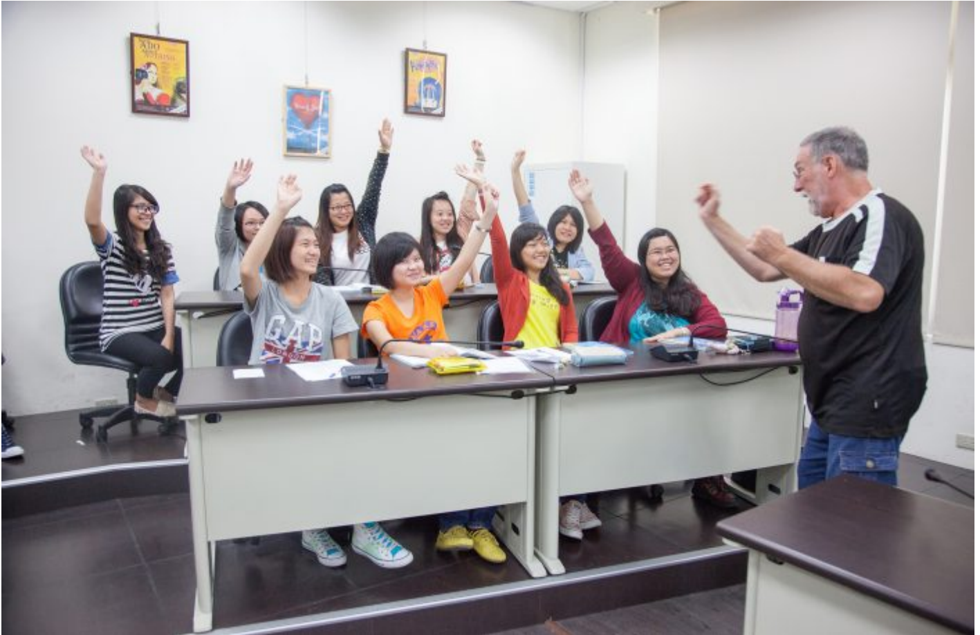
嘉藥外語系設置二年制安親美語學士後培力專班，協助畢業生培育相關專長