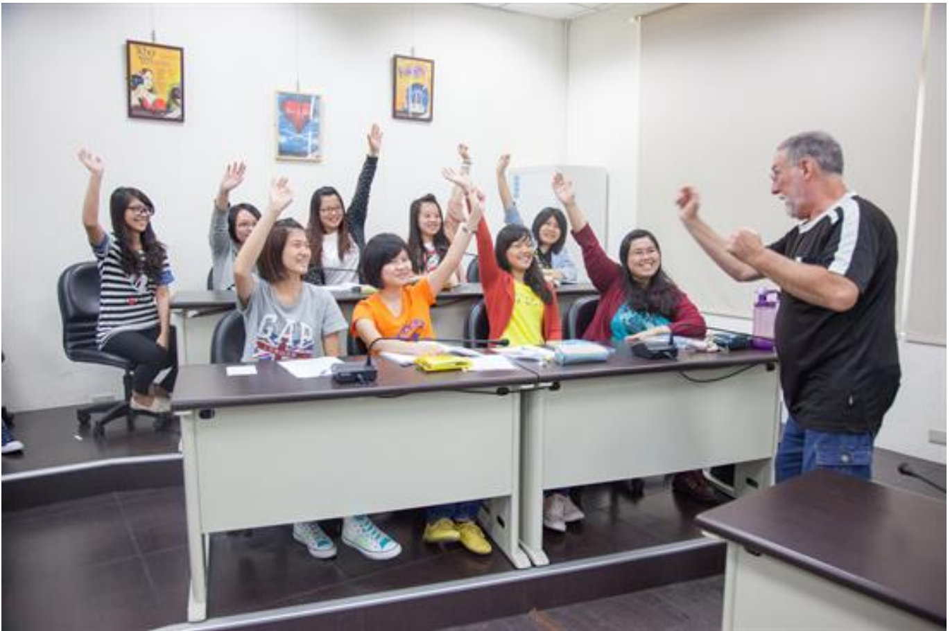
嘉藥「就業充電站」助你迫降黃金職場

(中央社訊息服務20200629 10:07:50)嘉藥瞄準後疫情時代的就業市場，一連推出針對職涯培力再造等多項職訓課程與計畫，包括最夯的產業新尖兵、今年甫獲准成立教保員專班及安親美語雙專長課程和環境工程與科學系多元專長培力課程，不論是應屆畢業生或是希望再增能的人士，都可在嘉藥就業充電站中找到再出發的動力，也為國家新發展產業培育人才。