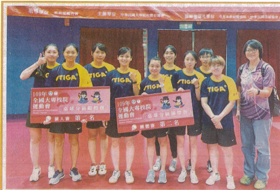
← 嘉藥羽球及桌球隊傳佳績，成功取得全大專運總決賽門票！