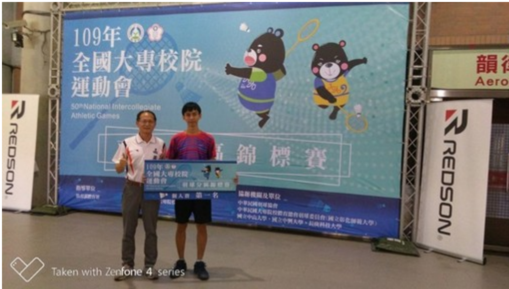
Taken with Zenfone 4 series

心與努力外，面對10月底的全大運總決賽，她也期許選手們以認真拼戰精神，在全大運總決賽拿下更佳成績。