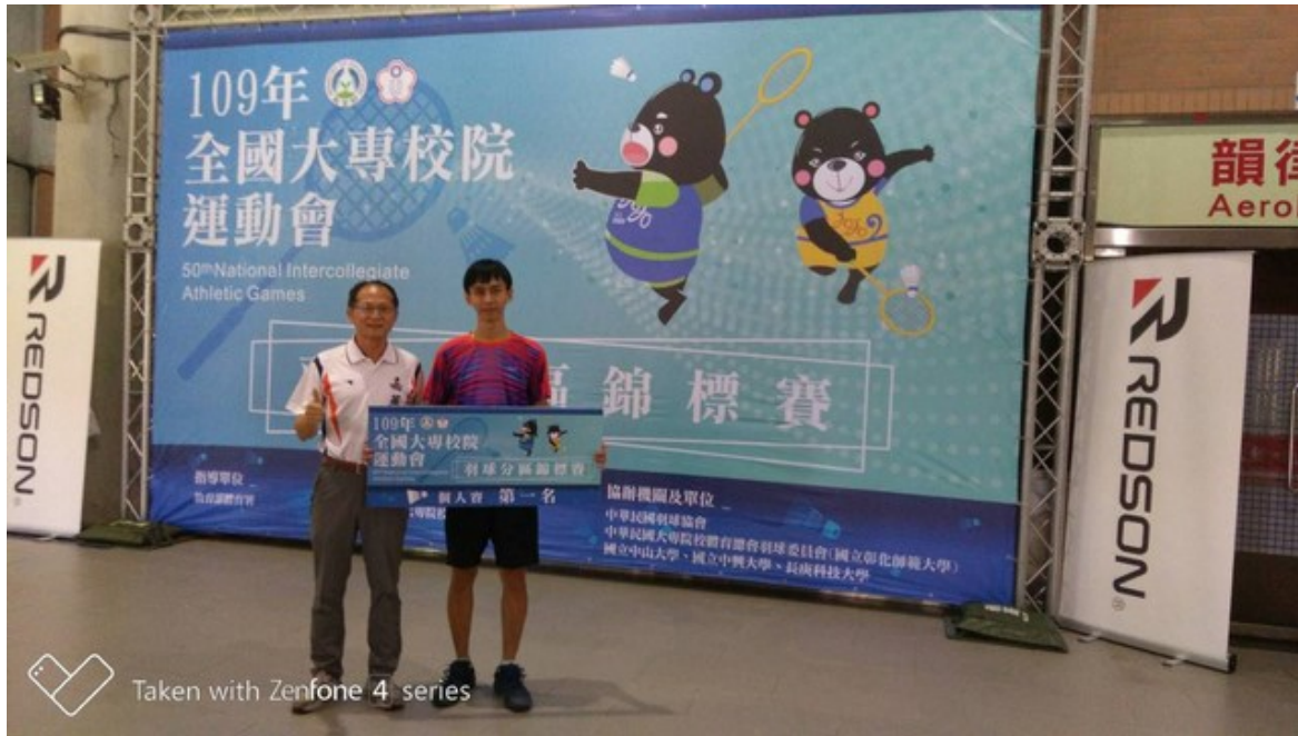
Taken with Zenfone 4 series

顧到，要參加選手抱持著平常心應戰，以表現出最佳狀態。在得知羽球隊、桌球隊捷報，除了感謝教練與選手的用心與努力外，面對10月底的全大運總決賽，她也期許選手們以認真拼戰精神，在全大運總決賽拿下更佳的成绩。