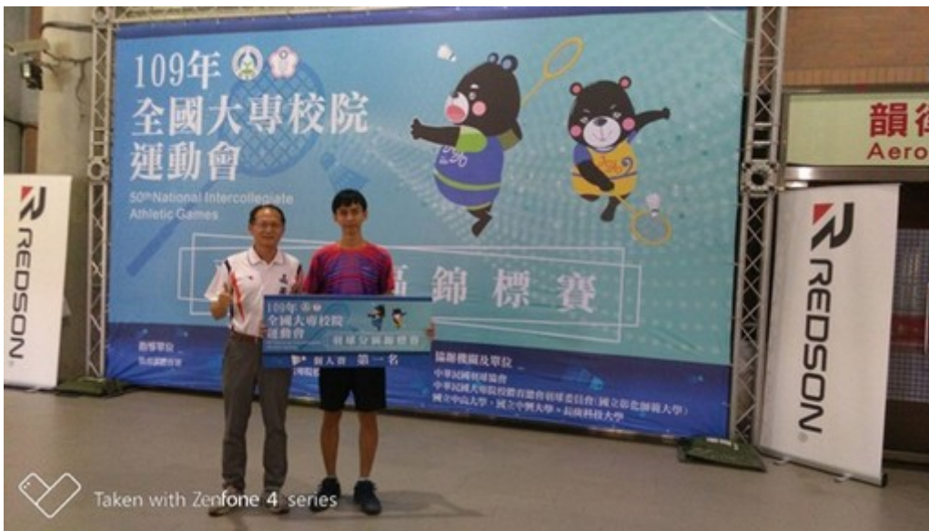
Taken with Zenfone 4 series

心與努力外，面對10月底的全大運總決賽，她也期許選手們以認真拼戰精神，在全大運總決賽拿下更佳的成绩。