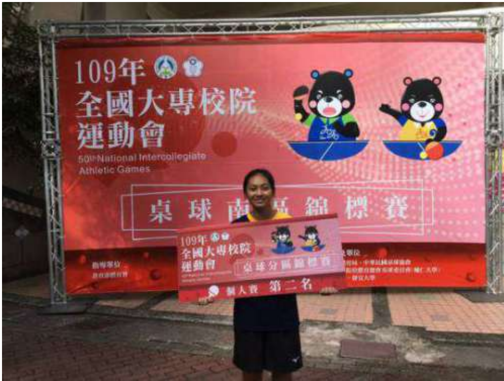
▲嘉藥羽球及桌球隊成功取得全大專運總決賽門票