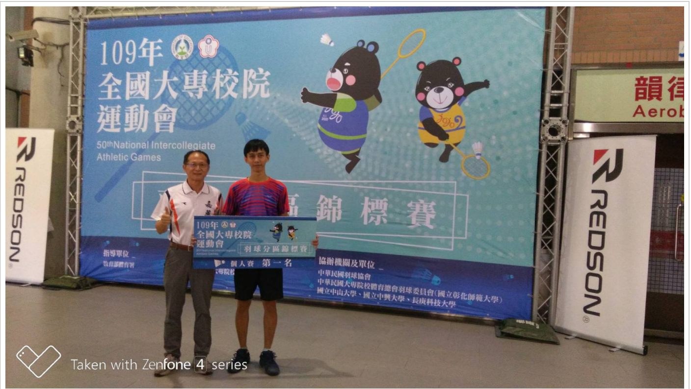
Taken with Zenfone 4 series