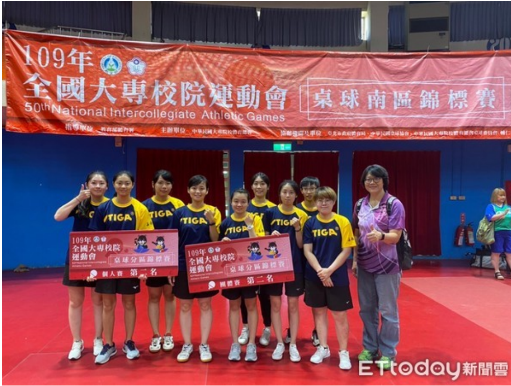
▲嘉藥羽球及桌球隊傳佳績，為10月底的全國大專運動會總決賽邁出成功的第一步，全校師生為之歡欣鼓舞。