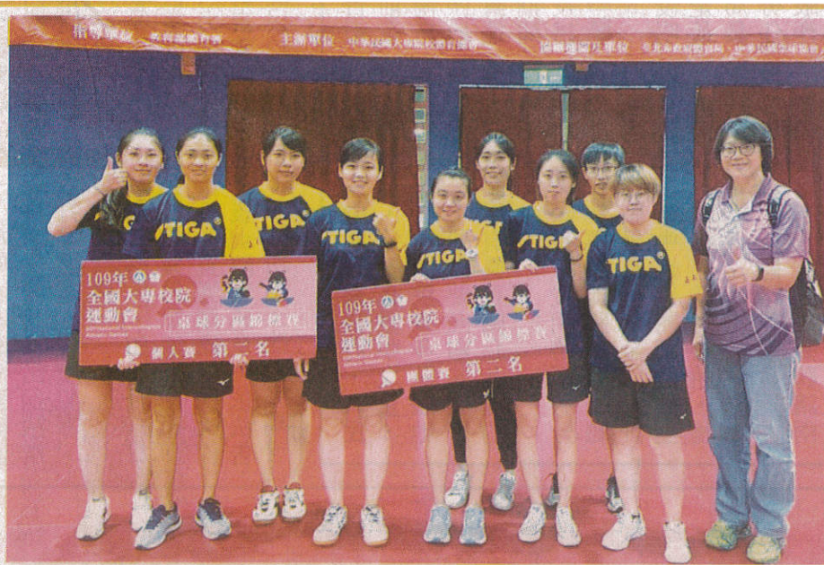
← 嘉藥羽球及桌球隊傳佳績，成功取得全大專運總決賽門票！