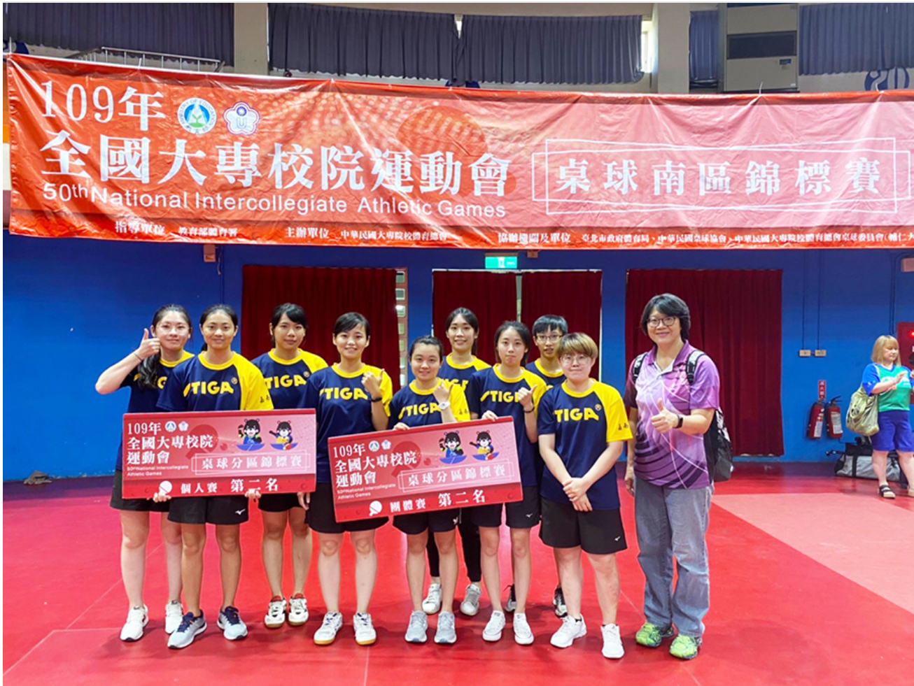
嘉藥代表隊參加全大運南區錦標賽傳捷報。