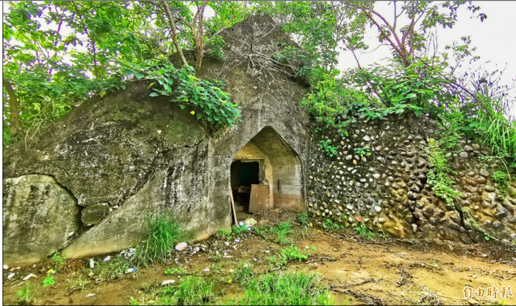
較小的彈藥庫，未被破壞，外型仍保留完整。

不用抽 不用搶 現在用APP看新聞 保證天天中獎 點我下載APP 按我看活動辦法