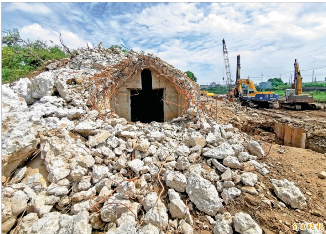
日治時期的軍火庫，因三爺溪的整治工程，掩體遭到破壞。（記者吳俊鋒攝）