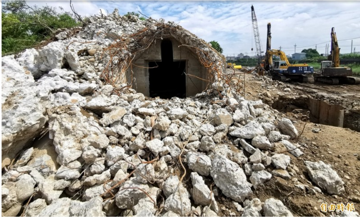
三爺溪整治工程，讓日治時期的軍火庫遭到破壞，地方搶救。