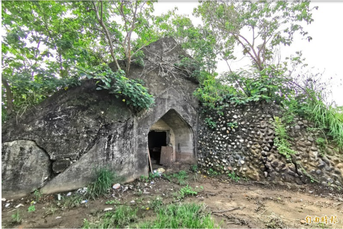
三爺溪整治工程，讓日治時期的軍火庫遭到破壞，地方搶救。