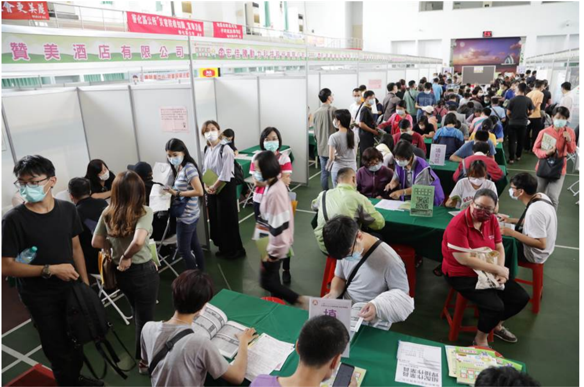
台南市勞工局今天舉行年度第2場就業博覽會，吸引民眾前來。