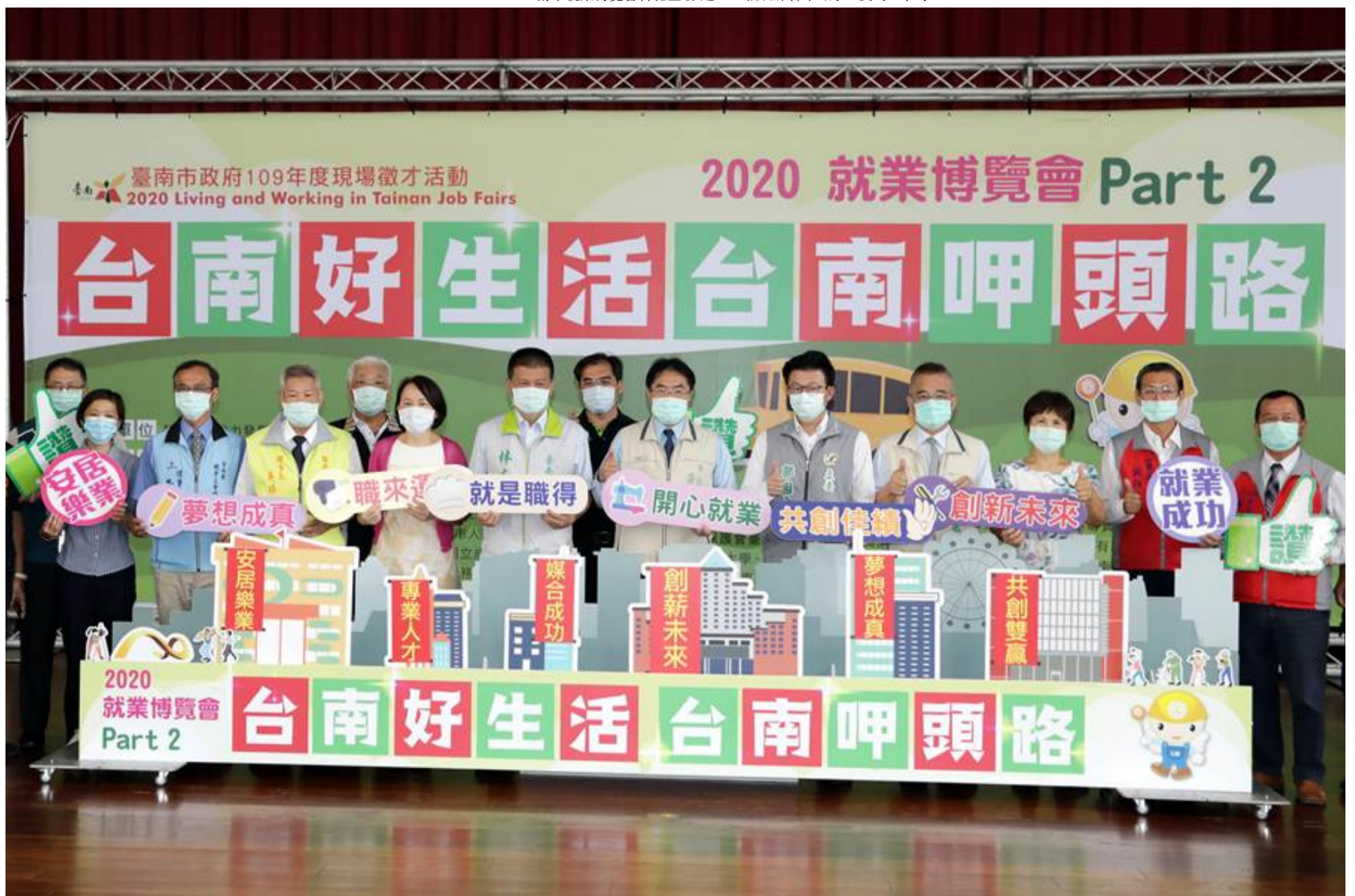
台南市年度第2場就業博覽會提供6653個職缺，媒合率達5成6。

台南市政府15日在善化區文康育樂中心舉行今年第2場大型徵才活動「台南好生活、台南呷頭路」就業博覽會，現場共有包括台積電、長榮鋼鐵、生達化學製藥、大潤發、美廉社等73家廠商釋出6653工作機會，其中月薪超過3萬的就有2860個職缺，吸引近千位民眾前來謀職，媒合率達5成6。