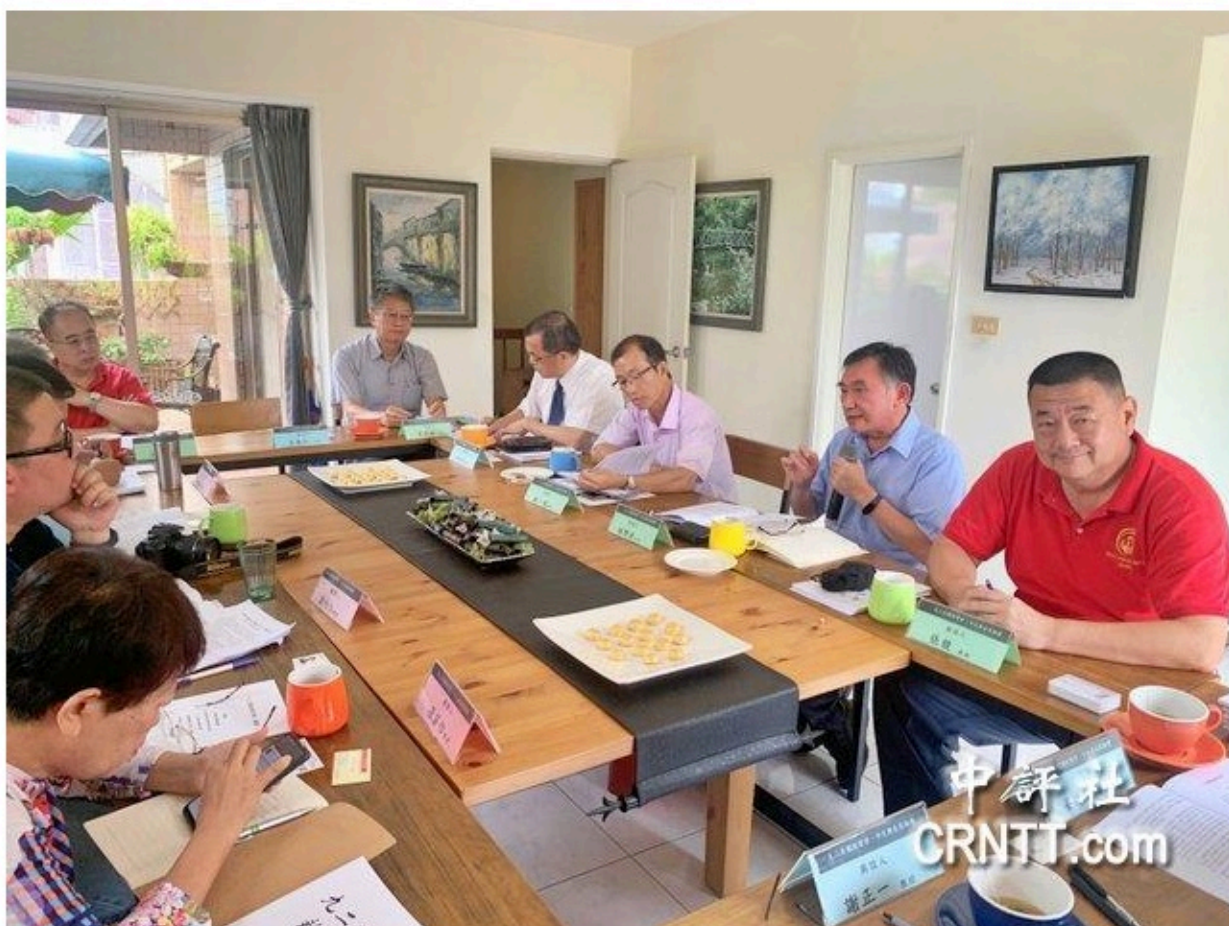
“九二共識台灣觀點”座談會現場。（中評社 方敬為攝）

http://www.CRNTT.com 2020-08-17 11:01:41