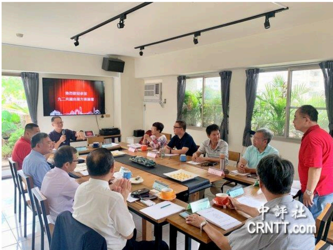
“九二共識台灣觀點”座談會現場。(中評社 方敬為攝)

http://www.CRNTT.com 2020-08-17 11:01:41