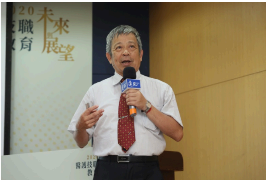
圖 / 中華技職教育學會理事長陳德華專題演講「疫後領航員：台灣醫護專才新未來」，分享技職培育體制應開放招收高中生。

衛生福利部醫事司司長石崇良以「抗疫最前線：台灣醫護Can Help」為題，分享我國防疫政策及省思。這波疫情對我國醫療體系形成挑戰，影響遍及健康照護、就醫行為、照護模式、經濟財務和關鍵資源掌握。策略上，首要減緩散播速度，避免短時間內感染個案暴增衝擊醫療體系，其次是保全核心人力維持醫療體系運作，第三是擴充量能降低重症及死亡人數。也敦促國人重新思考需要與需求、追求高效率壓縮人力、分級醫療等議題。