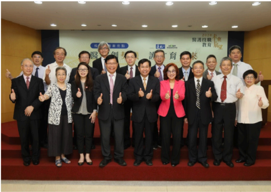
圖 / 8月17日，由《遠見》及台灣健康管理學會主辦 2020醫護技職教育展望論壇，匯聚全國各醫事科大及醫藥衛護單位代表，共商防疫醫護專才新標準，強化醫事技職教育。