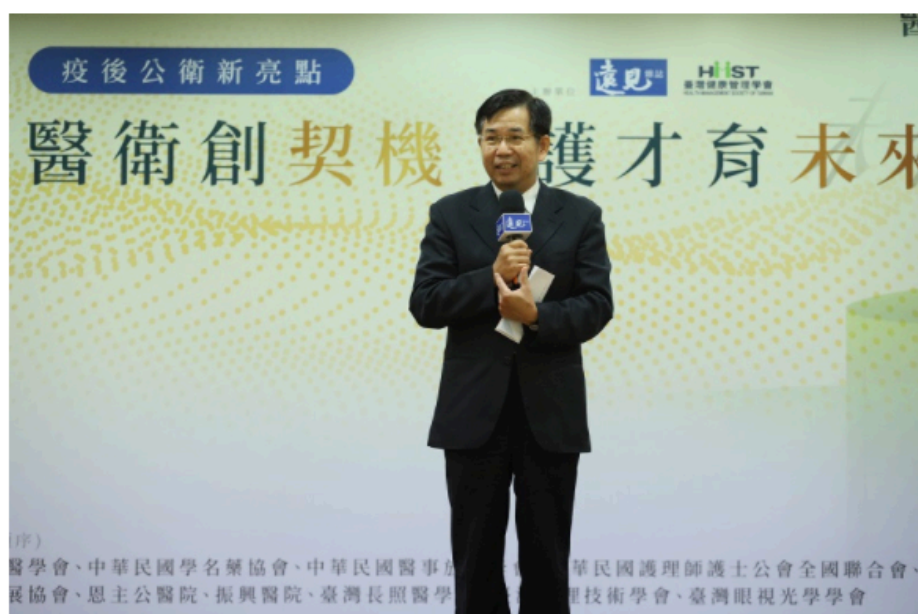
圖 / 教育部長潘文忠出席論壇表示，教育部將持續與衛福部就醫護人才培育進行整體檢視，從專案計畫著手。

由《遠見雜誌》與臺灣健康管理學會合作，於8月17日主辦「醫衛創契機 護才育未來」2020醫護技職教育展望論壇，匯聚來自全國醫事科大及醫藥護衛單位代表，搭建了一場「公衛」與「教育」的對話交流平台。論壇開場即由《遠見雜誌》社長楊瑪利點出臺灣防疫超前部署並領先全球，但卻面臨兩大隱憂，一是新冠肺炎疫情的持續控制；遠患是2026年超高齡社會將至，醫事人力是否足夠支應長照？