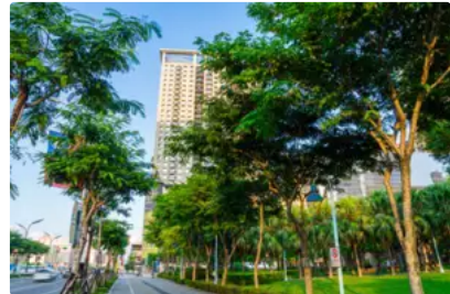
日本牙醫師遺愛 跨海捐贈溫暖台南家扶