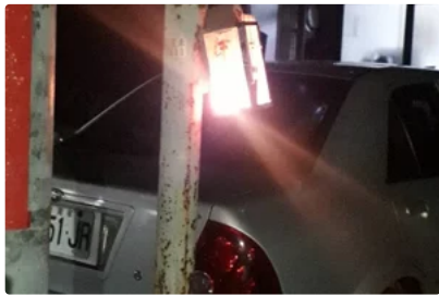
傳統習俗式微！高雄岡山老店今年只賣出3盞普度公燈