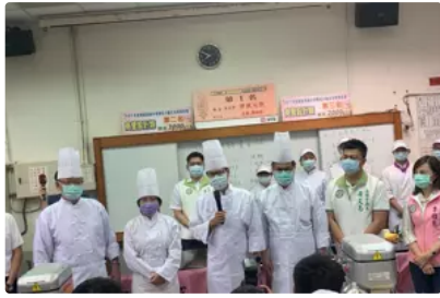
中小學開學！陳其邁到校園宣導防疫 做月餅推技職教育