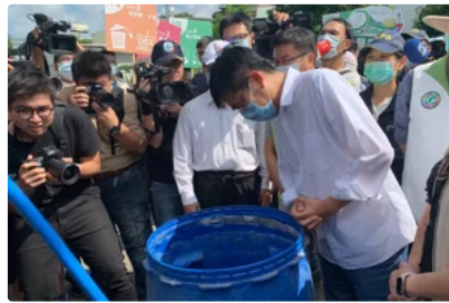
雨後戒備！陳其邁：高雄397登革熱高風險場域加強巡檢