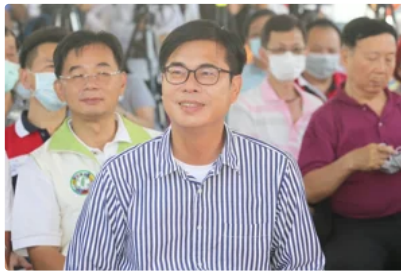
雄中人大集合 陳其邁小內閣互稱學長、學弟好親切