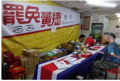
提議書百餘份不符規定 罷捷社團依規定十日內補齊