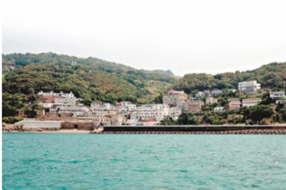
馬祖學校師資仍缺 盼開學前順利招募