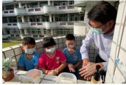
影／開學日 潘孟安要求縣內校園開學防疫「不能怠慢」