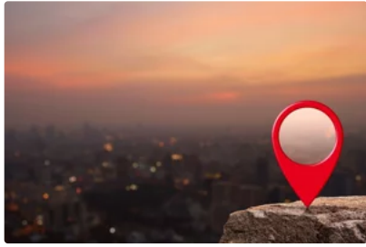
「高雄」是個好標籤嗎？北漂樂團現身說法