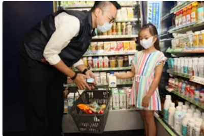
家扶：2成4弱勢兒少未每天吃三餐 逾3成「有得吃就好」