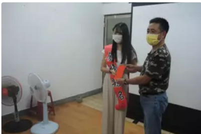
金門家扶頒大專新鮮人獎助學金 貼補就學費用如及時雨