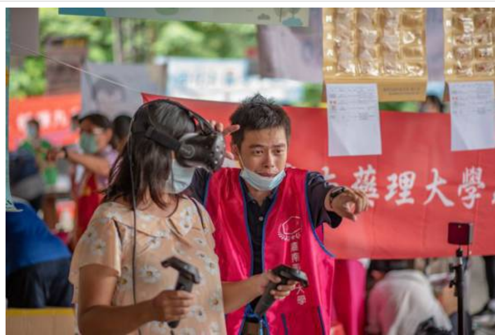
▲ 2020心理健康家園活動 與嘉藥一起守護健康