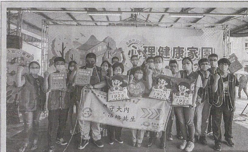
嘉藥師生參加2020心理健康家園活動與民眾一起守護健康。

【記者孫紹逸／南市報導】隨著高齡化社會來臨，長者的醫療照護及衛教日益重要，嘉南藥理大學藥理學院與人文暨資訊學院師生組成跨領域團隊，參加由臺南市政府衛生局在大內區青果市場舉辦的「臺南市2020心理健康家園活動」，透過有趣的桌遊及VR體驗活動來增進民眾健康照護及衛教知識，現場超過200名以上名民眾共襄盛舉，不僅民眾大呼有趣又能學到知識，參與活動的學生也在與民眾的互動中吸收經驗，成就感滿滿。