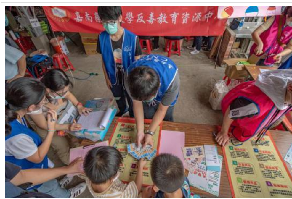
▲ 2020心理健康家園活動 與嘉藥一起守護健康