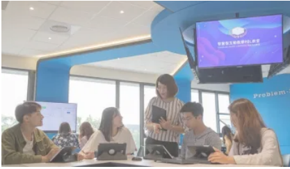
狂賀嘉藥喜事連連 入選台灣最佳 大學 志願私立科大前五強