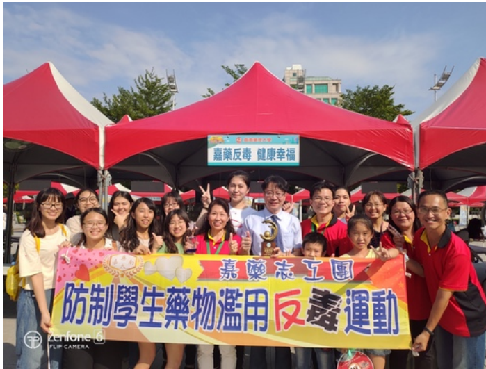
嘉藥反毒宣導獲選為績優單位蟬聯四連霸，高達10次獲獎紀錄.jpg