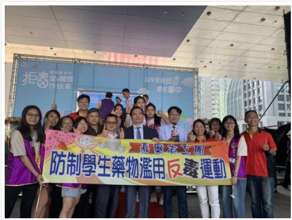
▲ 嘉藥反毒十全十美，榮獲教育部表揚

教育部為落實防制學生藥物濫用宣導，加強師生瞭解社會新型態毒品氾濫與危害，日前於臺中市政府前廣場舉行「拒毒健康新世代、愛與關懷作伙來」反毒設攤宣導博覽會，並於當日頒獎典禮公開表揚嘉勉績優有功單位。台南嘉南藥理大學，配合政府「新世代反毒行動綱領」，辦理一系列校內外頗具創新多元宣教活動，績效卓越、深獲肯定，被評選為績優學校；這不僅是該校連續4年贏得此項殊榮，更是累計10度獲獎，其傑出表現，相當難能可貴。