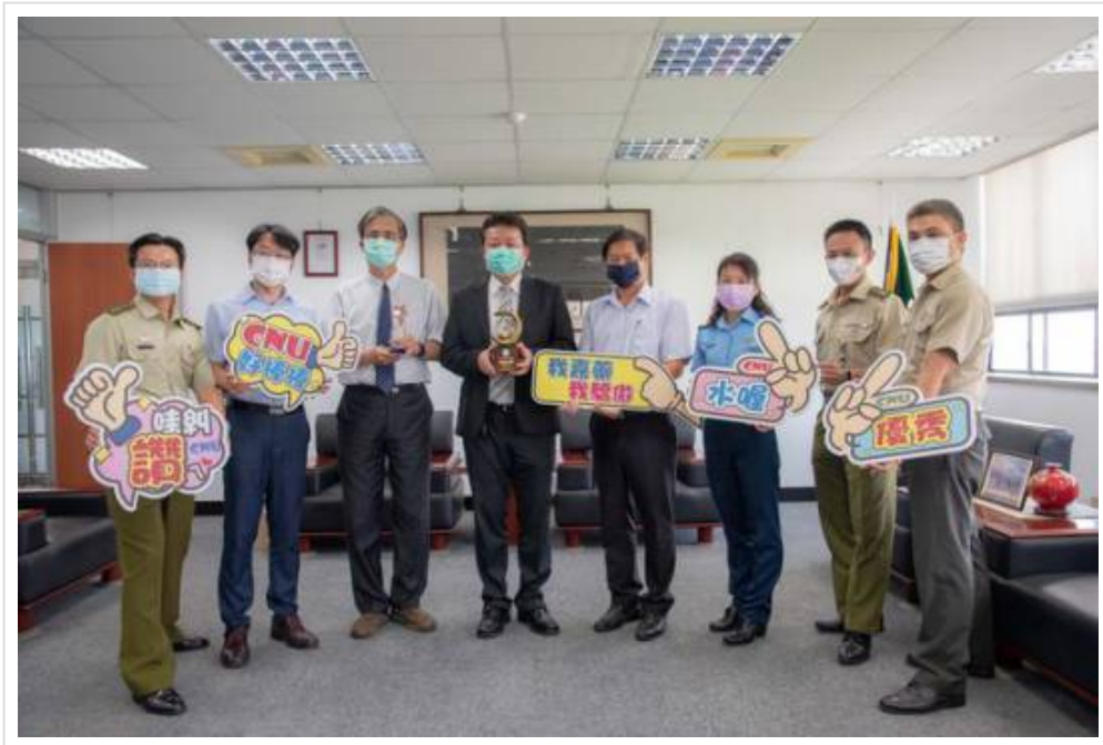
▲ 嘉藥反毒十全十美，榮獲教育部表揚