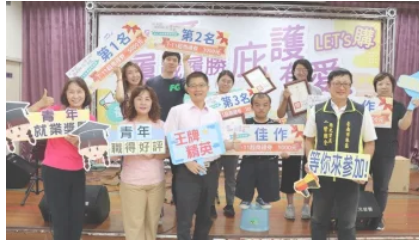
台南就業中心辦「履歷競賽」高 雄龐大龐屆生 拿下冠軍