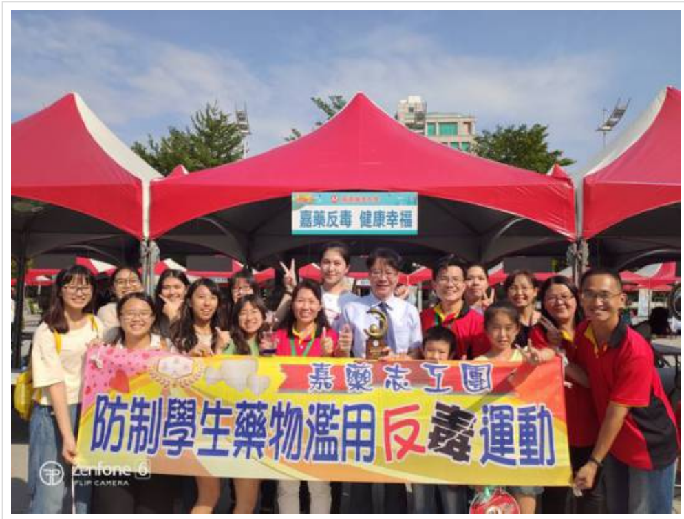
▲ 嘉藥反毒十全十美，榮獲教育部表揚