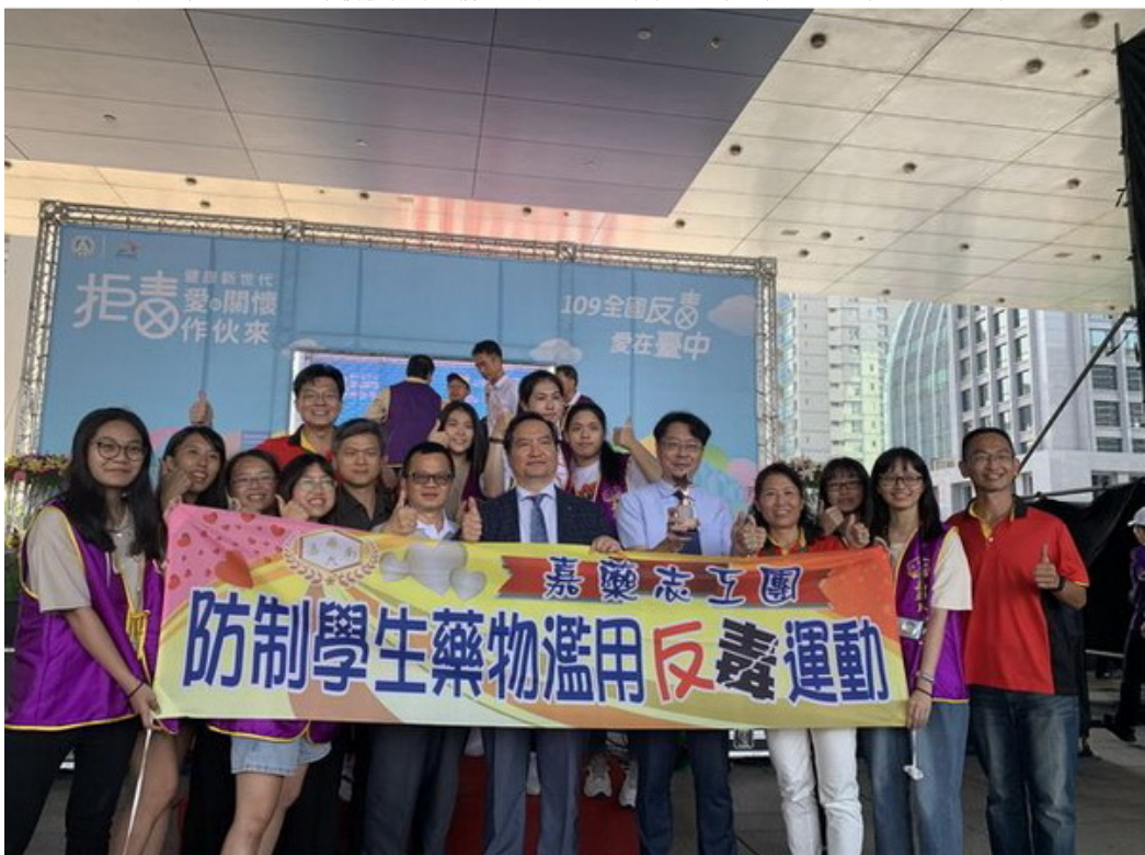
嘉藥獲選為反毒績優學校榮獲教育部表揚。