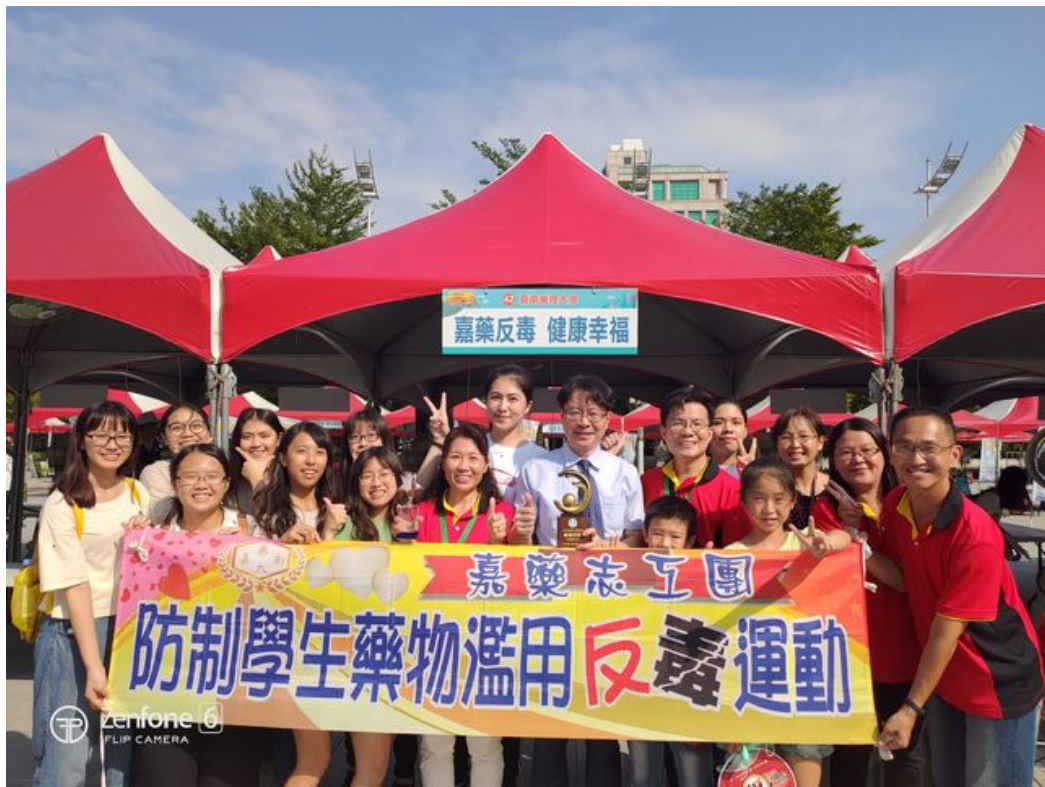
嘉藥反毒宣導獲選為績優單位蟬聯四連霸，高達10次獲獎紀錄。

教育部為落實防制學生藥物濫用宣導，加強師生瞭解社會新形態毒品氾濫與危害，日前於臺中市政府前廣場舉行「拒毒健康新世代、愛與關懷作伙來」反毒設攤宣導博覽會，並於當日頒獎典禮公開表揚嘉勉績優有功單位。台南嘉南藥理大學，配合政府「新世代反毒行動綱領」，辦理一系列校內外頗具創新多元宣教活動，績效卓越、深獲肯定，被評選為績優學校；這不僅是該校連續4年贏得此項殊榮，更是累計10度獲獎，其傑出表現，相當難能可貴。