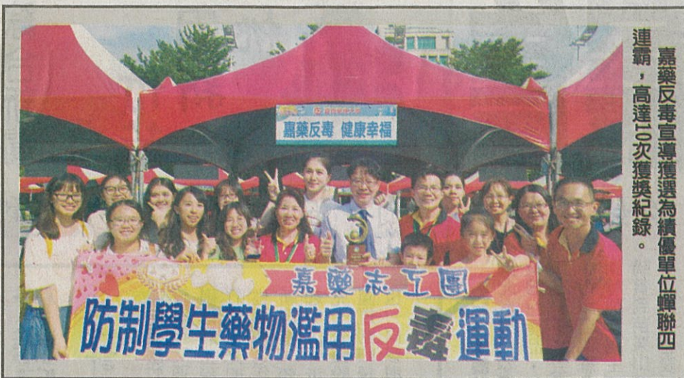
嘉藥反毒宣導獲選為績優單位蟬聯四連霸，高達10次獲獎紀錄。