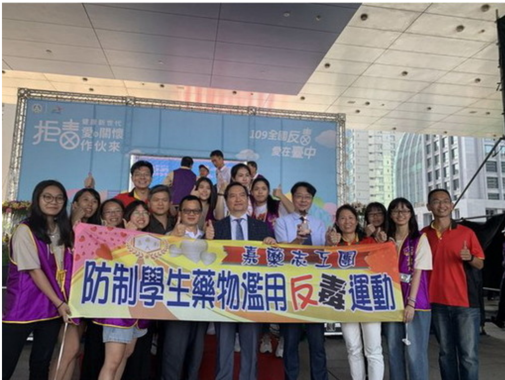
圖1：嘉藥獲選為反毒績優學校榮獲教育部表揚。