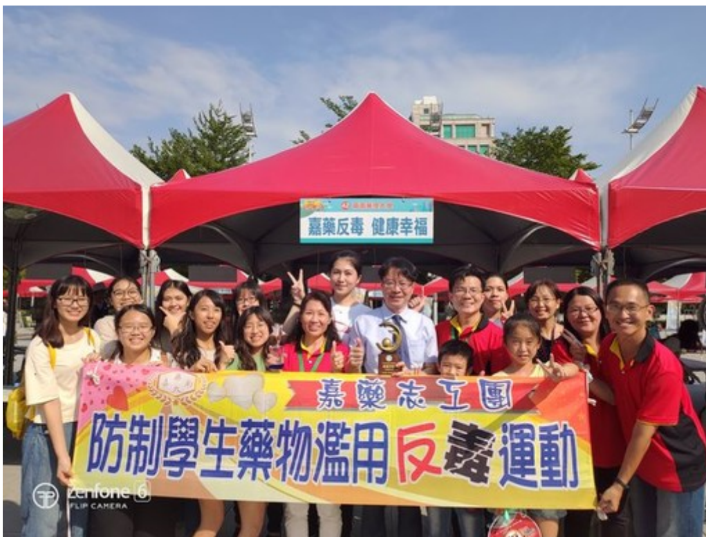
圖2：嘉藥反毒宣導獲選為績優單位蟬聯四連霸，高達10次獲獎紀錄。