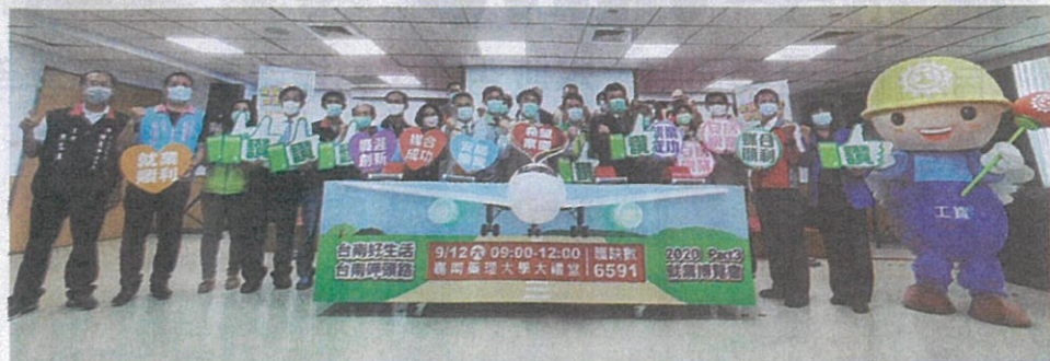
「台南好生活 台南呷頭路」行前記者會，由市長黃偉哲宣布第三場就博會即將舉辦的好消息，共65家廠商，提供6,591個工作機會。

為響應節能減碳，求職民眾當日可搭乘台南市公車5號或大台南公車紅3到嘉南藥理大學(大臺南公車系統 http://tourguide.tainan.gov.tw/ )，或搭乘火車至保安火車站，騎乘T-BIKE約5分鐘可抵達嘉南藥理大學，敬請民眾把握機會，9/12一起到嘉南藥理大學找頭路。