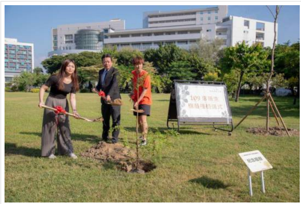
▲開學首日 從早到晚都精彩 嘉藥「秘境」等您一探究竟

新學期新氣象，開學首日，嘉南藥理大學以一系列活動拉開序幕，從一早活力陽光中的「早安、您好」活動、109級新生植樹、嶄新學生餐廳登場到溫柔夕陽下的「秘境」音樂會，就是要帶動謙和禮貌風氣，讓所有嘉藥學子感受到熱情、活力與創新的校園氛圍，不僅要讓學習更快樂，也要開闊學子視野與美感。