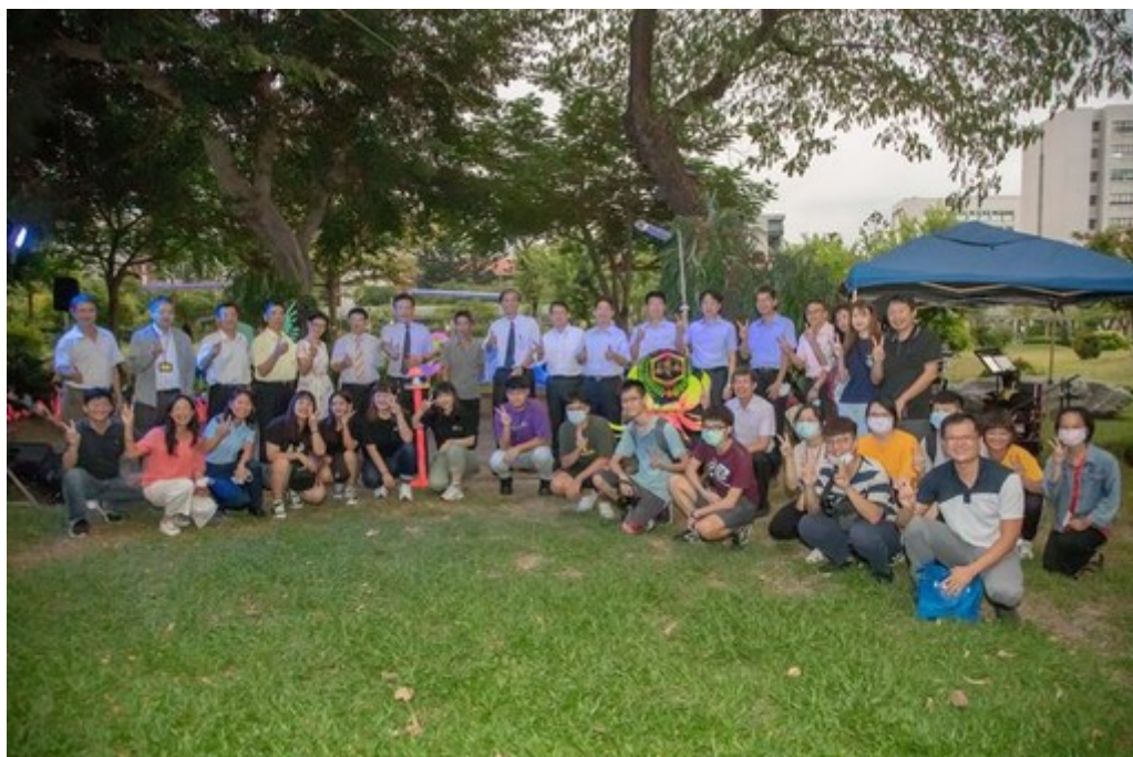
圖3：嘉藥秘境點燈音樂會吸引眾多師生共襄盛舉。