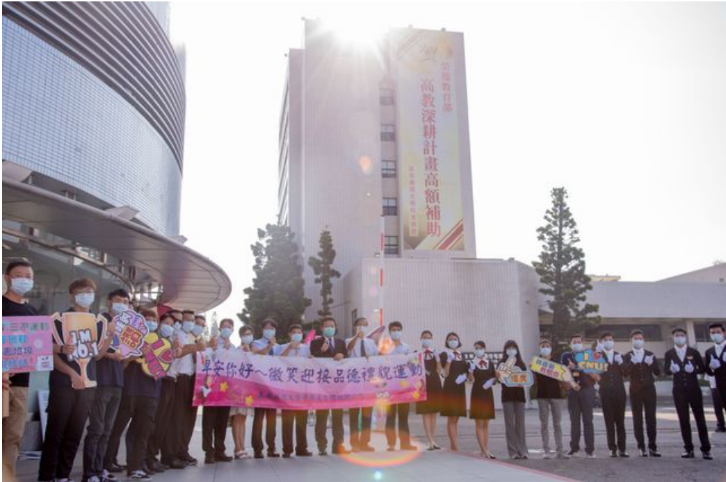
開學首日嘉藥師長齊聚校門迎接學生上學。

新學期新氣象，開學首日，嘉南藥理大學以一系列活動拉開序幕，從一早活力陽光中的「早安、您好」活動、109級新生植樹、嶄新學生餐廳登場到溫柔夕陽下的「秘境」音樂會，就是要帶動謙和禮貌風氣，讓所有嘉藥學子感受到熱情、活力與創新的校園氛圍，不僅要讓學習更快樂，也要開闊學子視野與美感。