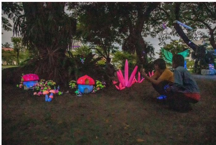
夜晚的秘境吸引嘉藥學生前來拍照