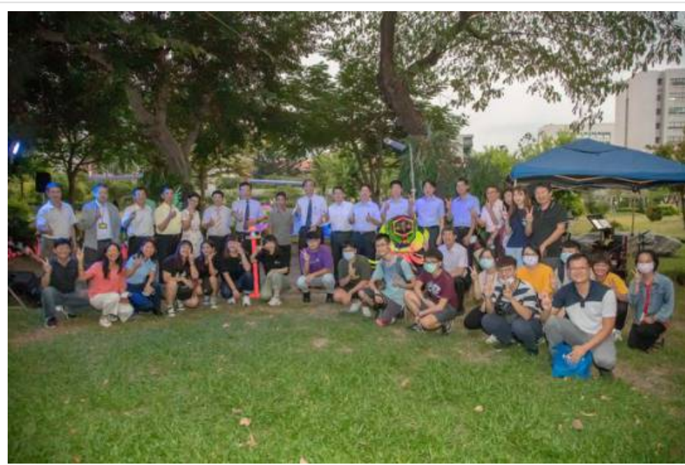
▲開學首日 從早到晚都精彩 嘉藥「秘境」 等您一探究竟