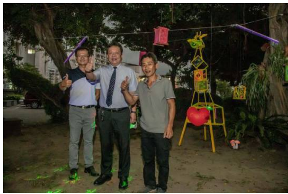
▲開學首日 從早到晚都精彩 嘉藥「秘境」 等您一探究竟