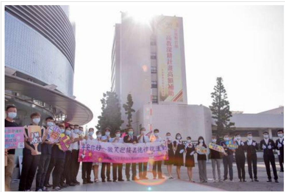
▲開學首日 從早到晚都精彩 嘉藥「秘境」等您一探究竟