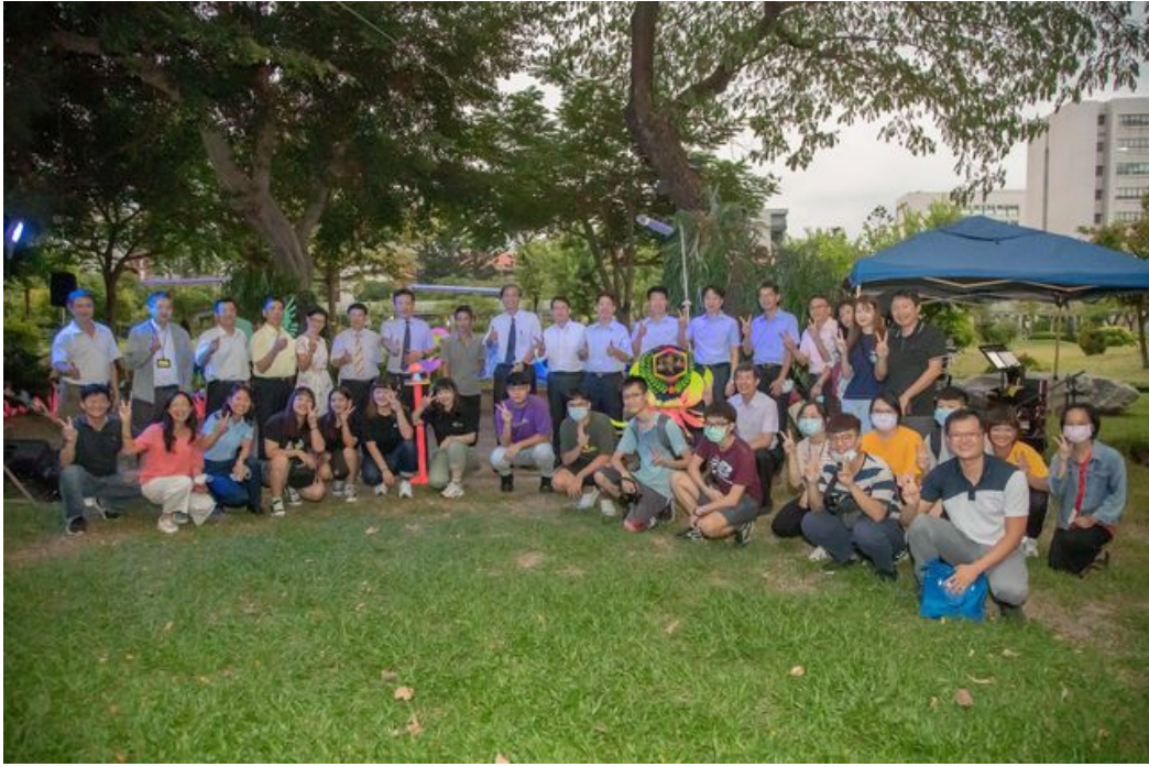
嘉藥秘境點燈音樂會吸引眾多師生共襄盛舉。