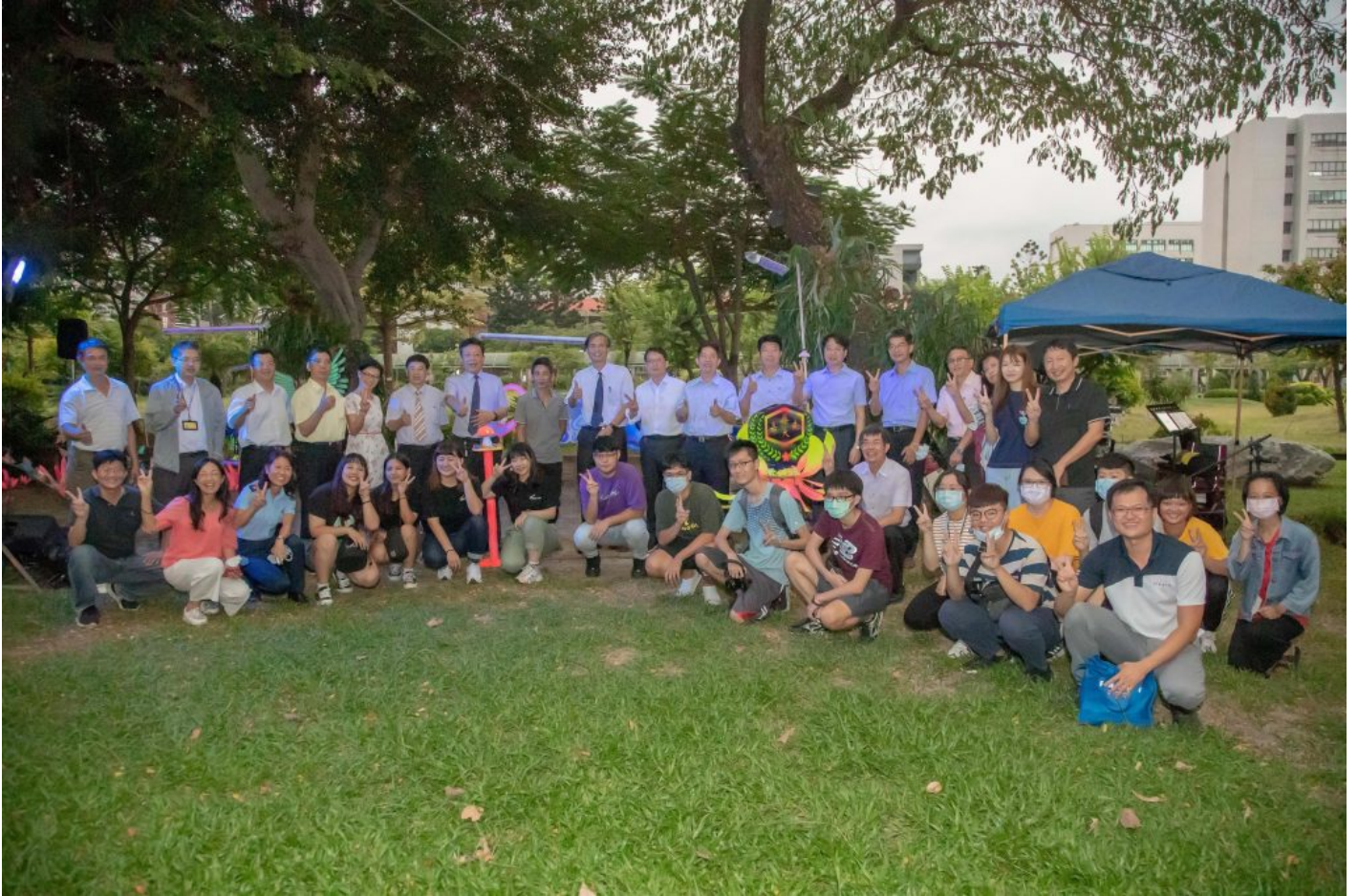
嘉南藥理大學開學日傍晚舉辦秘境點燈音樂會。