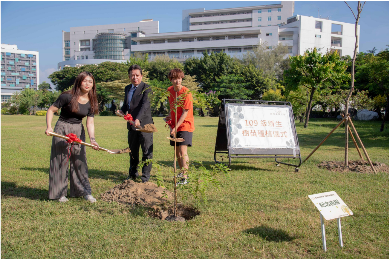
嘉藥校長李孫榮與新生代表一同將象徵109級新生小樹種植於校園內

當夕陽緩緩落下，以螢光裝置藝術為主的「秘境」音樂會才要登場，在二胡跳躍奔放樂聲中，越來越多學生被吸引而聚攏到逸舒園旁草地來，隨著太陽光芒褪去，草地小蘑菇、小精靈鮮活起來，嘉藥校長李孫榮及其他師長也駐足觀賞，一同為此次活動開幕點燈。點燈後的螢光藝術作品綻發出絢麗色彩，配合著國樂及吉他社優雅的音樂聲，在初秋夜晚裡，師生一同享受著視覺、聽覺及心靈上的藝術饗宴，成為校園新亮點。