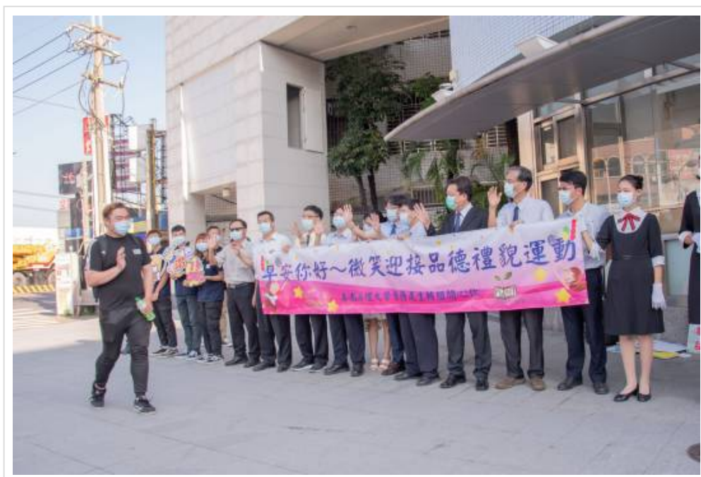
▲開學首日 嘉藥「秘境」等您一探究竟