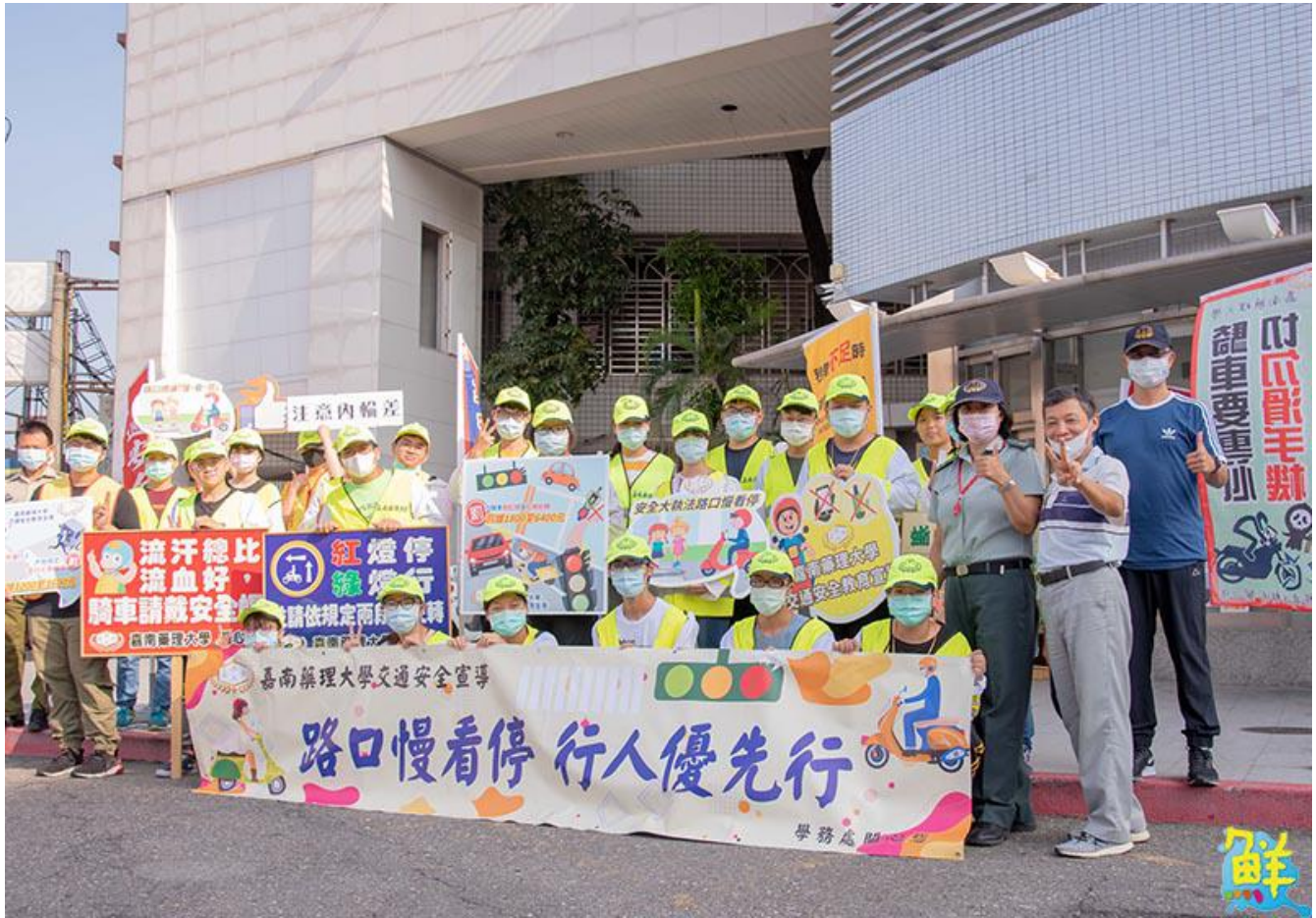
▲嘉藥舉辦安全大執法行人優先教育宣導系列活動。