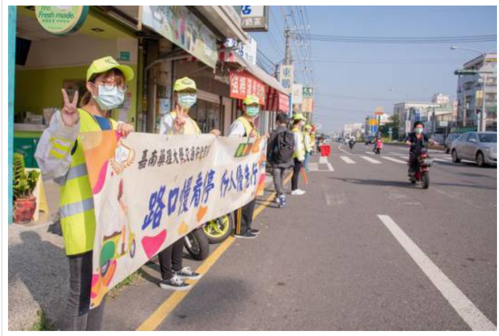
▲安全大執法 - 嘉藥安全行