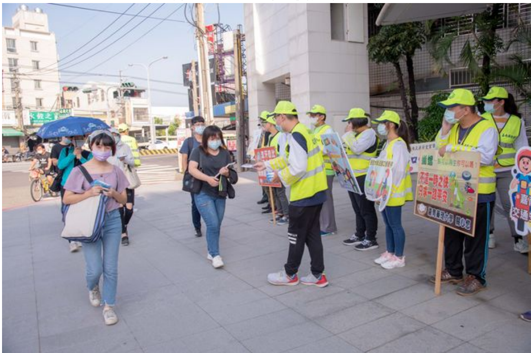
嘉藥交通隊發送交通安全小卡給上學同學。