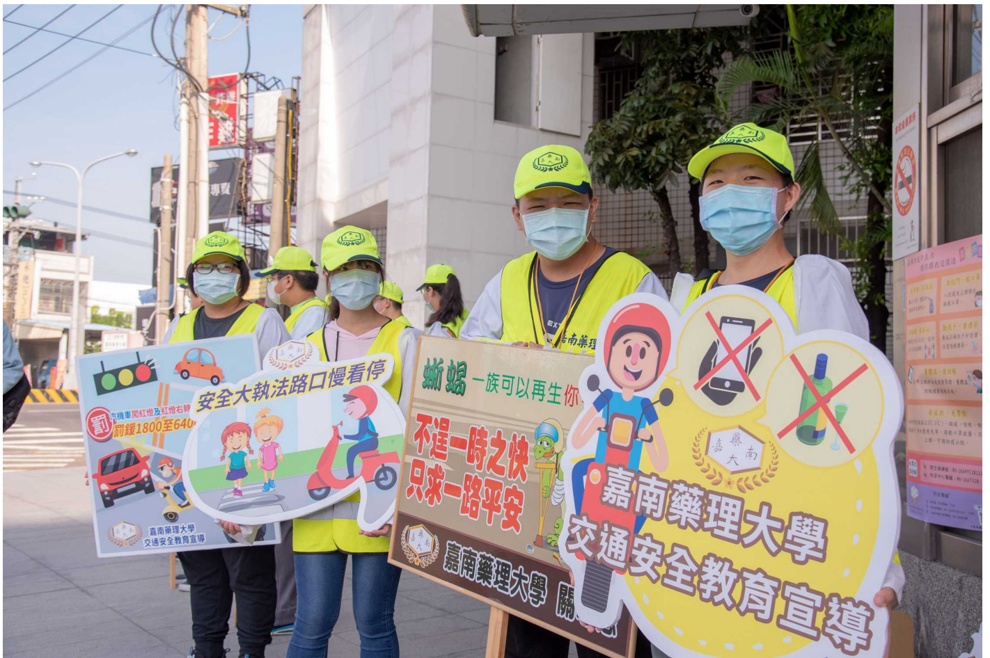
圖說：嘉藥交通服務隊同學舉牌宣導交通安全的重要。

警政署自九月一日起啟動全國「路口安全大執法」，針對「汽機車不停讓行人」、「車輛轉向不暫停讓行人優先通行」、「汽機車闖紅燈及紅燈右轉」、「行人未依規定行走行人穿越道」、「行人未依標誌、標線、號誌指示或手勢指揮穿越道路」等五大重點項目進行取締。