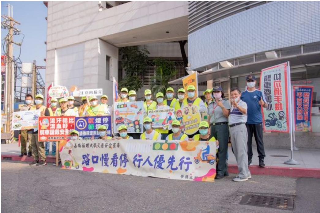
嘉藥舉辦安全大執法行人優先行教育宣導系列活動。

http://www.cntimes.info 2020-09-22 19:41:24