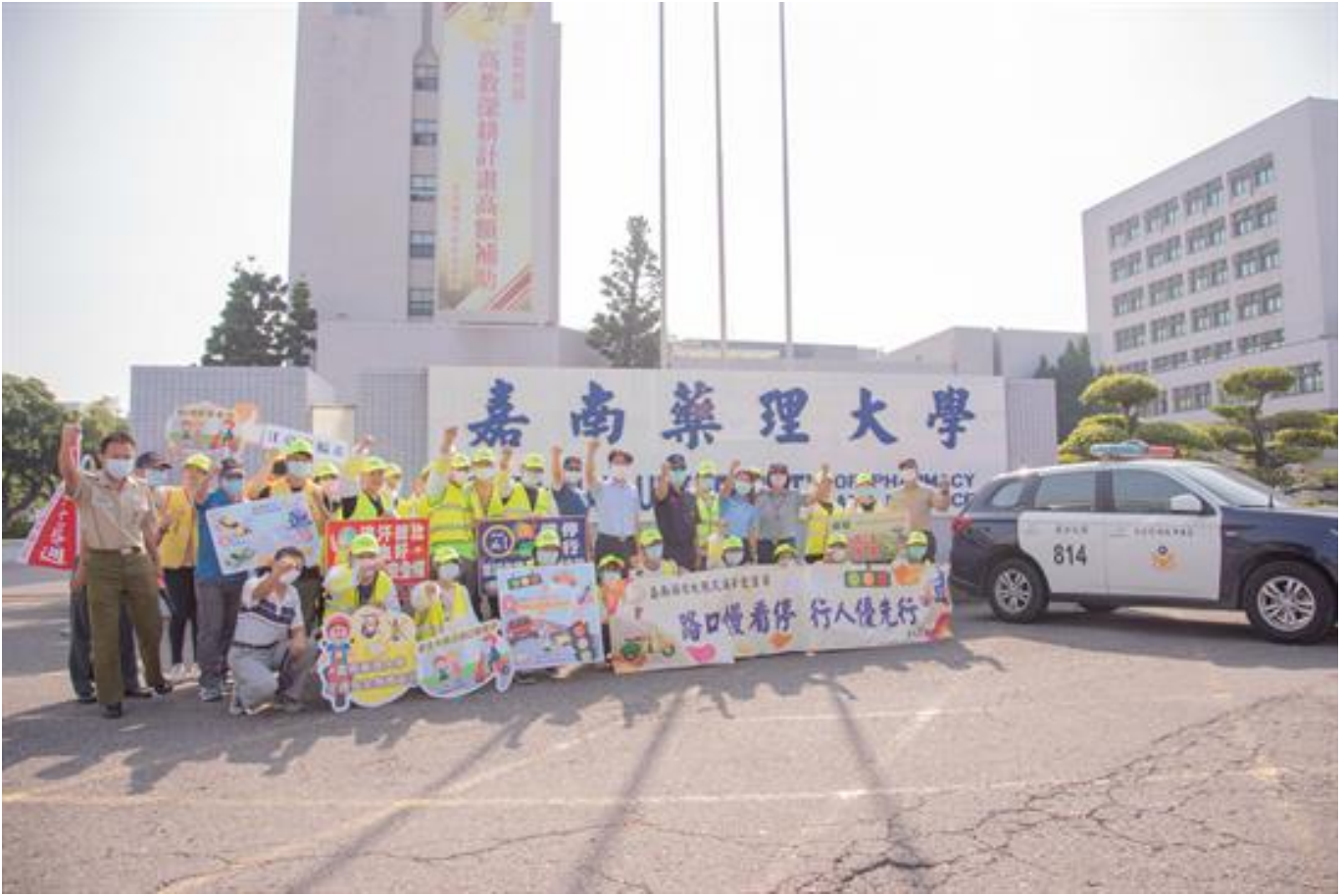
安全大執法 - 嘉藥安全行

(中央社訊息服務20200923 09:28:56)嘉南藥理大學配合全國安全宣導周22日上午辦理「安全大執法行人優先」教育宣導系列活動，學務長董志明帶領學務處同仁及交通服務隊同學於二仁路校門口、中正路及保安路機車停車場出入口對全校師生及用路人進行交通宣導，活動特別邀請臺南市政府警察局歸仁分局文賢派出所所長徐博文共同參與指導，帶給參與同仁及民眾正確的交通知識與用路禮儀。