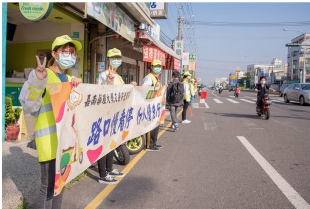
圖3：嘉藥交通隊學生對往來汽機車駕駛及行人傳達行人優先的用路理念。