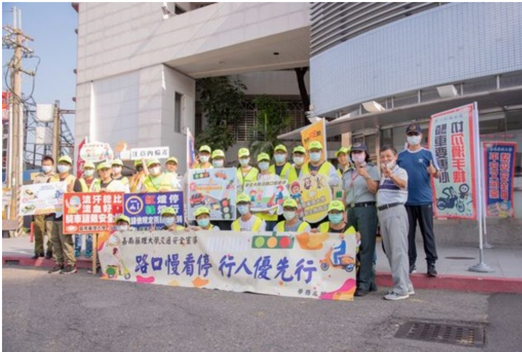
圖1：嘉藥舉辦安全大執法行人優先行教育宣導系列活動。