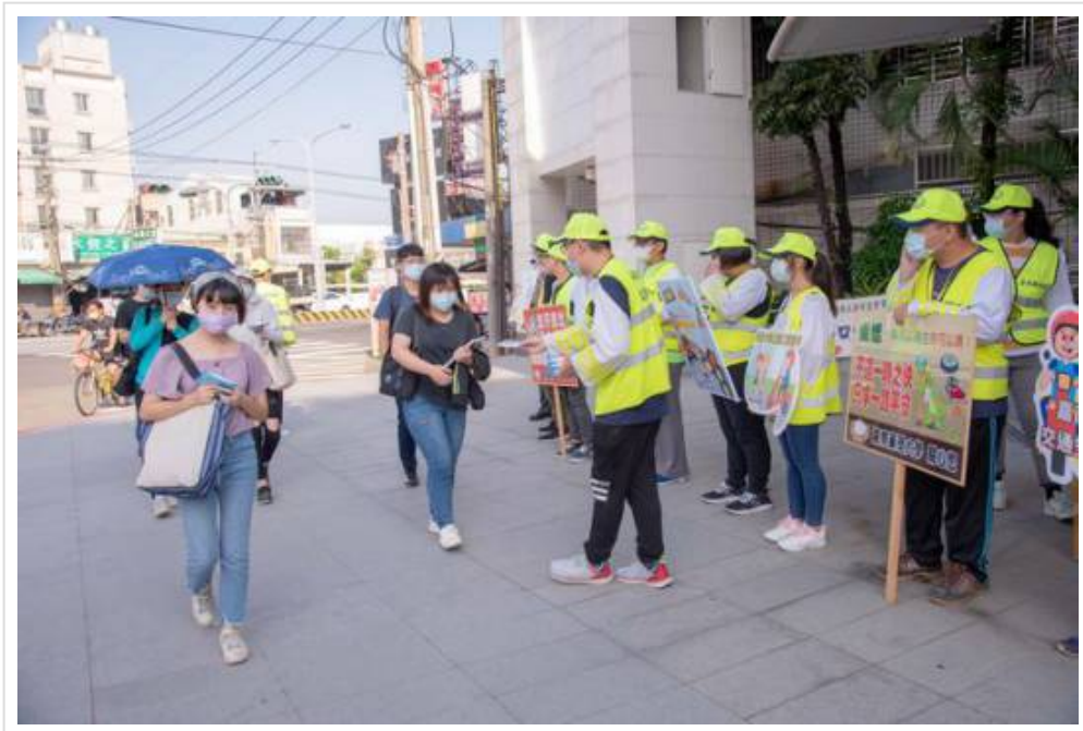
▲安全大執法 - 嘉藥安全行