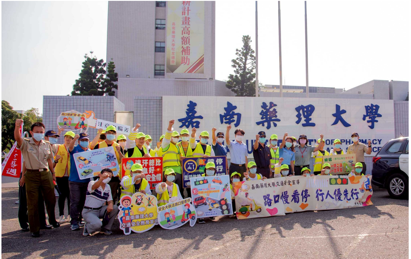
圖說：文賢派出所所長徐博文、嘉藥同仁及交通隊學生手持創意宣導標語傳達行人優先的用路理念。

嘉南藥理大學配合「全國安全宣導周」，二十二日舉辦「安全大執法行人優先行」教育宣導系列活動，由學務長董志明帶領教官及交通服務隊同學於二仁路校門口、中正路及保安路機車停車場出入口對全校師生及用路人進行交通宣導，並邀請歸仁分局文賢派出所指導參與師生及民眾正確的交通知識與用路禮儀。