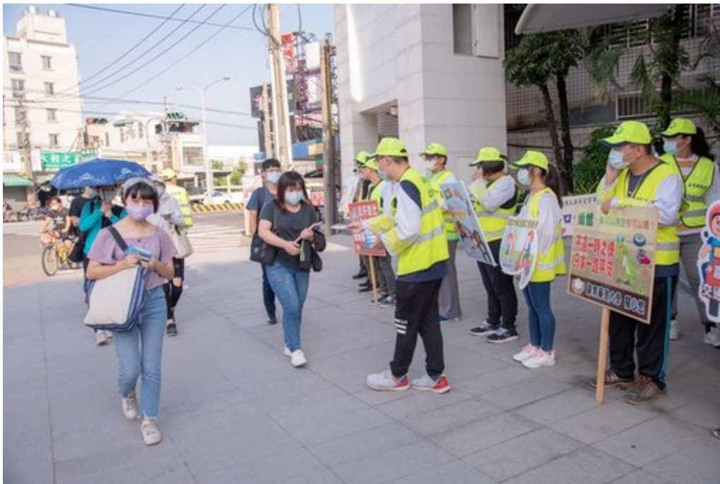
圖2：嘉藥交通隊發送交通安全小卡給上學同學。