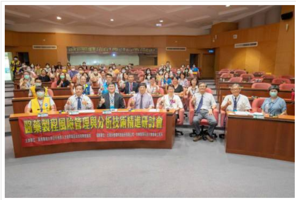
▲ 醫藥製程風管與分析技術精進研討會 嘉藥登場

近來多次爆發食藥品安全事件引發社會大眾不安，也引起產官學界對相關議題的重視，因高齡化社會而來的用藥安全、新冠疫情肆虐產生的藥品疫苗需求，高血壓、降血糖及胃藥等出現不純物，乃至於中藥材重金屬含量超標都帶動民眾對用藥信心危機、國內製藥產業內控自律標準與政府重視醫藥生技的態度，不僅是重要的民生議題，也與國家重點產業升級息息相關。