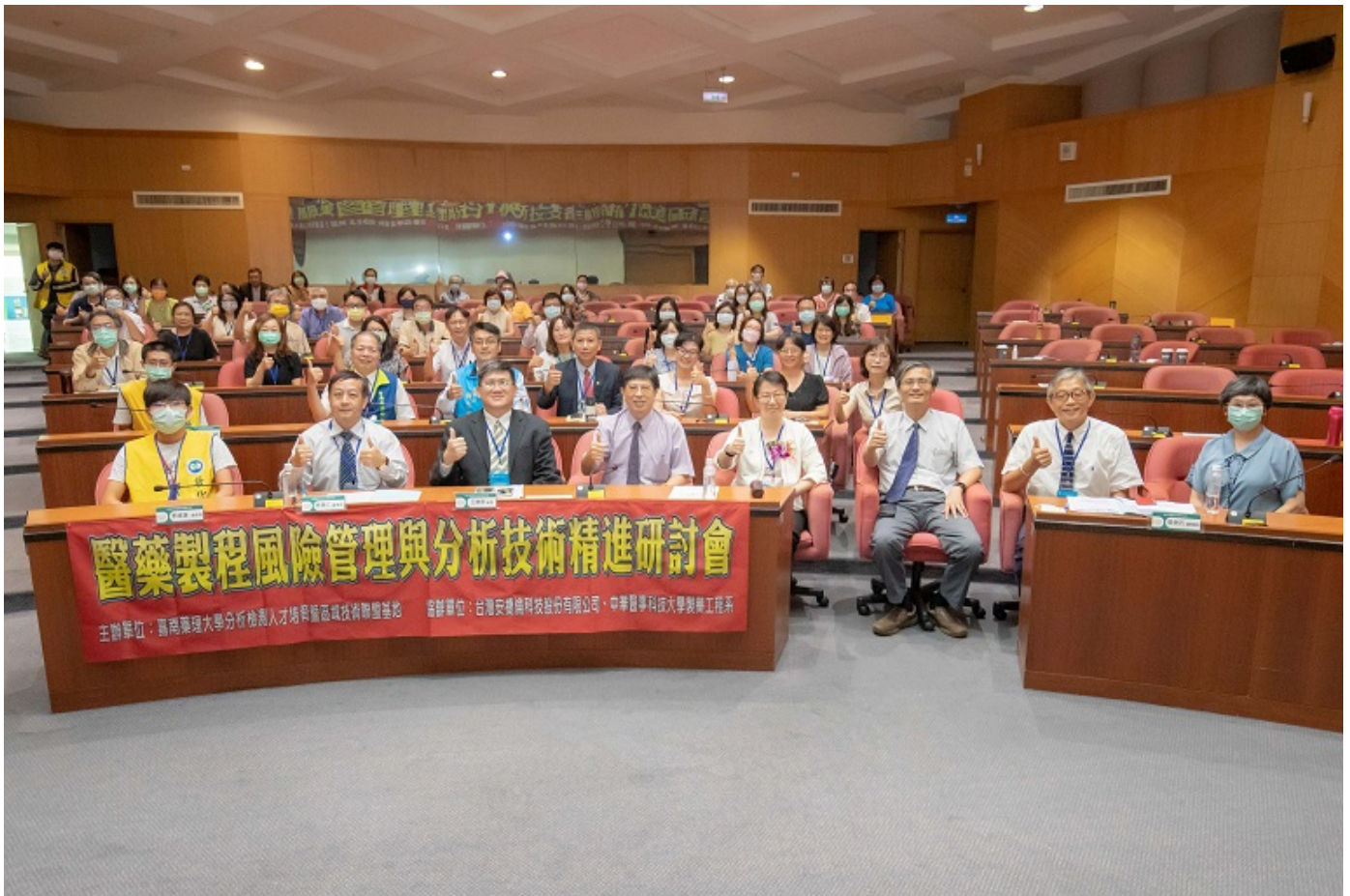
▲嘉藥舉辦醫藥製程風管與分析技術精進研討會，吸引許多產官學界人士參加。