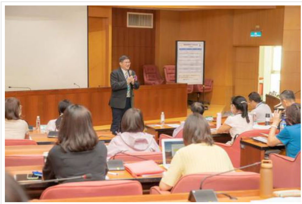
▲ 醫藥製程風管與分析技術精進研討會 嘉藥登場