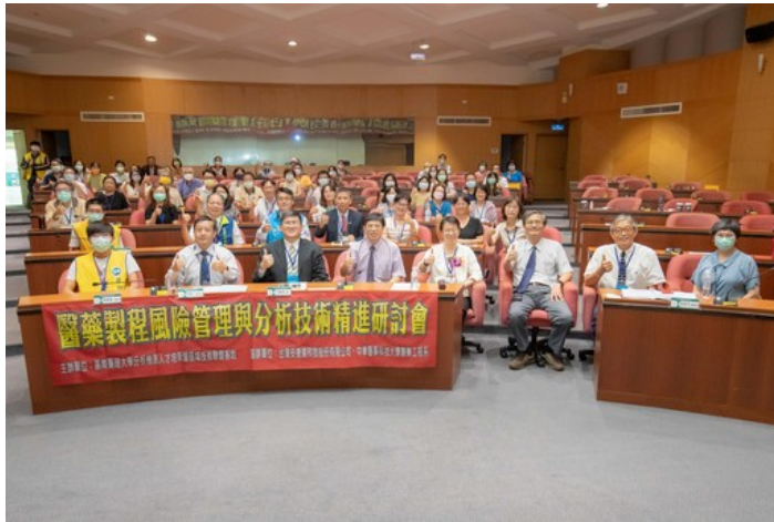
嘉藥舉辦醫藥製程風管與分析技術精進研討會，吸引許多產官學界人士參加