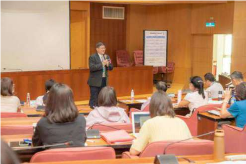
▲ 醫藥製程風管與分析技術精進研討會 嘉藥登場