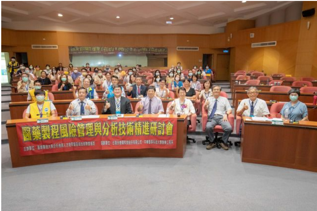
嘉藥舉辦醫藥製程風管與分析技術精進研討會，吸引許多產官學界人士參加。

http://www.cntimes.info 2020-10-12 20:00:15