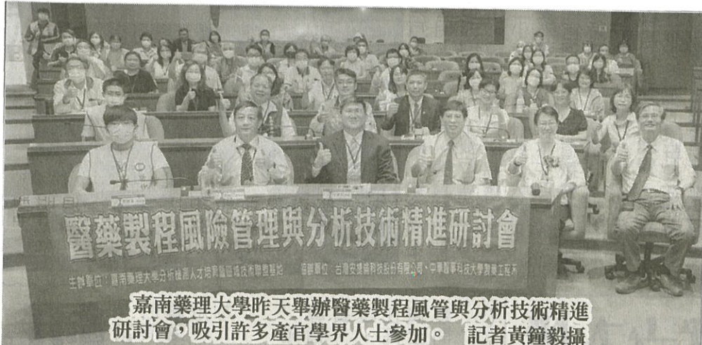
嘉南藥理大學昨天舉辦醫藥製程風管與分析技術精進研討會，吸引許多產官學界人士參加。