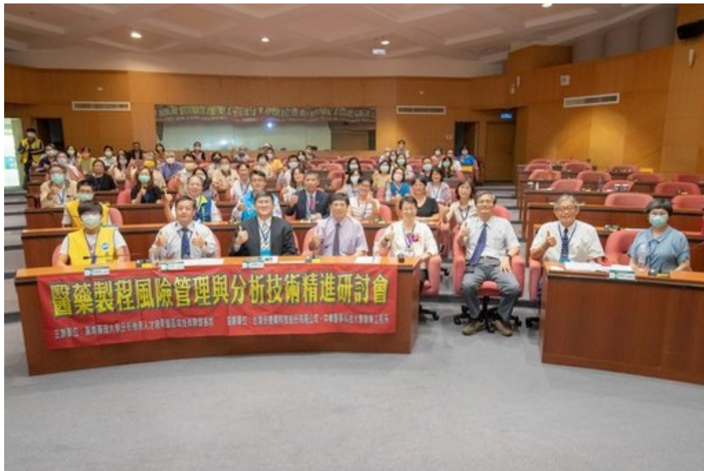
圖1：嘉藥舉辦醫藥製程風管與分析技術精進研討會，吸引許多產官學界人士參加。