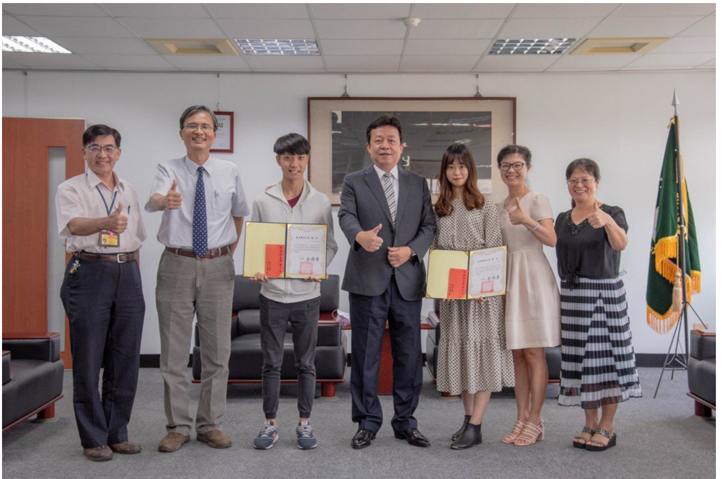
嘉藥藥師國考通過百分百，全校師生備感光榮。