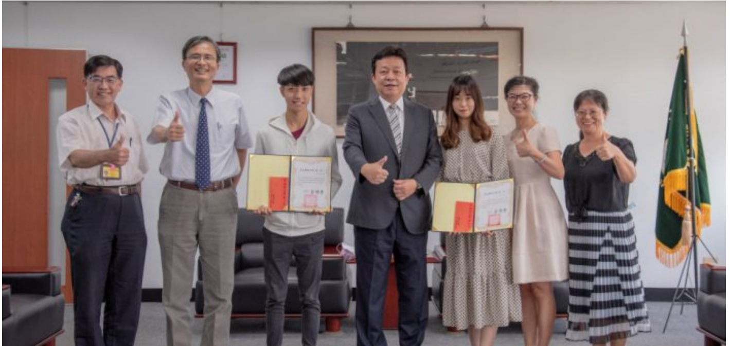
嘉藥藥師國考通過百分百 全校師生備感光榮