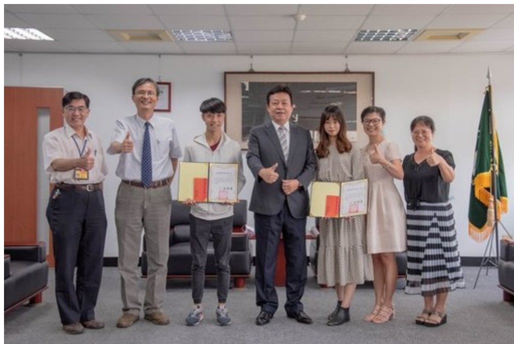
圖3：嘉藥藥師國考通過百分百 全校師生備感光榮。