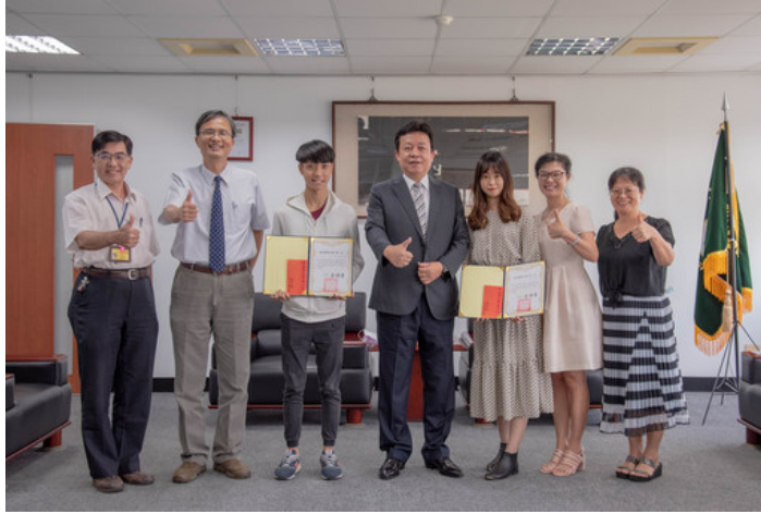
嘉藥藥師國考通過百分百 全校師生備感光榮