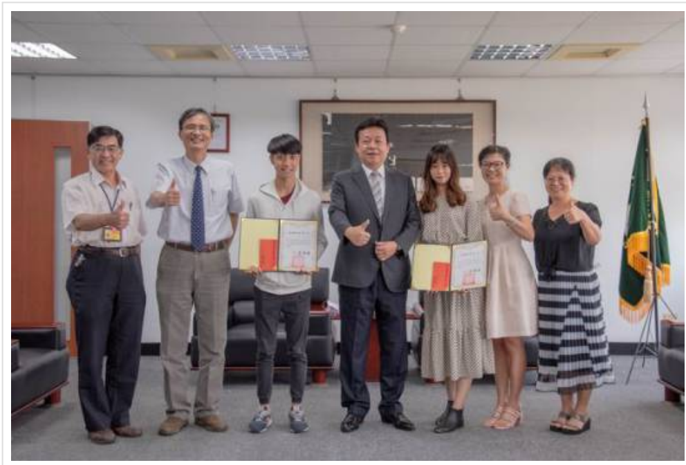
▲ 近千新科藥師出列 嘉藥國考通過百分百