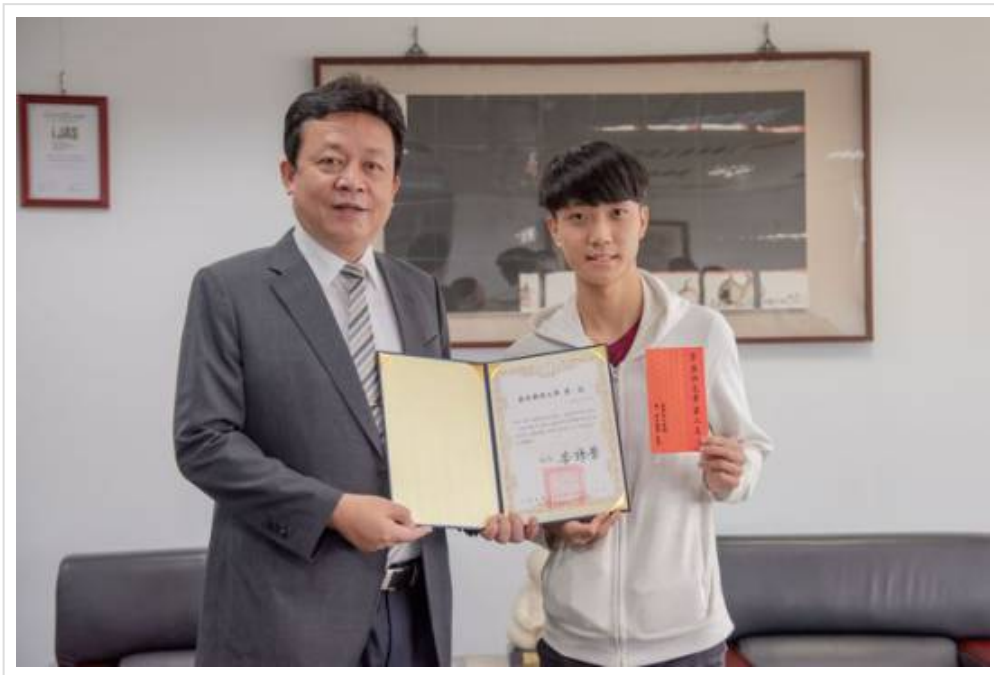
▲ 近千新科藥師出列 嘉藥國考通過百分百

109專技藥師國家考試榜單揭曉，嘉南藥理大學藥學系第二階段藥師分階段考試，124位畢業生全數通過，自103年起已培育近千位應屆藥師加入藥事服務行列，在校生不遑多讓，201位三年級學生報名第一階段藥師考試，118位通過，及格率高達58.7%，遠遠超過全國及格率34.1%，更難得的是，全國榜眼及第四名也在嘉藥，嘉藥校長李孫榮頒發獎狀及獎學金，以資鼓勵，證明嘉藥藥學系教學重質也重量，作為「藥師搖籃」實至名歸。