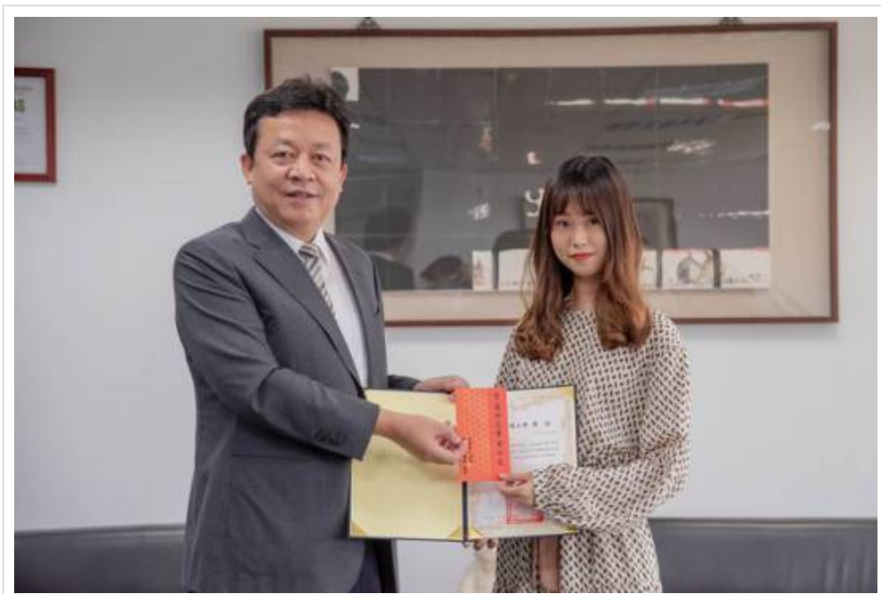
圖3：嘉藥藥師國考通過百分百 全校師生備感光榮。