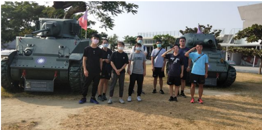
一整天的ROTC研習活動讓參與學生收穫滿滿。