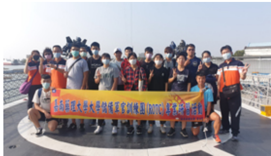
嘉藥軍官訓練團(ROTC)特地至德陽艦園區參訪。

【記者孫宜秋 / 南市報導】嘉南藥理大學為建立大學儲備軍官訓練團 ( ROTC ) 學生正確國家觀念及愛國意識，提升其軍事專業知能，培養成為允文允武的國軍軍官，特於日前舉辦「大學儲備軍官訓練團 ( ROTC ) 109學年度第一學期專業研習暨全民國防教育多元活動」，研習活動規劃一天行程，包含「國防政策宣導」、「經驗傳承」、「全民國防專題演講」及「安平區文史參訪」等，精采豐富。