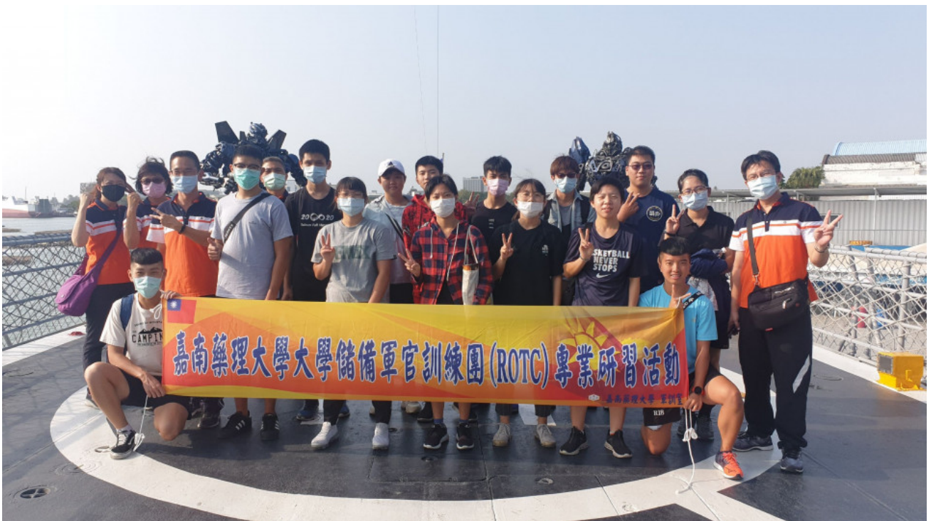
▲嘉藥軍官訓練團(ROTC)特地至德陽艦園區參訪