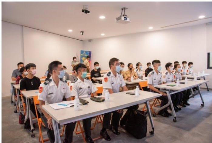
熱血生涯 穩定就業 嘉藥辦理ROTC講座