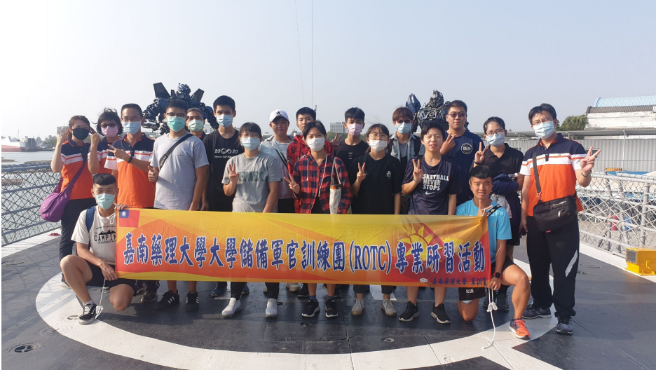
嘉藥軍官訓練團(ROTC)特地至德陽艦園區參訪

經驗，透過實際的互動與提問，解答學弟妹可能的疑惑，也提升對大學儲備軍官的認同，進而砥礪自身，為投入軍旅做足準備。