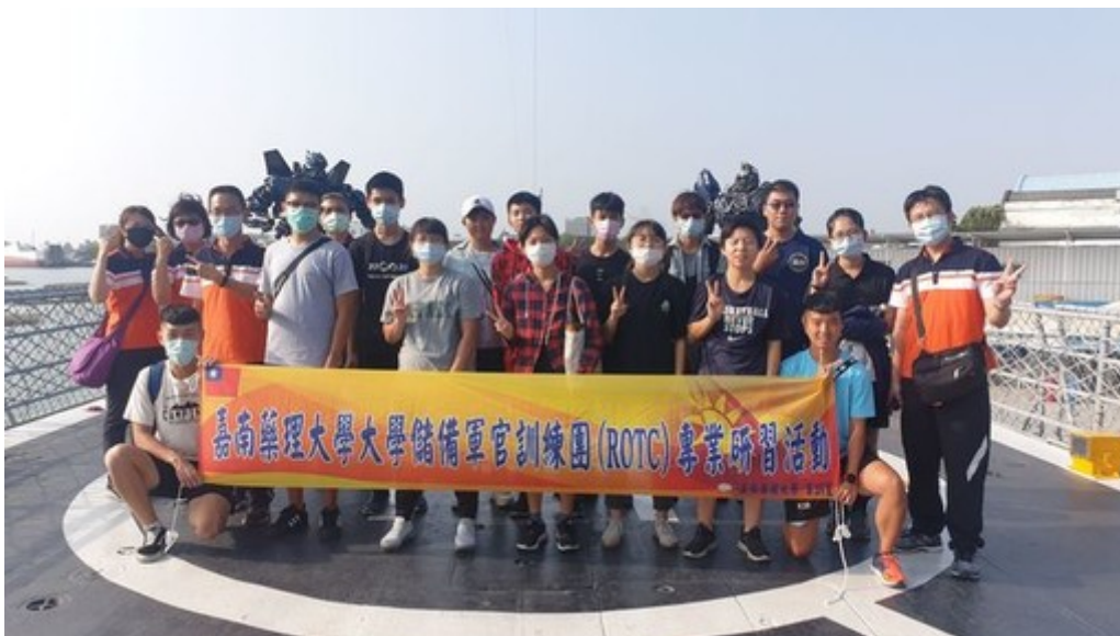
圖2：嘉藥軍官訓練團(ROTC)特地至德陽艦園區參訪。