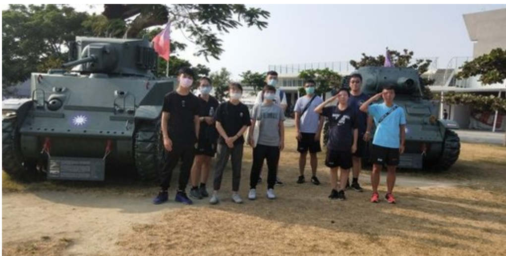
圖3：一整天的ROTC研習活動讓參與學生收穫滿滿。