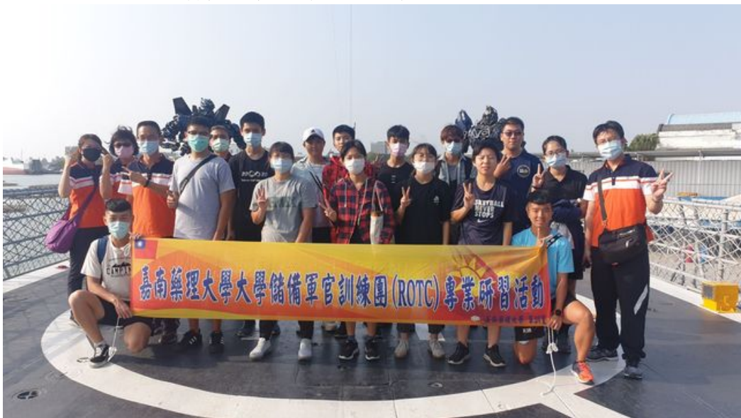
嘉藥軍官訓練團 (ROTC) 特地至德陽艦園區參訪。