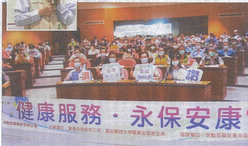
↓ 市府勞工局舉辦「健康服務·永保安康」高階主管論壇，與會人員大合照。

他指出，除舉辦論壇，勞工局已成立卅一個安衛家族，有七百多個事業單位參加運作，以大廠帶小廠的經驗傳承推集合式輔導，每年還安排事業單位的工安參訪體感訓練，讓學員感受工作環境潛在的工安危害，以期提升職安意識，降低職災發生。