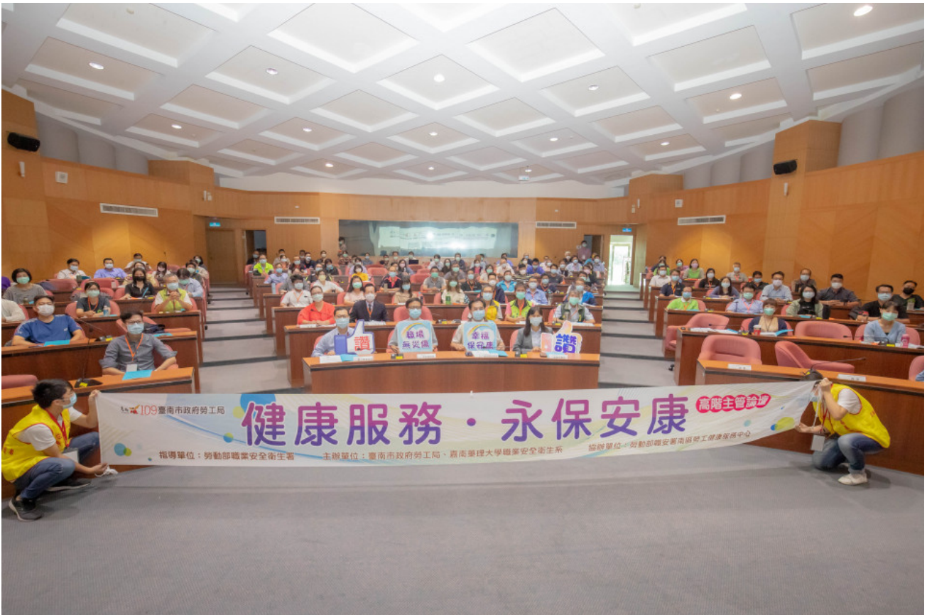
▲嘉藥與台南市府聯手舉辦「健康服務·永保安康」高階主管論壇