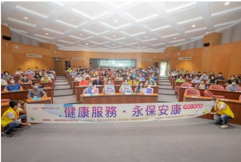
圖1：嘉藥與台南市府聯手舉辦「健康服務·永保安康」高階主管論壇。