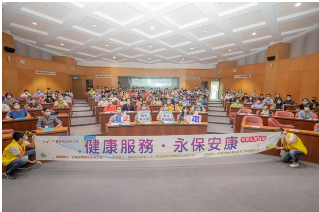
嘉藥與台南市府聯手舉辦「健康服務．永保安康」高階主管論壇。

http://www.cntimes.info 2020-11-05 19:58:00