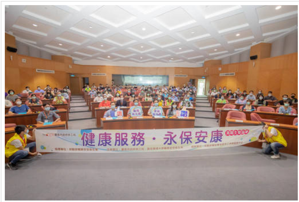
▲ 嘉藥與台南市府聯手舉辦「健康服務·永保安康」高階主管論壇