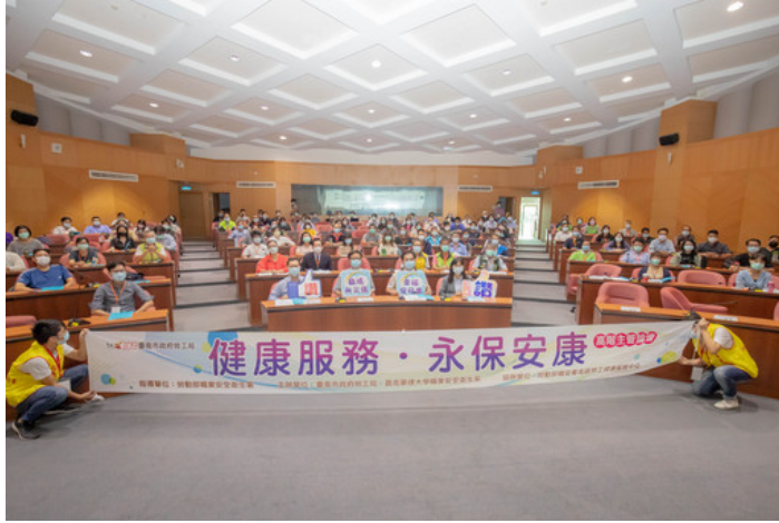
嘉藥與台南市府聯手舉辦「健康服務·永保安康」高階主管論壇