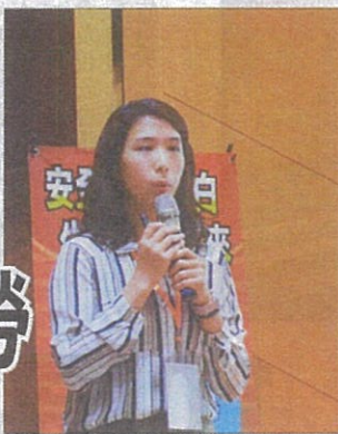
← 李彤說，企業落實勞工健康管理，能減少勞動力損失和提升企業競爭力。