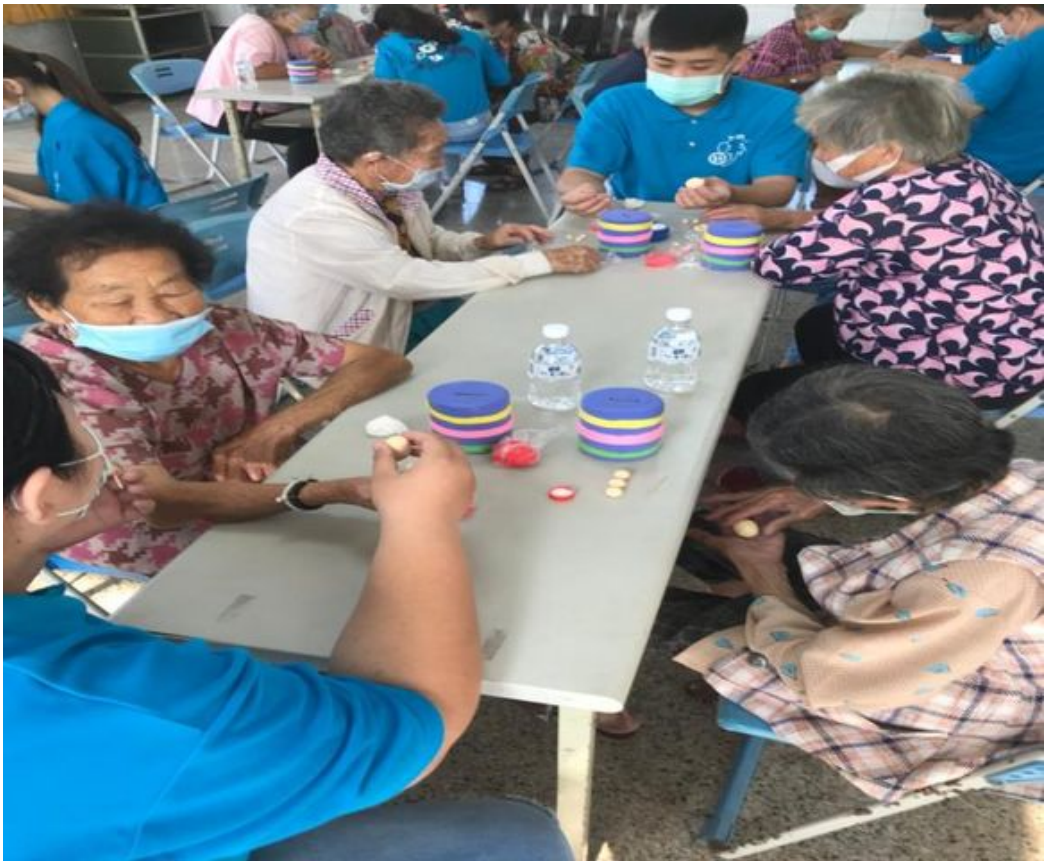
專注認真的長者動手做黏土。

嘉南藥理大學老人服務事業管理系與「財團法人臺南市私立王趁社會福利慈善事業基金會」攜手合辦關懷銀髮族系列活動，因應歲末聖誕佳節，在七股區竹橋里多功能活動中心舉行DIY 手藝講座「聖誕老公公撲滿~存入愛與回憶」，參加者都是台南市七股區竹橋里80~90多歲的社區長者共約30位。希望在活動的規劃引導下，除了帶給偏鄉老人豐富的學習內容，讓參加的長者獲得被關懷與溫暖。