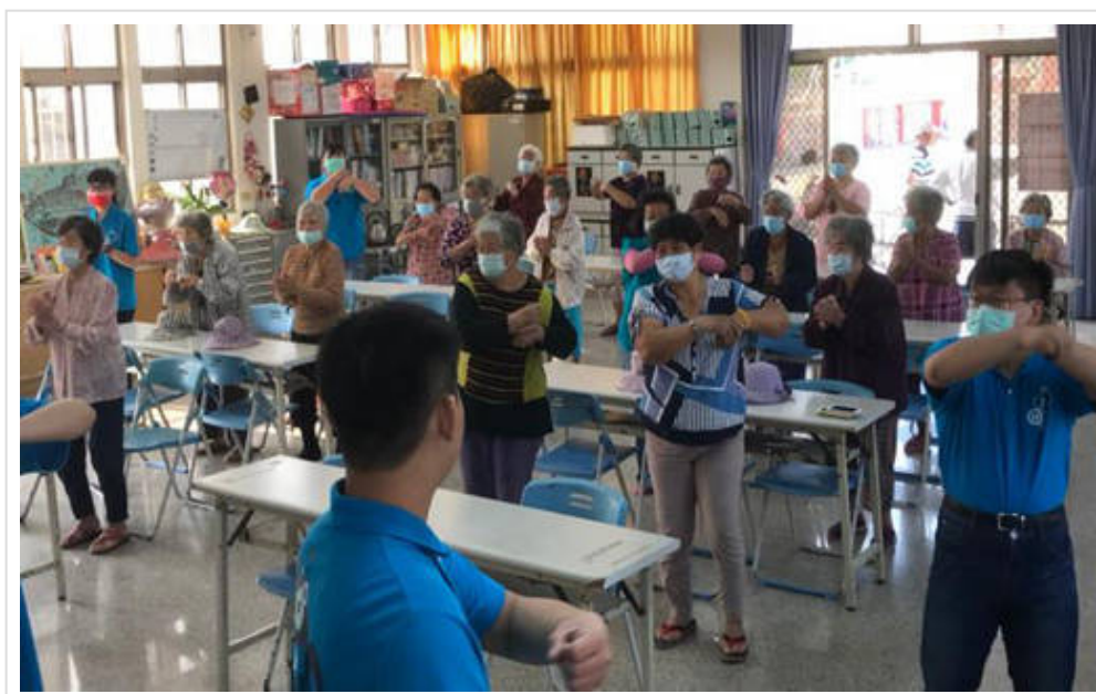
▲嘉藥老服系志工帶領韻律操活動

(中央社訊息服務20201201 09:28:33)嘉南藥理大學老人服務事業管理系與「財團法人臺南市私立王趁社會福利慈善事業基金會」攜手合辦關懷銀髮族系列活動，因應歲末聖誕佳節，在七股區竹橋里多功能活動中心舉行DIY 手藝講座「聖誕老公公撲滿~存入愛與回憶」，參加者都是台南市七股區竹橋里80~90多歲的社區長者共約30位。希望在活動的規劃引導下，除了帶給偏鄉老人豐富的學習內容，讓參加的長者獲得被關懷與溫暖。