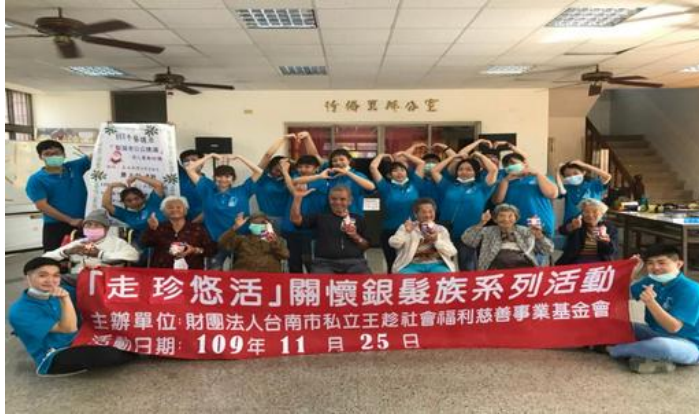
90 歲以上高齡長者熱衷參與~活到老學到老