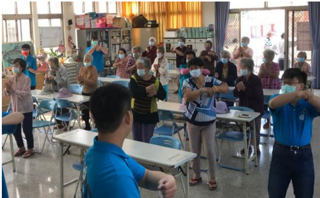
嘉藥老服系志工帶領韻律操活動。