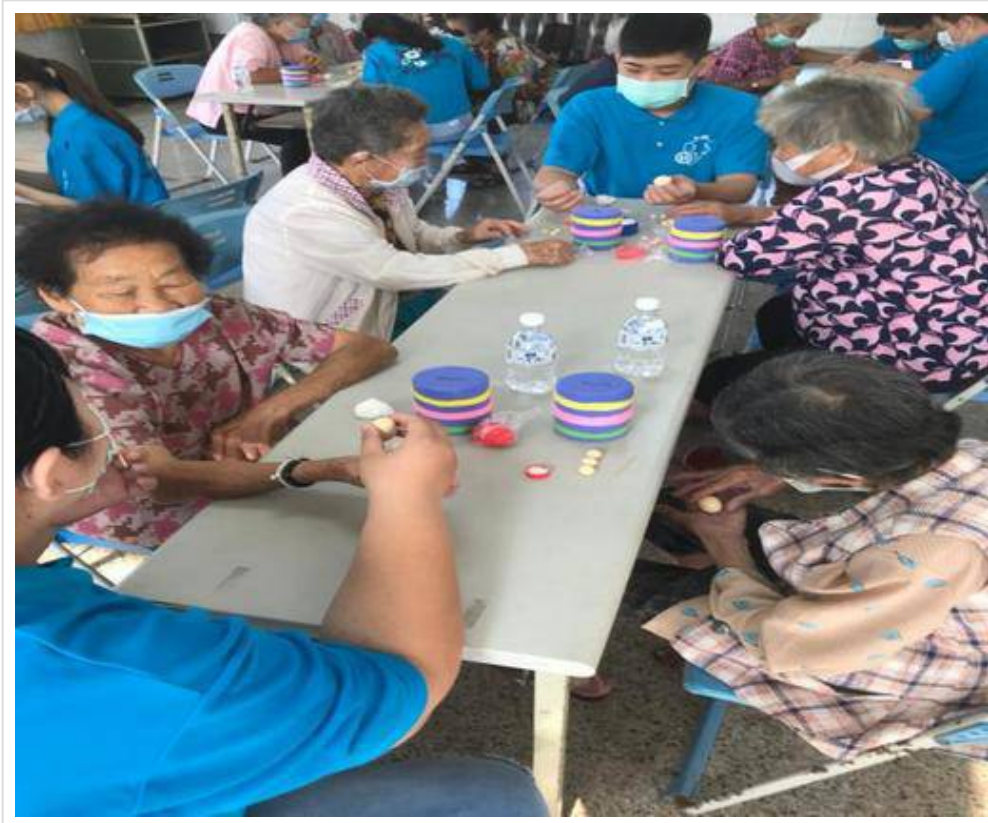
▲專注認真的長者動手做黏土