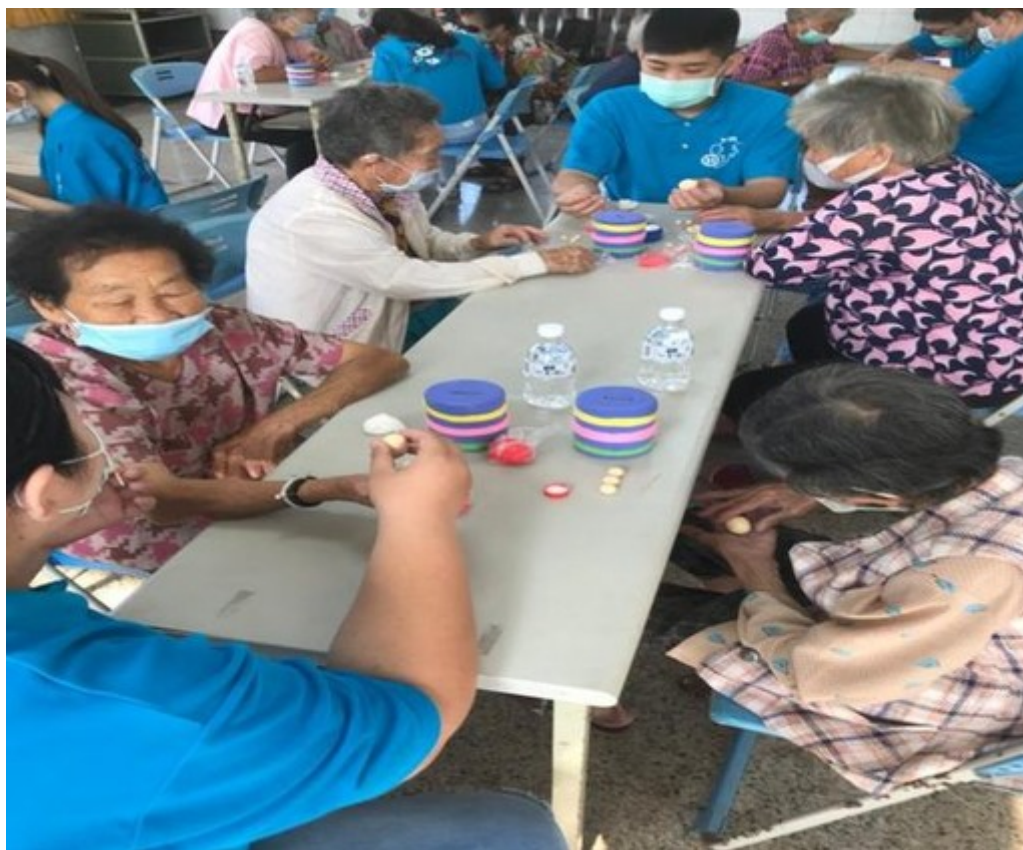
圖3：專注認真的長者動手做黏土。