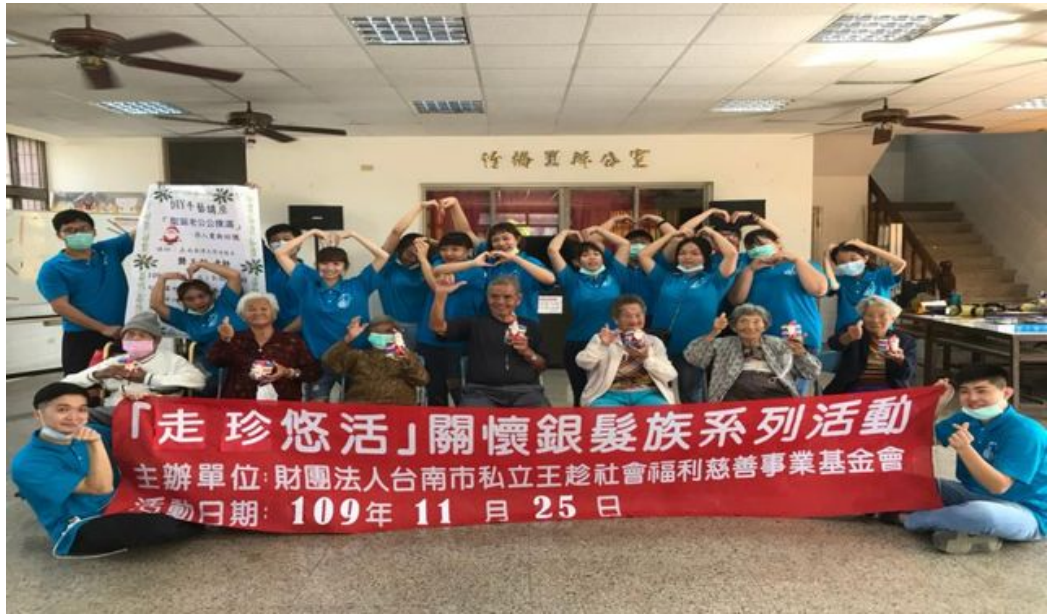
嘉藥攜手社福基金會合辦歲末關懷偏鄉老人。

http://www.cntimes.info 2020-11-27 20:20:02