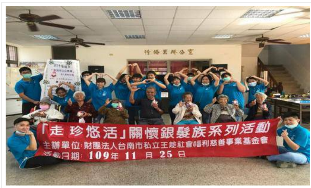
▲ 90 歲以上高齡長者熱衷參與~活到老學到老