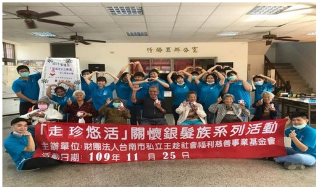
圖1：嘉藥攜手社福基金會合辦歲末關懷偏鄉老人。