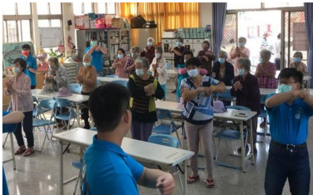
圖2：嘉藥老服系志工帶領韻律操活動。