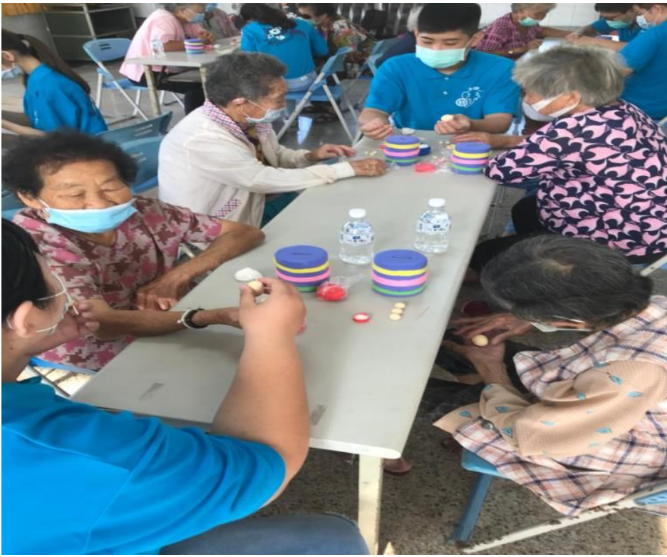
▲ 專注認真的長者動手做黏土

關懷銀髮族系列活動「DIY 手藝講座」主要以共學為目標，結合青年族群至社區辦理休閒活動，增加長輩與社區的連結，提升長輩們的互動關係，以減少內心的孤寂感；也能透過手作輕黏土活動培養興趣，活到老學到老，從活動中獲得成就感，以豐富生活。嘉藥老服系特別選派20位同學擔任志工，由於本身所學領域，在服務的過程中，不僅可以實踐自身的專業，也能累積本身的志工實務經驗，對參與的學生來說也獲益良多。