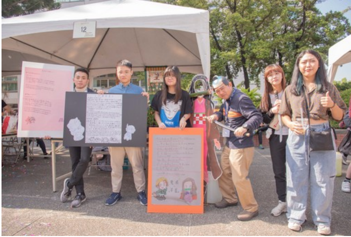
嘉藥日籍老師特別裝扮成時下流行的鬼滅之刃來吸引學生目光