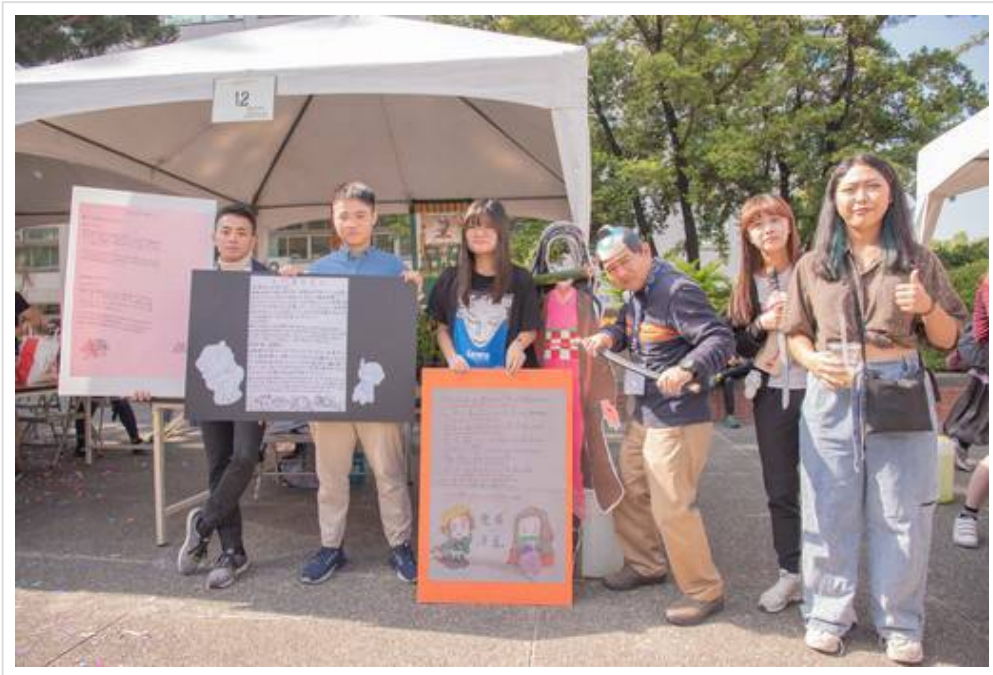
▲嘉藥日籍老師特別裝扮成時下流行的鬼滅之刃來吸引學生目光