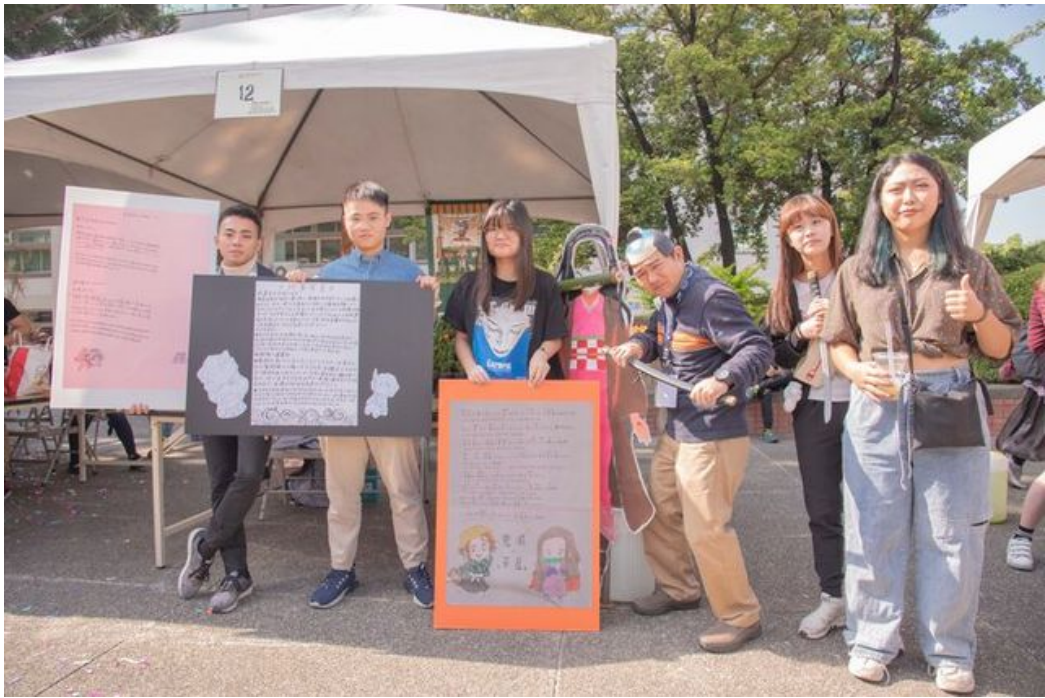
嘉藥日籍老師特別裝扮成時下流行的鬼滅之刃來吸引學生目光。