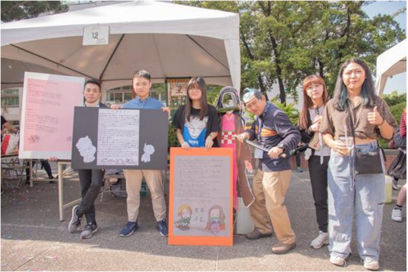
嘉藥外語週熱鬧登場 多元文化開拓國際視野

(中央社訊息服務20201208 09:20:22)嘉藥應用外語系於今 (7) 日舉辦外語週活動，響應「多元文化祭」主題，活動內容涵蓋英美、日本以及東南亞各國族群多元文化動態展，新增西班牙語靜態展及時下最夯的「鬼滅之刃」都熱鬧登場，而臺南市政府新聞及國際關係處國際關係科對日事務諮詢顧問阿部真行夫婦也蒞臨外語週會場，介紹日本群馬縣文化，新出爐「嘉藥好聲音 (Voice of CNU)」英日語歌唱比賽優勝者更在現場演唱，宛如一場類出國的外語嘉年華盛會。