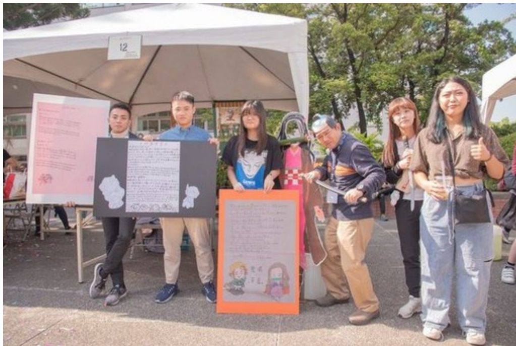
圖3：嘉藥日籍老師特別裝扮成時下流行的鬼滅之刃來吸引學生目光。