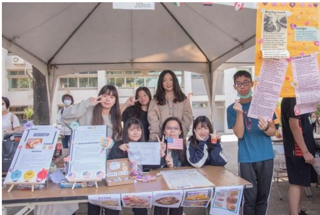
圖4：外語系同學設攤讓同學實際體驗英文點餐。