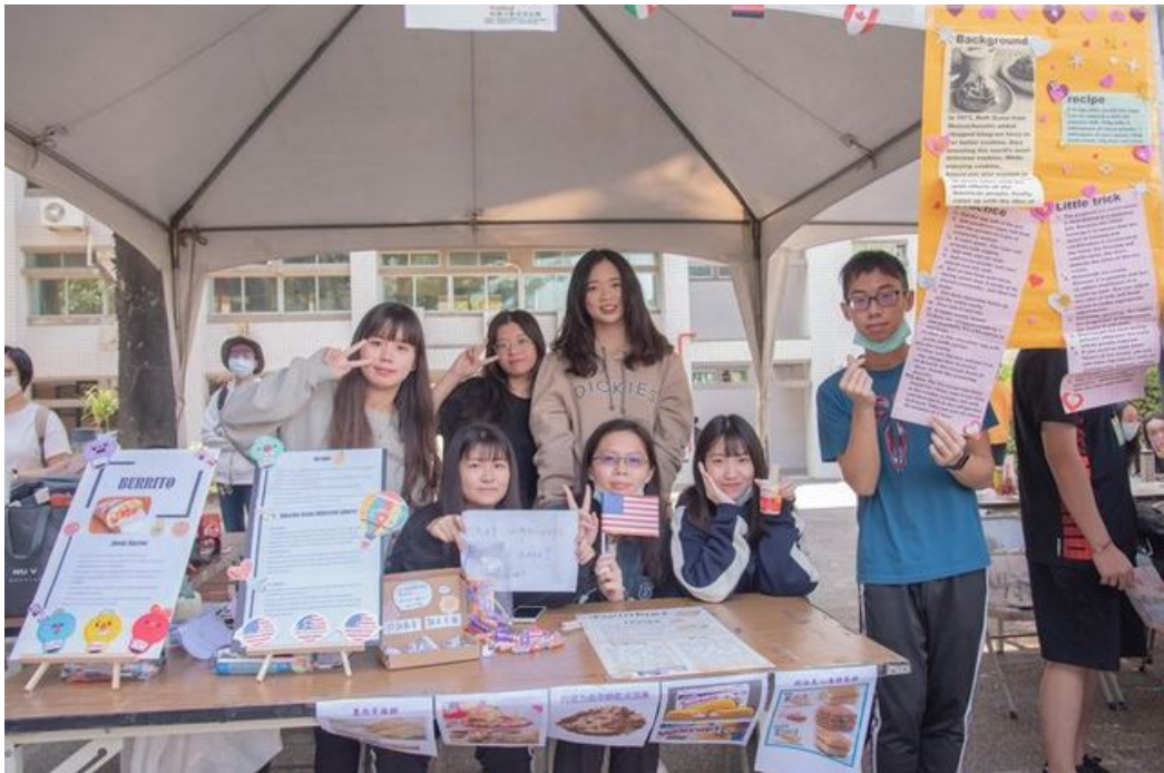
外語系同學設攤讓同學實際體驗英文點餐。

嘉藥應用外語系於今（7）日舉辦外語週活動，響應「多元文化祭」主題，活動內容涵蓋英美、日本以及東南亞各國族群多元文化動態展，新增西班牙語靜態展及時下最夯的「鬼滅之刃」都熱鬧登場，而臺南市政府新聞及國際關係處國際關係科對日事務諮詢顧問阿部真行夫婦也蒞臨外語週會場，介紹日本群馬縣文化，新出爐「嘉藥好聲音（Voice of CNU）」英日語歌唱比賽優勝者更在現場演唱，宛如一場類出國的外語嘉年華盛會。