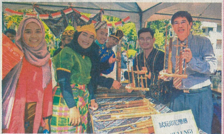
↑ 嘉藥外語週熱鬧登場，多元文化開拓國際視野！

另外，主辦單位也準備五百份禮物，鼓勵全校同學一同參與，現場充滿異國風情，熱鬧滾滾。