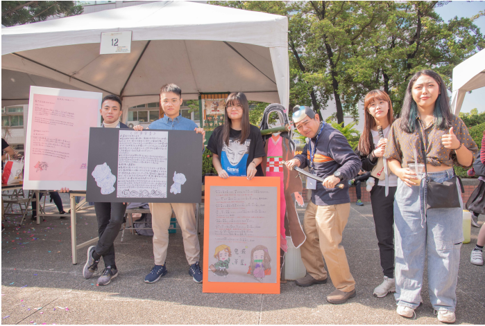
▲ 嘉藥日籍老師特別裝扮成時下流行的鬼滅之刃來吸引學生目光

嘉藥應用外語系於12月7日舉辦外語週活動，響應「多元文化祭」主題，活動內容涵蓋英美、日本以及東南亞各國族群多元文化動態展，新增西班牙語靜態展及時下最夯的「鬼滅之刃」都熱鬧登場，而臺南市政府新聞及國際關係處國際關係科對日事務諮詢顧問阿部真行夫婦也蒞臨外語週會場，介紹日本群馬縣文化，新出爐「嘉藥好聲音 (Voice of CNU)」英日語歌唱比賽優勝者更在現場演唱，宛如一場類出國的外語嘉年華盛會。