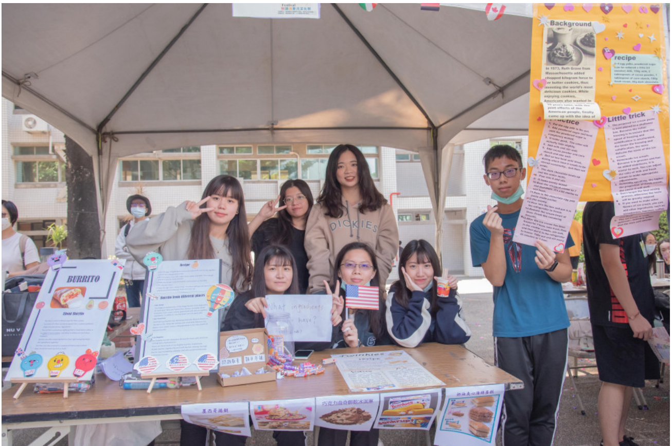
▲外語系同學設攤讓同學實際體驗英文點餐