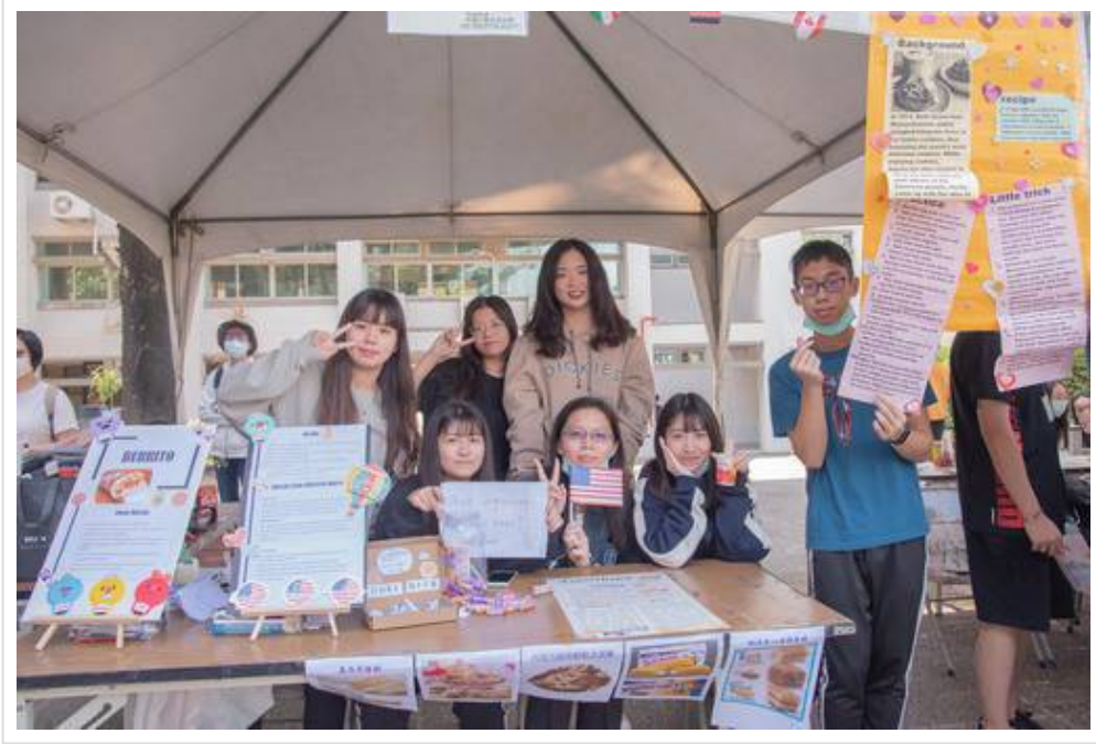
▲外語系同學設攤讓同學實際體驗英文點餐

(中央社訊息服務20201208 09:20:22)嘉藥應用外語系於今(7)日舉辦外語週活動，響應「多元文化祭」主題，活動內容涵蓋英美、日本以及東南亞各國族群多元文化動態展，新增西班牙語靜態展及時下最夯的「鬼滅之刃」都熱鬧登場，而臺南市政府新聞及國際關係處國際關係科對日事務諮詢顧問阿部真行夫婦也蒞臨外語週會場，介紹日本群馬縣文化，新出爐「嘉藥好聲音 (Voice of CNU)」英日語歌唱比賽優勝者更在現場演唱，宛如一場類出國的外語嘉年華盛會。