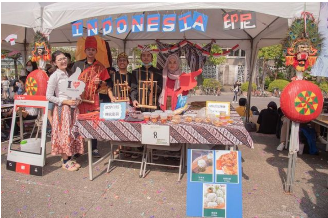
嘉藥舉辦外語週活動全校充滿異國風情。