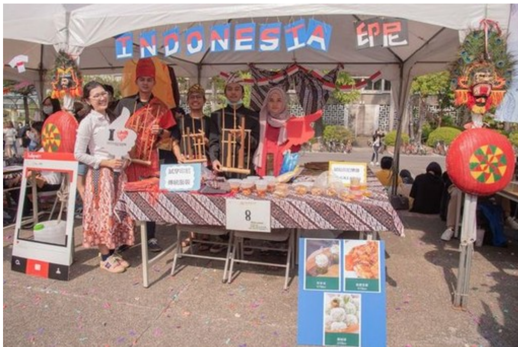
圖2：嘉藥舉辦外語週活動全校充滿異國風情。