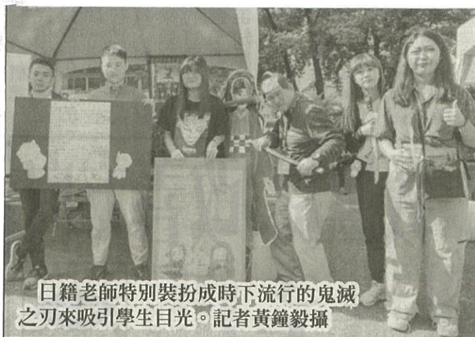
日籍老師特別裝扮成時下流行的鬼滅之刃來吸引學生目光。