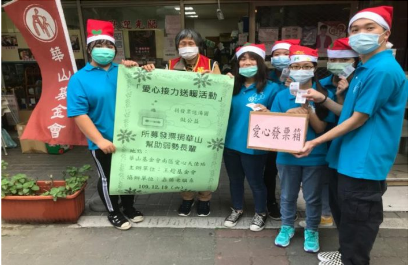
▲所募發票捐給華山基金會