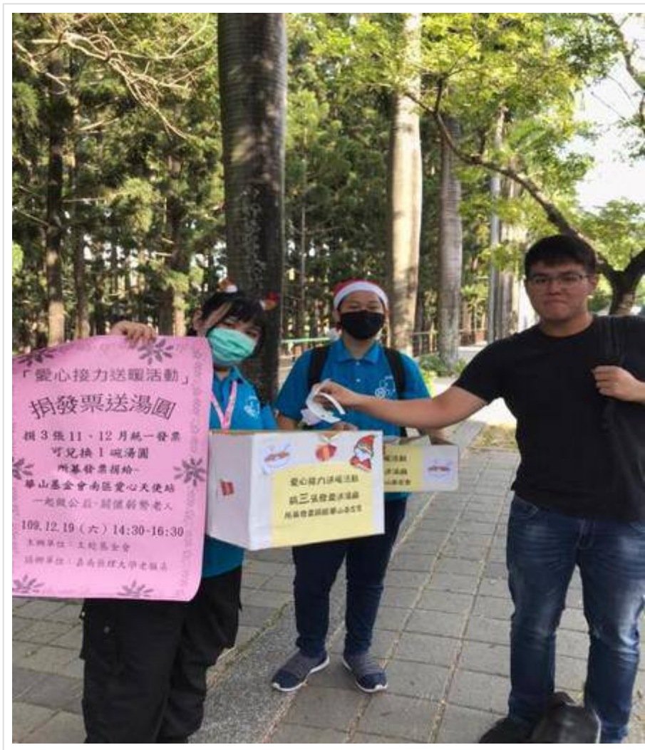
▲總計募得1000張發票捐予「華山基金會南區愛心天使站」

(中央社訊息服務20201230 09:49:26)歲末冬至來臨，冬至吃湯圓的傳統習俗，象徵圓滿與溫暖，嘉南藥理大學老人服務事業管理系與財團法人臺南市私立王趁社會福利慈善事業基金會攜手合辦「愛心接力送暖活動」，因應冬至及聖誕佳節，以實際行動落實在地關懷，發送暖心湯圓給台南街友、伊甸大林雙福家園-身心障礙者雙老家庭個案及熱心捐發票的市民。希望在活動的規劃引導下，喚起大眾對社會的關懷，以行動支持公益活動傳達愛心，並在冷冬的季節裡讓雙老家庭、街友們也能感受到愛與溫暖。