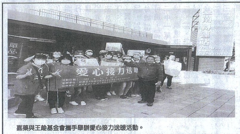
嘉藥與王趁基金會攜手舉辦愛心接力送暖活動。

多元化，以回饋社會為目的，連結嘉南藥理大學老服系、社工系、觀光系志工及財團法人高雄市慈聯社會福利基金會（台南街友服務中心）、伊甸基金會大林雙福園區等單位資源合作，共同參與完成。 「愛心接力送暖活動」分兩部曲，第一部捐發票送湯圓，8位志工在臺南公園、臺南轉運站、火車站附近沿途邀請市民獻愛心民眾只要捐出10張1元至20元紙本發票1張，就可兌換湯圓一碗本次活動在大家熱情參與及發揮愛心中，共募集100張發票，此所募發票全數捐予「華山基金會南區愛心天使站」，希望藉由捐發票做愛心，幫助弱勢的老人，發揮力量支持公益。「愛心接力送暖活動」二部曲，則為伊甸雙老家庭個案、台南公園及東豐地下道的街