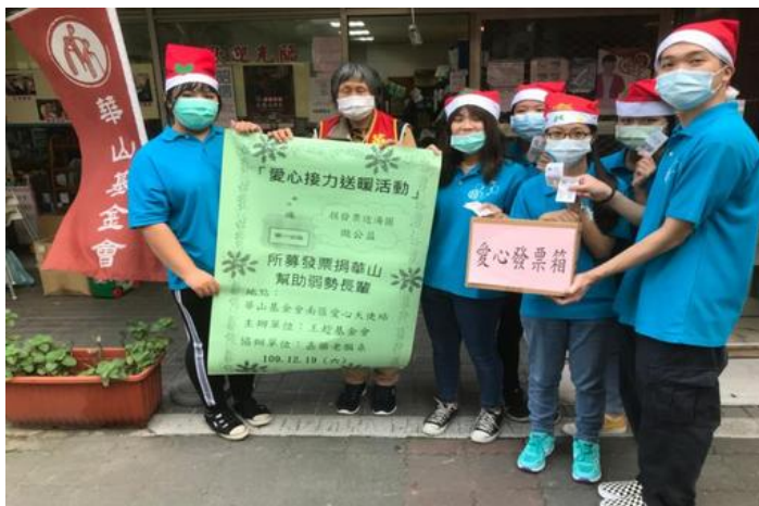
所募發票捐給華山基金會