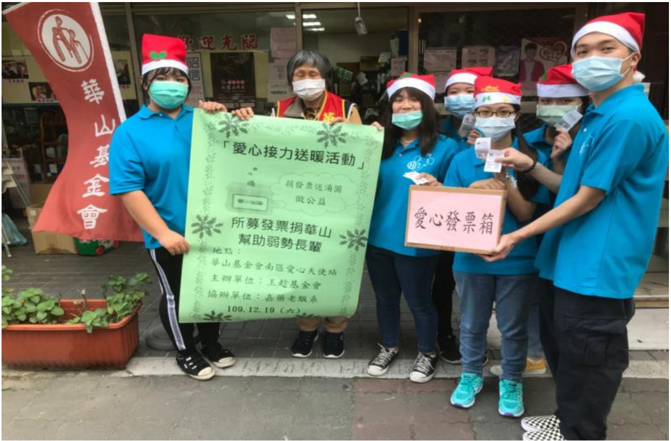
▲所募發票捐給華山基金會