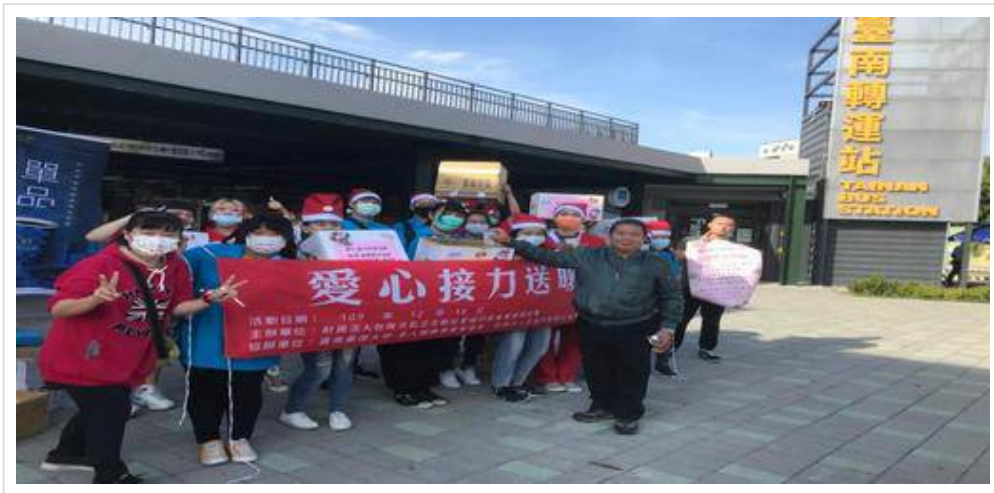
▲嘉藥與王趁基金會攜手舉辦愛心接力送暖活動