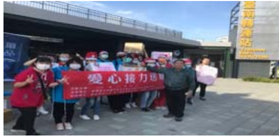
嘉藥與王趁基金會攜手舉辦愛心接力送暖活動。

【記者孫宜秋 / 南市報導】歲末冬至來臨，冬至吃湯圓的傳統習俗，象徵圓滿與溫暖，嘉南藥理大學老人服務事業管理系與財團法人臺南市私立王趁社會福利慈善事業基金會攜手合辦「愛心接力送暖活動」，因應冬至