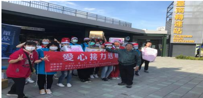
嘉藥與王趁基金會攜手舉辦愛心接力送暖活動