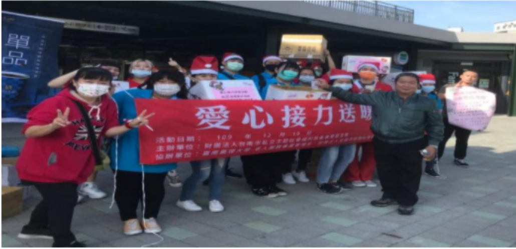
嘉藥老服系攜手王趁社福基金會舉辦愛心接力送暖活動。