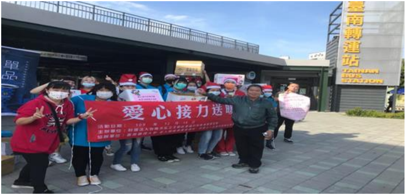
嘉藥攜手基金會 愛心接力冬至送暖

(中央社訊息服務20201230 09:49:26)歲末冬至來臨，冬至吃湯圓的傳統習俗，象徵圓滿與溫暖，嘉南藥理大學老人服務事業管理系與財團法人臺南市私立王趁社會福利慈善事業基金會攜手合辦「愛心接力送暖活動」，因應冬至及聖誕佳節，以實際行動落實在地關懷，發送暖心湯圓給台南街友、伊甸大林雙福家園-身心障礙者雙老家庭個案及熱心捐發票的市民。希望在活動的規劃引導下，喚起大眾對社會的關懷，以行動支持公益活動傳達愛心，並在冷冬的季節裡讓雙老家庭、街友們也能感受到愛與溫暖。