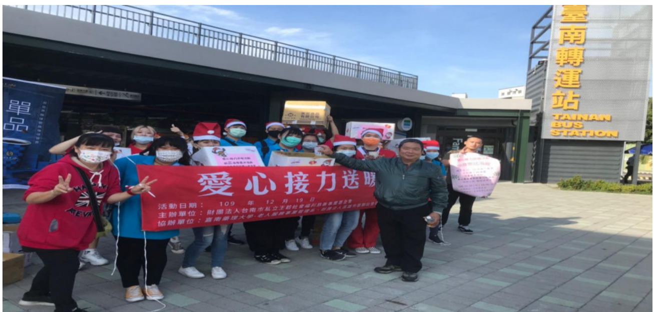
▲嘉藥與王趁基金會攜手舉辦愛心接力送暖活動