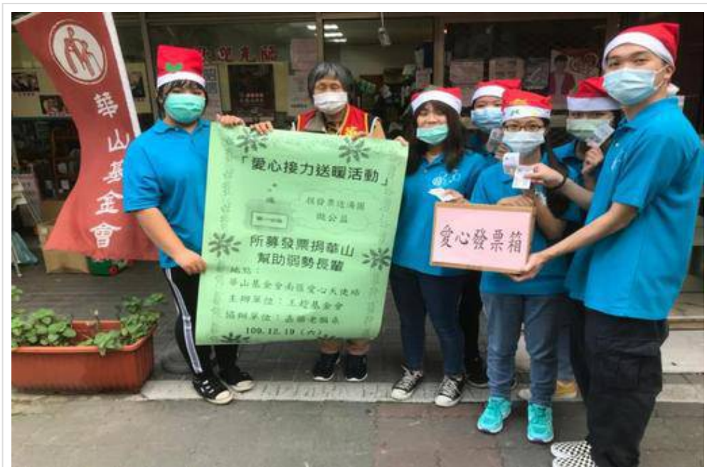
▲所募發票捐給華山基金會