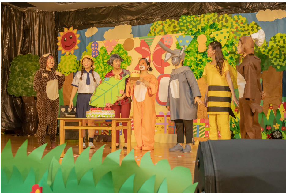
▲ 畢業展演展現了嘉藥幼保系四年來所學

12月3日首場演出吸引超過 200位鄰近幼兒園的師生到場欣賞，依序入場小朋友難掩興奮之情，戲劇開演後小小觀眾們全神關注，隨著情節歡笑、驚呼，演出結束後的有獎問答將現場氣氛帶到更高點，每個問題都引來全場熱烈的回響，小朋友們爭先恐後想要回答，一個個把小小手臂伸的筆直，認真可愛模樣萌翻全場，最後更與演出的大哥哥、大姊姊們合照，畫下完美句點。