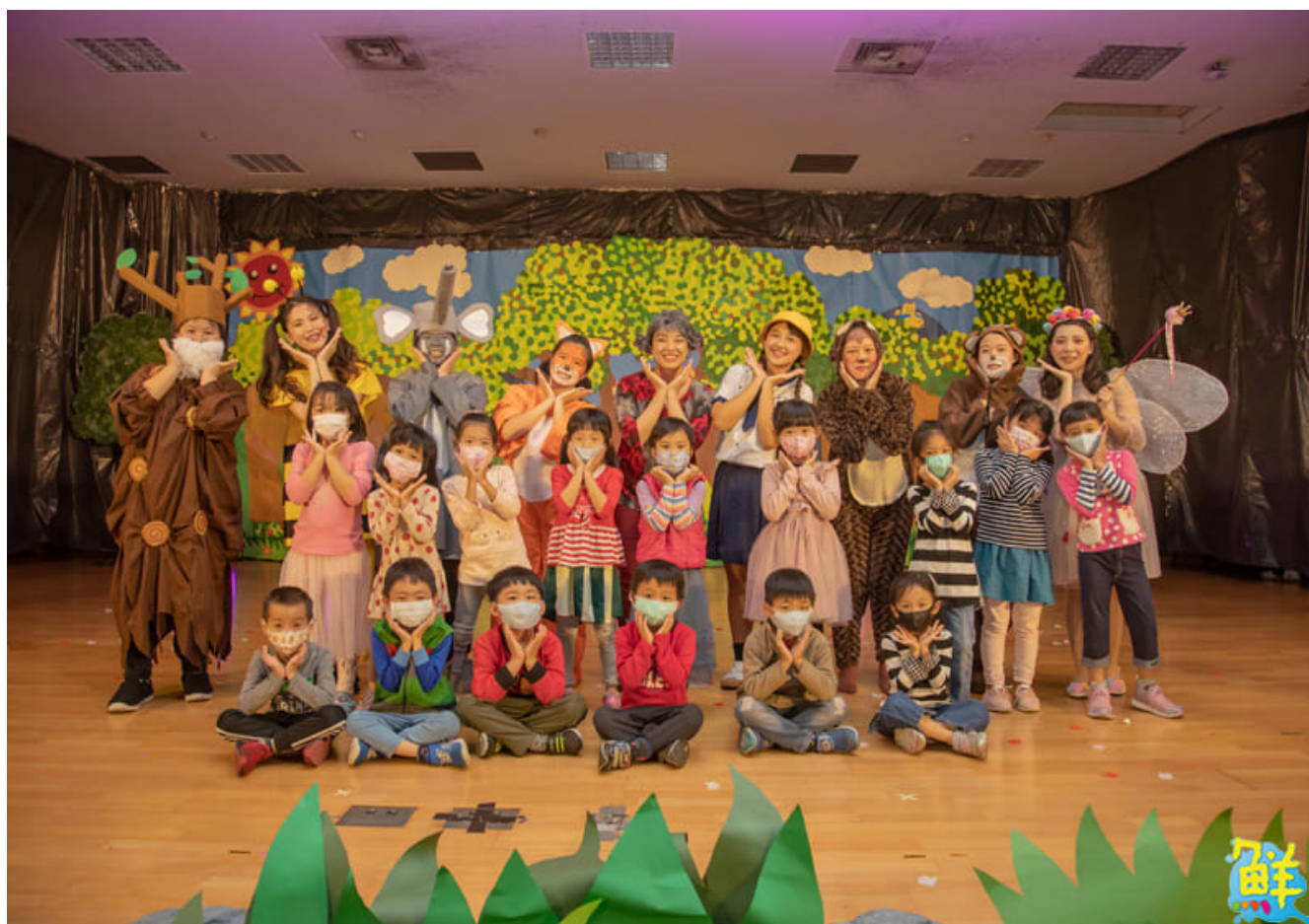
▲展演後小朋友開心與演員們合影留念。