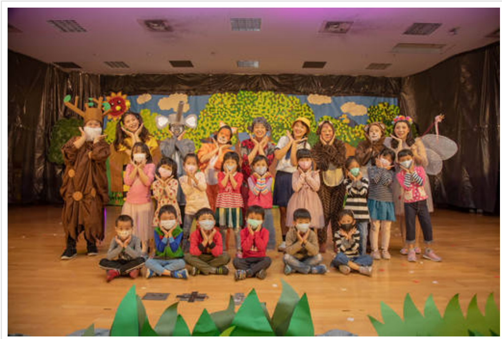
▲ 展演後小朋友開心與演員們合影留念