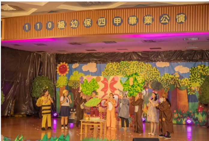
嘉藥幼保系今舉辦畢業專題展演邀請鄰近幼兒園小朋友一同觀賞