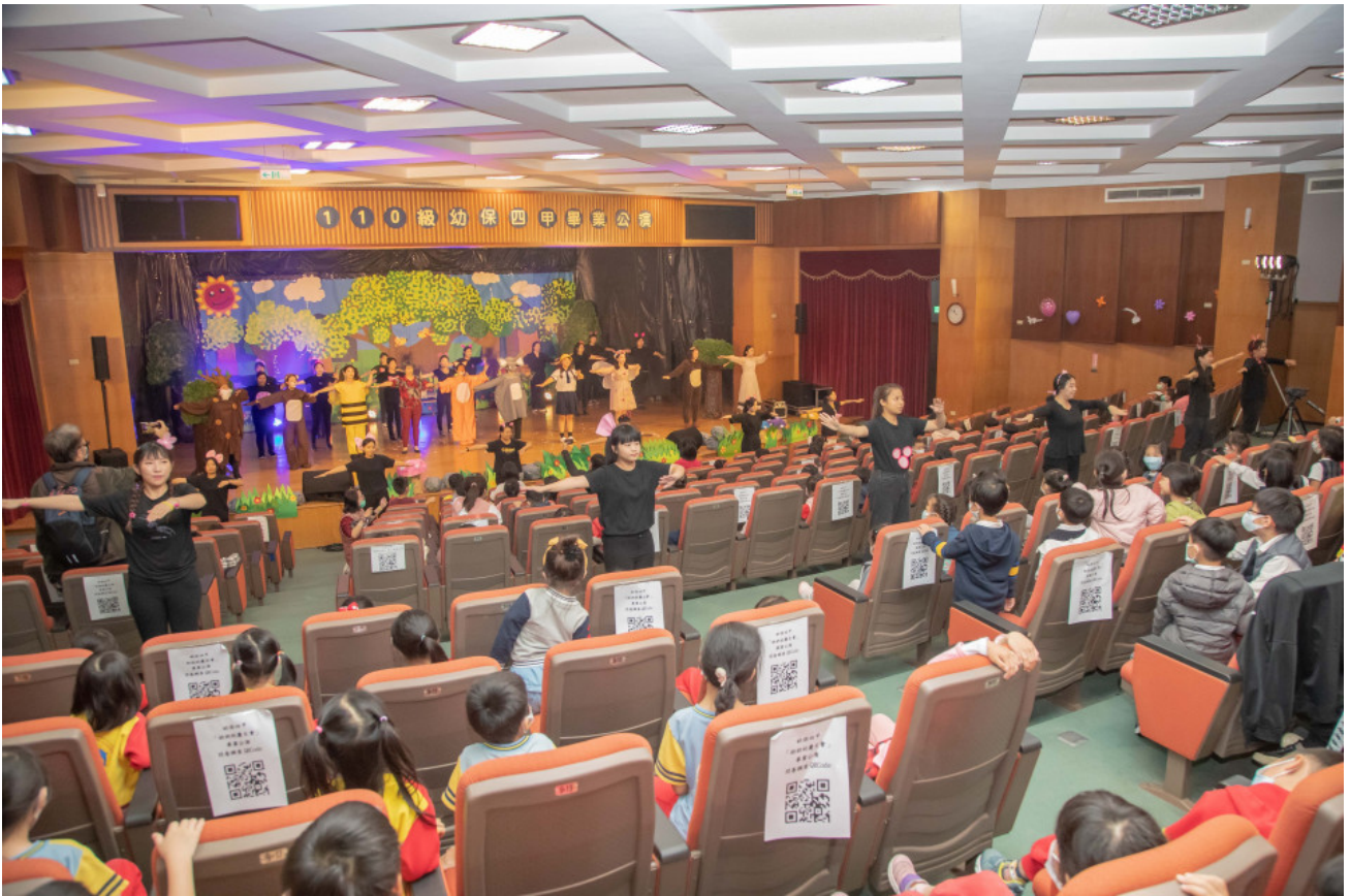
▲小朋友開心跟著台上演員唱唱跳跳

12月3日首場演出吸引超過 200位鄰近幼兒園的師生到場欣賞，依序入場小朋友難掩興奮之情，戲劇開演後小小觀眾們全神關注，隨著情節歡笑、驚呼，演出結束後的有獎問答將現場氣氛帶到更高點，每個問題都引來全場熱烈的回響，小朋友們爭先恐後想要回答，一個個把小小手臂伸的筆直，認真可愛模樣萌翻全場，最後更與演出的大哥哥、大姊姊們合照，畫下完美句點。