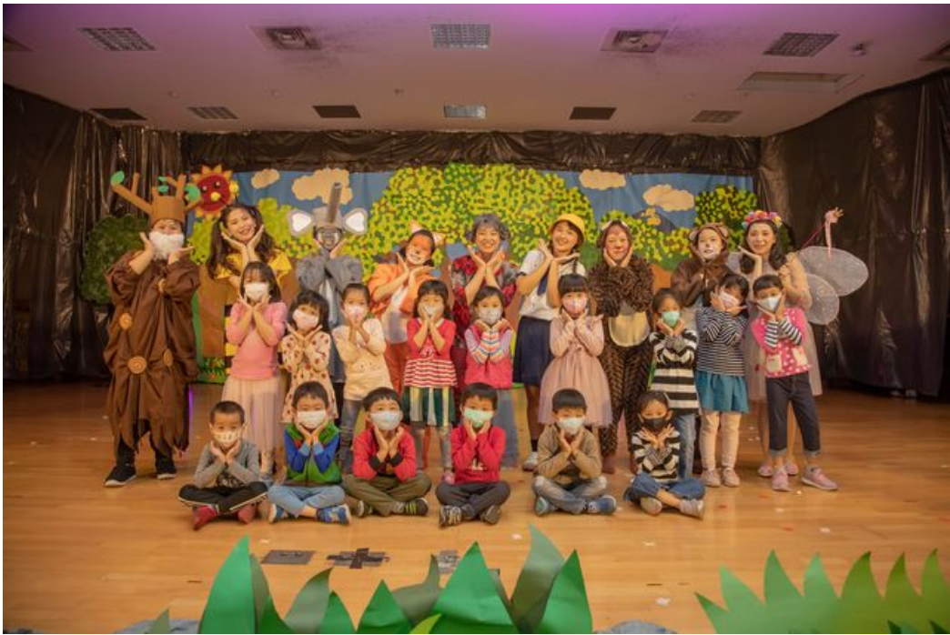
展演後小朋友開心與演員們合影留念。