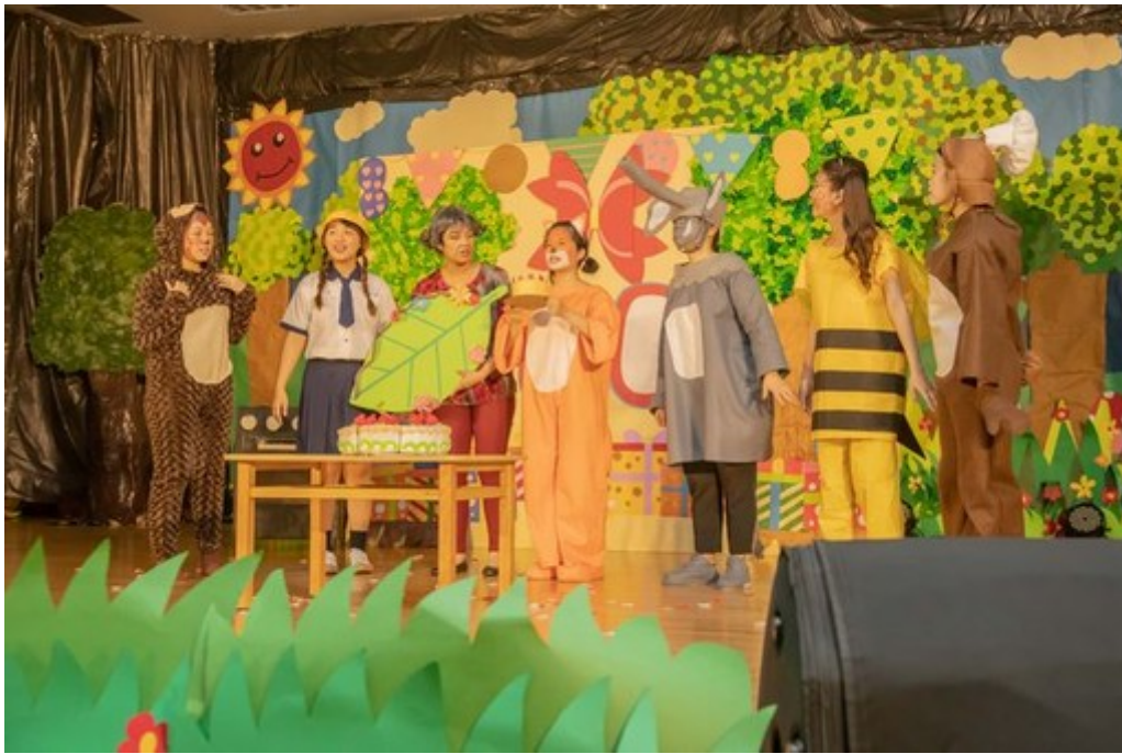
圖1：畢業展演展現了嘉藥幼保系四年來所學。