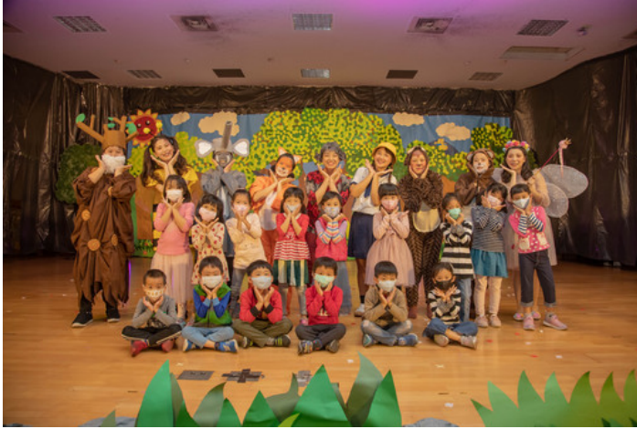
展演後小朋友開心與演員們合影留念