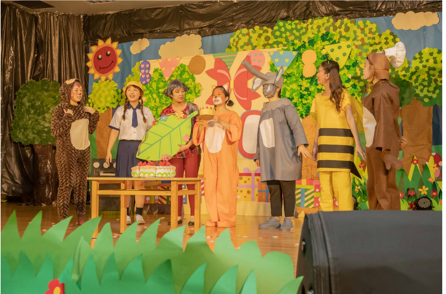
圖一：嘉藥嬰幼兒保育系三日舉辦畢業成果展，展現四年來所學。

嘉南藥理大學嬰幼兒保育系三日在該校國際會議中心舉辦為期二天的一一〇級畢業成果展「奶奶的慶生會」兒童戲劇表演，準畢業生透過「社區兒童活動企劃專題製作」課程，展現幼保人創意與專業兒童活動策劃執行力，希望優質的兒童戲劇能豐富社區兒童生活，並促進社區民眾交流。