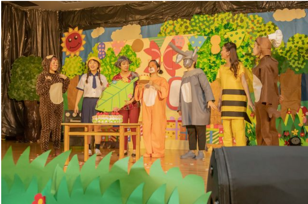
畢業展演展現了嘉藥幼保系四年來所學。

http://www.cntimes.info 2020-12-03 19:00:08