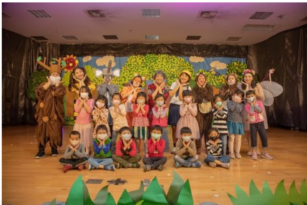
圖3：展演後小朋友開心與演員們合影留念。