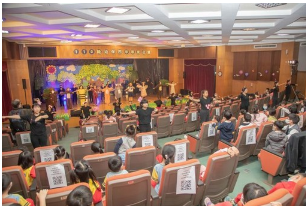
圖4：「奶奶的慶生會」兒童戲劇表演現場。