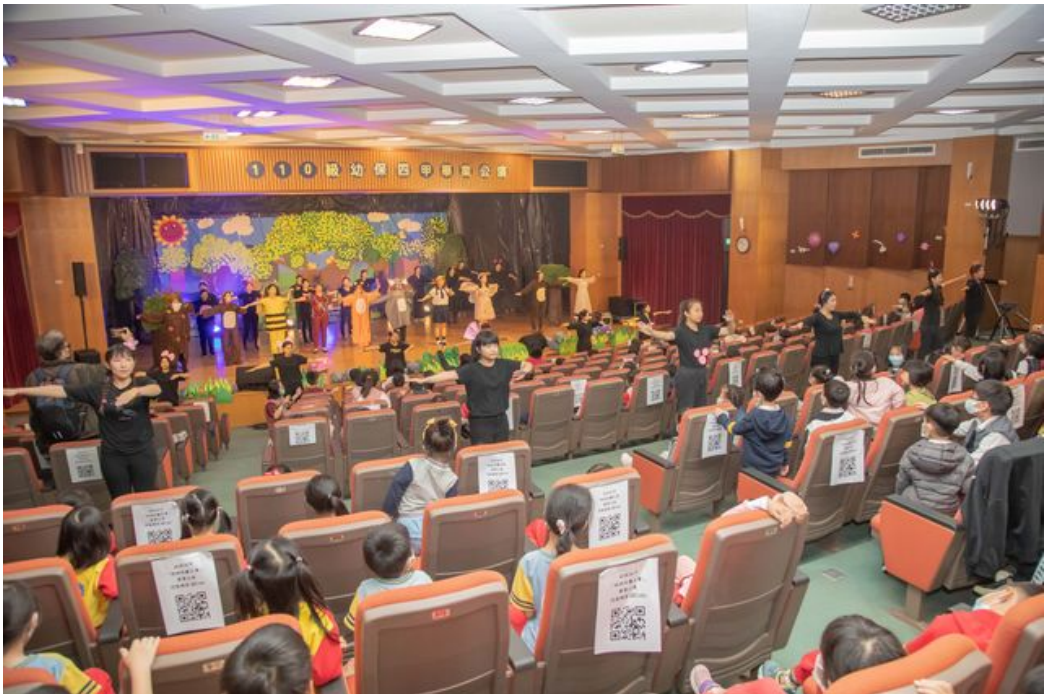
「奶奶的慶生會」兒童戲劇表演現場。

嘉南藥理大學嬰幼兒保育系於3、4日連續兩天在該校國際會議中心二樓演藝廳舉辦110級畢業成果展「奶奶的慶生會」兒童戲劇表演，準畢業生透過「社區兒童活動企劃專題製作」課程，展現幼保人創意與專業兒童活動策劃執行力，希冀優質的兒童戲劇能豐富社區兒童生活，並促進社區民眾交流。