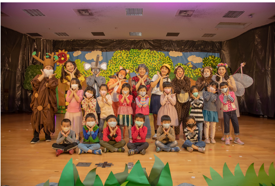
▲ 展演後小朋友開心與演員們合影留念

嘉南藥理大學嬰幼兒保育系於3、4日連續兩天在該校國際會議中心二樓演藝廳舉辦110級畢業成果展「奶奶的慶生會」兒童戲劇表演，準畢業生透過「社區兒童活動企劃專題製作」課程，展現幼保人創意與專業兒童活動策劃執行力，希冀優質的兒童戲劇能豐富社區兒童生活，並促進社區民眾交流。