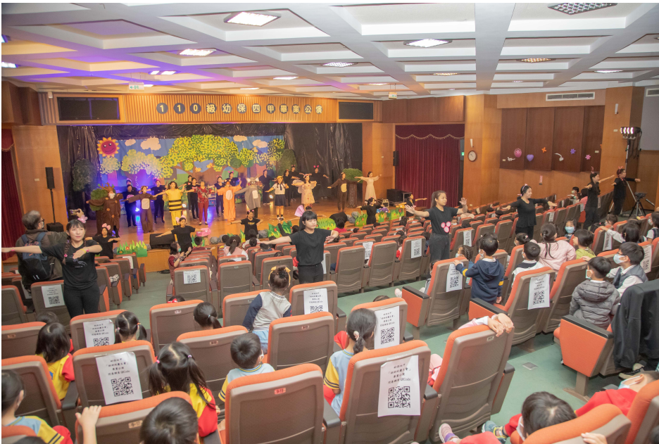
▲ 小朋友開心跟著台上演員唱唱跳跳

嘉南藥理大學嬰幼兒保育系於3、4日連續兩天在該校國際會議中心二樓演藝廳舉辦110級畢業成果展「奶奶的慶生會」兒童戲劇表演，準畢業生透過「社區兒童活動企劃專題製作」課程，展現幼保人創意與專業兒童活動策劃執行力，希冀優質的兒童戲劇能豐富社區兒童生活，並促進社區民眾交流。